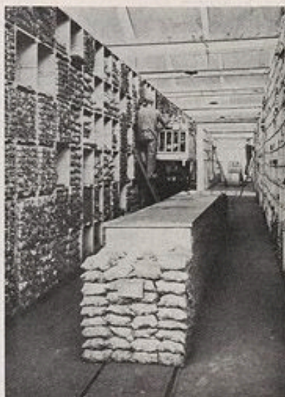
Ci-dessus, aspect des cases de stockage au Magasin Général de Villeneuve-Prairie.

Il ne reste qu'à en suivre les livraisons et les fréquentes