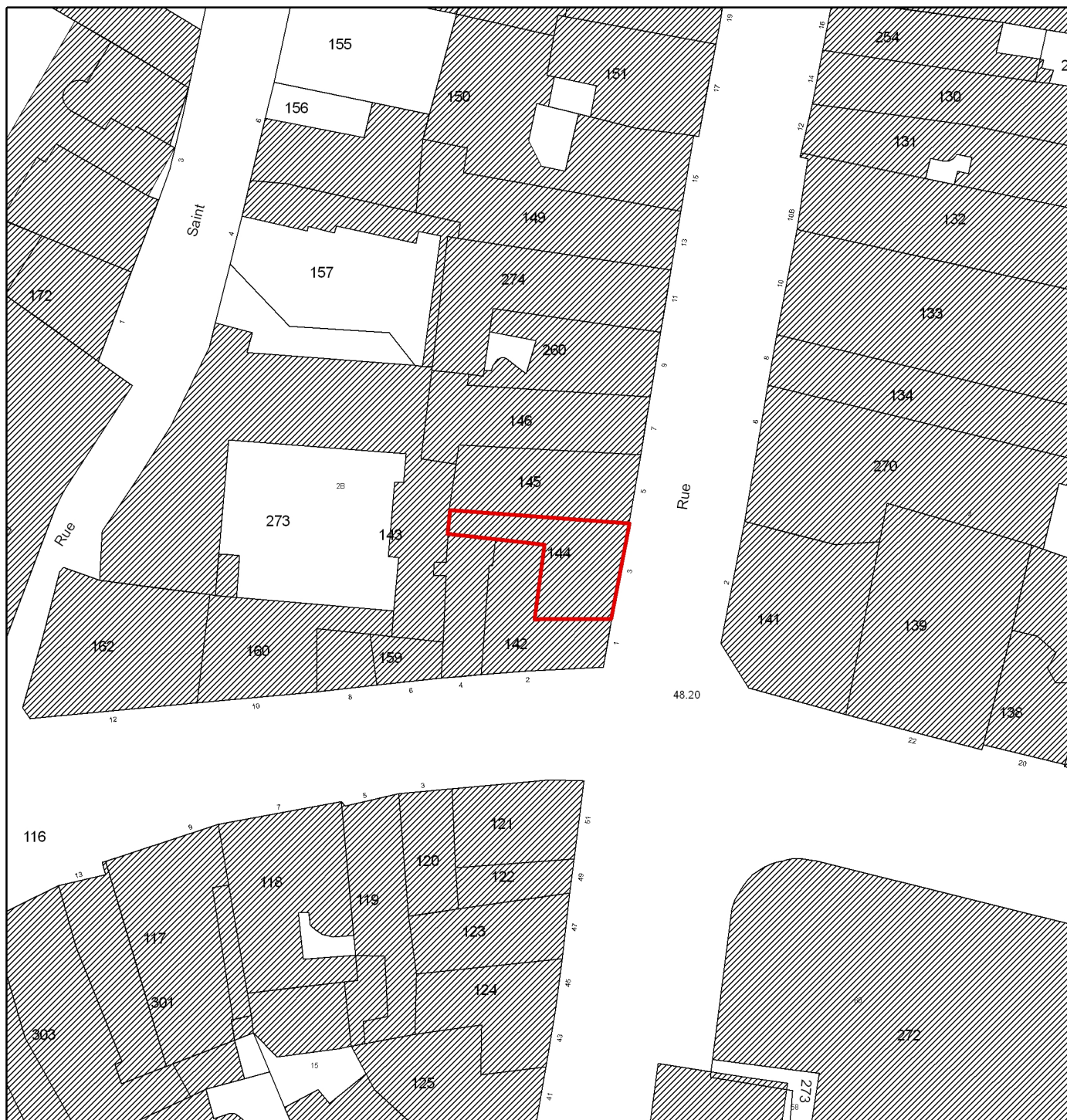
Pl. I Plan masse extrait du cadastre numérisé, 1985 Section AS, parcelle 144 Echelle : 1/500e Diane Bétored, 2008