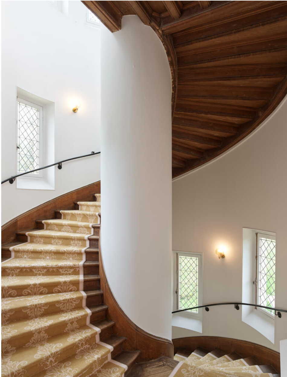
L'escalier d'honneur occupe la grande tour couverte en dôme.