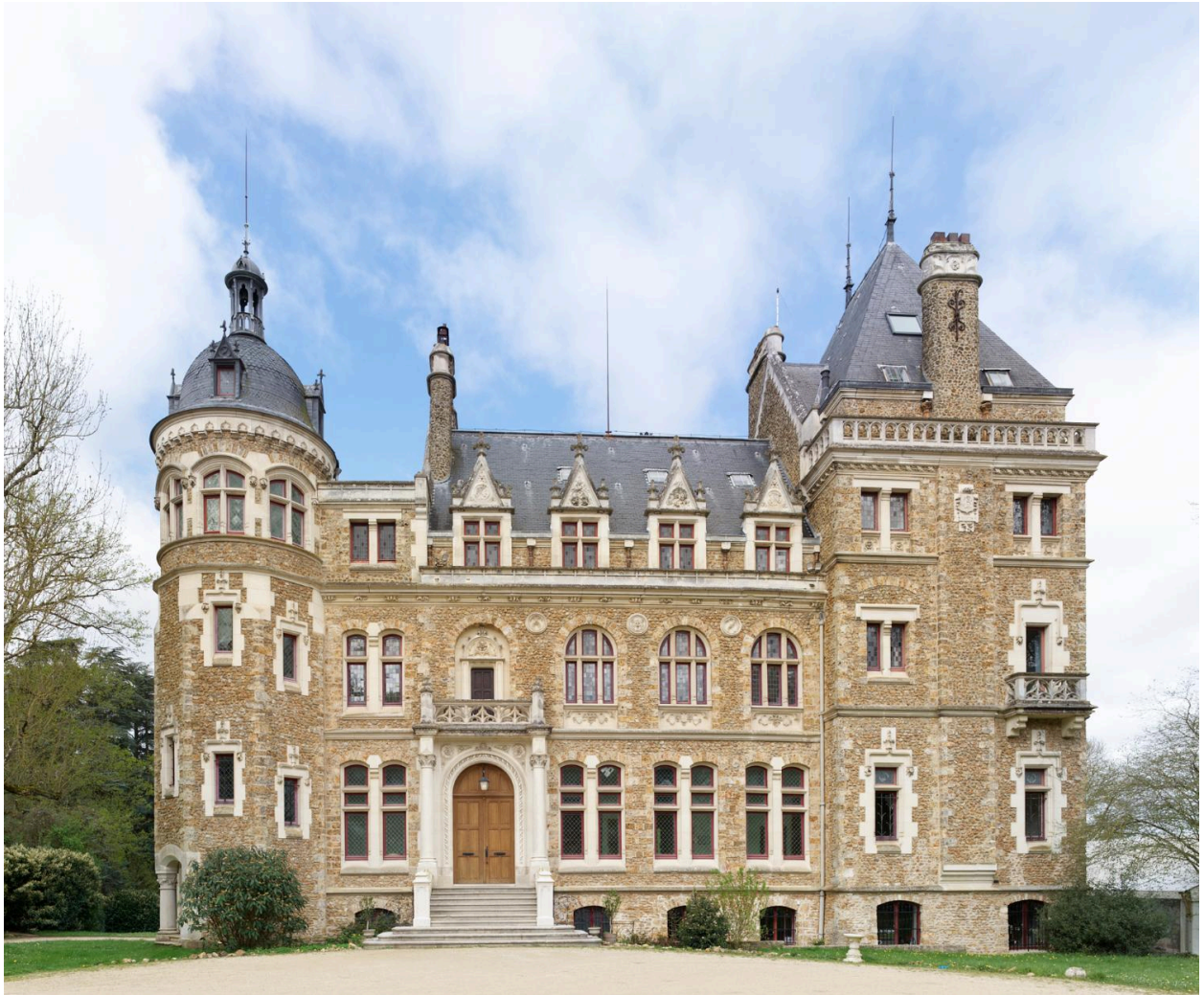
La façade principale.