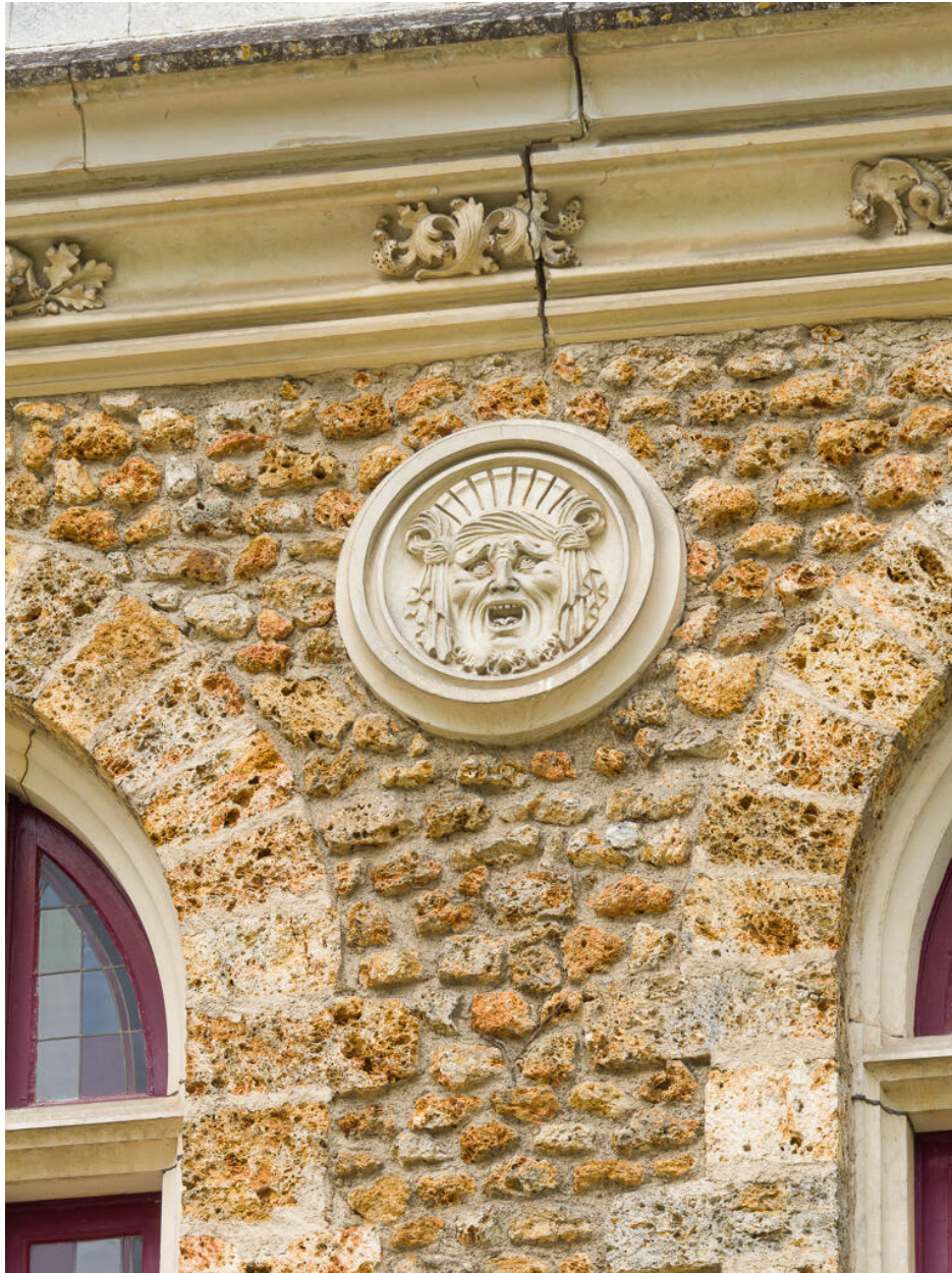
Mascaron sur la façade antérieure et détail de la corniche à chou frisé.