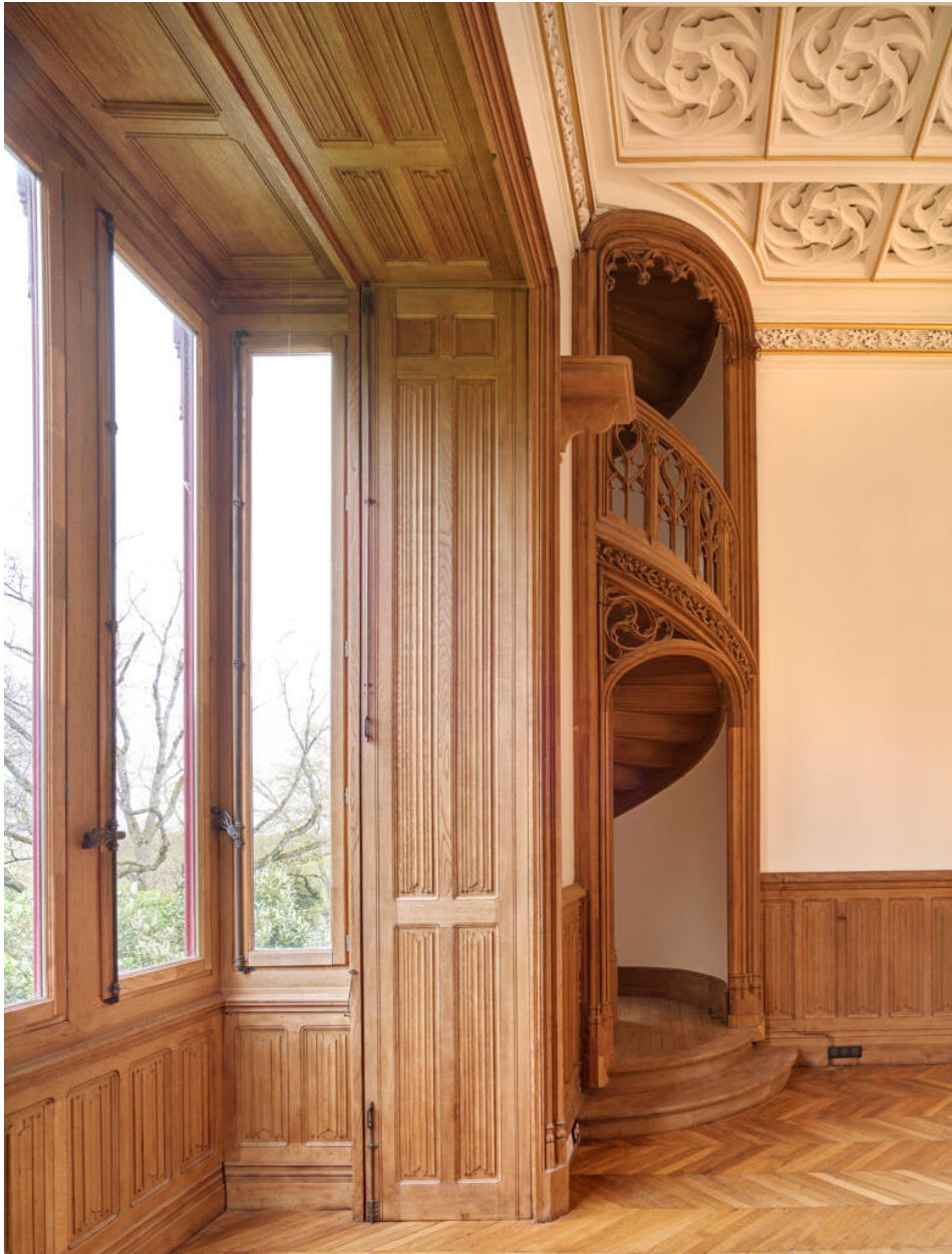
Détail du bow-window à lambris, à l'anglaise.