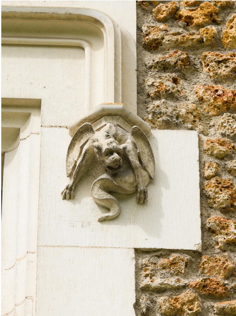
Détail sculpté d'un cul de lampe sur le donjon.