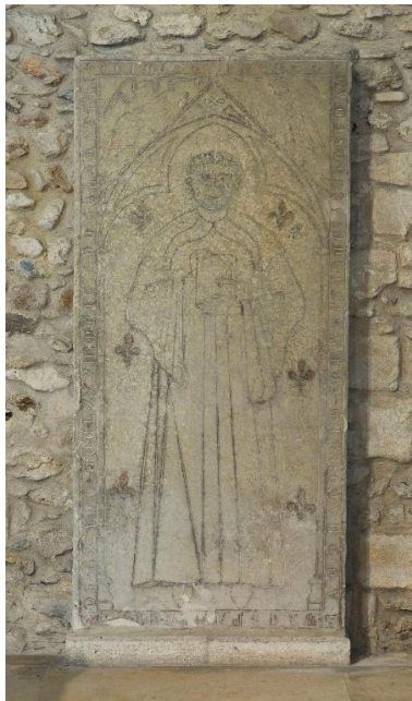
Vue d'ensemble. IVR11_20177800755NUC4A