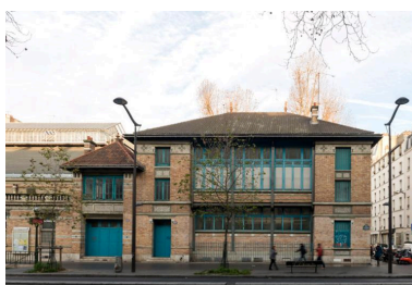
L'élévation antérieure des bains-douches accolés en 1913-1914 au gymnase dit "d'Allemagne", rue Jean Jaurès (Paris, 19e).