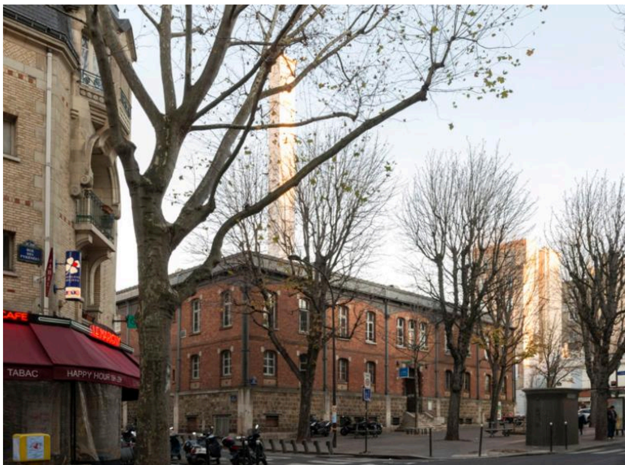
Vue générale des bains-douches de la rue des Pyrénées (Paris, 20e).