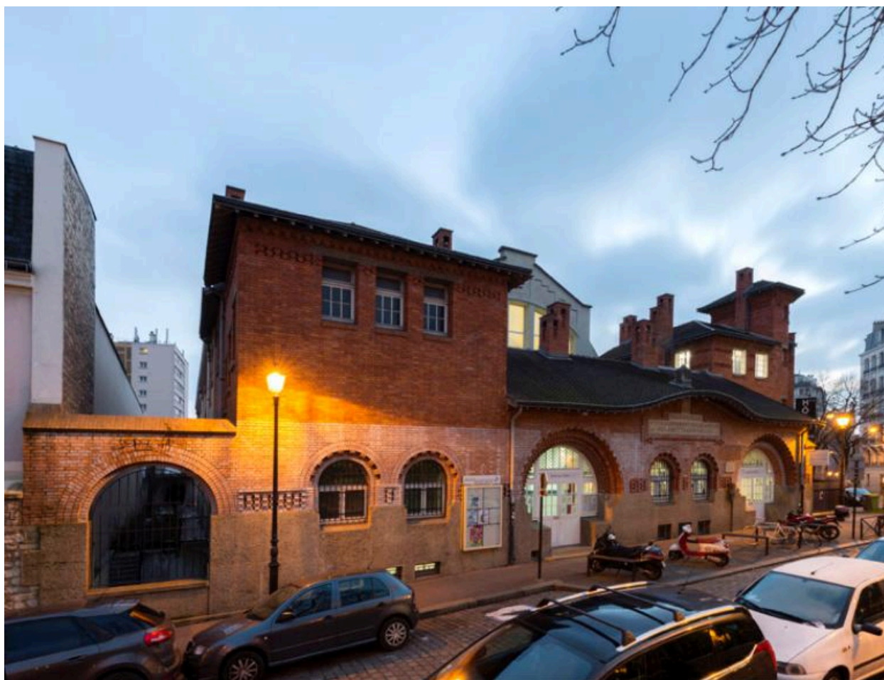
Vue générale de la piscine et des bains-douches de la Butte-aux-Cailles (Paris, 13e).