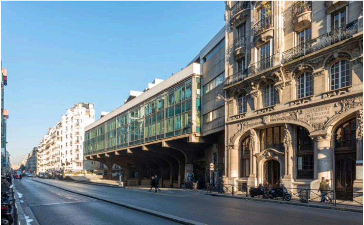
Vue générale de l'équipement polyvalent situé à l'angle de la rue du Renard et de la rue Saint-Merri (Paris, 4e), comportant une école, une piscine, un gymnase et des bains-douches.

IVR11_20177500045NUC4A Auteur de l'illustration : Laurent Kruszyk Date de prise de vue : 2017 ; (c) Laurent Kruszyk, Région Île-de-France communication libre, reproduction soumise à autorisation