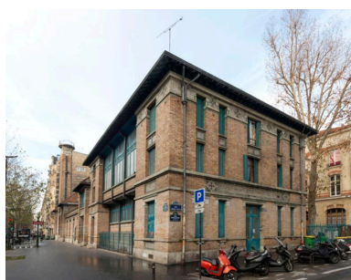
Vue générale des bains-douches de la rue Jean Jaurès (Paris, 19e), créés en 1913-1914 à