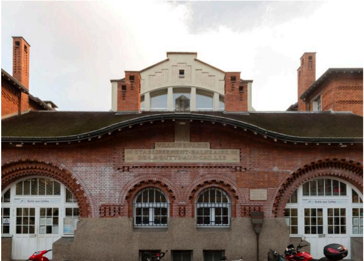
Détail du fronton de l'établissement, avec à l'arrière-plan le long vaisseau de la piscine.