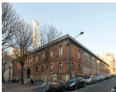
Vue générale des bains-douches de la rue des Pyrénées (Paris, 20e) aménagés en 1901-1904 dans l'ancien marché couvert de Belleville, édifié en 1876. IVR11_20177500049NUC4A