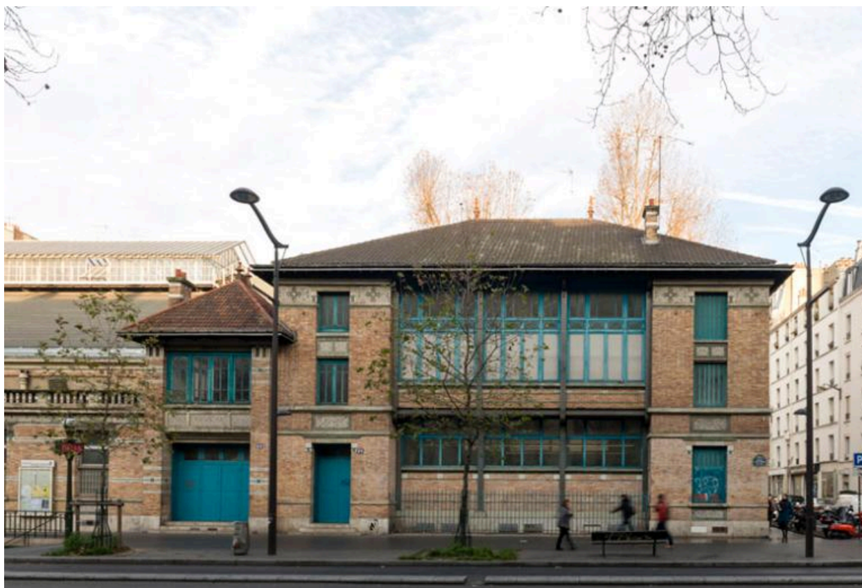
L'élévation antérieure des bains-douches accolés en 1913-1914 au gymnase dit "d'Allemagne", rue Jean Jaurès (Paris, 19e).