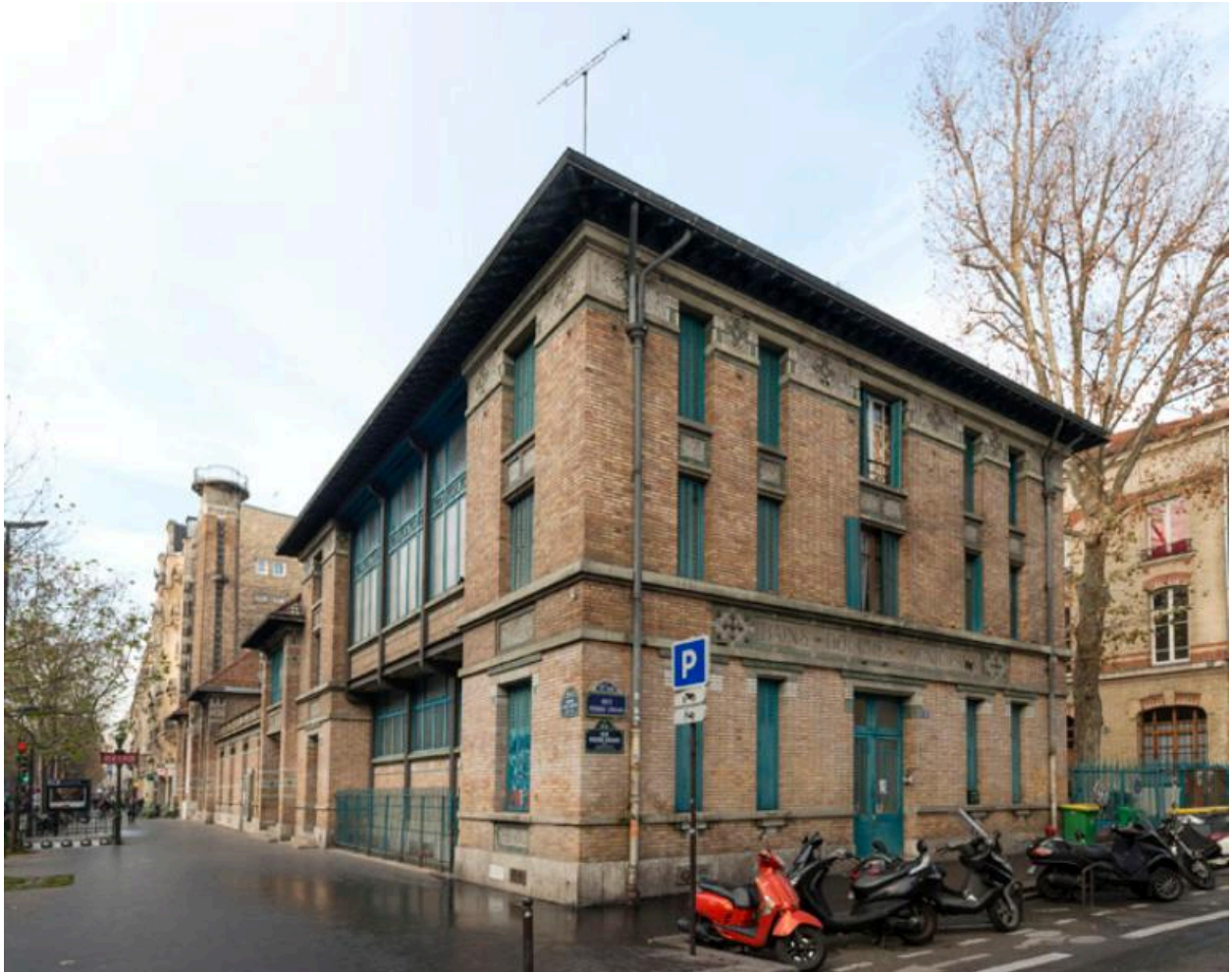
Vue générale des bains-douches de la rue Jean Jaurès (Paris, 19e), créés en 1913-1914 à l'occasion de l'agrandissement du gymnase dit "d'Allemagne".