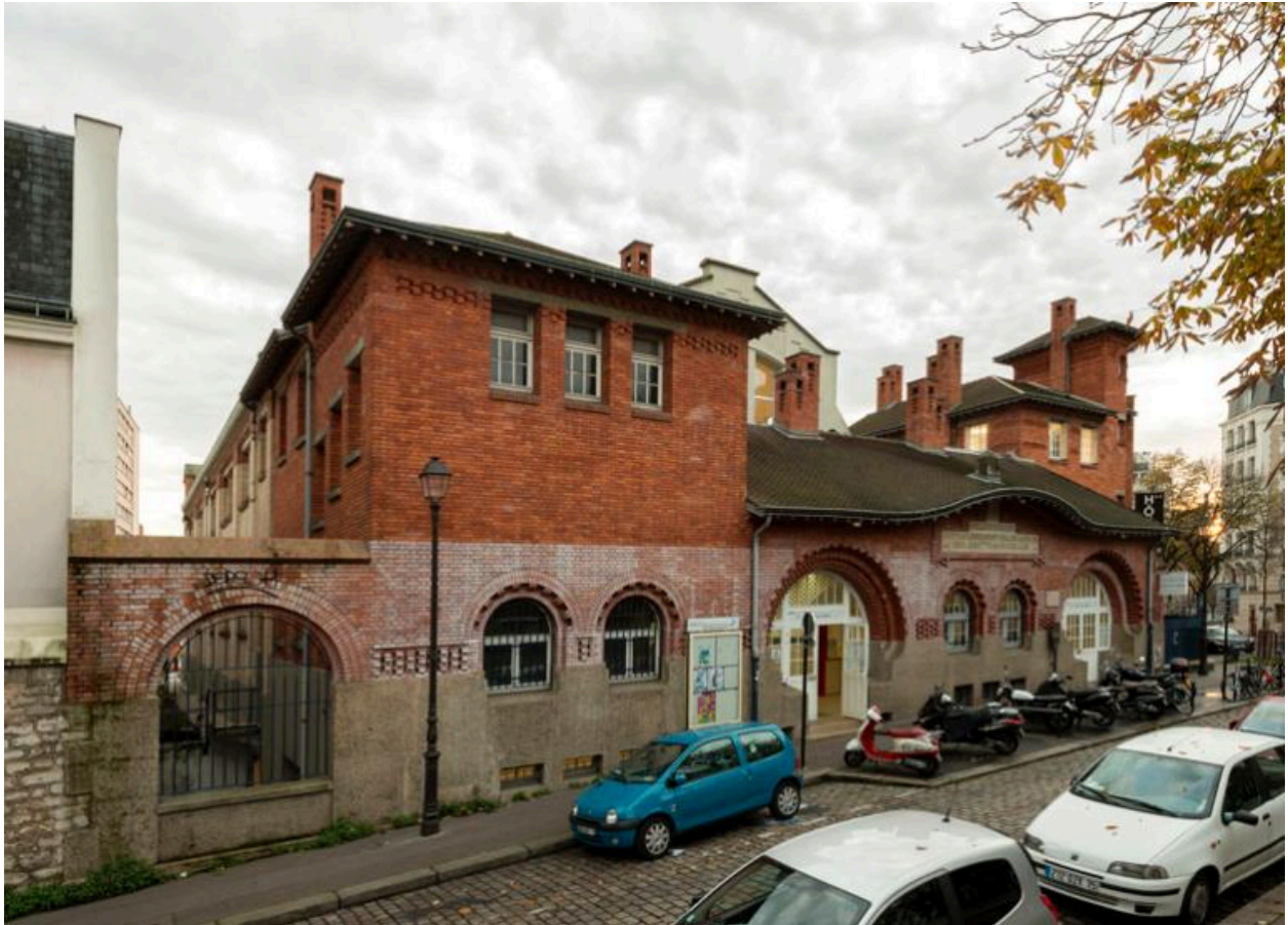
Vue générale de la piscine et des bains-douches de la Butte-aux-Cailles, place Paul Verlaine (Paris, 13e).

IVR11_20167500811NUC4A Auteur de l'illustration : Laurent Kruszyk Date de prise de vue : 2016 ; (c) Laurent Kruszyk, Région Île-de-France communication libre, reproduction soumise à autorisation