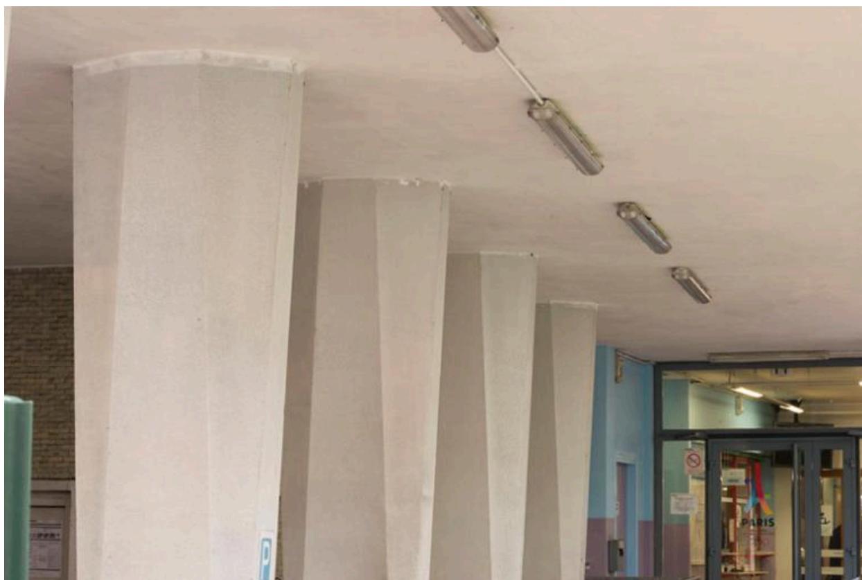
Détail de la structure sur pilotis des bains-douches de la rue Blomet (Paris, 15e).