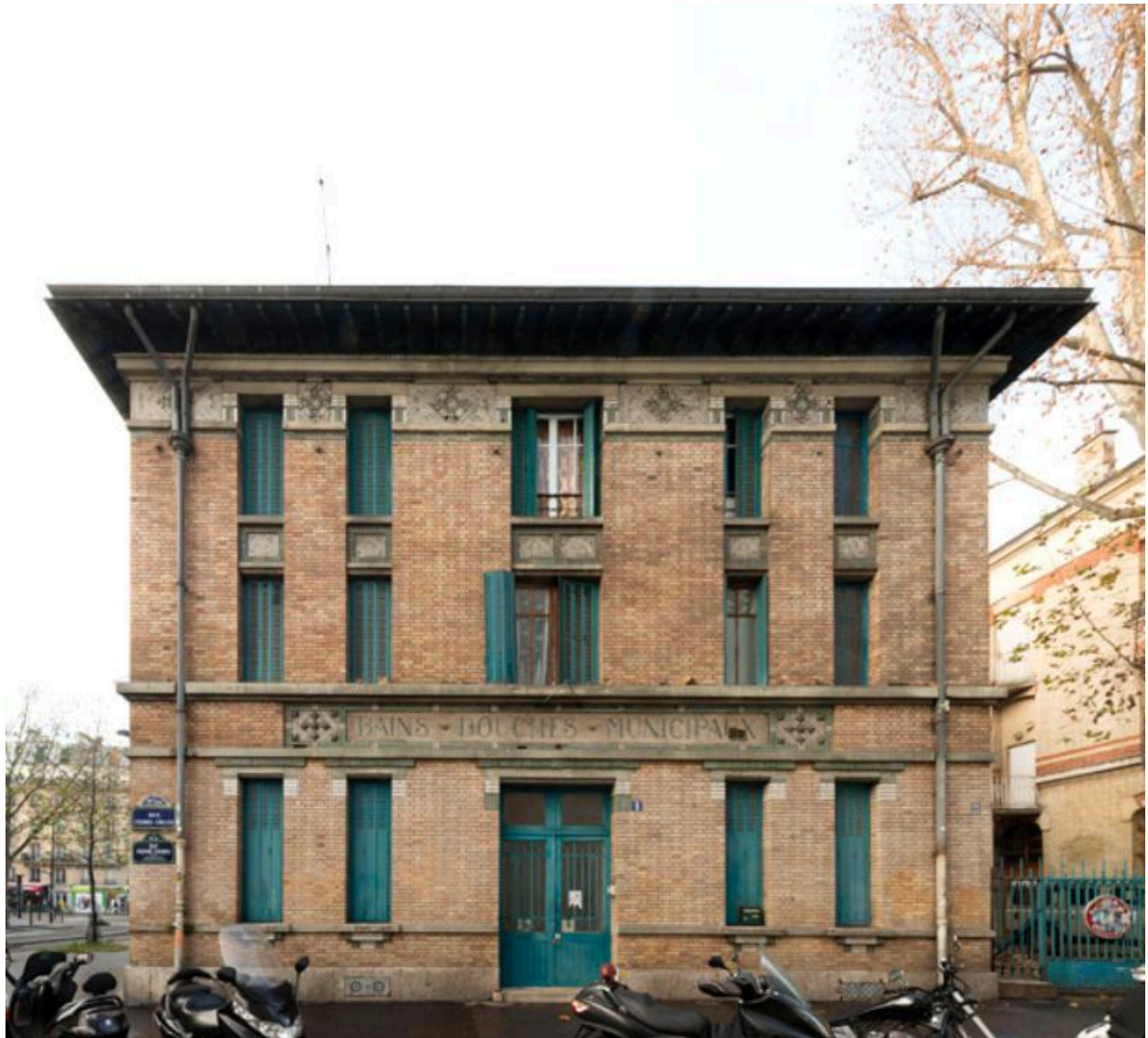
Détail de l'entrée des bains-douches de la rue Jean Jaurès (Paris, 19e).