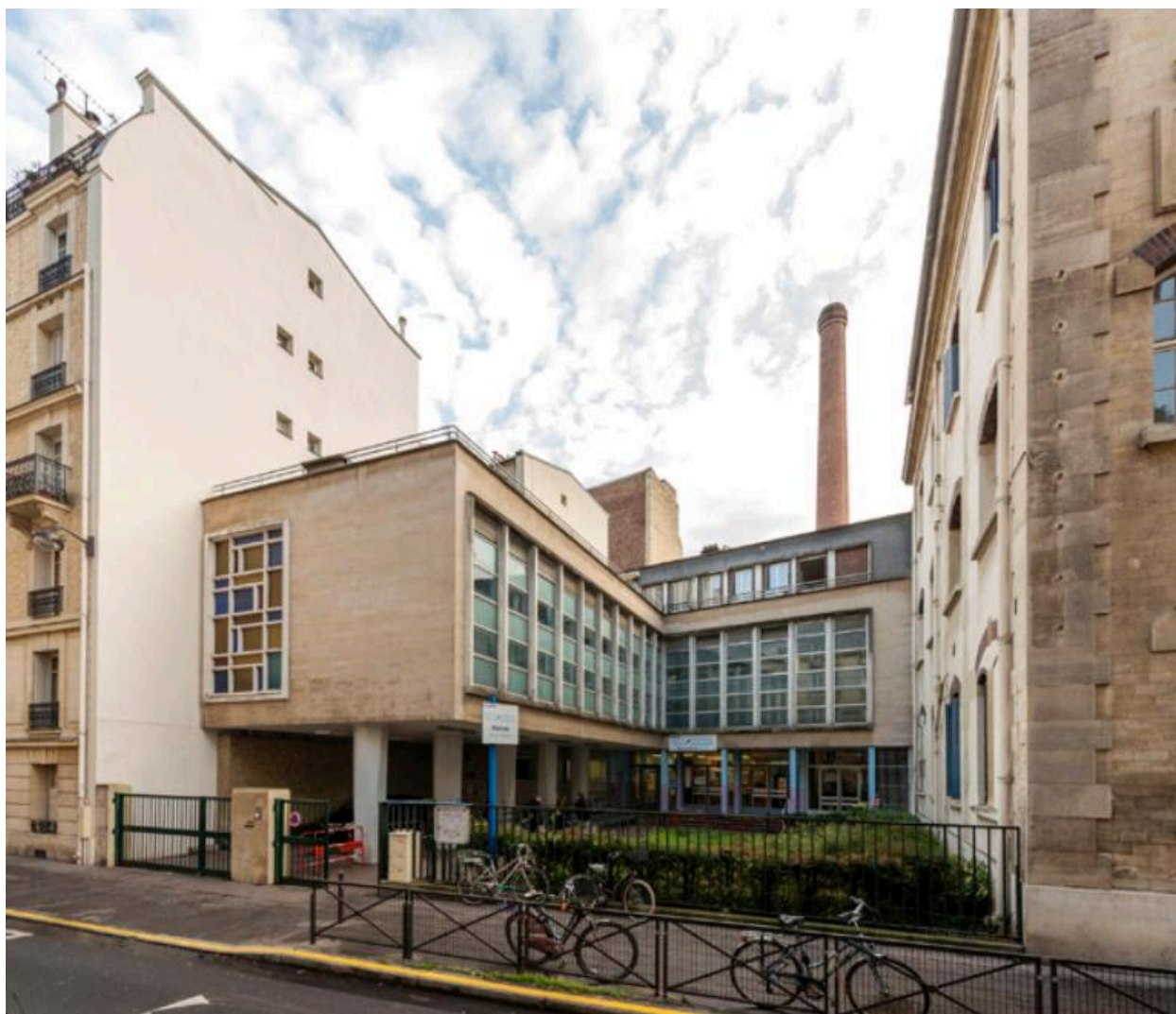
Vue générale des bains-douches de la rue Blomet (Paris, 15e), reconstruits en 1960 à l'occasion de la rénovation de la piscine.