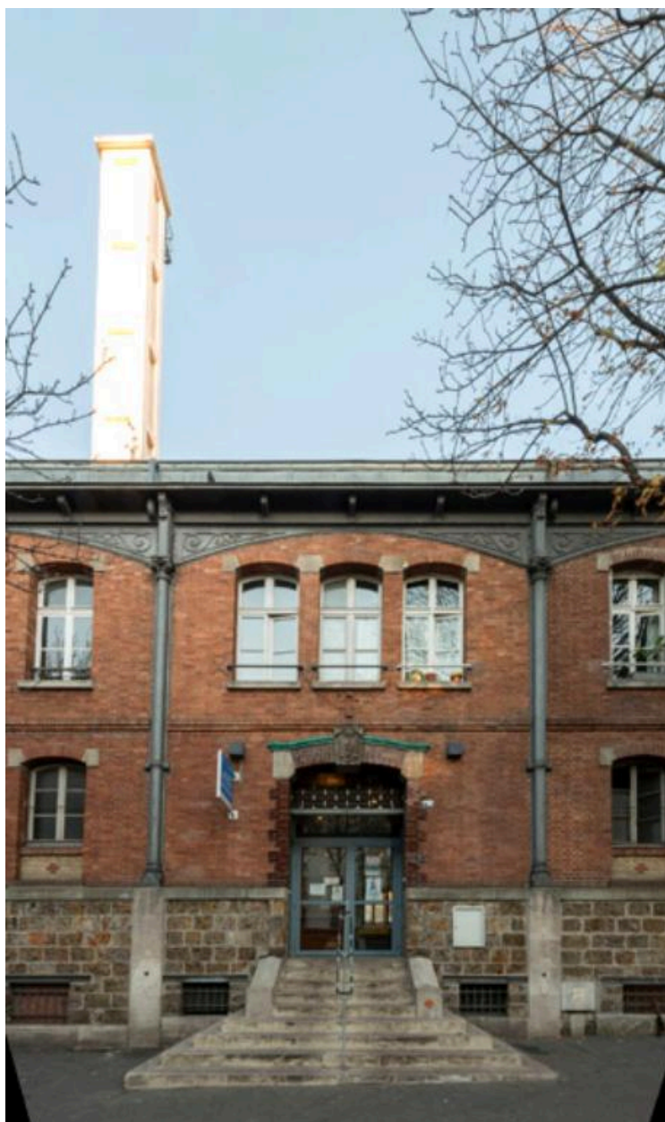
Détail de l'entrée des bains-douches de la rue des Pyrénées (Paris, 20e).