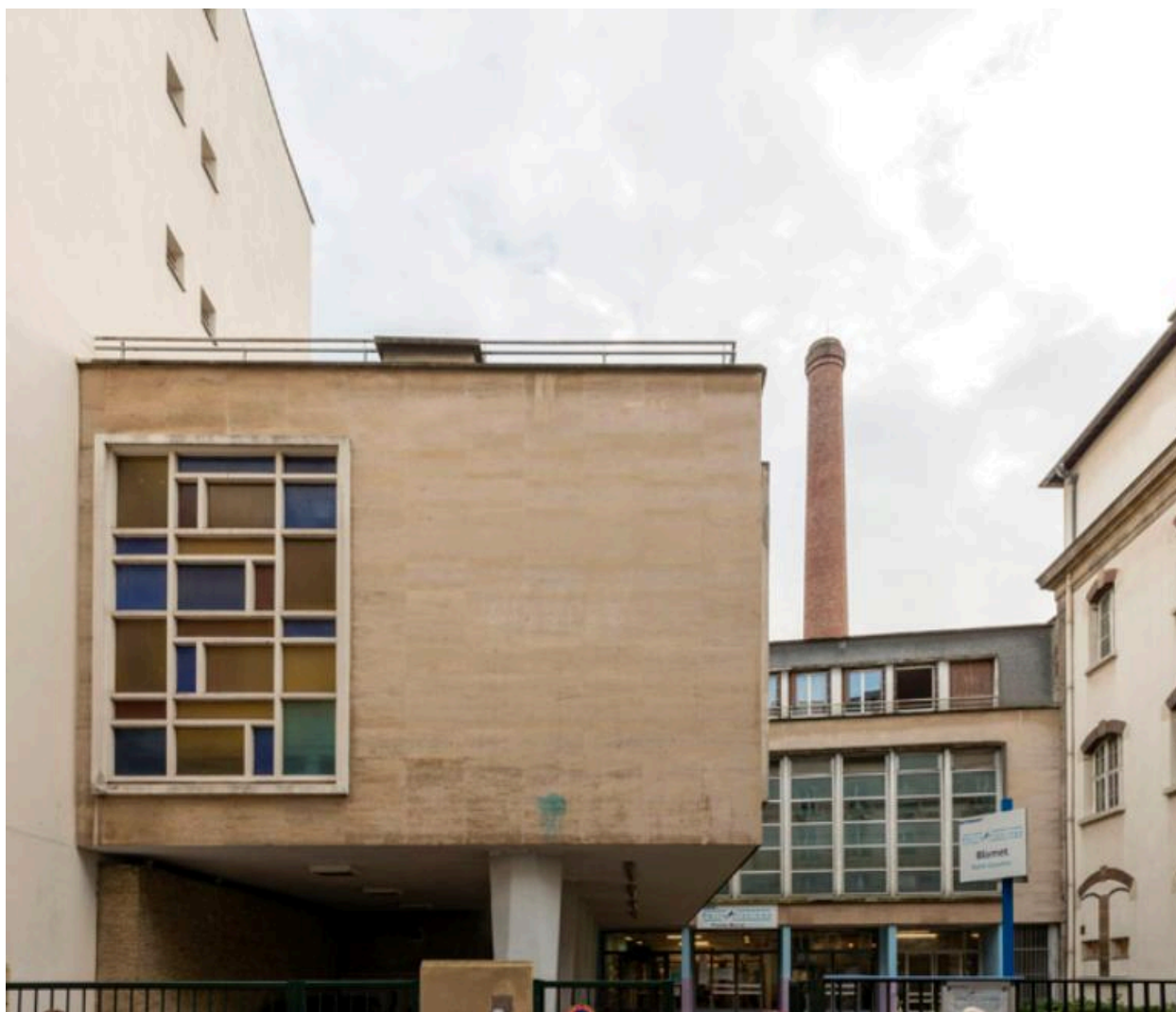
Détail du mur-pignon des bains-douches de la rue Blomet (Paris, 15e).