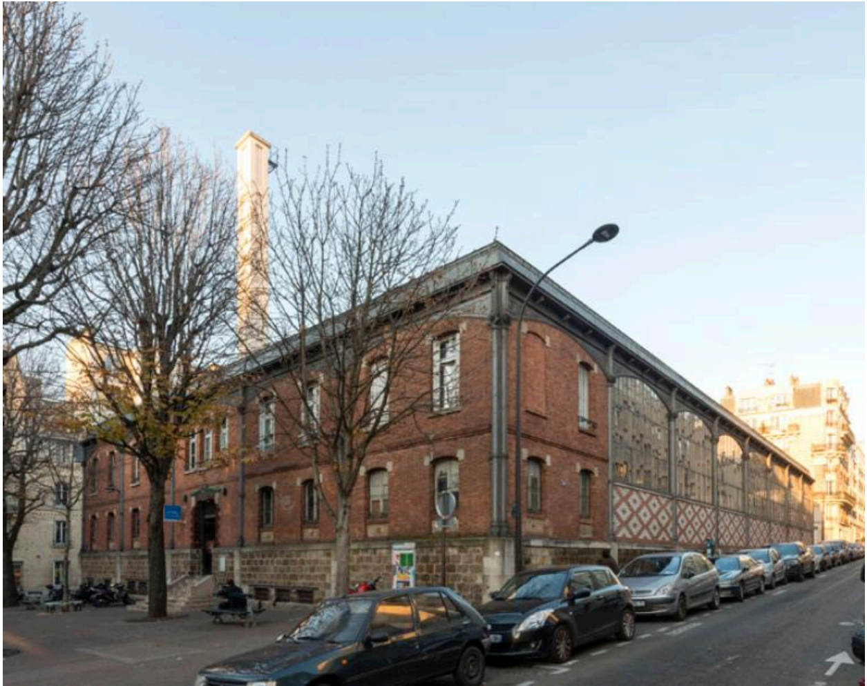
Vue générale des bains-douches de la rue des Pyrénées (Paris, 20e) aménagés en 1901-1904 dans l'ancien marché couvert de Belleville, édifié en 1876.