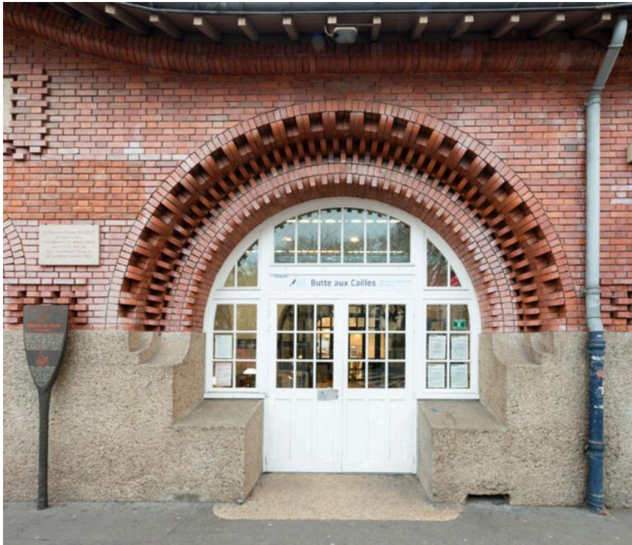
Détail d'une baie à arc en anse de panier et de ses voissures en brique.