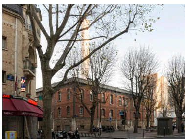
Vue générale des bains-douches de la rue des Pyrénées (Paris, 20e).