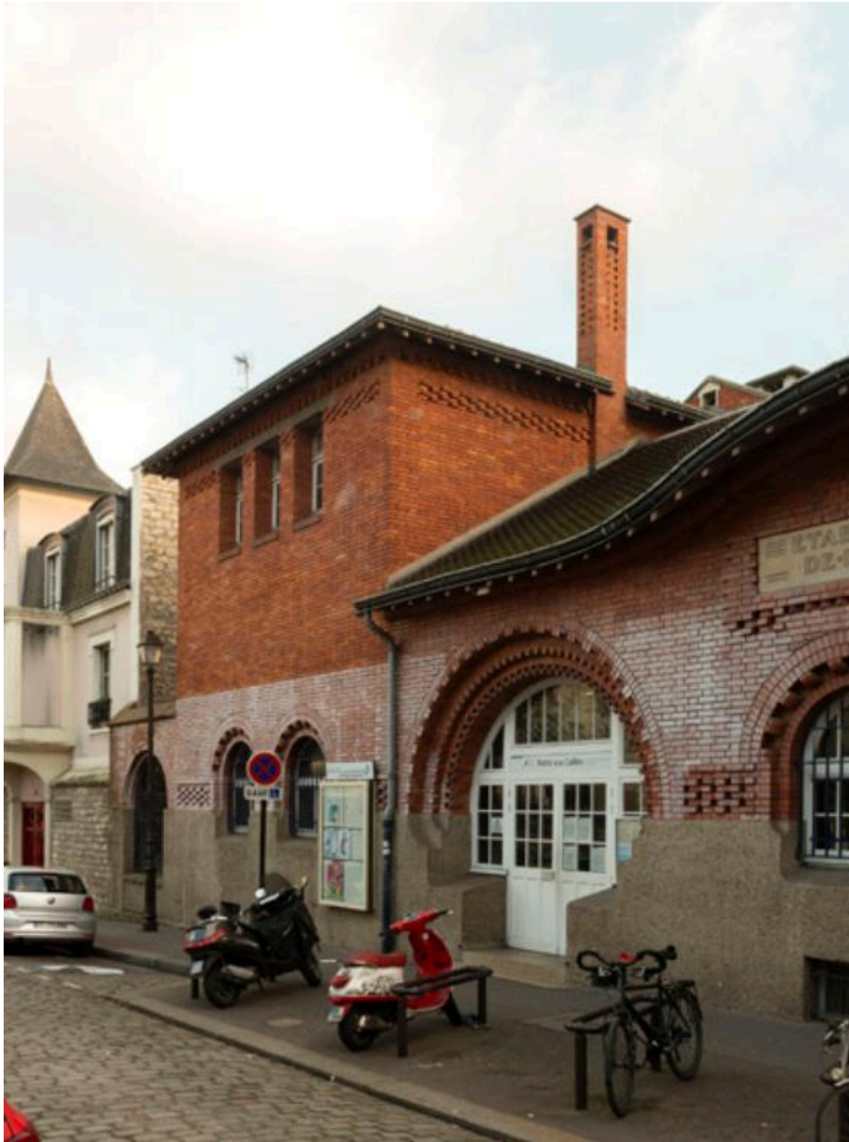
Détail de l'aile latérale contenant les bains-douches, accolée à la piscine de la Butte-aux-Cailles (Paris, 13e).