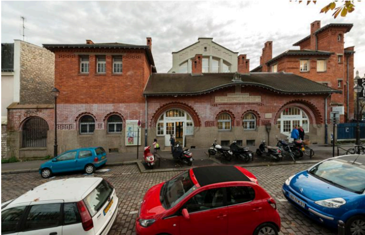
Vue générale de la piscine et des bains-douches de la Butte-aux-Cailles (Paris, 13e).