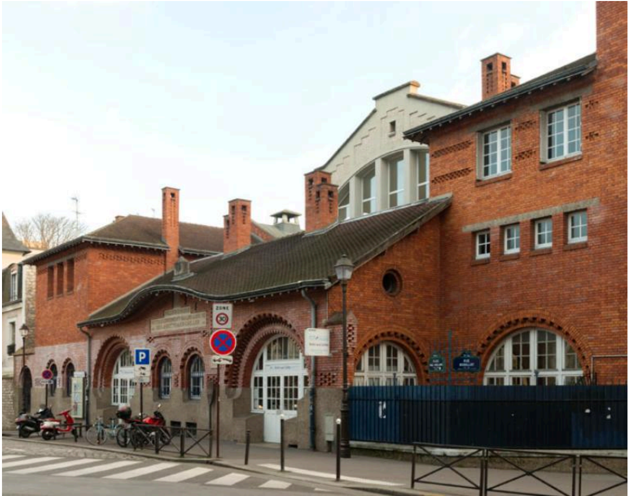
Vue générale de la piscine et des bains-douches de la Butte-aux-Cailles (Paris, 13e) depuis la place Paul Verlaine.

IVR11_20177500074NUC4A Auteur de l'illustration : Laurent Kruszyk Date de prise de vue : 2017 ; (c) Laurent Kruszyk, Région Île-de-France communication libre, reproduction soumise à autorisation