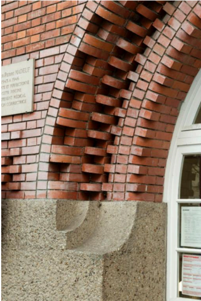
Détail d'un jeu de voûtures en brique, sur l'une des baies de la façade antérieure de la piscine.