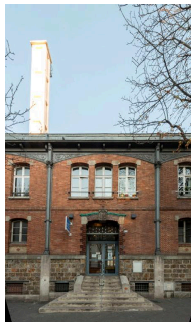
Détail de l'entrée des bains-douches de la rue des Pyrénées (Paris, 20e).