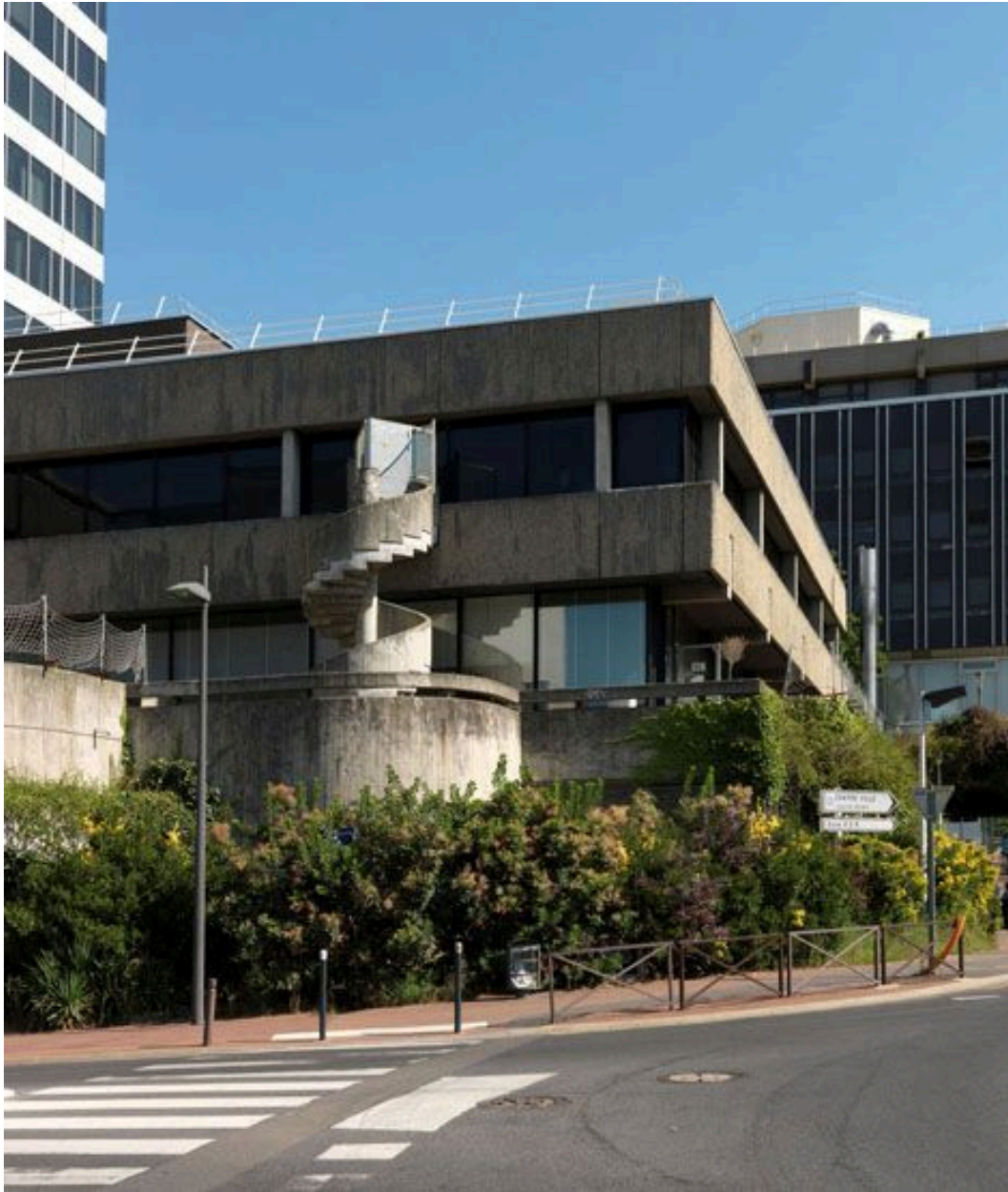
Vue d'un escalier hélicoidal à l'angle de la rue de la Préfecture.