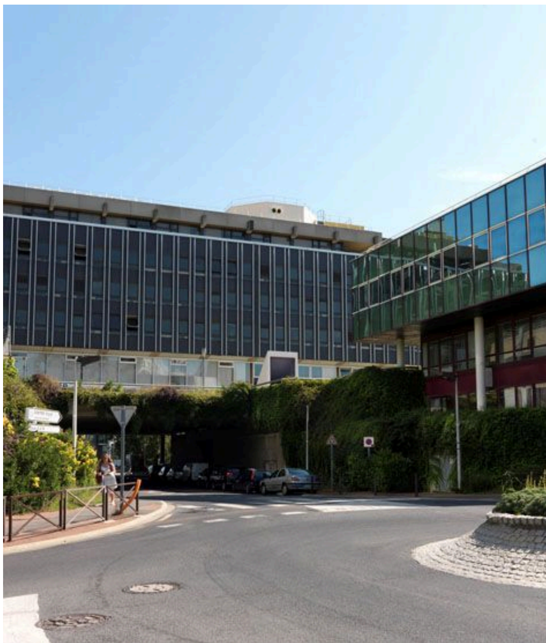
Vue de l'avenue de la Poste au niveau de son passage sous la dalle.