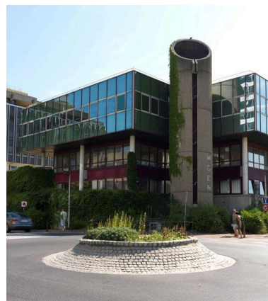
Vue du bâtiment MGEN situé à l'angle de la rue du Verger et de l'avenue de la Poste.