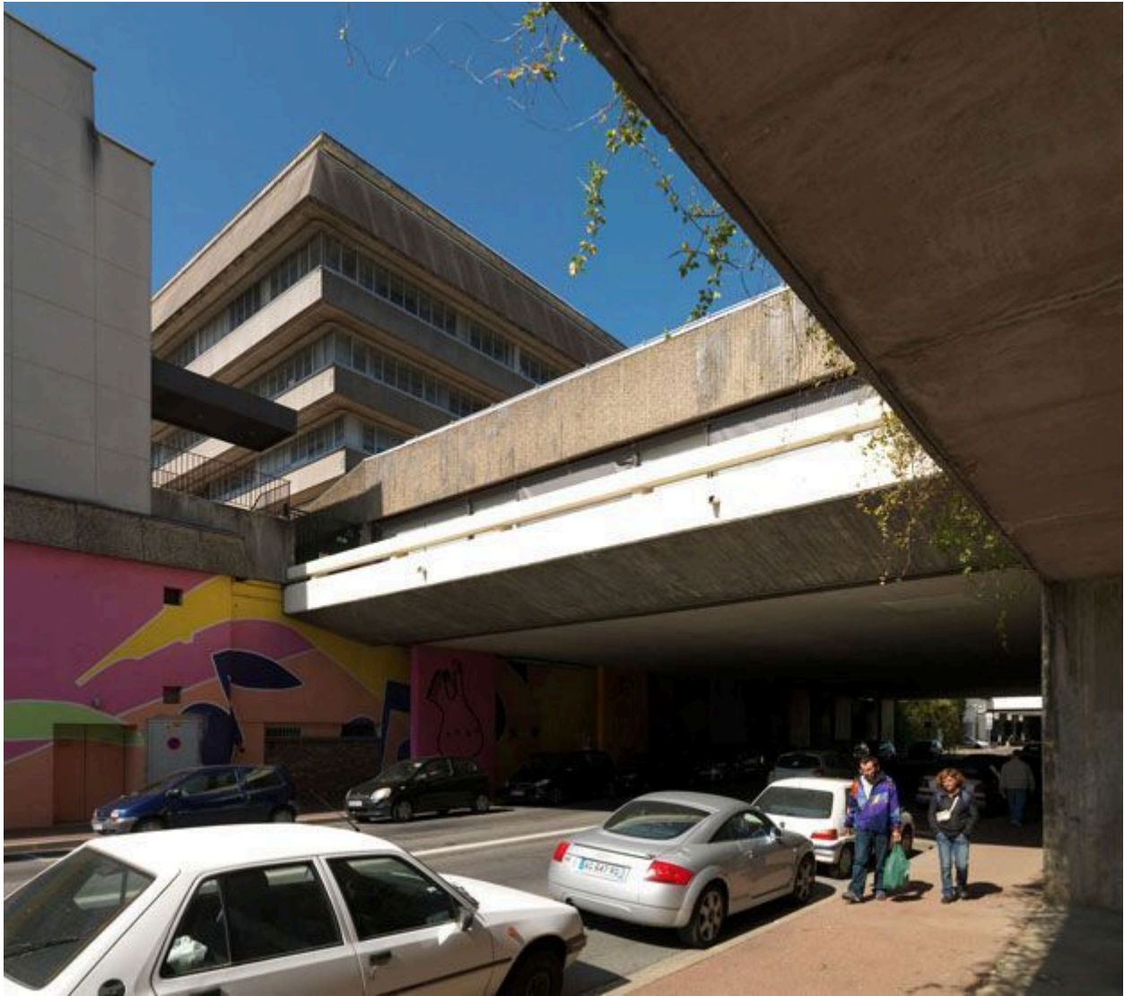
Vue de la rue de la Préfecture au niveau d'un passage sous la dalle. A gauche, le bâtiment de la préfecture.