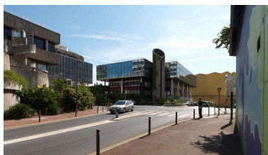
Vue du bâtiment MGEN depuis la rue de la Préfecture. IVR11_20129500577NUC4A