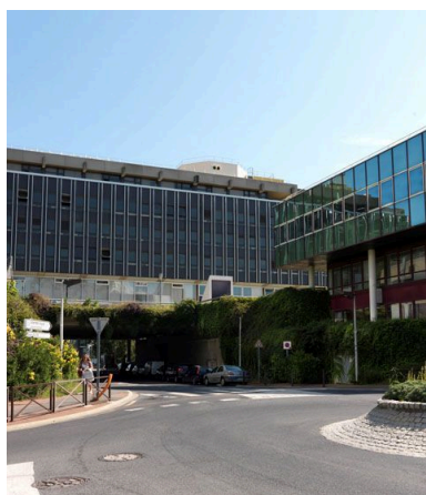
Vue de l'avenue de la Poste au niveau de son passage sous la dalle.