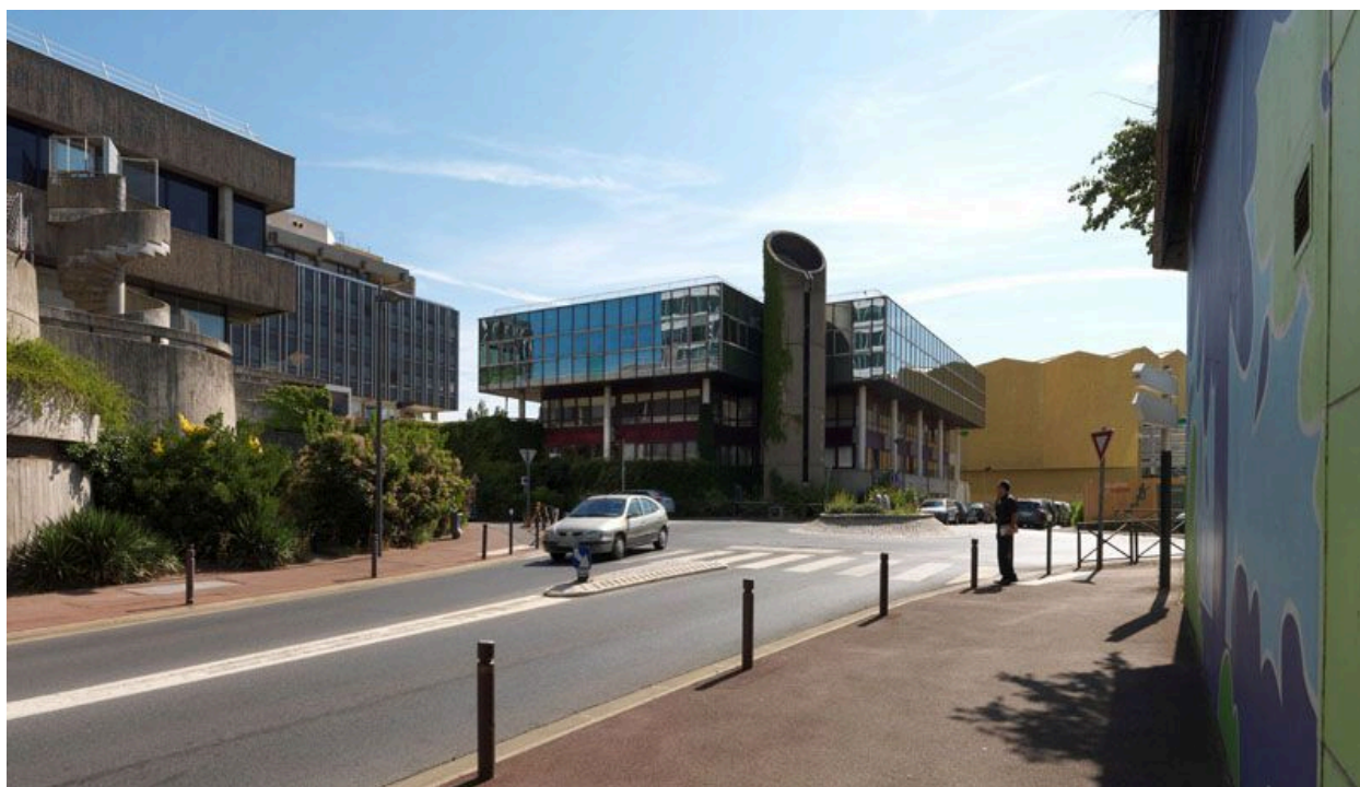
Vue du bâtiment MGEN depuis la rue de la Préfecture.