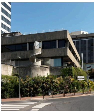
Vue d'un escalier hélicoidal à l'angle de la rue de la Préfecture.