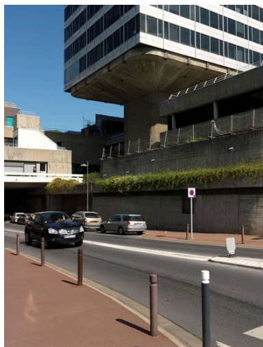
Vue de la rue de la préfecture qui pénètre sous la dalle.