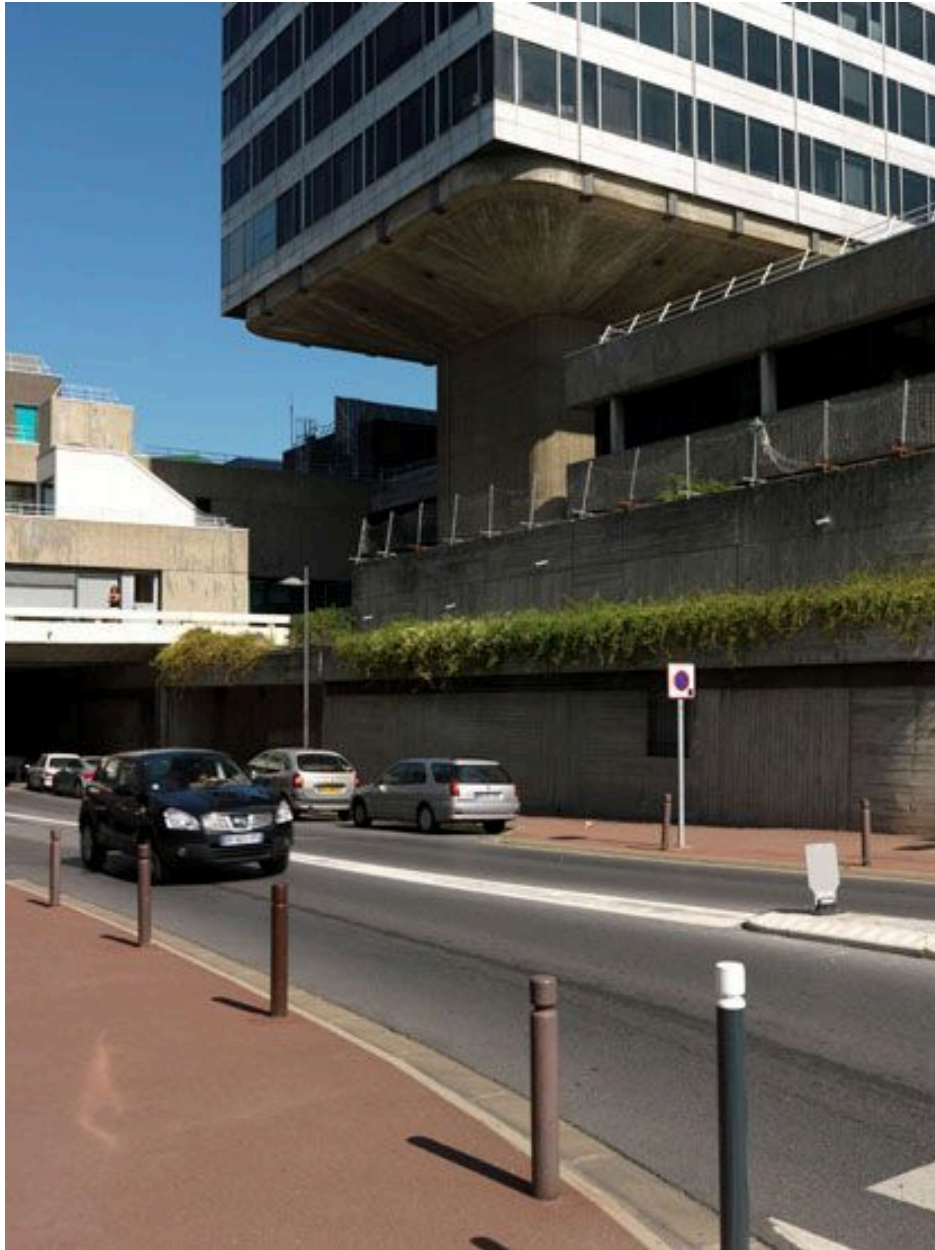
Vue de la rue de la préfecture qui pénètre sous la dalle.

IVR11_20129500576NUC4A Auteur de l'illustration : Philippe Ayrault Date de prise de vue : 2011 (c) Philippe Ayrault, Région Ile-de-France communication libre, reproduction soumise à autorisation