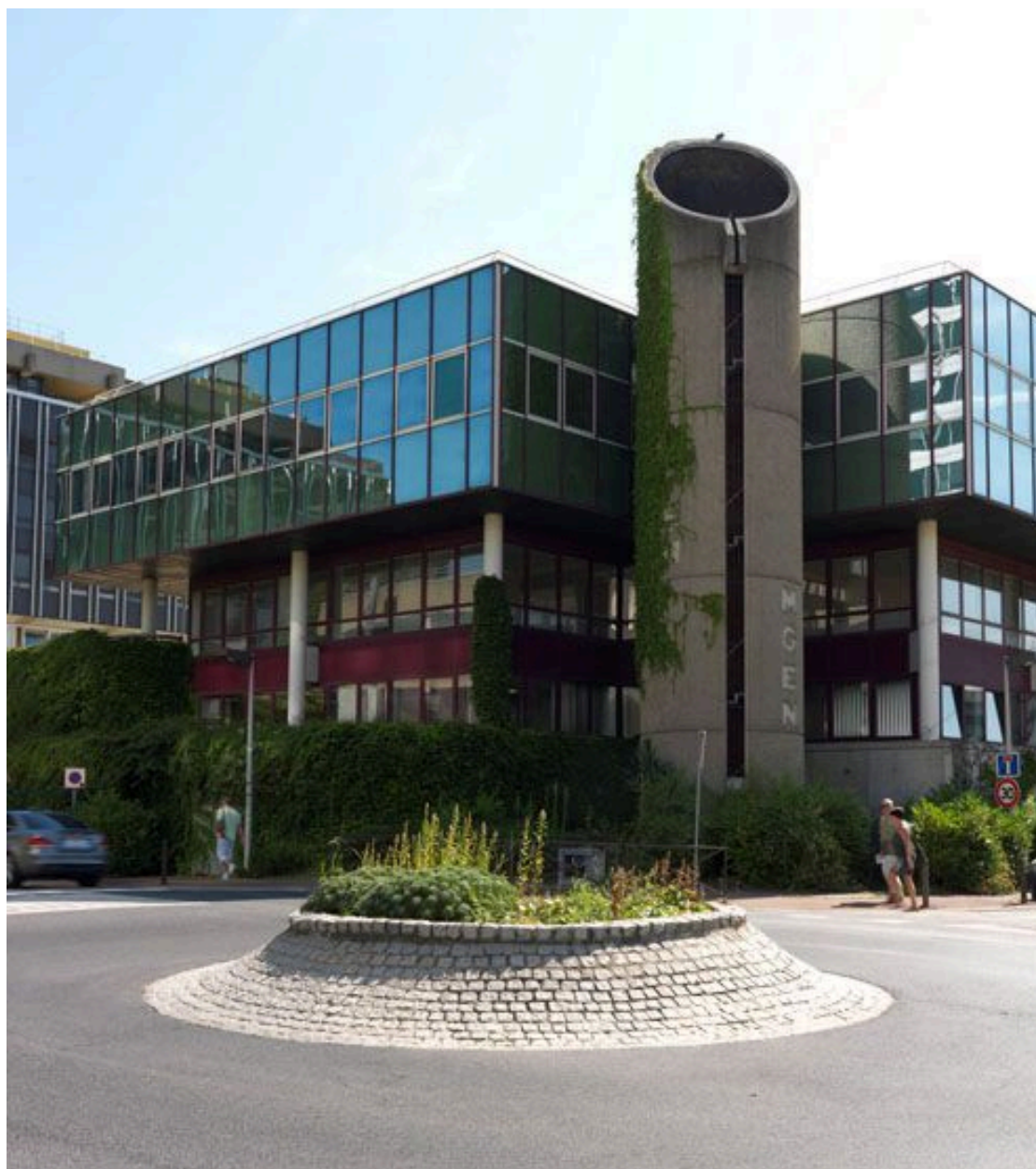
Vue du bâtiment MGEN situé à l'angle de la rue du Verger et de l'avenue de la Poste.