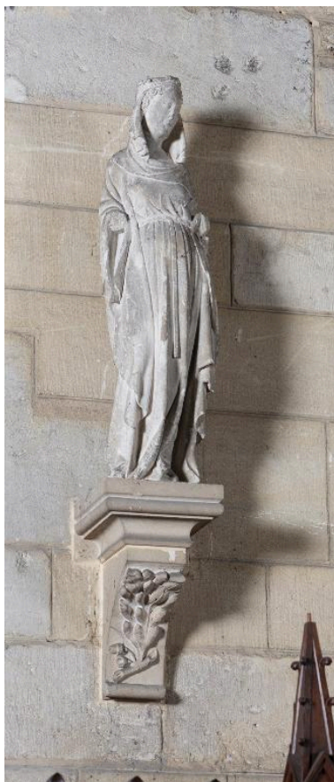
Vue d'une sainte non identifiée. IVR11_20187800714NUC4A