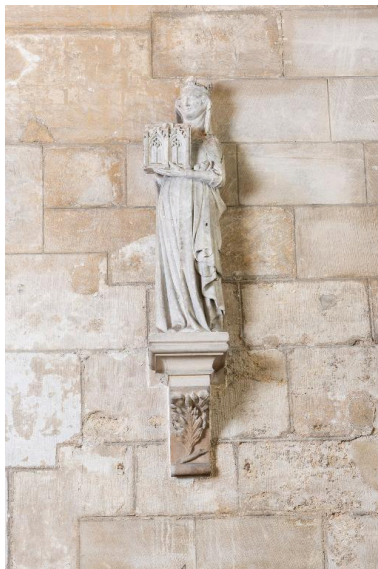
Statue de reine pouvant être Jeanne de Navarre. IVR11_20187800319NUC4A