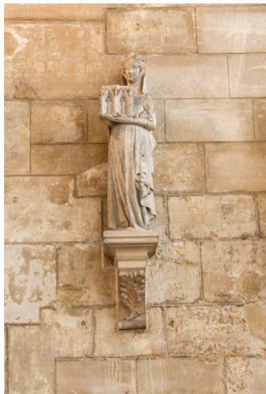
Statue de reine pouvant être Jeanne de Navarre.