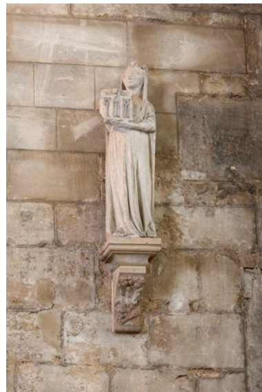
Statue de reine pouvant être Marie de Brabant.