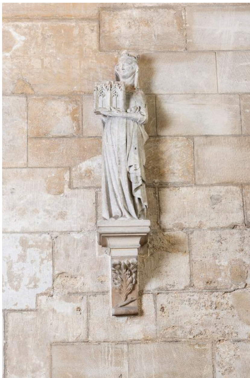
Statue de reine pouvant être Jeanne de Navarre.