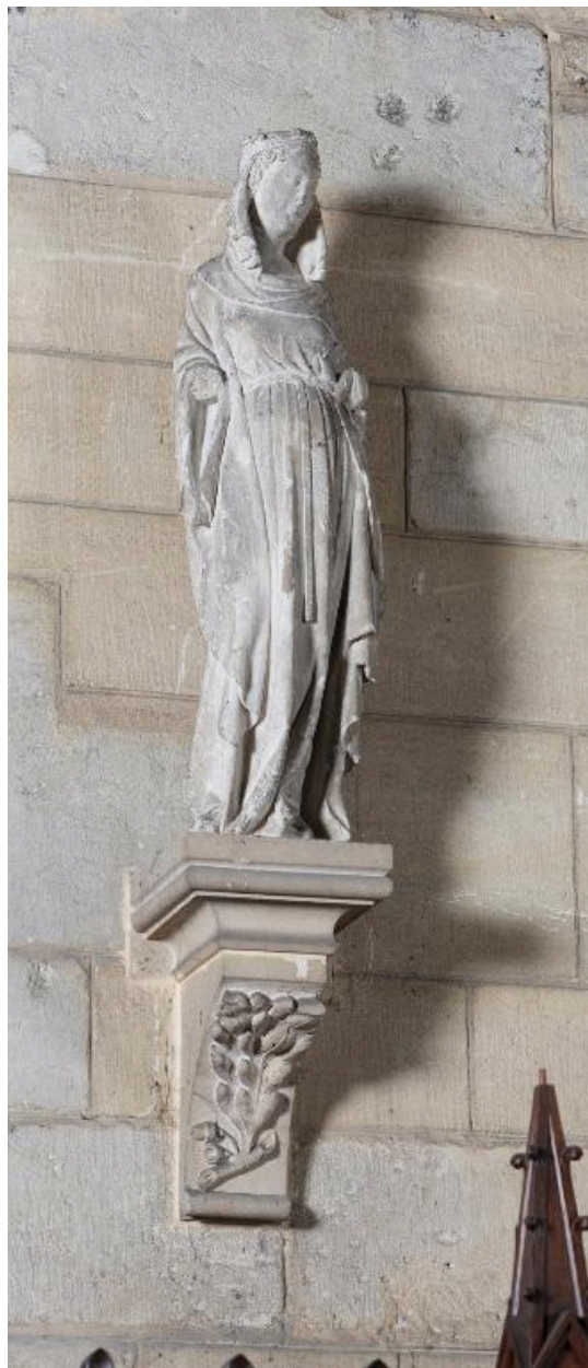
Vue d'une sainte non identifiée.