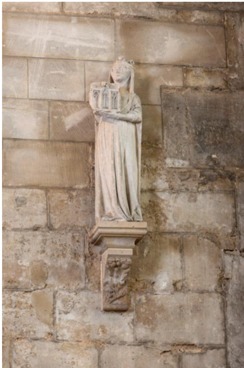
Statue de reine pouvant être Marie de Brabant.