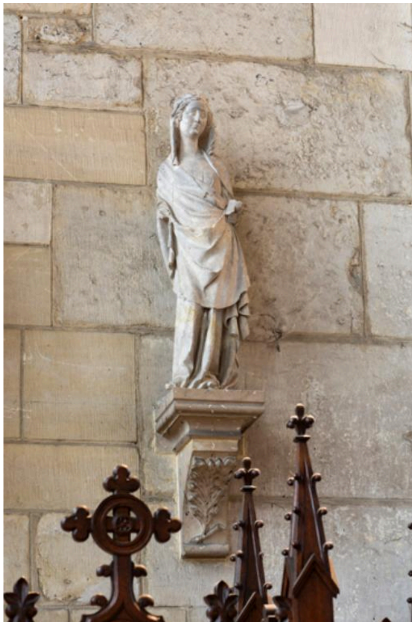
Statue de sainte non identifiée.