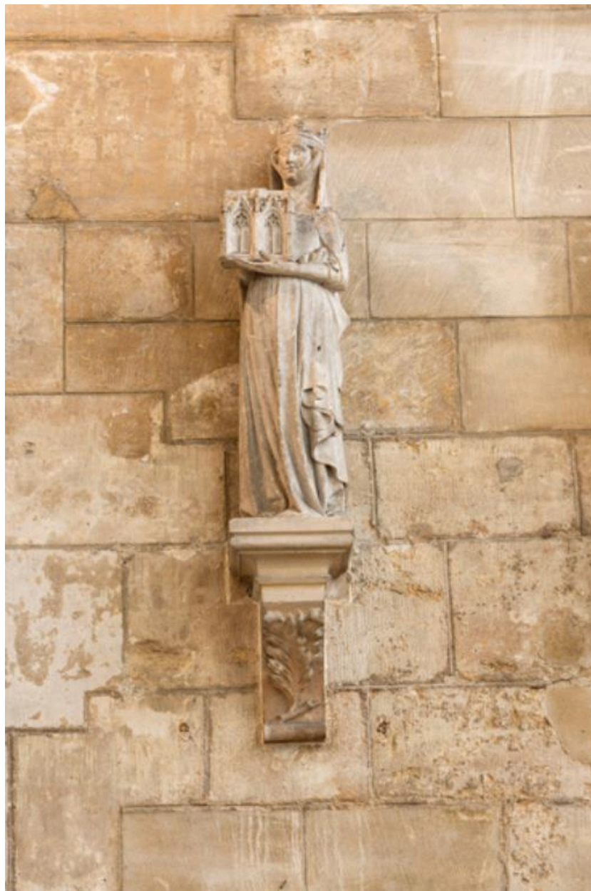
Statue de reine pouvant être Jeanne de Navarre.