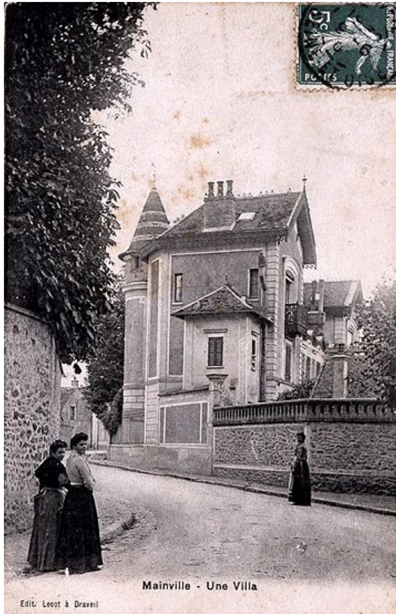
Vue latérale. Carte postale, 1910.