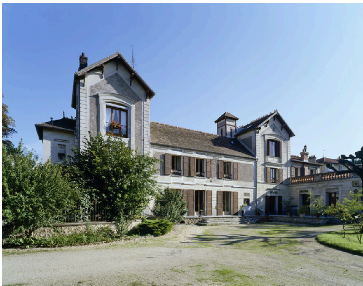
La façade donnant sur le parc.