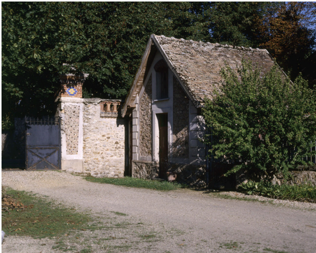
Une remise accolée au mur de clôture, près de l'entrée.