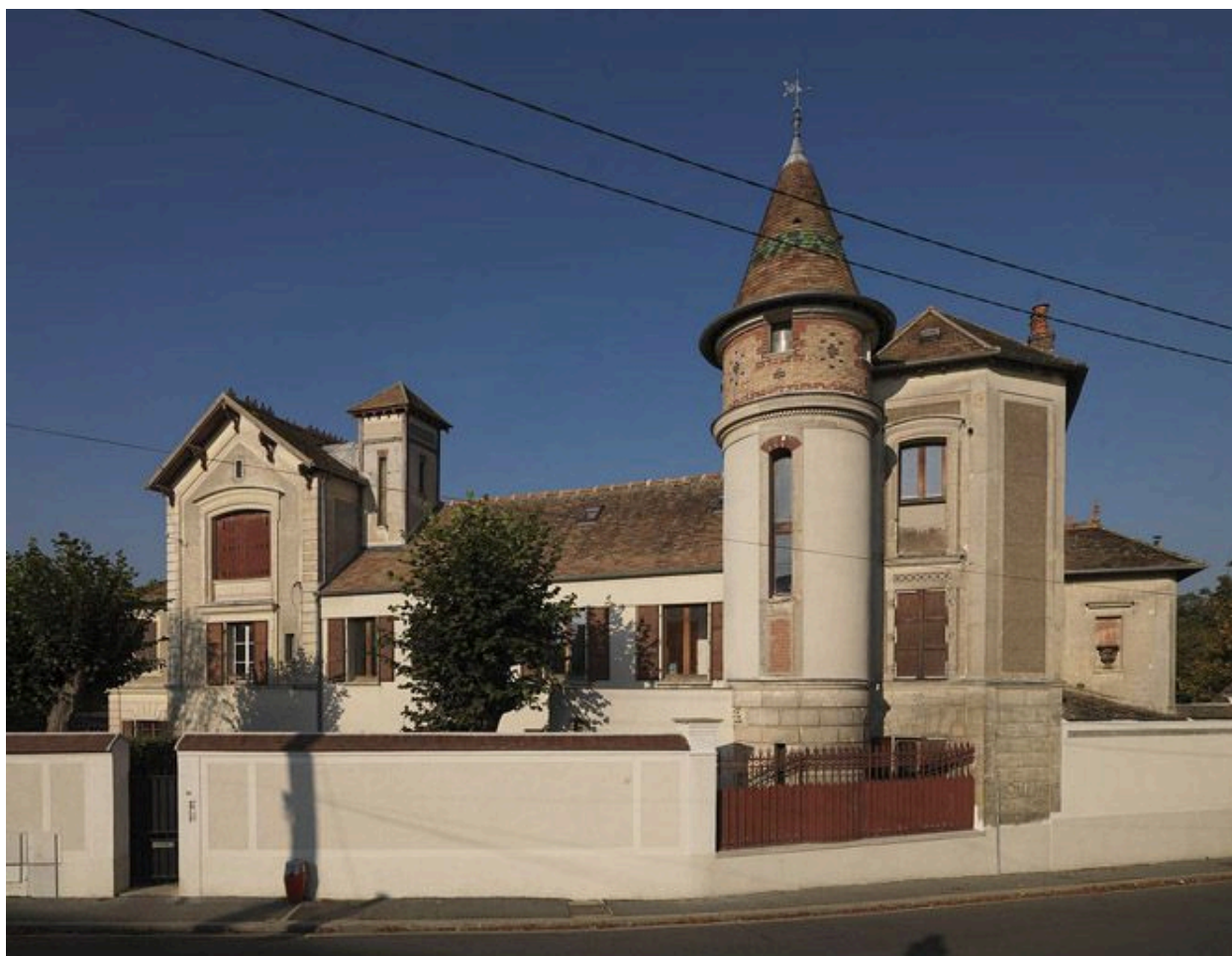
Vue de la façade arrière sur la rue Waldeck-Rousseau.