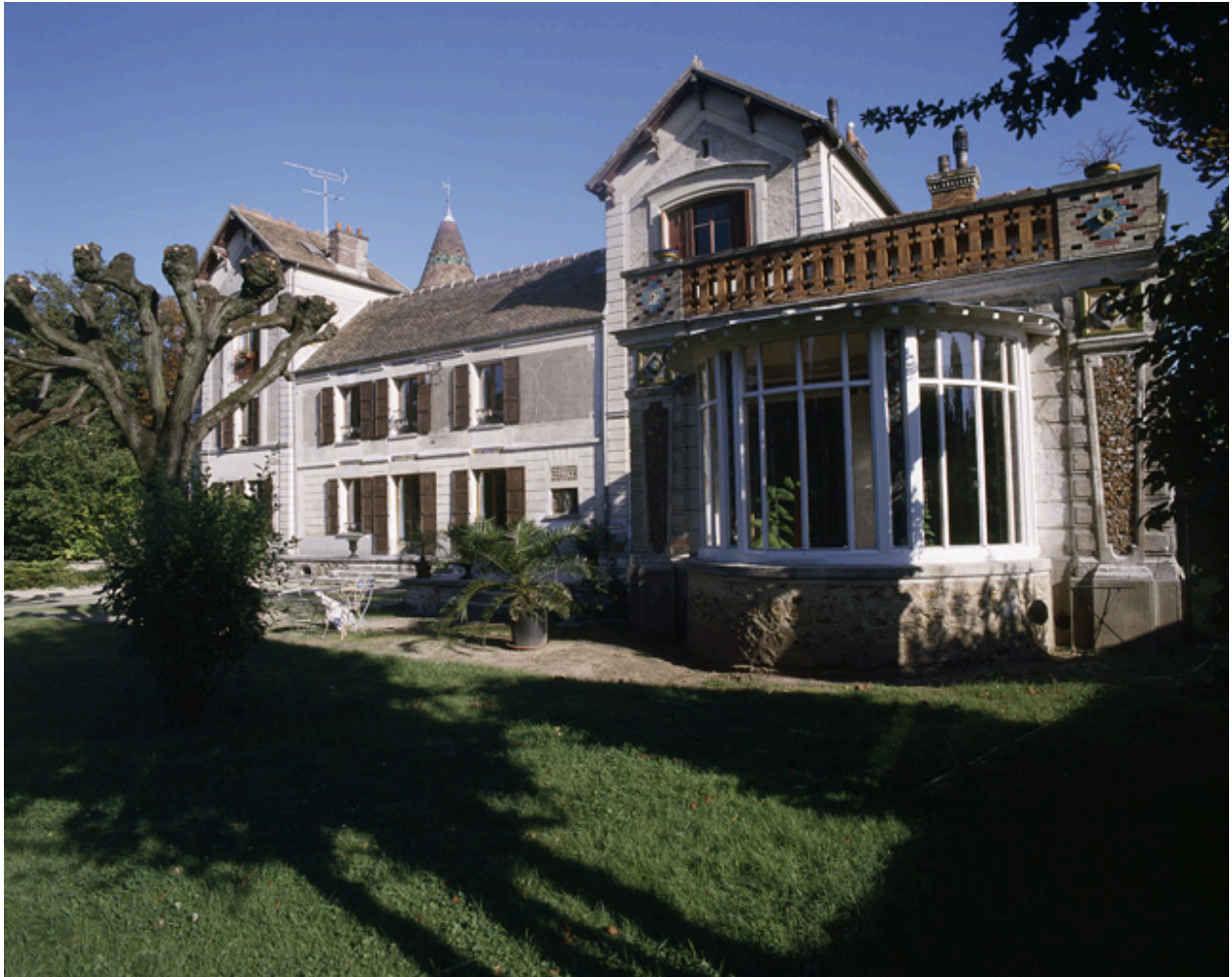
Façade sur le parc : vue d'ensemble montrant au premier plan la terrasse accolée à l'aile ouest.