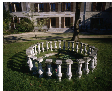
Un bassin au centre de la pelouse située devant la maison. Son pourtour circulaire est formé d'une rangée de balustres.