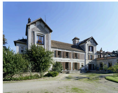
La façade donnant sur le parc.