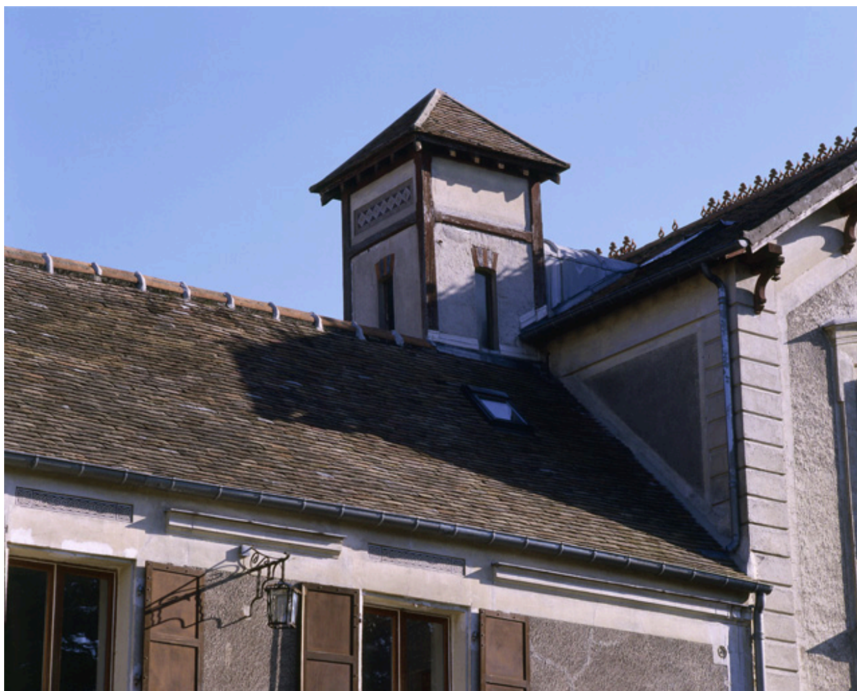
Détail du clocheton surmontant la toiture à l'angle du corps principal et de l'aile ouest.