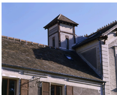
Détail du clocheton surmontant la toiture à l'angle du corps principal et de l'aile ouest. IVR11_20069101233XA