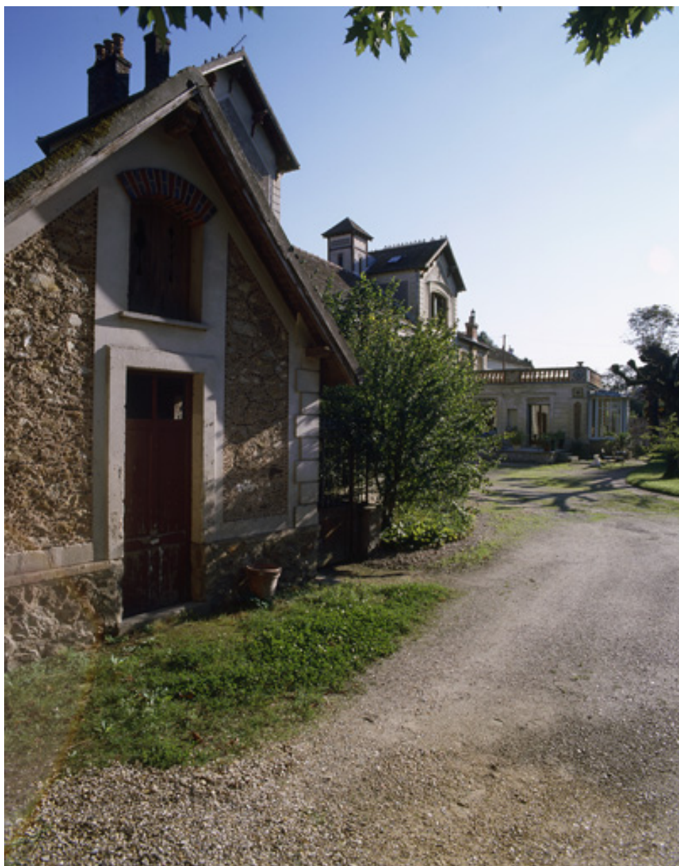
Vue perspective côté parc, à partir du portail d'entrée.