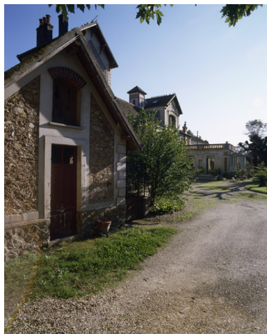
Vue perspective côté parc, à partir du portail d'entrée.