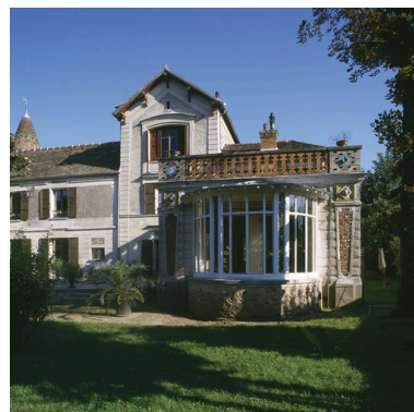
Façade sur le parc : détail de la terrasse prolongée par une véranda.