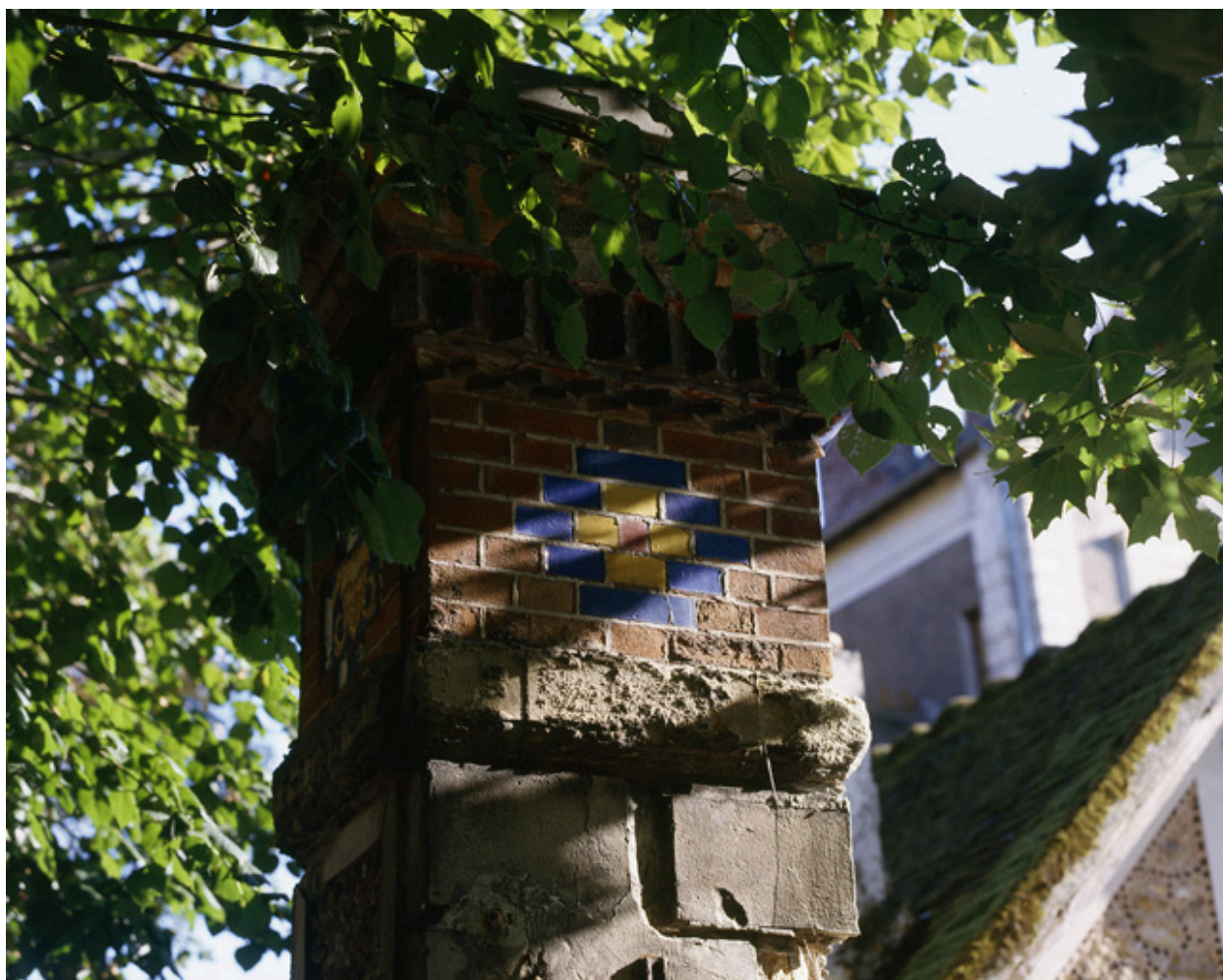
Détail du décor de céramique d'un des piliers du portail d'entrée.