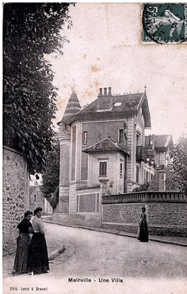
Vue latérale. Carte postale, 1910.