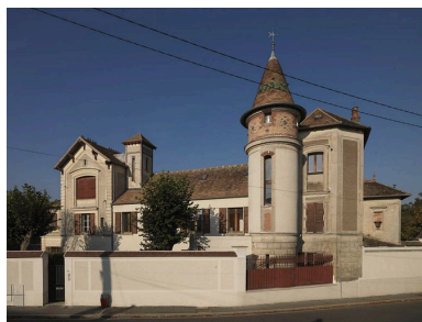
Vue de la façade arrière sur la rue Waldeck-Rousseau. IVR11_20089100297NUC4A