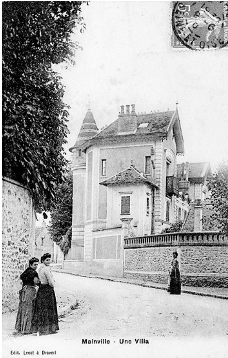
Vue latérale. Carte postale, vers 1910.