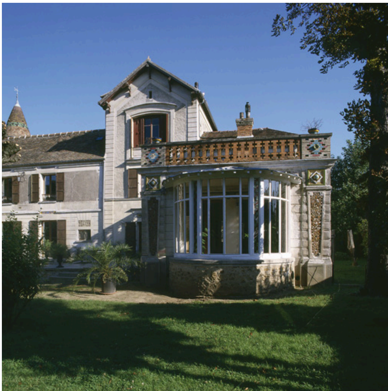
Façade sur le parc : détail de la terrasse prolongée par une véranda.