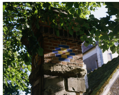
Détail du décor de céramique d'un des piliers du portail d'entrée.