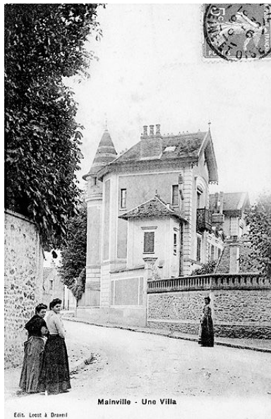
Vue latérale. Carte postale, vers 1910.