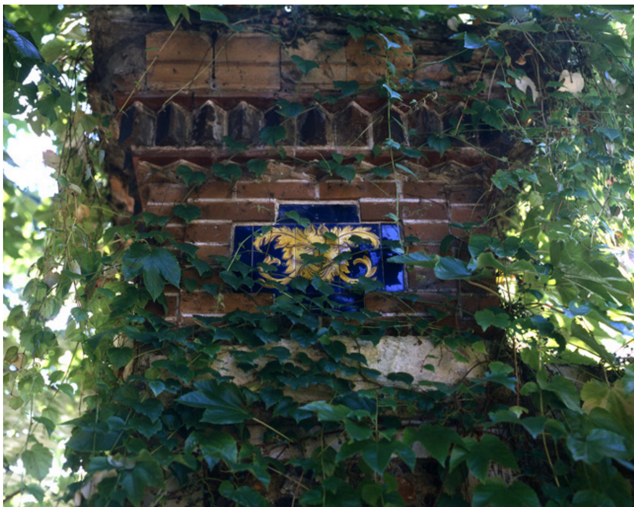
Détail du décor de céramique ornant les piliers du portail d'entrée.