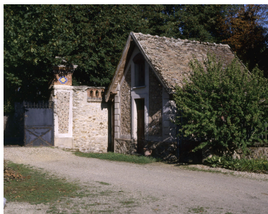
Une remise accolée au mur de clôture, près de l'entrée.