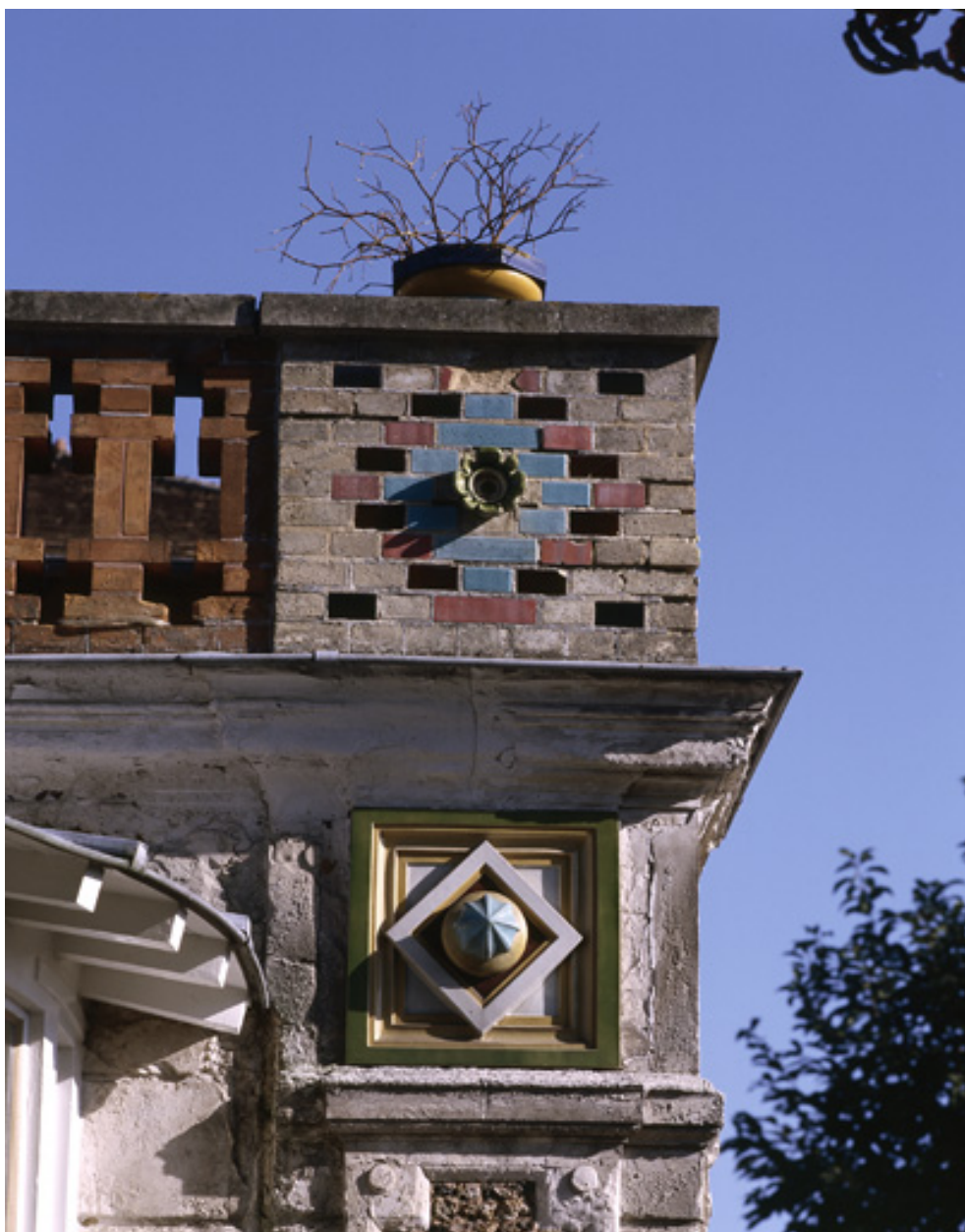
Détail du décor de brique vernissée et de céramique ornant la terrasse accolée à l'aile ouest.