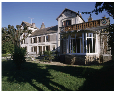
Façade sur le parc : vue d'ensemble montrant au premier plan la terrasse accolée à l'aile ouest.