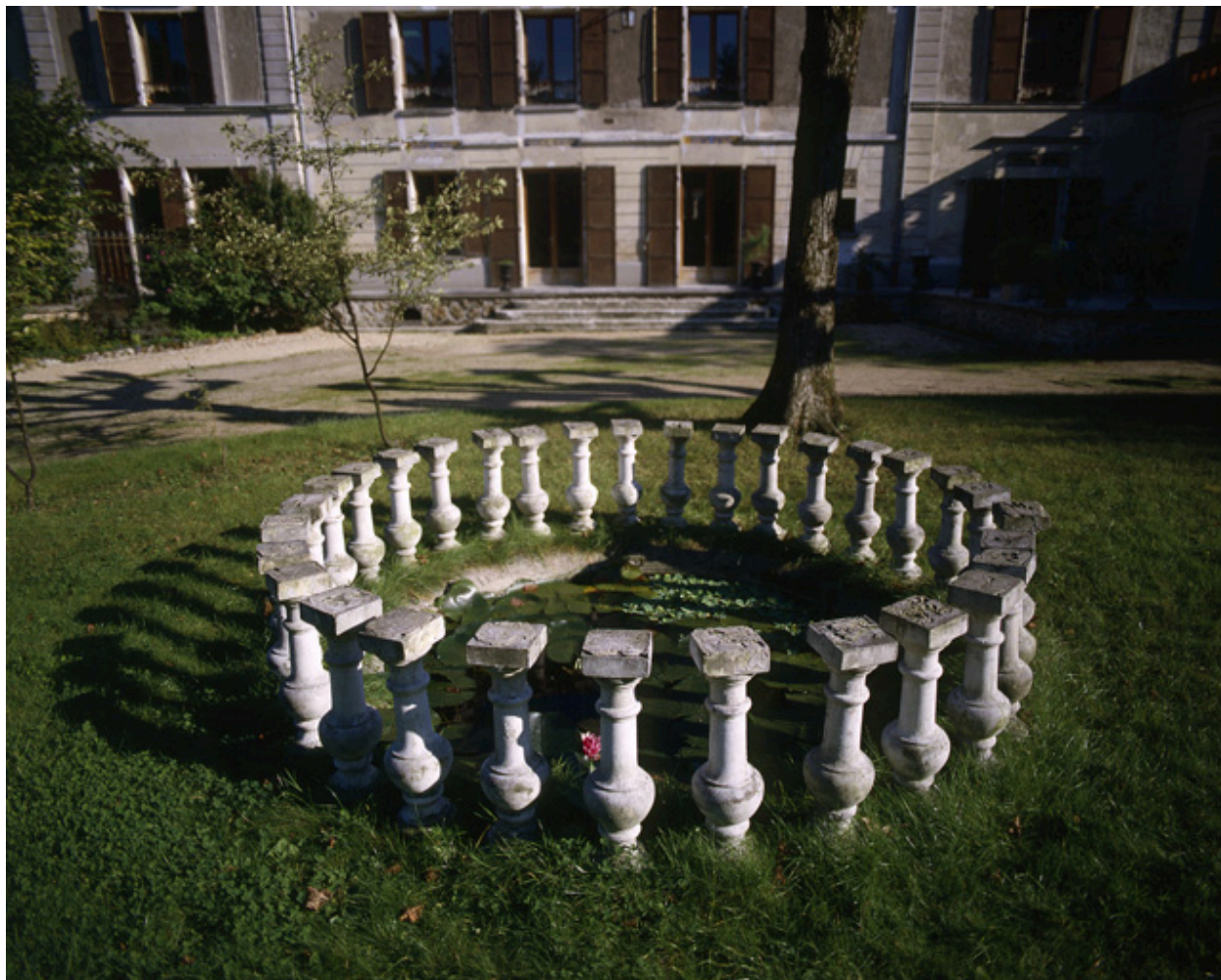
Un bassin au centre de la pelouse située devant la maison. Son pourtour circulaire est formé d'une rangée de balustres.