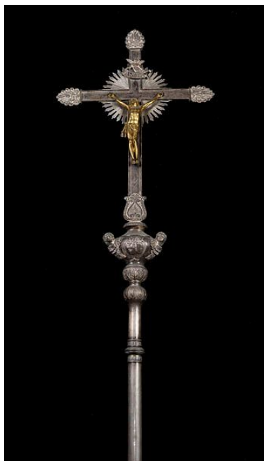
Croix n°1 : partie supérieure. IVR11_20117701104NUC4A