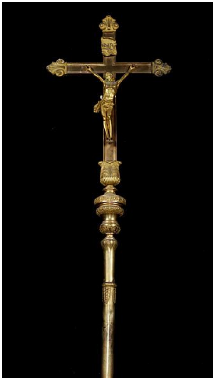
Croix n°3 : vue de la partie supérieure.