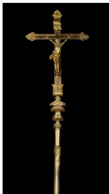
Croix n°3 : vue de la partie supérieure. IVR11_20117701102NUC4A