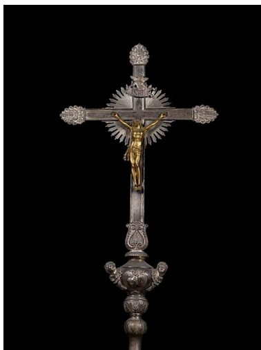
Croix n°1 : détail du Christ en croix.