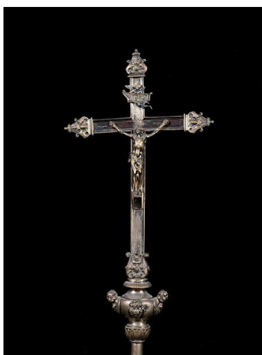
Croix n°2 : détail du Christ en croix.