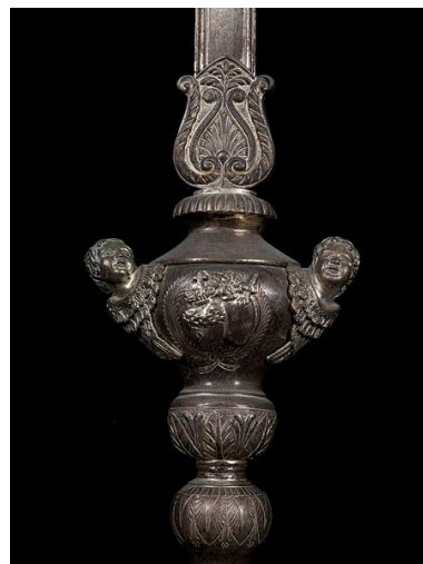
Croix n°1 : détail du noeud, avec les Sacrés-Coeurs de Jésus et Marie.