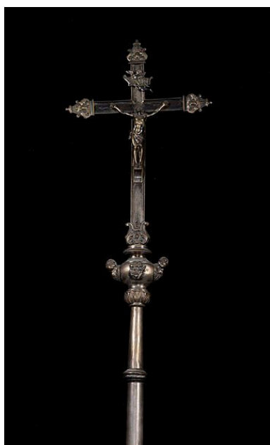
Croix n° 2 : partie supérieure. IVR11_20117701107NUC4A