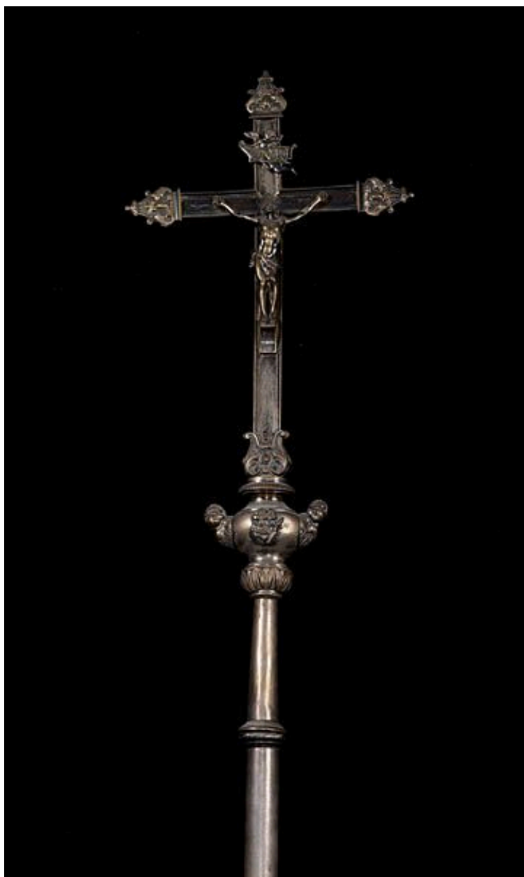
Croix n° 2 : partie supérieure.