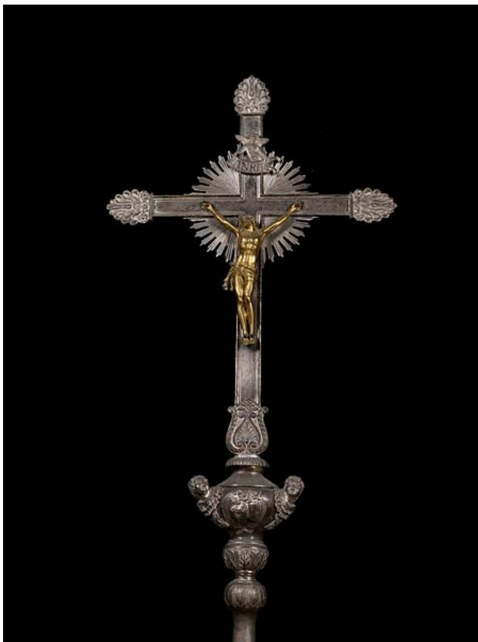
Croix n°1 : détail du Christ en croix.