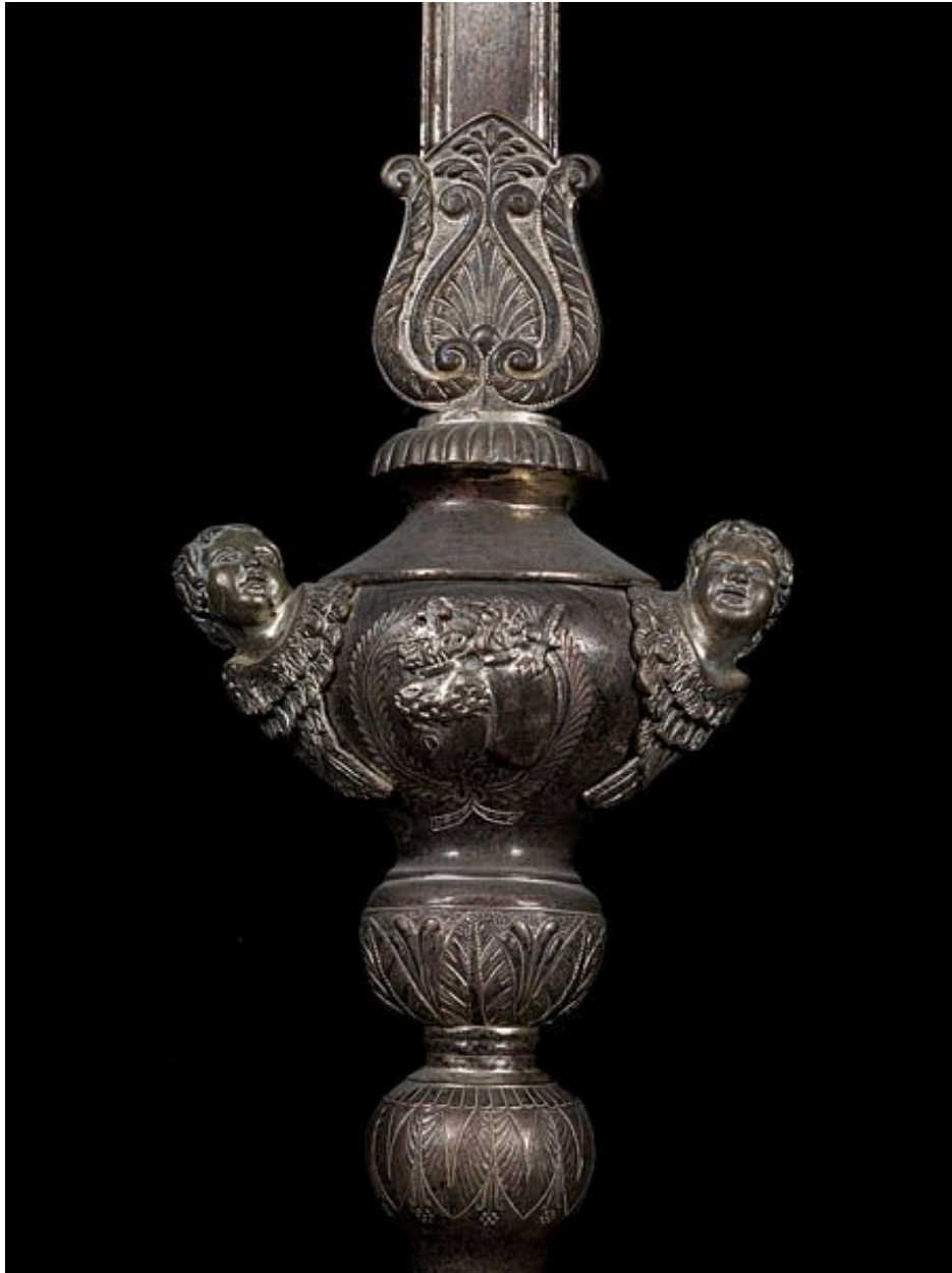
Croix n°1 : détail du noeud, avec les Sacrés-Coeurs de Jésus et Marie.