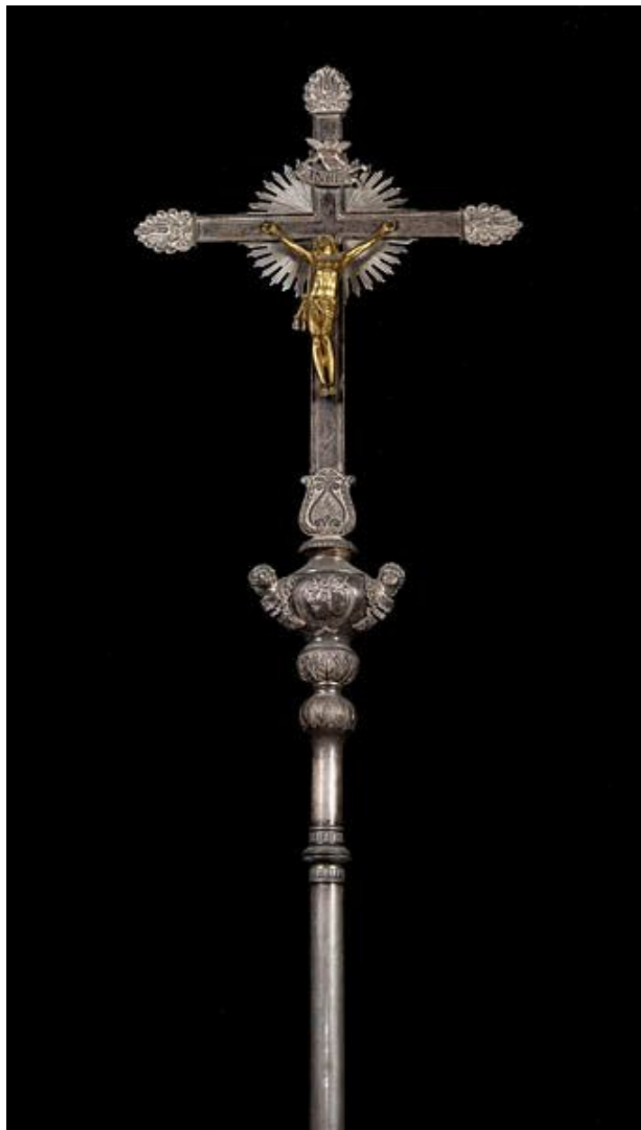
Croix n°1 : partie supérieure.