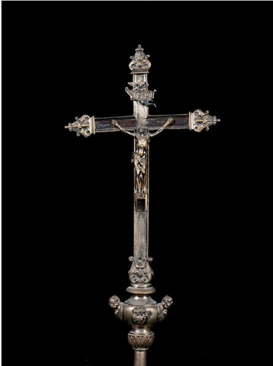
Croix n°2 : détail du Christ en croix.