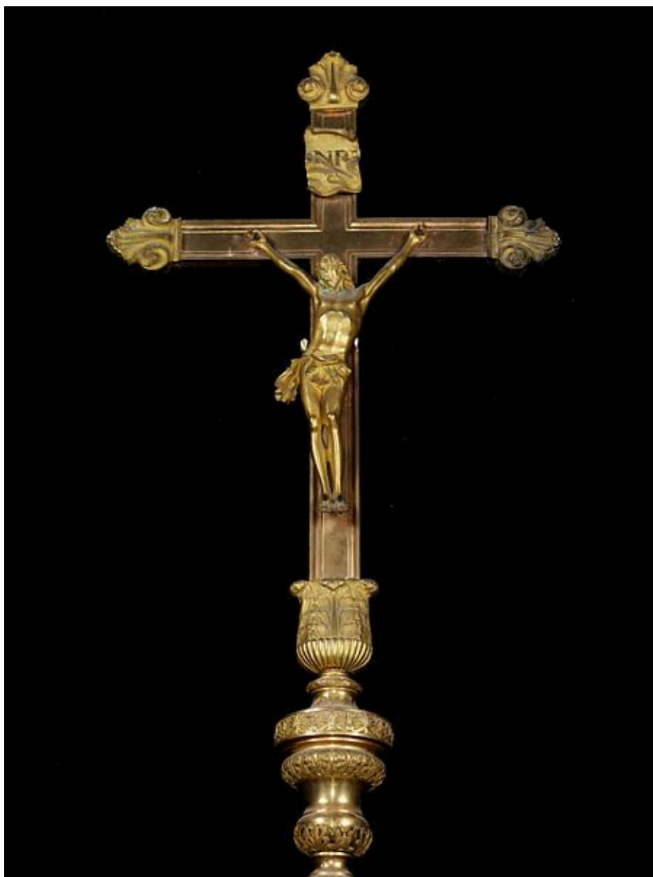
Croix n°3 : détail du Christ en croix.