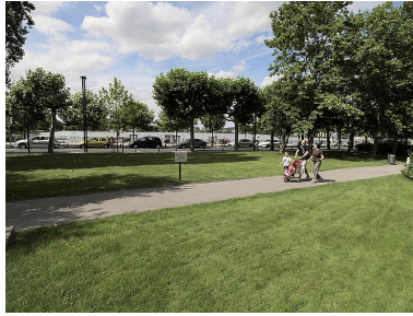
Vue d'ensemble de la promenade.

Autr. Jules (architecte) Emery, Autr. Roger (architecte) Hingre IVR11_20099500153NUC4A