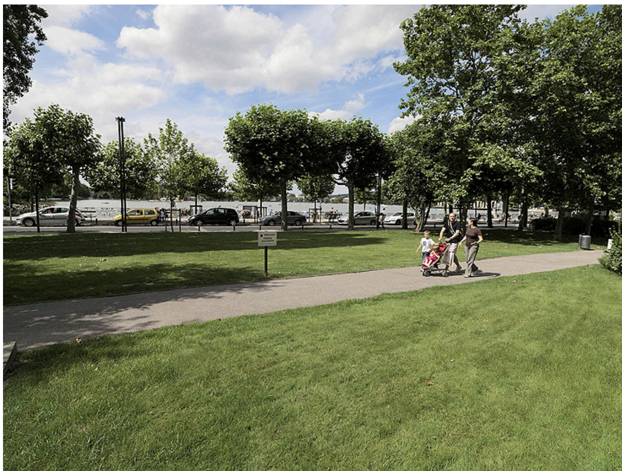
Vue d'ensemble de la promenade.