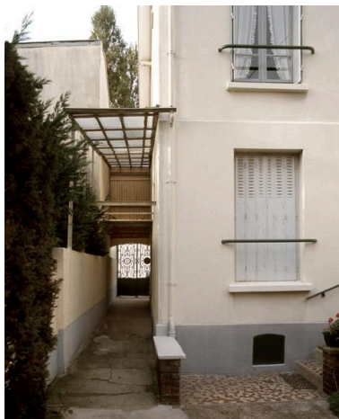
Passage latéral à la maison d'habitation, conduisant du portail d'entrée à la cour de l'atelier. Il est surmonté d'un espace de stockage où étaient abritées les pièces métalliques à transformer. IVR11_20059300031XA