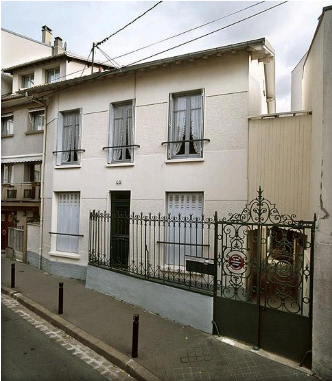
Maison d'habitation et grille en fer forgé, oeuvre du fils du serrurier BreLOT.