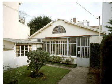
Vue du pignon de l'atelier, côté cour. IVR11_20059300027XA