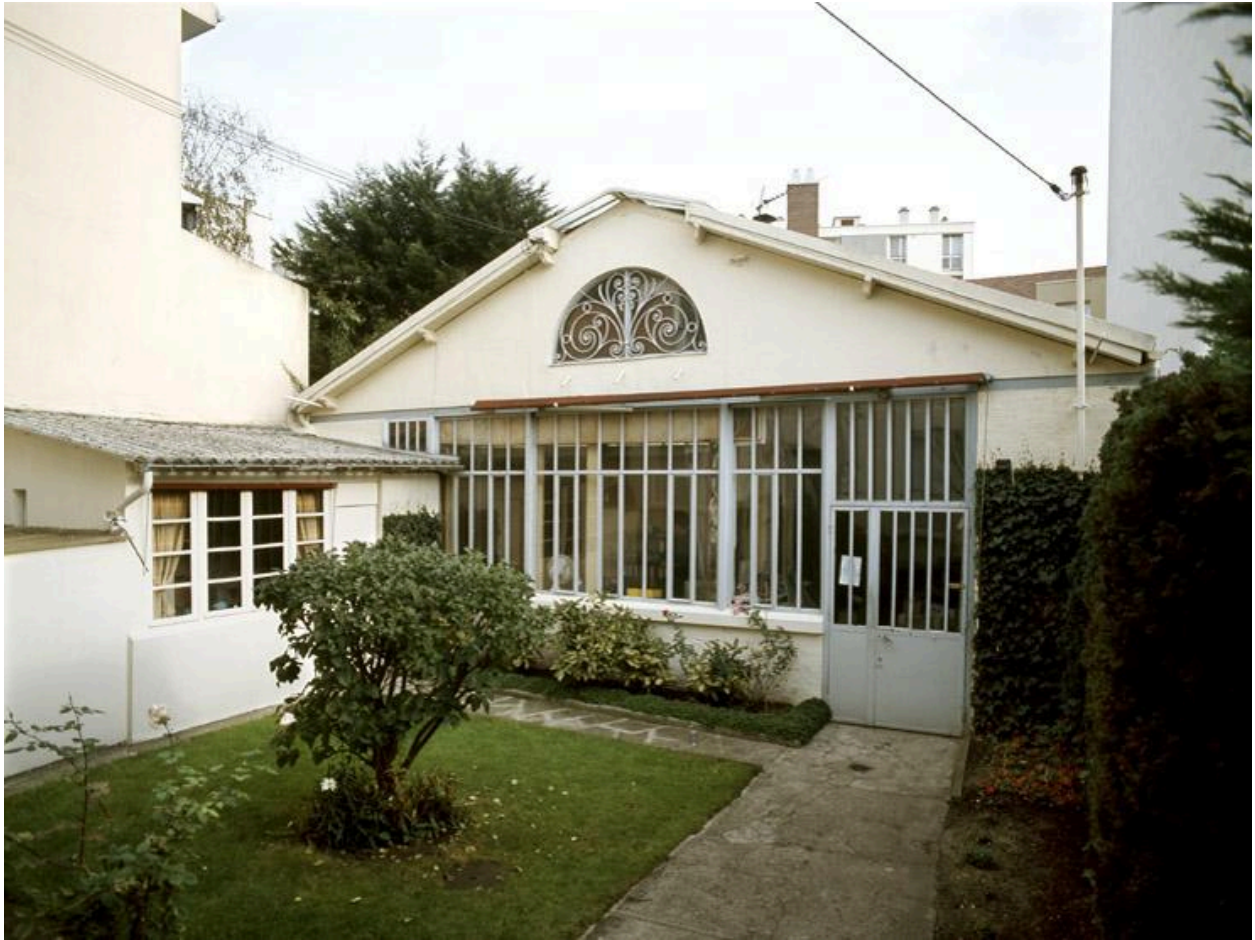
Vue du pignon de l'atelier, côté cour.