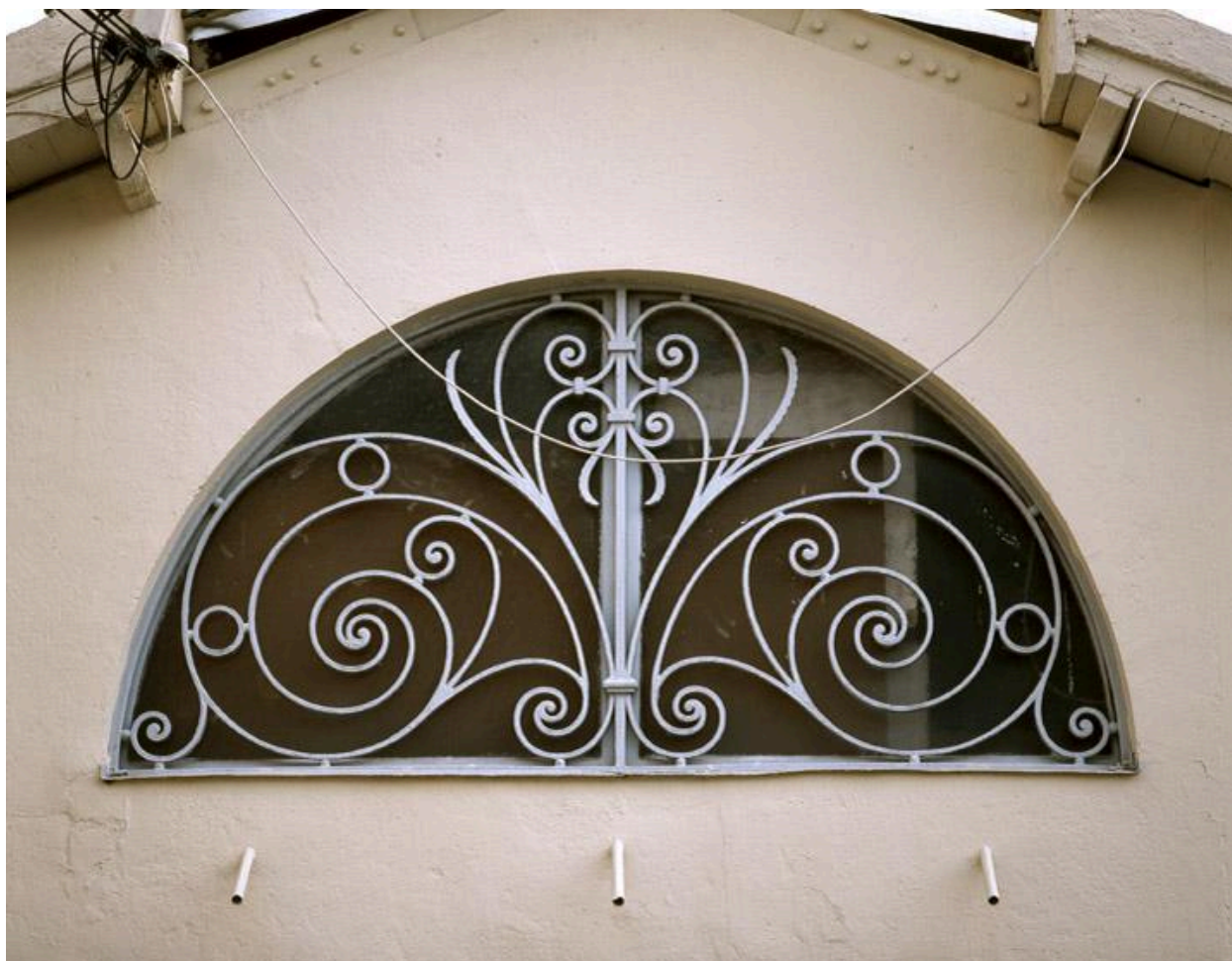
Baie en demi-cercle fermée d'une grille à motifs floraux, forgée par le fils de l'artisan serrurier BreLOT.