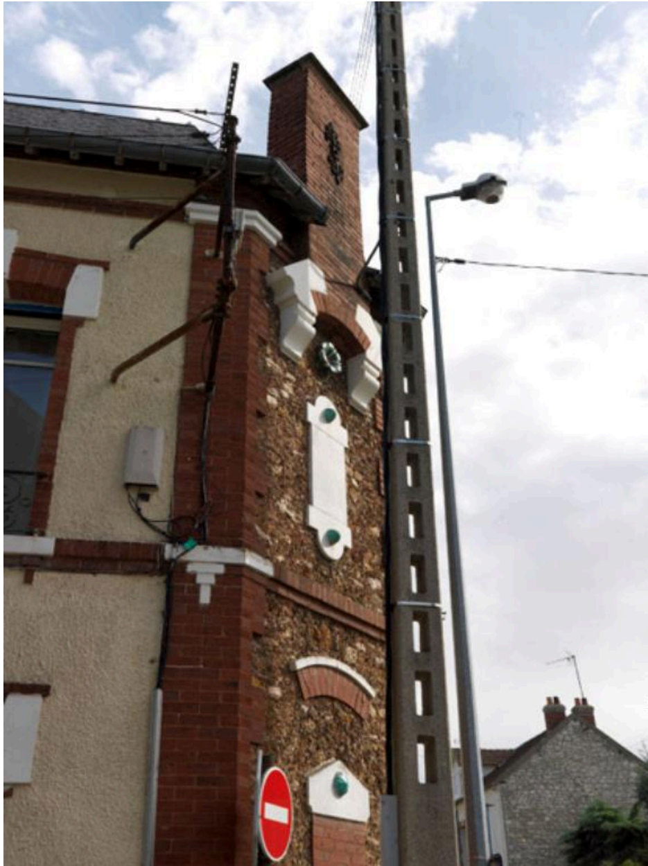
Vue du décor du pan coupé.