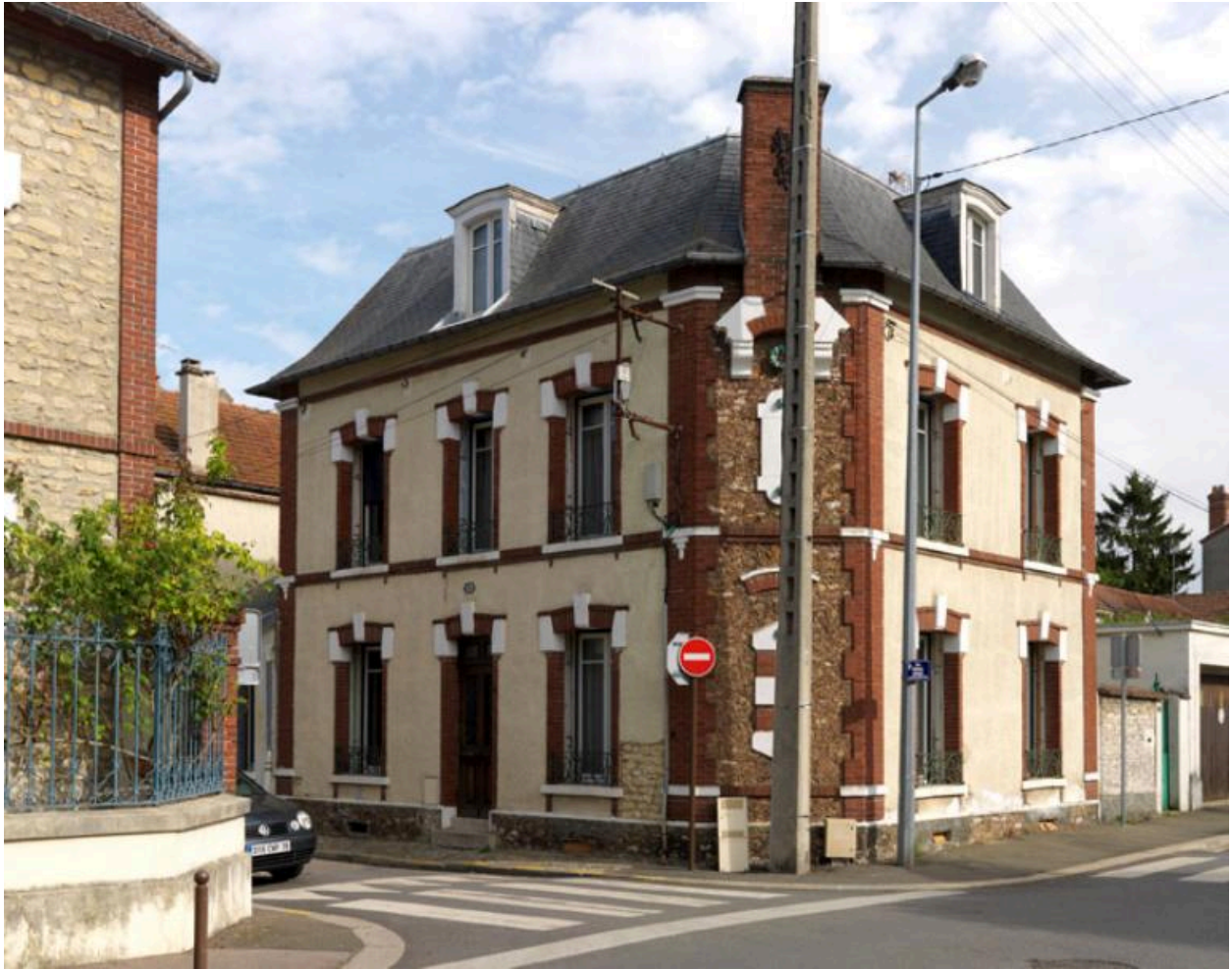
Vue d'ensemble de la maison.