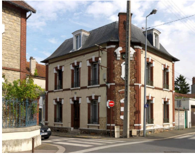
Vue d'ensemble de la maison. IVR11_20167800416NUC4A