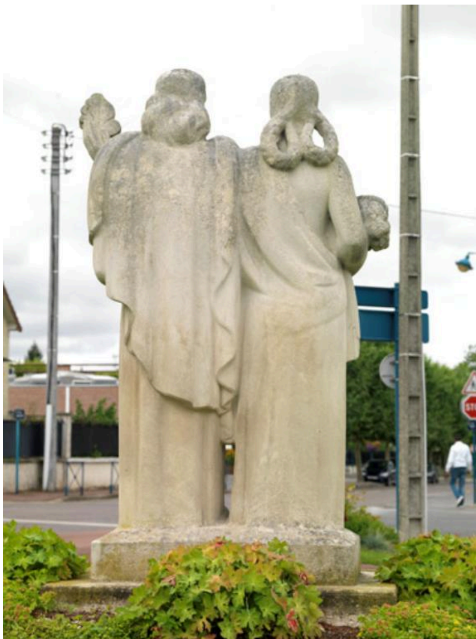
Le revers du groupe sculpté.