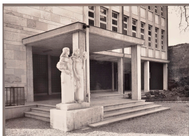
Cette sculpture devant l'hôtel-de-ville illustre la fusion de Mantes et de Gassicourt réalisée en 1930. IVR11_20157800461NUC4A