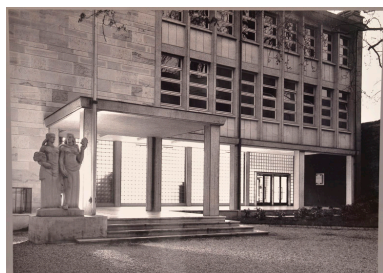
Le groupe sculpté en place devant l'hôtel-de-ville. IVR11_20157800460NUC4A