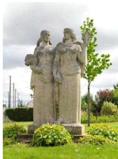
Vue de face du groupe sculpté. À gauche Gassicourt se reconnaît à sa gerbe de blé. À droite, Mantes tient les armoiries composées d'une demi fleur de lys et demi feuille de chêne.