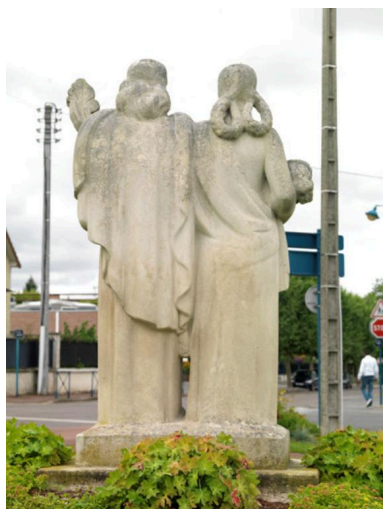
Le revers du groupe sculpté.