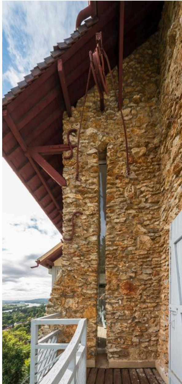
Fente dans la façade pour le passage des toiles