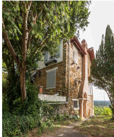
Vue latérale de la maison IVR11_20197800264NUC4A