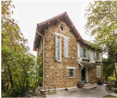
Vue générale de la maison IVR11_20197800263NUC4A