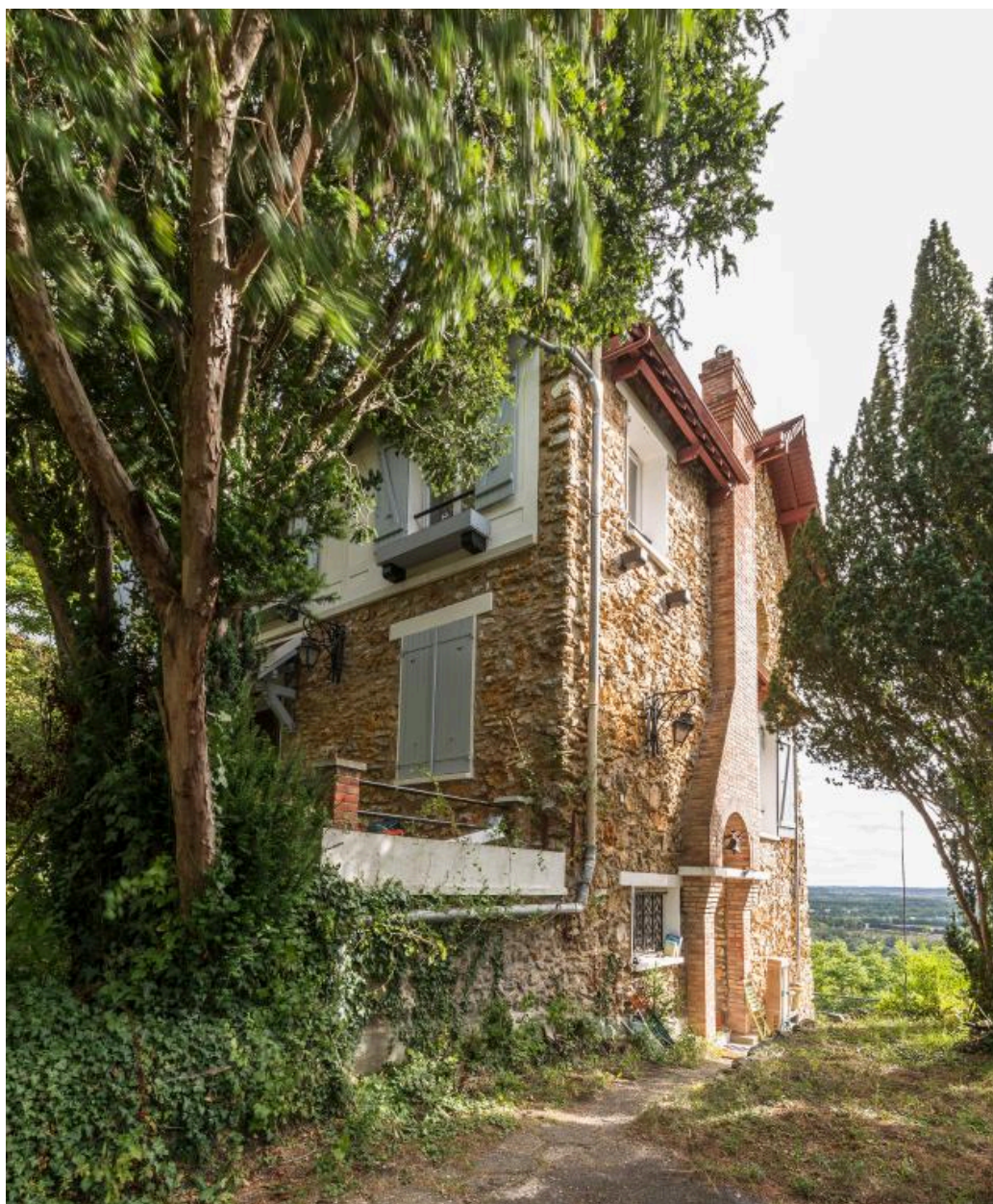
Vue latérale de la maison