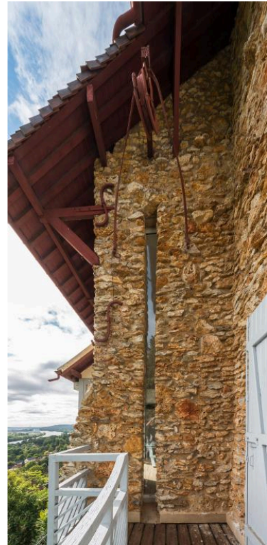
Fente dans la façade pour le passage des toiles IVR11_20197800265NUC4A