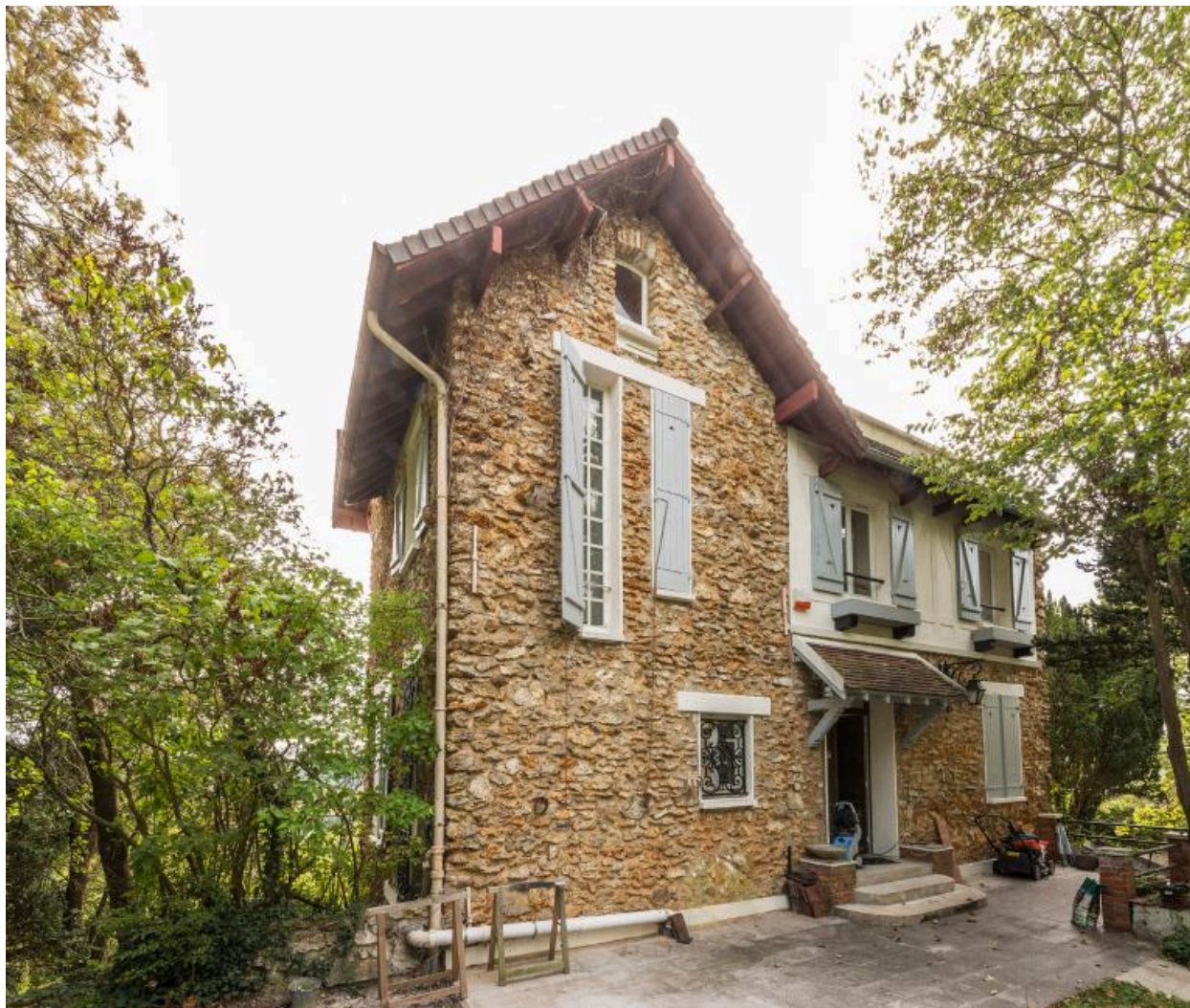
Vue générale de la maison