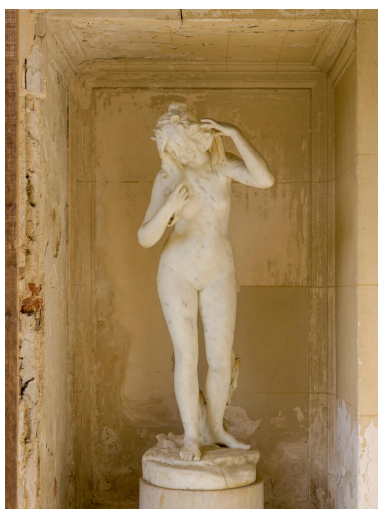
La nymphe dans la galerie. IVR11_20237800338NUC4A