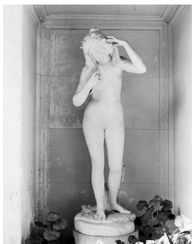
Nymphe en marbre dans sa niche. IVR11_19847801095X