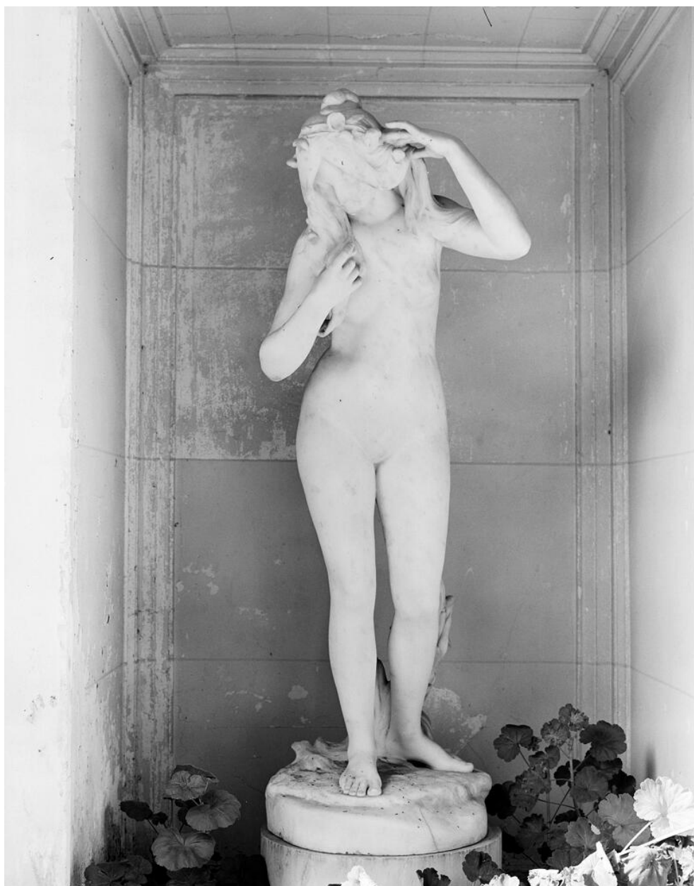
Nymphe en marbre dans sa niche.