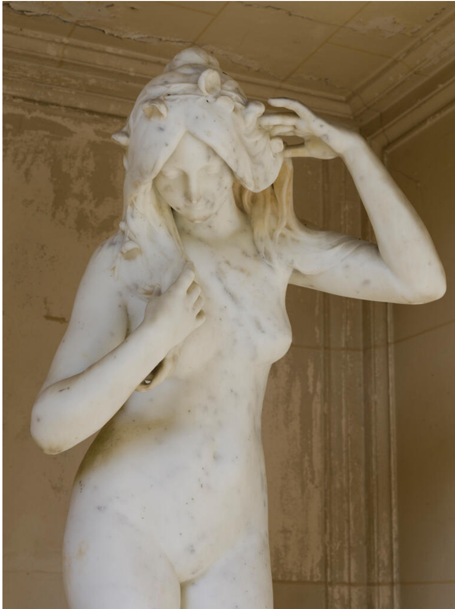
Détail de la nymphe et de sa couronne de fleurs.