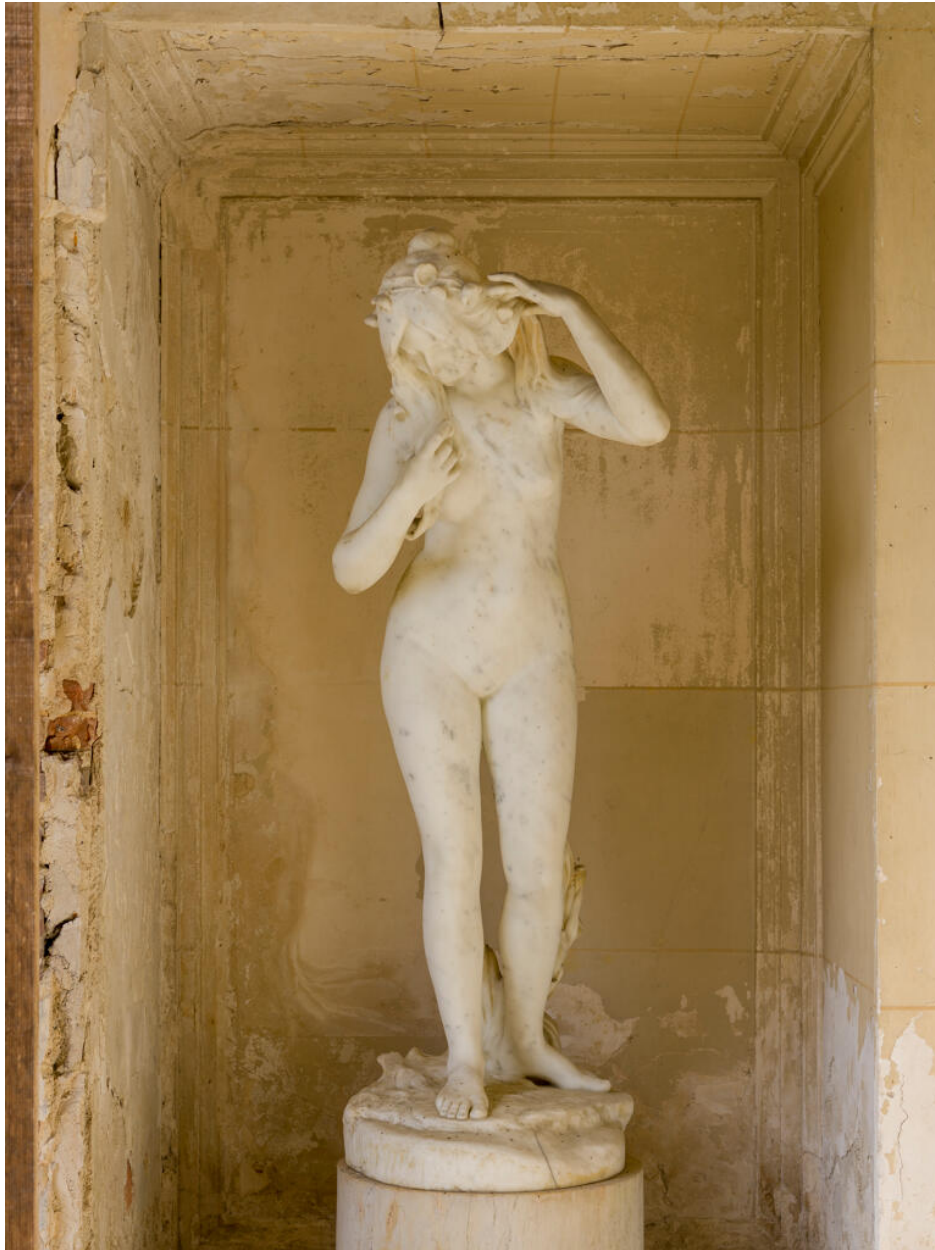
La nymphe dans la galerie.