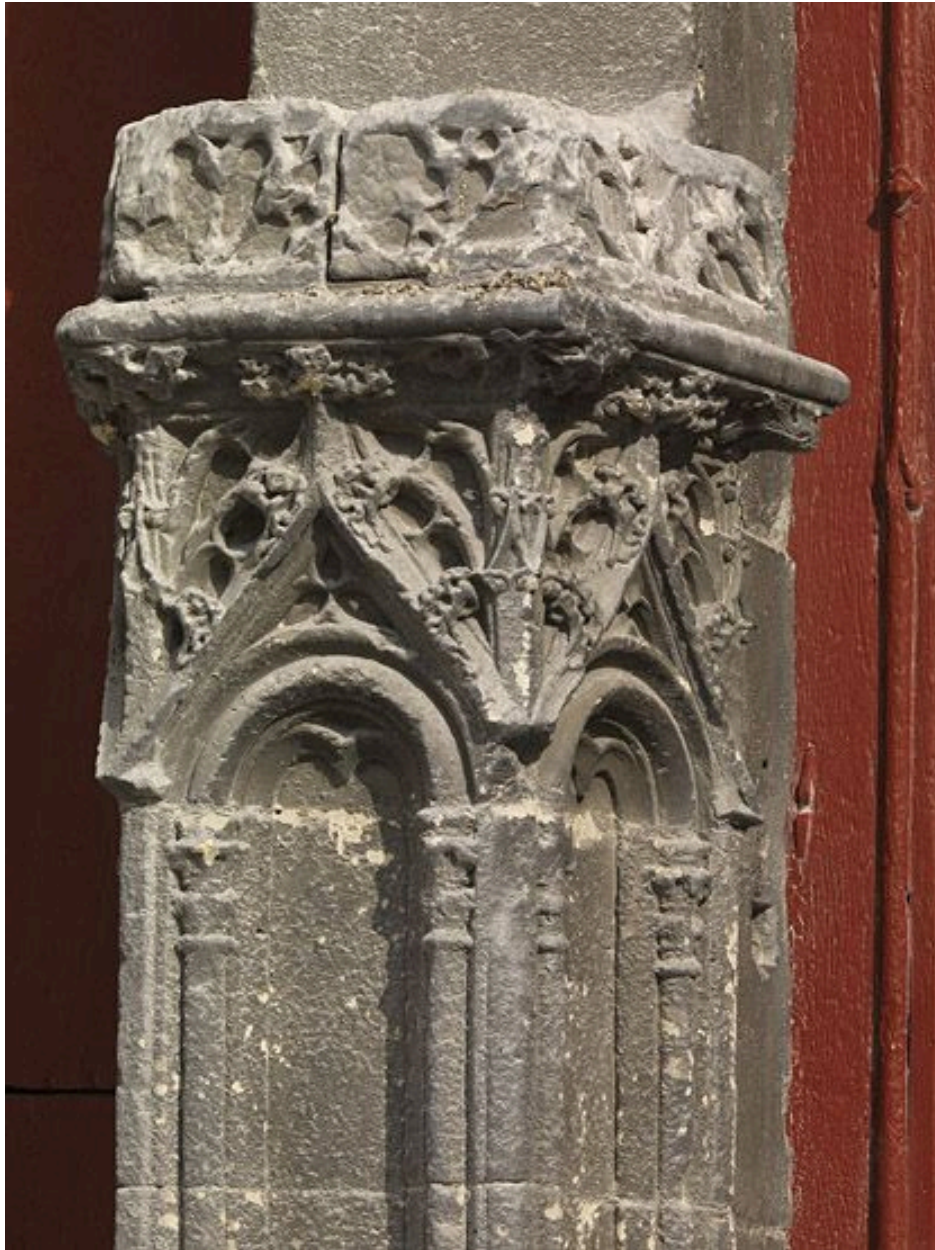
Détail du trumeau : socle de la statue (disparue).