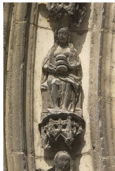
Détail de la voussure médiane : 2e claveau gauche, sainte Marie l'Egyptienne.