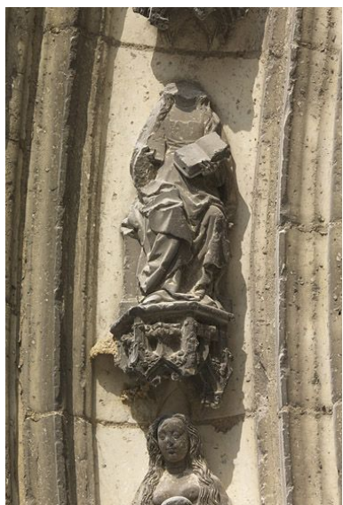
Détail de la voussure médiane : 3e claveau gauche, sainte lisant (étêtée).