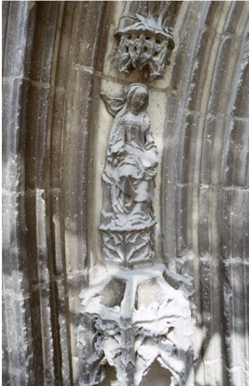
Les sculptures du portail Saint-Jean-Baptiste, vues depuis l'échafaudage dressé pour la restauration de la base de la tour nord (2008) : détail d'une sainte lisant, au départ de la voussure centrale (à gauche du tympan).