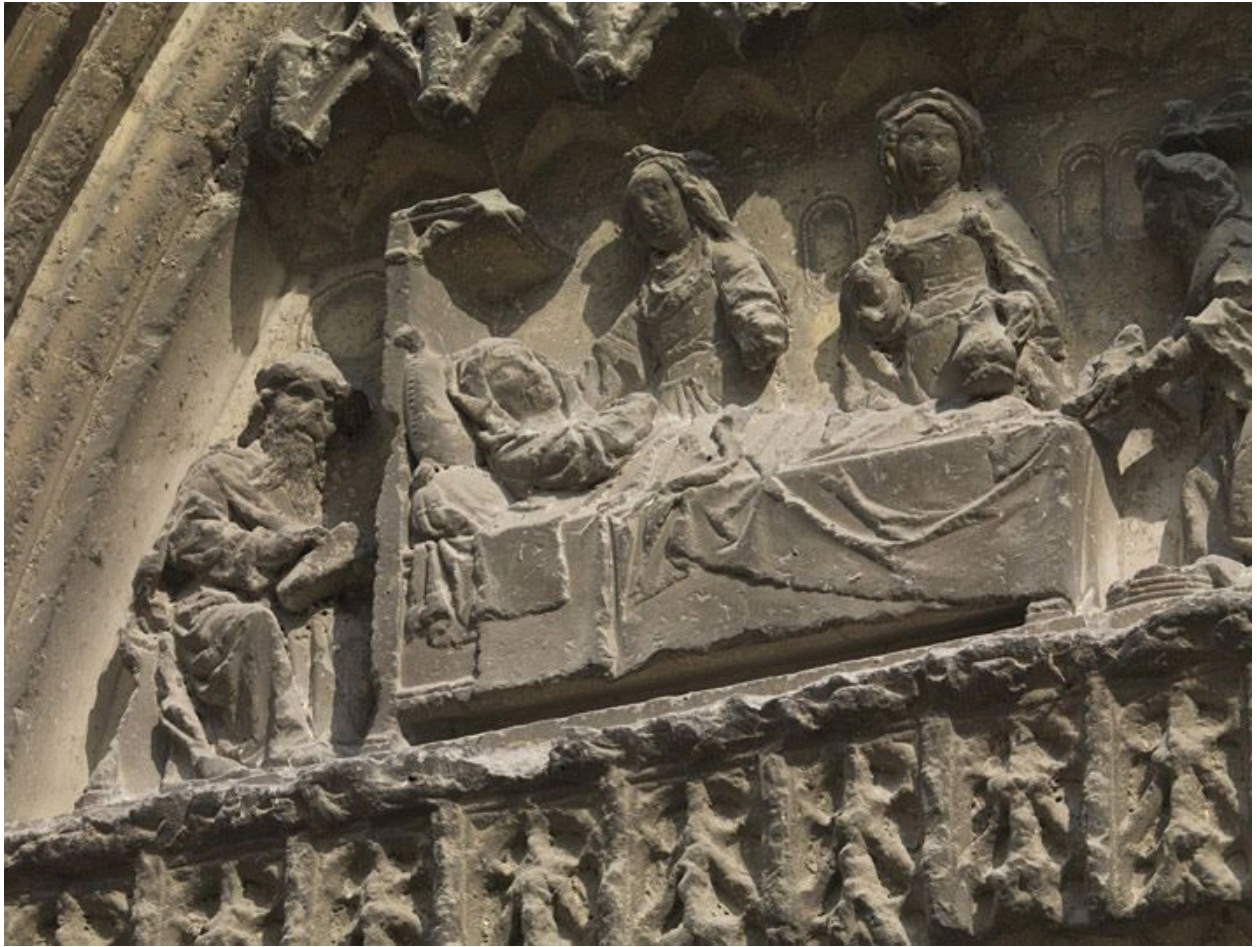
Détail du tympan (partie gauche du registre médian) : la naissance de saint Jean-Baptiste.