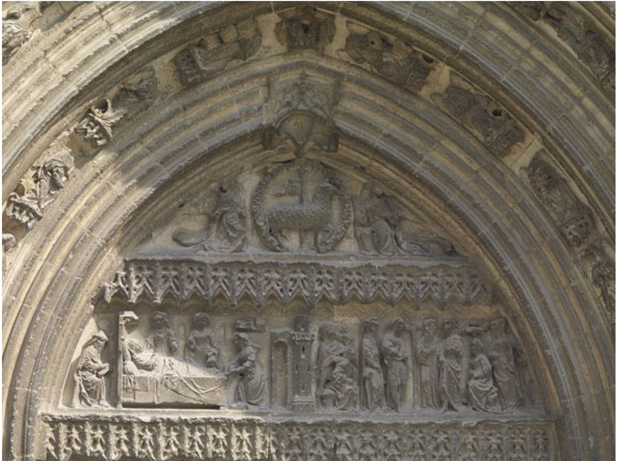
Partie supérieure du tympan et de la première voussure.