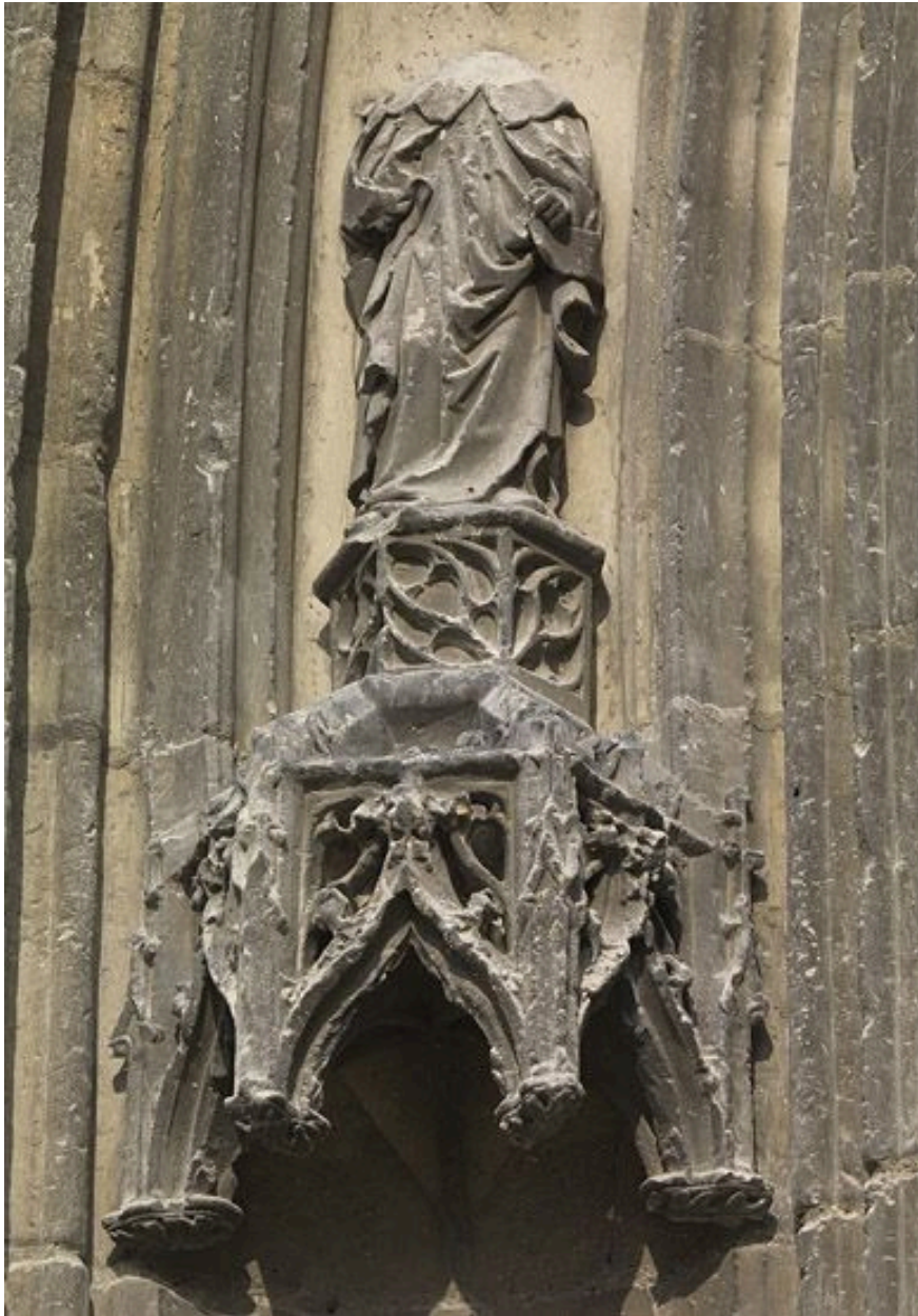
Détail de la voussure extérieure : 1er claveau gauche, saint debout (étêté).