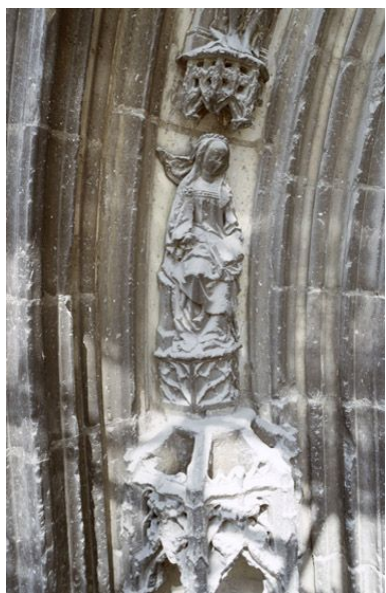
Les sculptures du portail Saint-Jean-Baptiste, vues depuis l'échafaudage dressé pour la restauration de la base de la tour nord (2008) : détail d'une sainte lisant, au départ de la voussure centrale (à gauche du tympan).