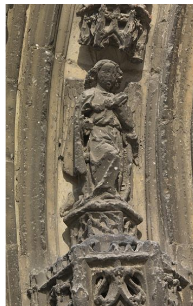
Détail de la voussure intérieure : 1er claveau gauche, ange musicien. IVR11_20097700224NUC4A