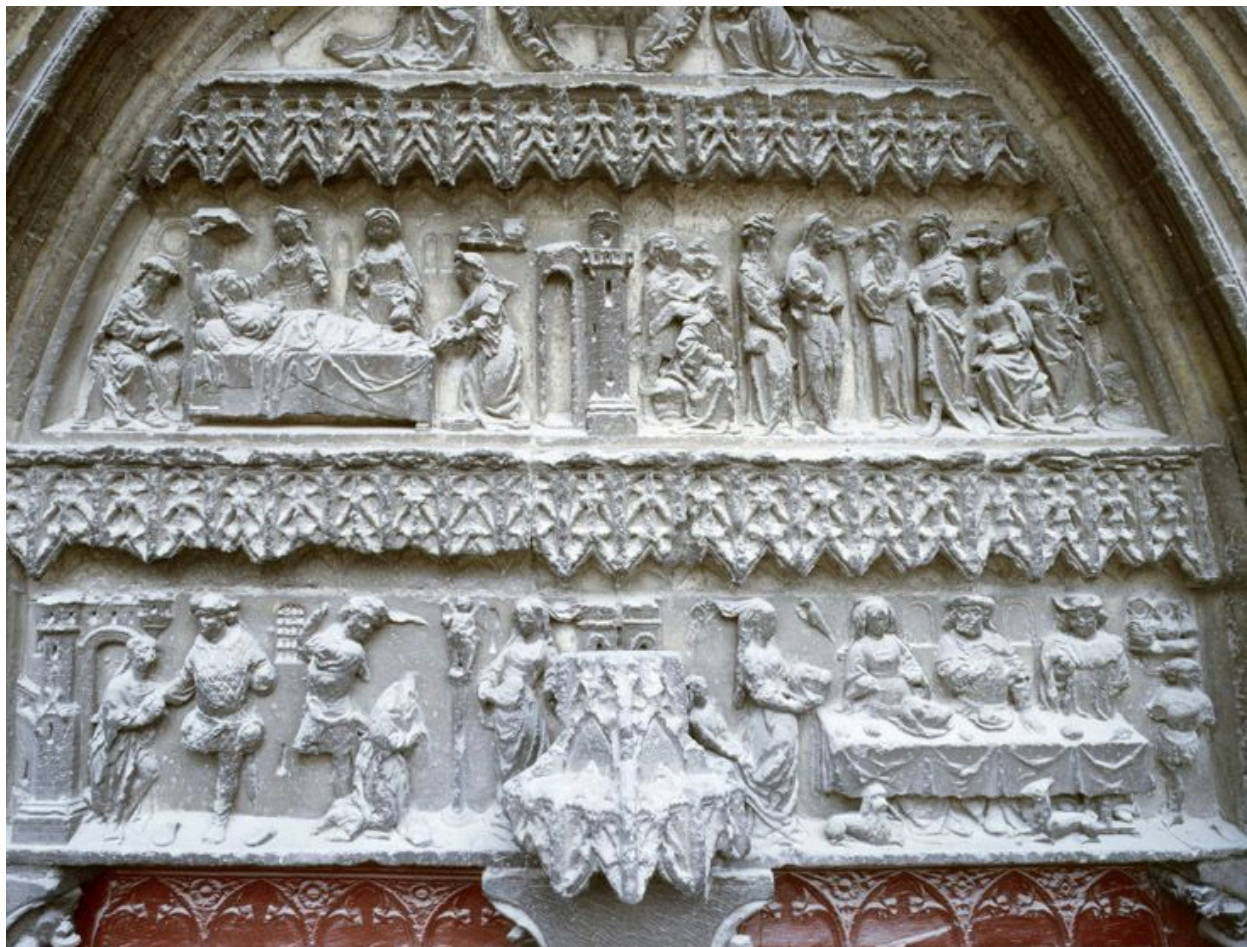
Les sculptures du portail Saint-Jean-Baptiste, vues depuis l'échafaudage dressé pour la restauration de la base de la tour nord (2008) : les registres inférieurs du tympan (scènes de la vie de saint Jean Baptiste).