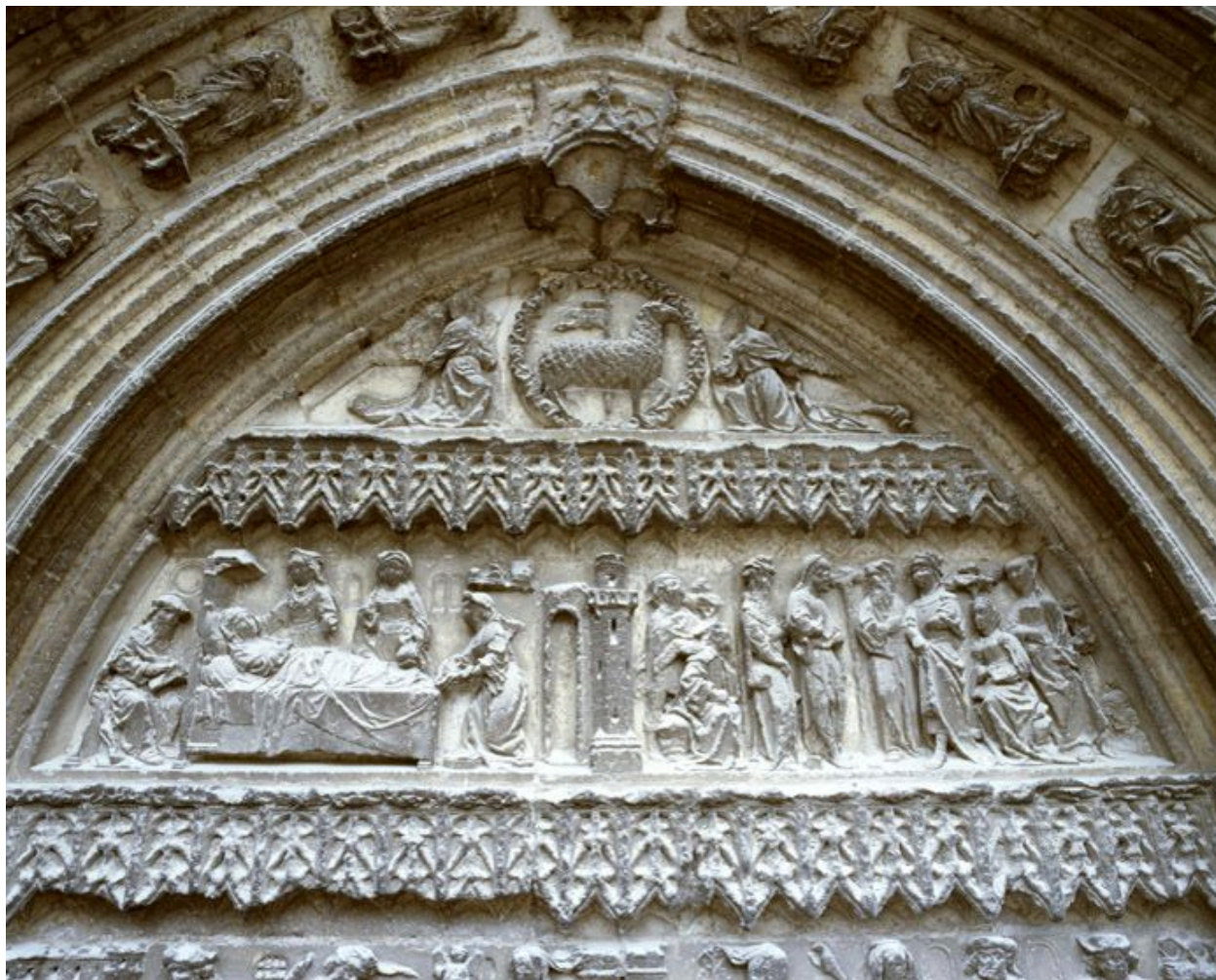
Les sculptures du portail Saint-Jean-Baptiste, vues depuis l'échafaudage dressé pour la restauration de la base de la tour nord (2008) : les registres supérieurs du tympan.