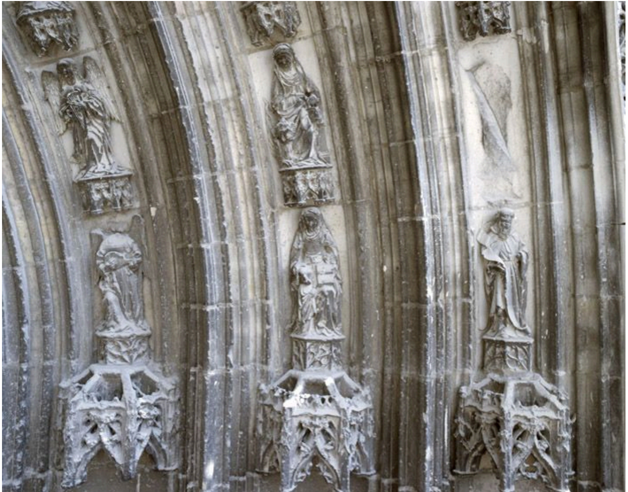
Les sculptures du portail Saint-Jean-Baptiste, vues depuis l'échafaudage dressé pour la restauration de la base de la tour nord (2008) : le départ des voussures, à droite du tympan.