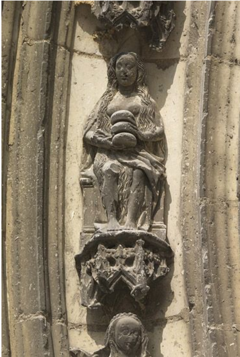
Détail de la voussure médiane : 2e claveau gauche, sainte Marie l'Egyptienne.