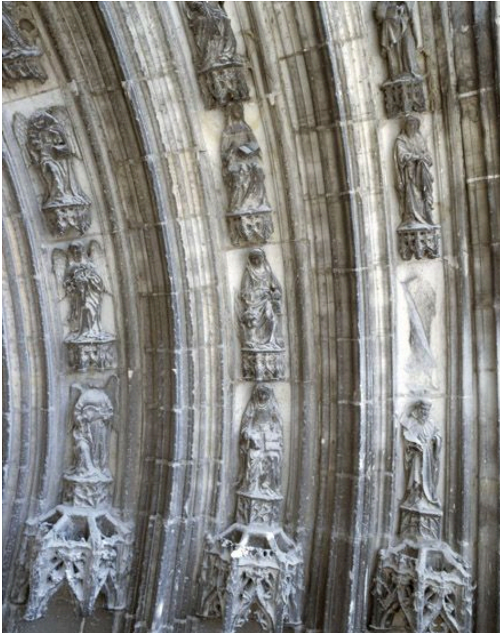
Les sculptures du portail Saint-Jean-Baptiste, vues depuis l'échafaudage dressé pour la restauration de la base de la tour nord (2008) : les voussures, à droite du tympan.