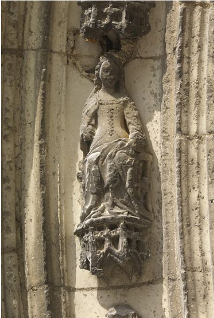
Détail de la voussure médiane : 4e claveau gauche, sainte Catherine d'Alexandrie assise, avec sa roue.