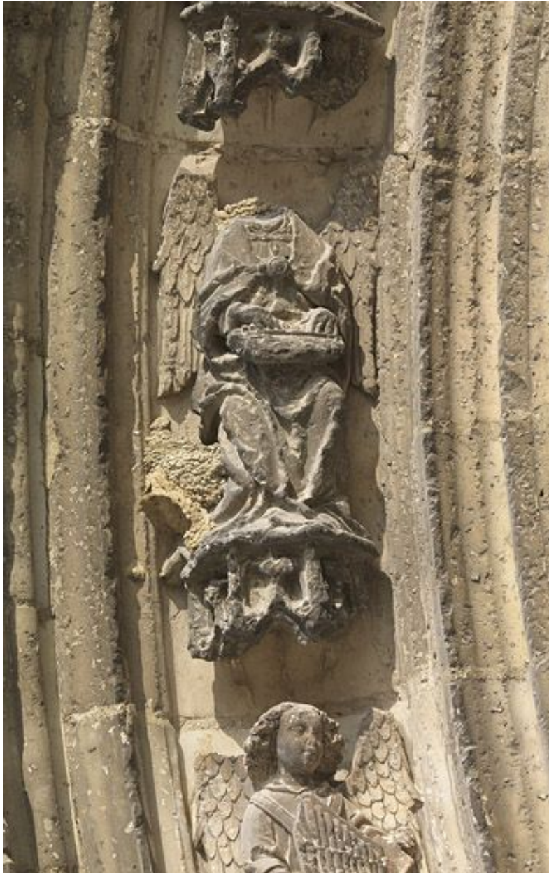
Détail de la voussure intérieure : 3e claveau gauche, ange musicien (étêté).