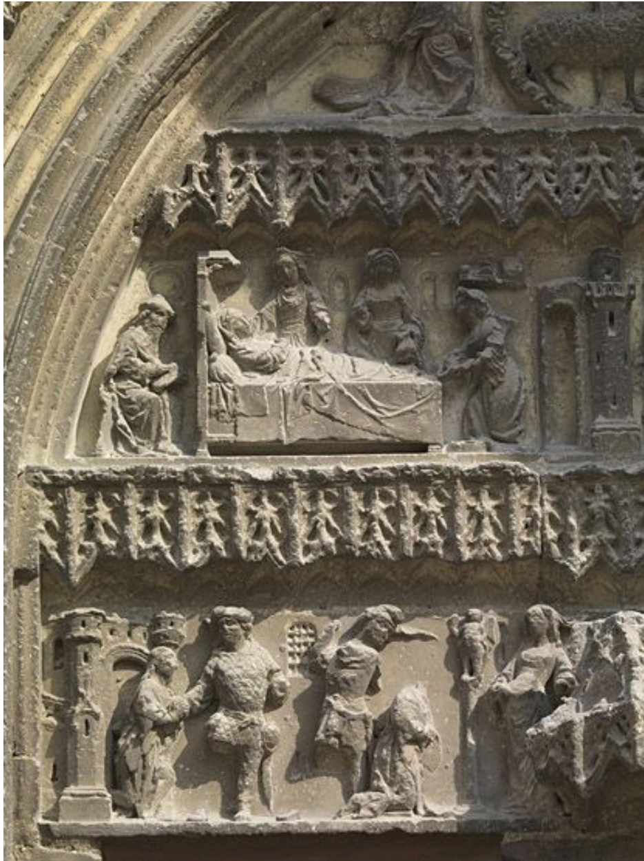
Partie gauche du tympan.