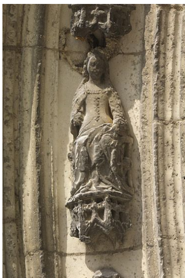
Détail de la voussure médiane : 4e claveau gauche, sainte Catherine d'Alexandrie assise, avec sa roue.