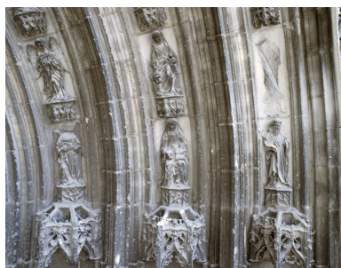
Les sculptures du portail Saint-Jean-Baptiste, vues depuis l'échafaudage dressé pour la restauration de la base de la tour nord (2008) : le départ des voussures, à droite du tympan.