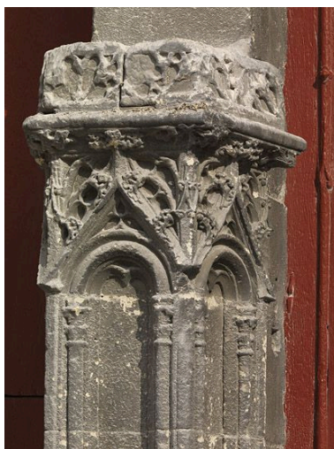
Détail du trumeau : socle de la statue (disparue).