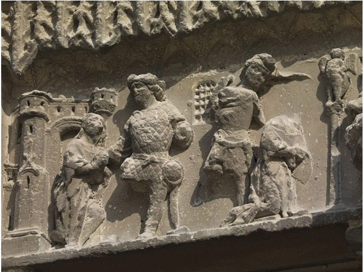
Détail du tympan (partie gauche du linteau) : saint Jean-Baptiste est emmené par un soldat et décapité.