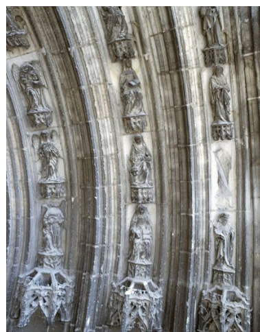
Les sculptures du portail Saint-Jean-Baptiste, vues depuis l'échafaudage dressé pour la restauration de la base de la tour nord (2008) : les voussures, à droite du tympan.