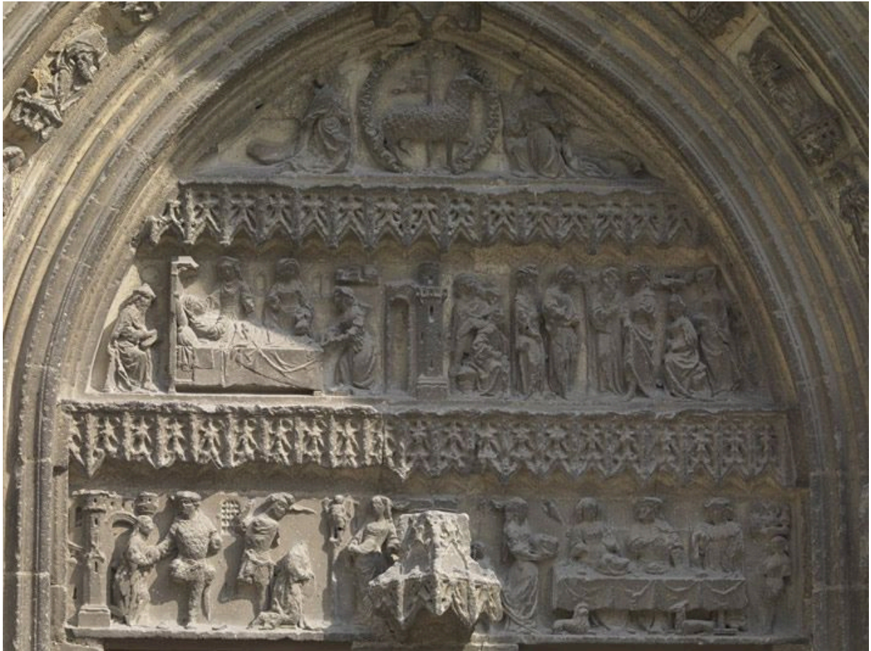
Vue d'ensemble du tympan.