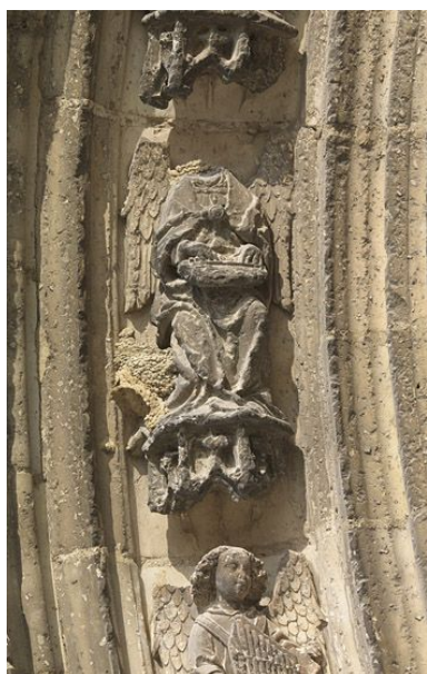
Détail de la voussure intérieure : 3e claveau gauche, ange musicien (étêté). IVR11_20097700223NUC4A