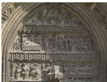
Vue d'ensemble du tympan.