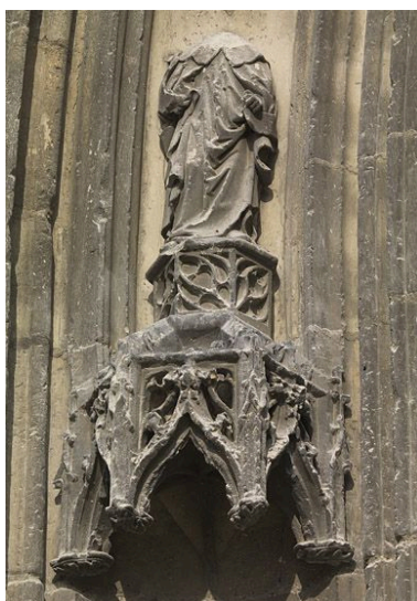
Détail de la voussure extérieure : 1er claveau gauche, saint debout (étêté).