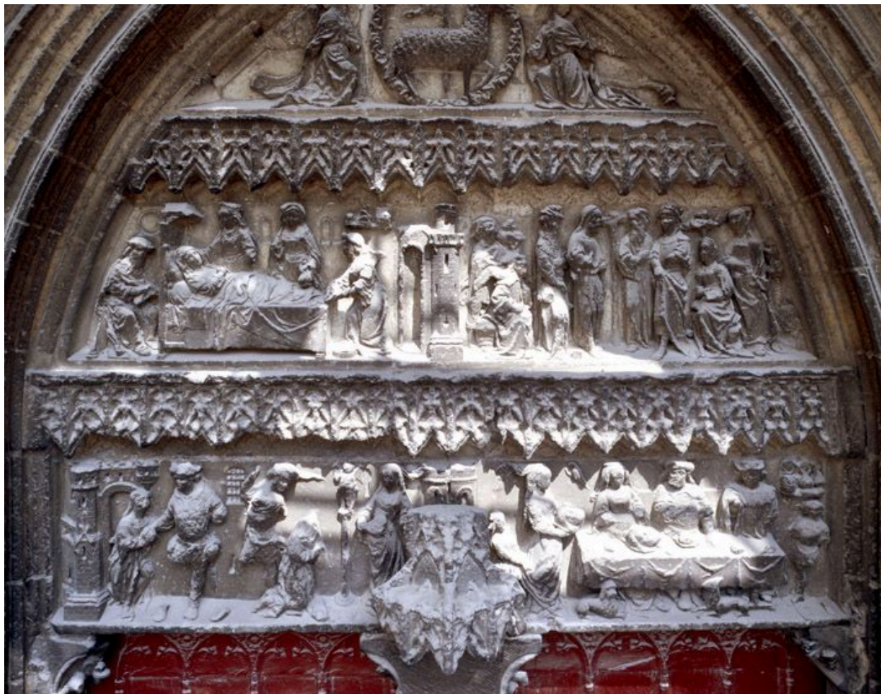
Les sculptures du portail Saint-Jean-Baptiste, vues depuis l'échafaudage dressé pour la restauration de la base de la tour nord (2008) : le tympan.