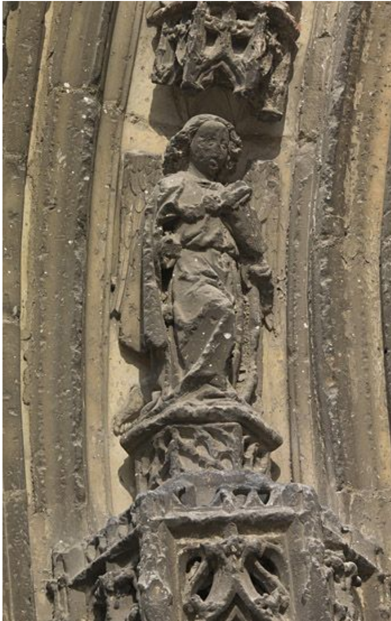
Détail de la voussure intérieure : 1er claveau gauche, ange musicien.