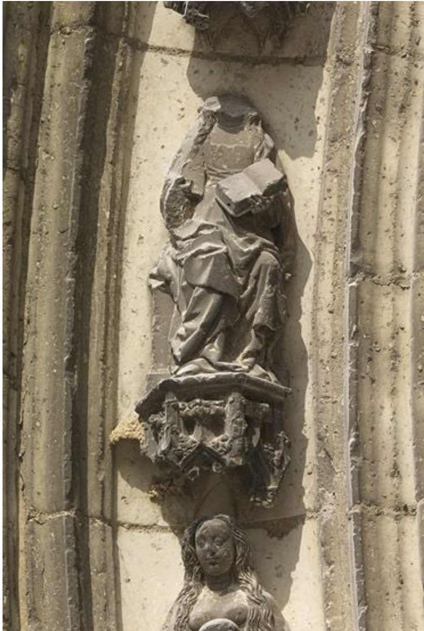
Détail de la voussure médiane : 3e claveau gauche, sainte lisant (étêtée).