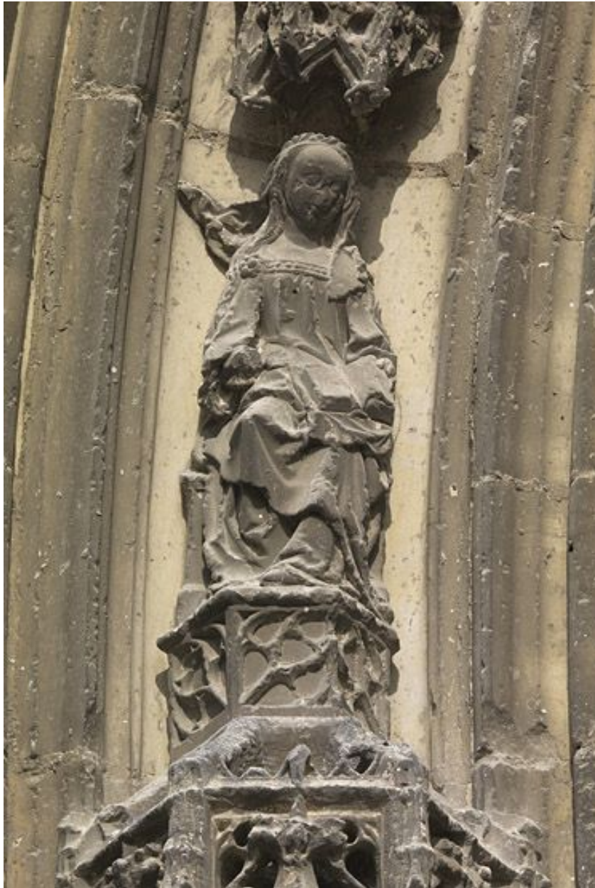
Détail de la voissure médiane : 1er claveau gauche, sainte assise lisant le livre ouvert sur ses genoux.