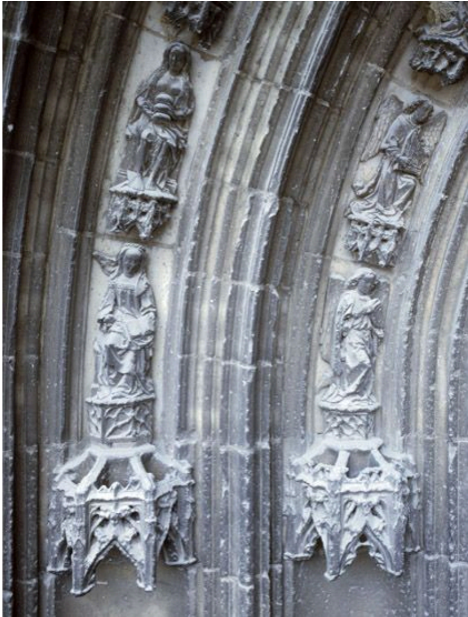
Les sculptures du portail Saint-Jean-Baptiste, vues depuis l'échafaudage dressé pour la restauration de la base de la tour nord (2008) : détail des voussures (à gauche du portail).