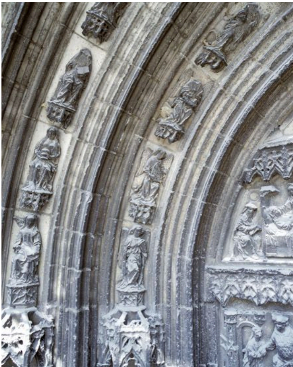
Les sculptures du portail Saint-Jean-Baptiste, vues depuis l'échafaudage dressé pour la restauration de la base de la tour nord (2008) : les voissures et l'extrémité gauche du tympan.