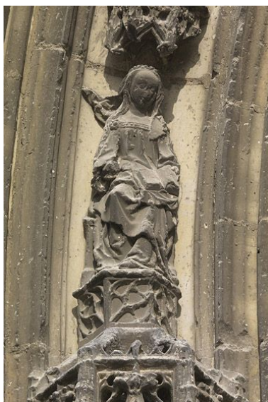
Détail de la voussure médiane : 1er claveau gauche, sainte assise lisant le livre ouvert sur ses genoux.