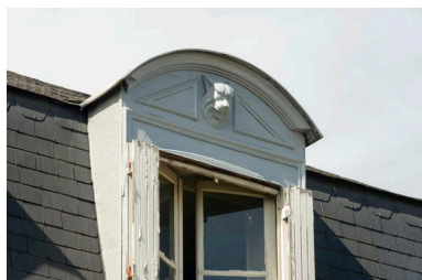
Détail du décor des lucarnes : tête de loup schématisée. IVR11_20177800364NUC4A