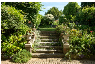
Escalier conduisant au jardin de la maison. IVR11_20177800365NUC4A