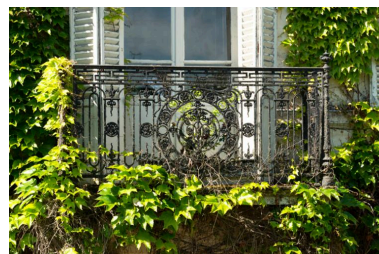
Le garde-corps en fonte du balcon central du premier étage.