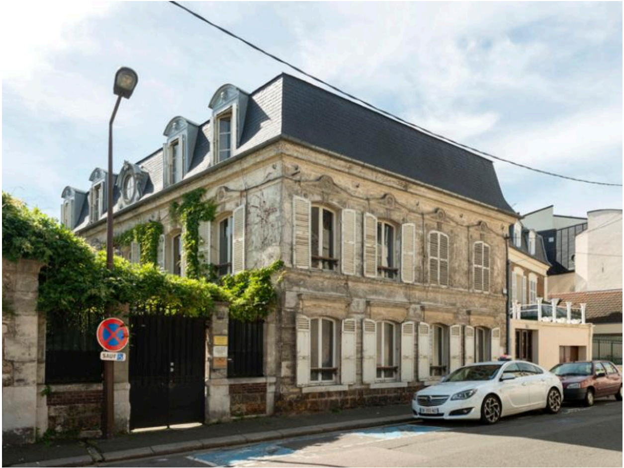
La façade sur rue.

IVR11_20177800361NUC4A Auteur de l'illustration : Philippe Ayrault Date de prise de vue : 2016 (c) Philippe Ayrault, Région Ile-de-France communication libre, reproduction soumise à autorisation