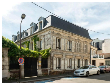
La façade sur rue.