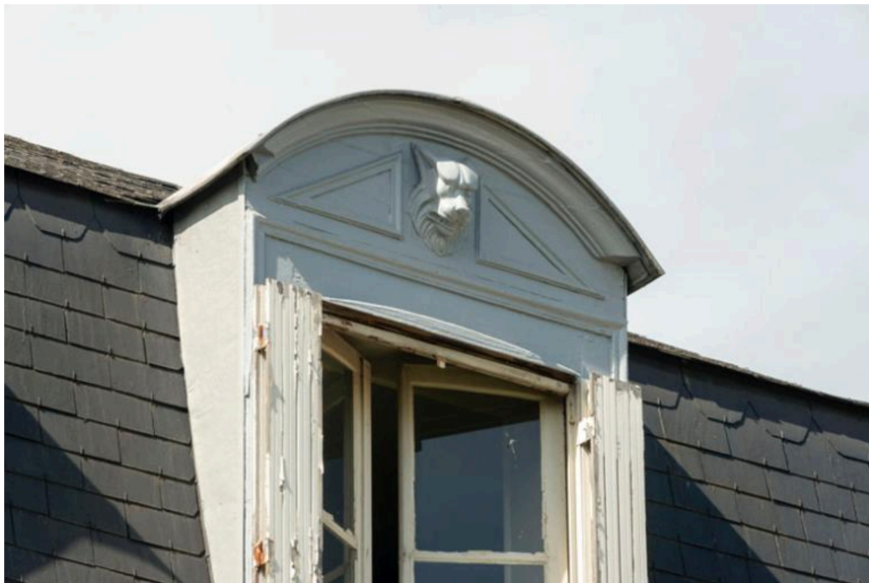
Détail du décor des lucarnes : tête de loup schématisée.