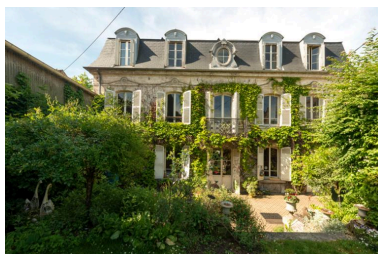
La façade sur jardin est caractéristique des maisons de notable : ordonnancement, mise en valeur de la travée centrale. IVR11_20177800362NUC4A