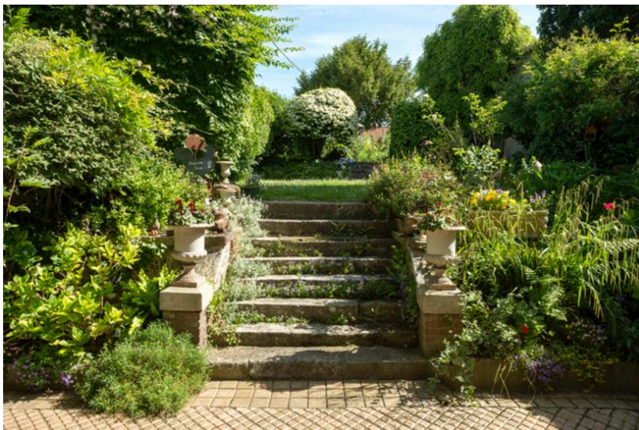
Escalier conduisant au jardin de la maison.