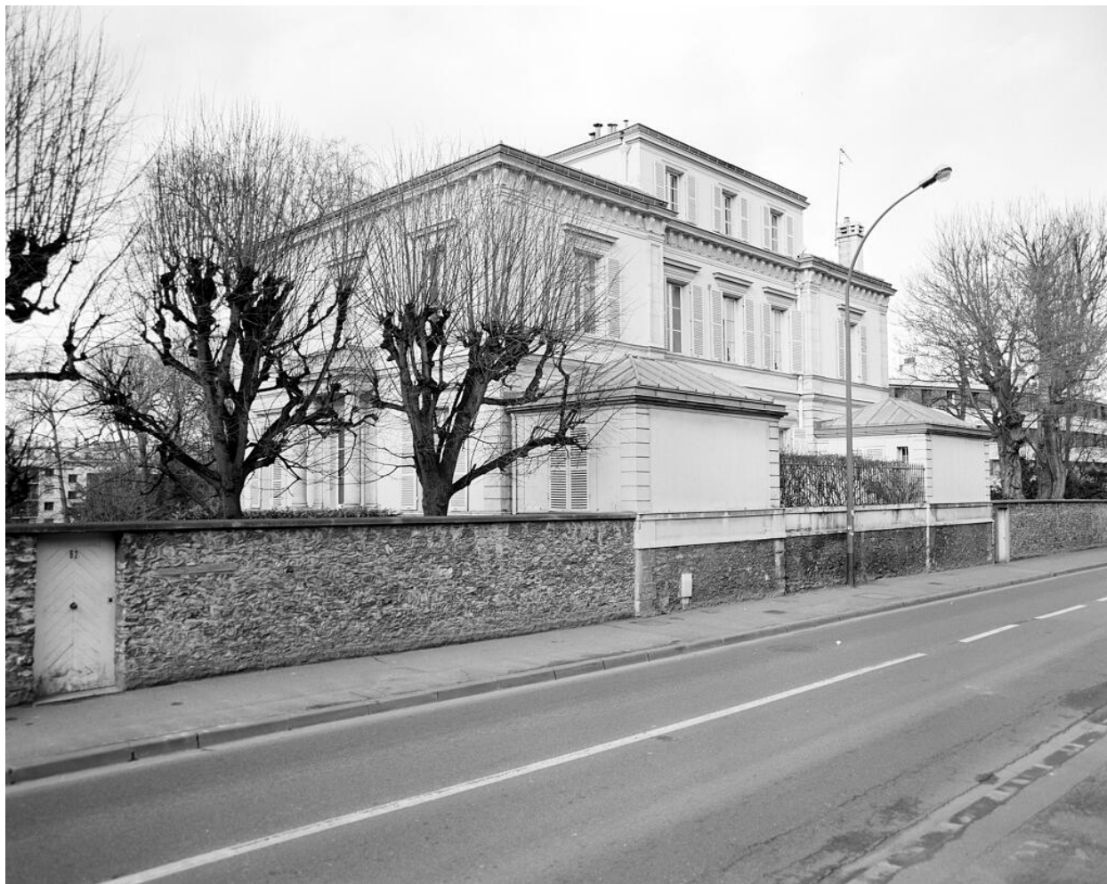
Façade sur la route des Gardes.