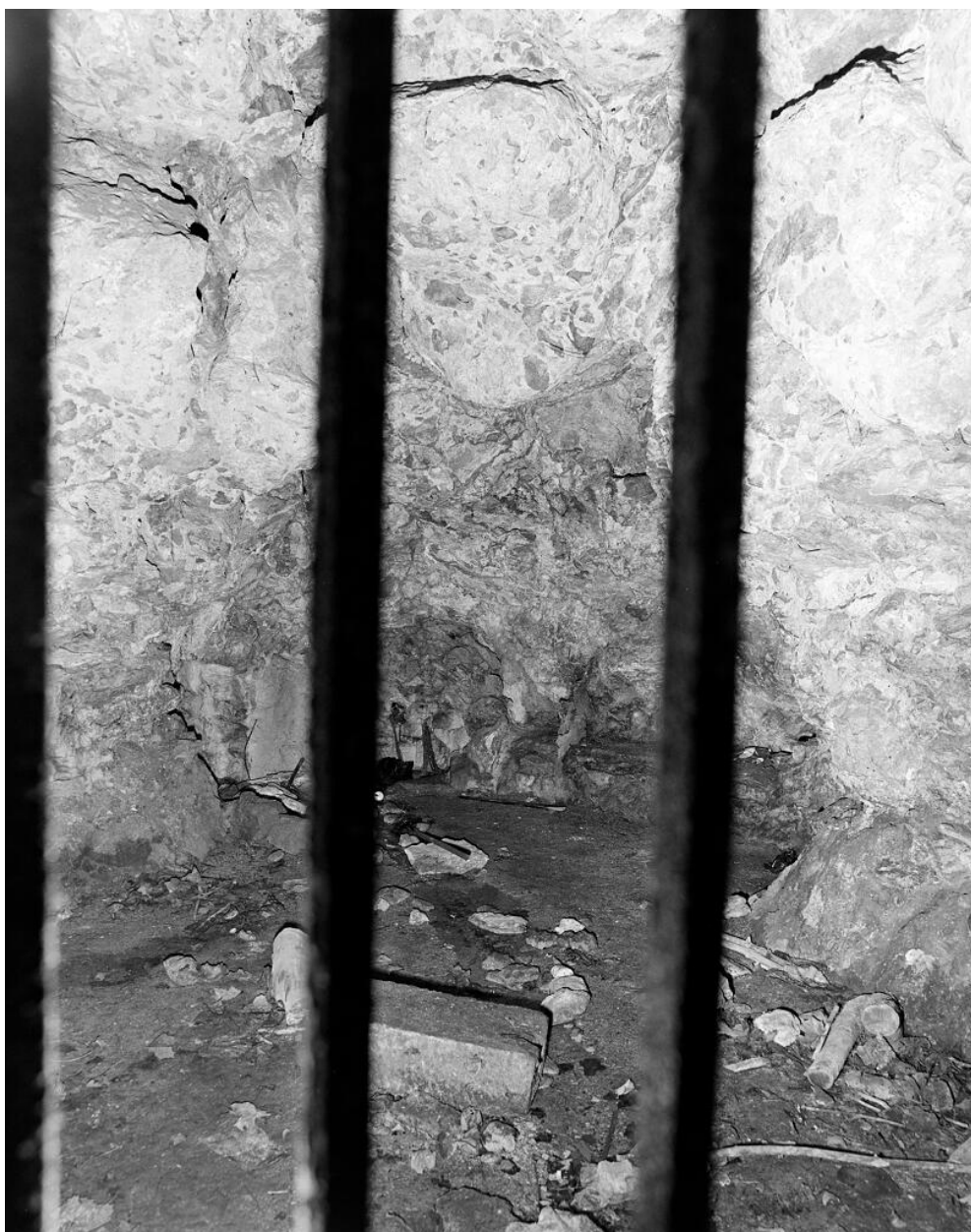
L'ancienne grotte du parc.