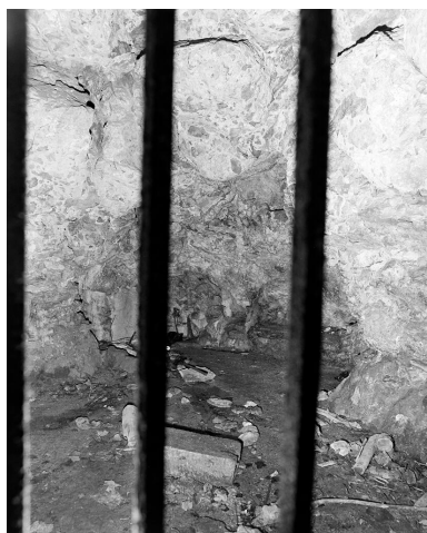
L'ancienne grotte du parc.

IVR11_19959200330X