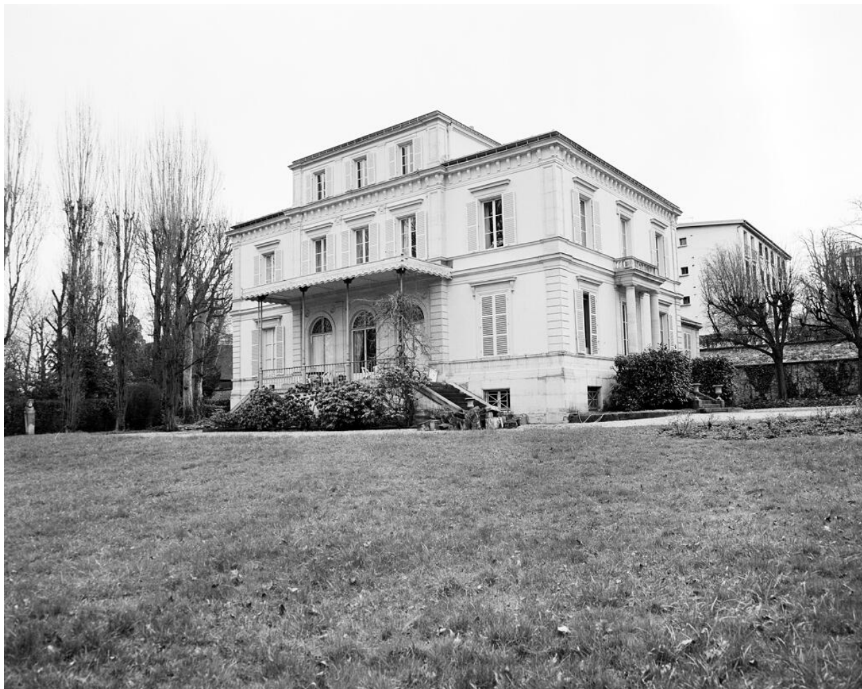
Façade sur le parc.