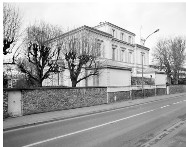
Façade sur la route des Gardes.

Phot. Ayrault Philippe IVR11_19949200310X