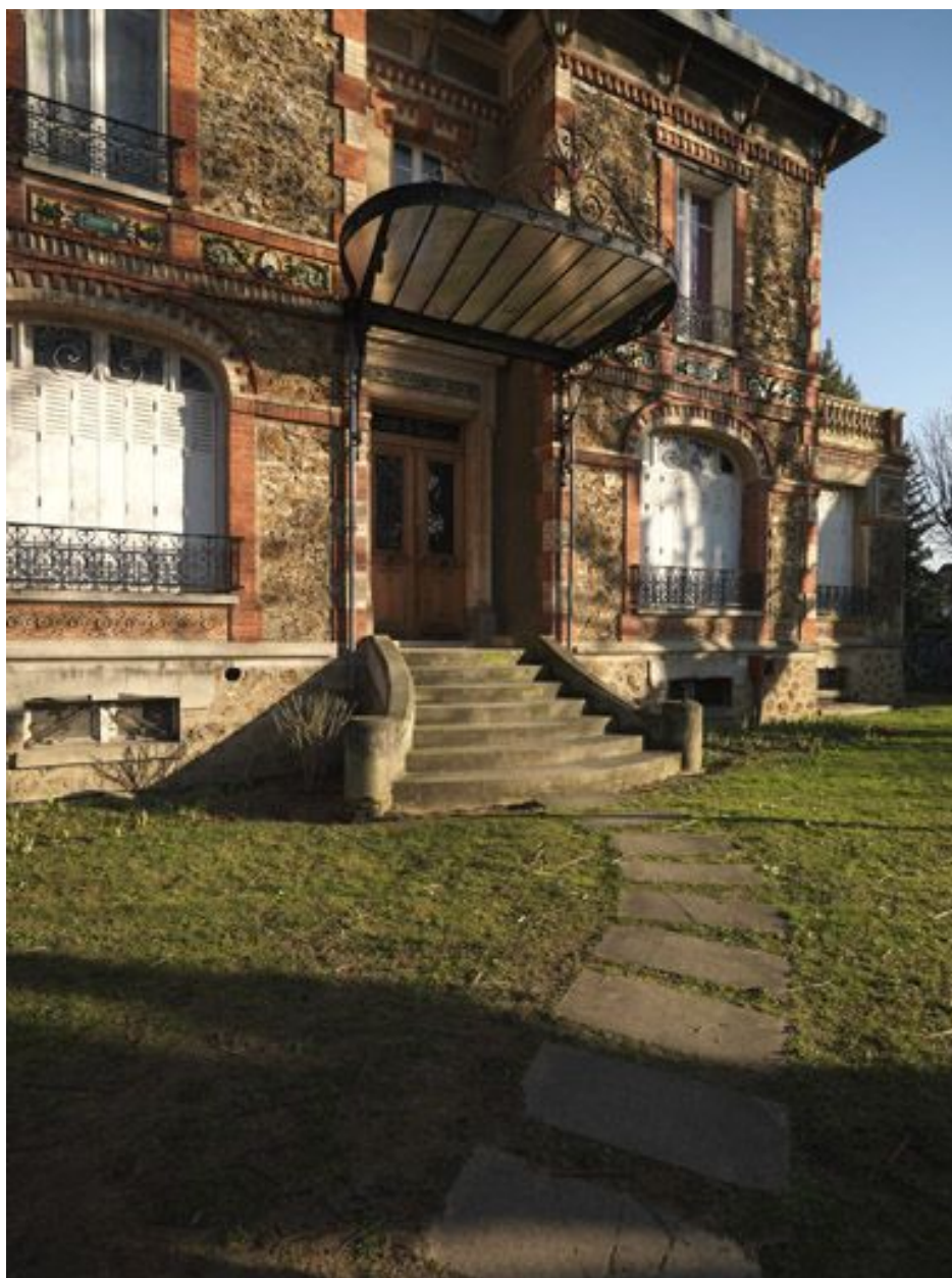
Vue de la partie centrale de la façade principale.