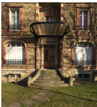
Détail du perron surmonté d'une marquise. IVR11_20089100208NUC4A