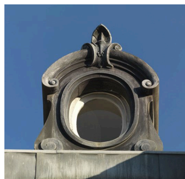
Lucarne ovale couronnant la travée centrale.