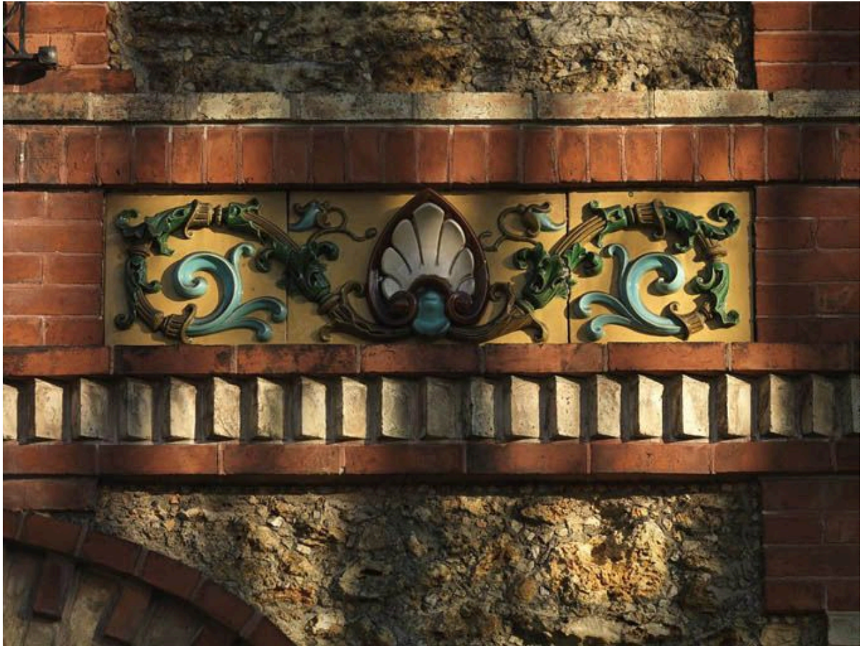
Détail de la frise de céramique polychrome formant bandeau entre le rez-de-chaussée et le premier étage.