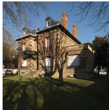
La maison vue de trois quarts (à partir de la terrasse sud). IVR11_20089100209NUC4A