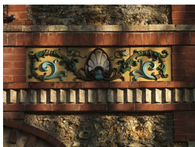
Détail de la frise de céramique polychrome formant bandeau entre le rez-de-chaussée et le premier étage.