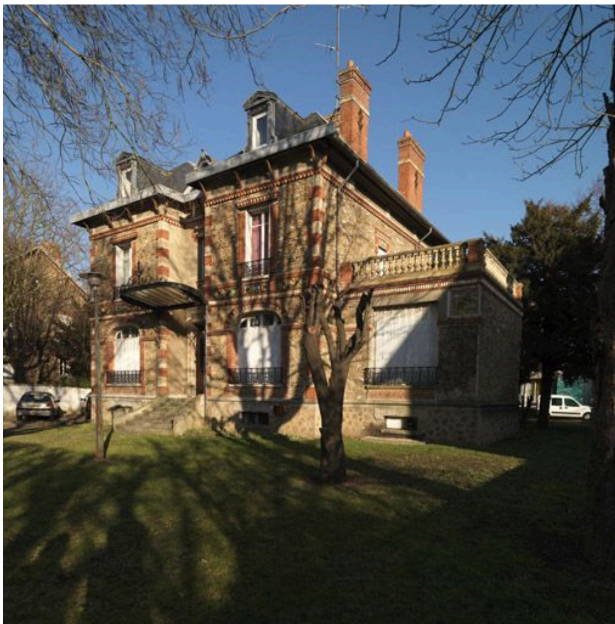
La maison vue de trois quarts (à partir de la terrasse sud).