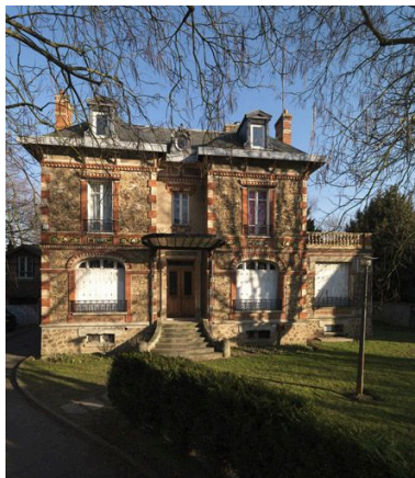
Vue d'ensemble. IVR11_20089100206NUC4A