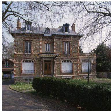
Vue d'ensemble. IVR11_20079101783XA