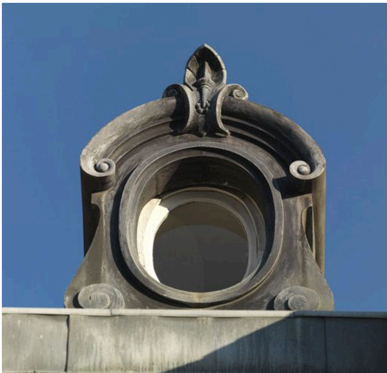
Lucarne ovale couronnant la travée centrale.