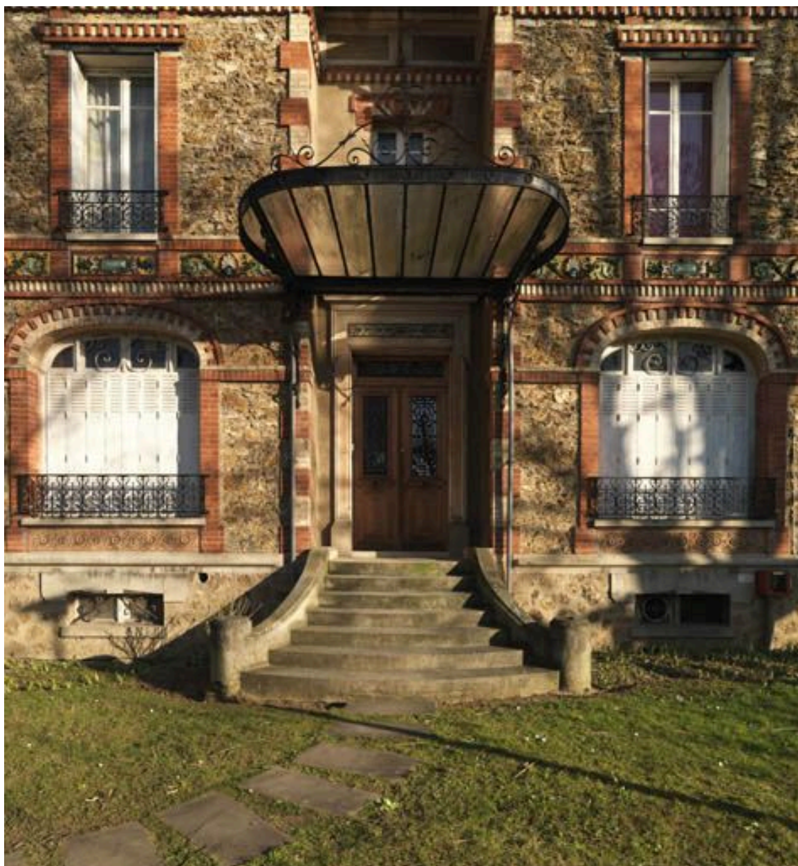
Détail du perron surmonté d'une marquise.