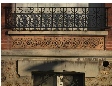
Frise en terre cuite sous les fenêtres du rez-de-chaussée.