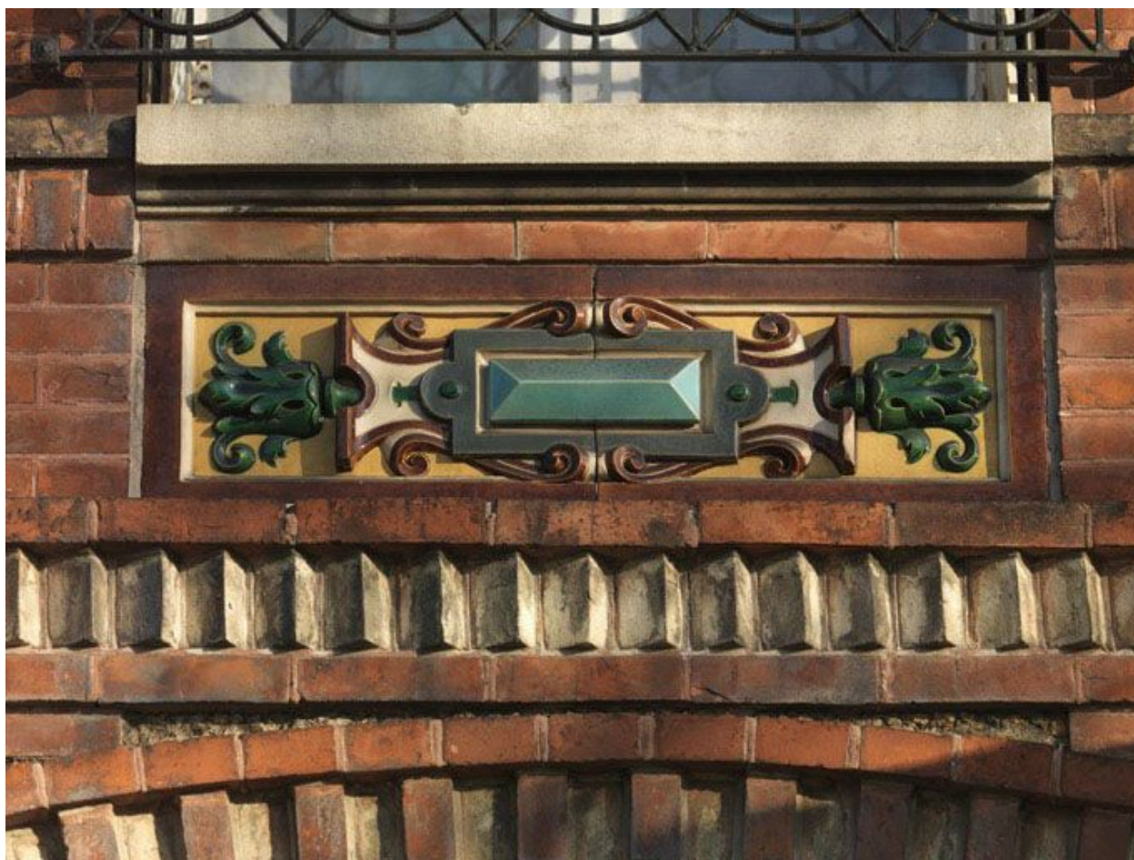
Bas-relief en cartouche composé de carreaux de faïence émaillée, surmontant les fenêtres du rez-de-chaussée.