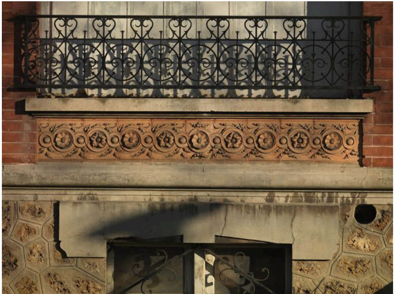
Frise en terre cuite sous les fenêtres du rez-de-chaussée.

IVR11_20089100212NUC4A Auteur de l'illustration : Philippe Ayrault Date de prise de vue : 2008 (c) Philippe Ayrault, Région Ile-de-France communication libre, reproduction soumise à autorisation