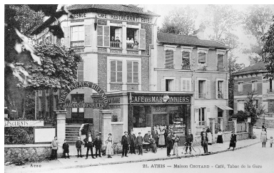
Le café-tabac de la place de la gare. IVR11_20019100463XB