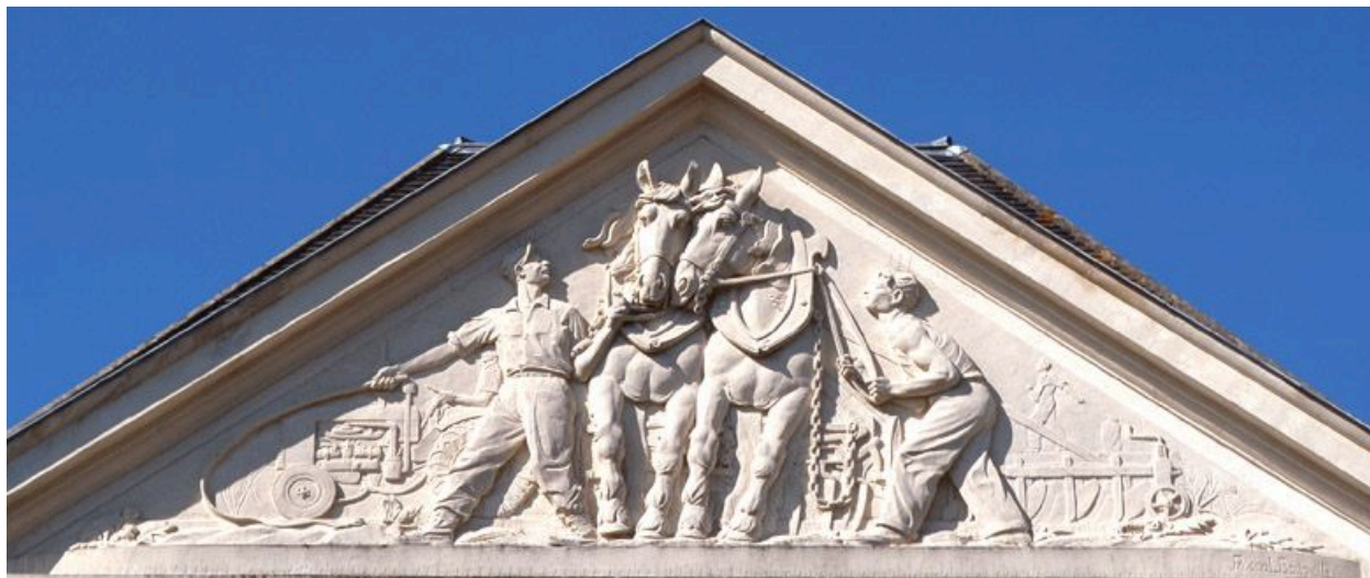
Bas-relief de Boueille, sur la façade orientale du bâtiment des années 1950.