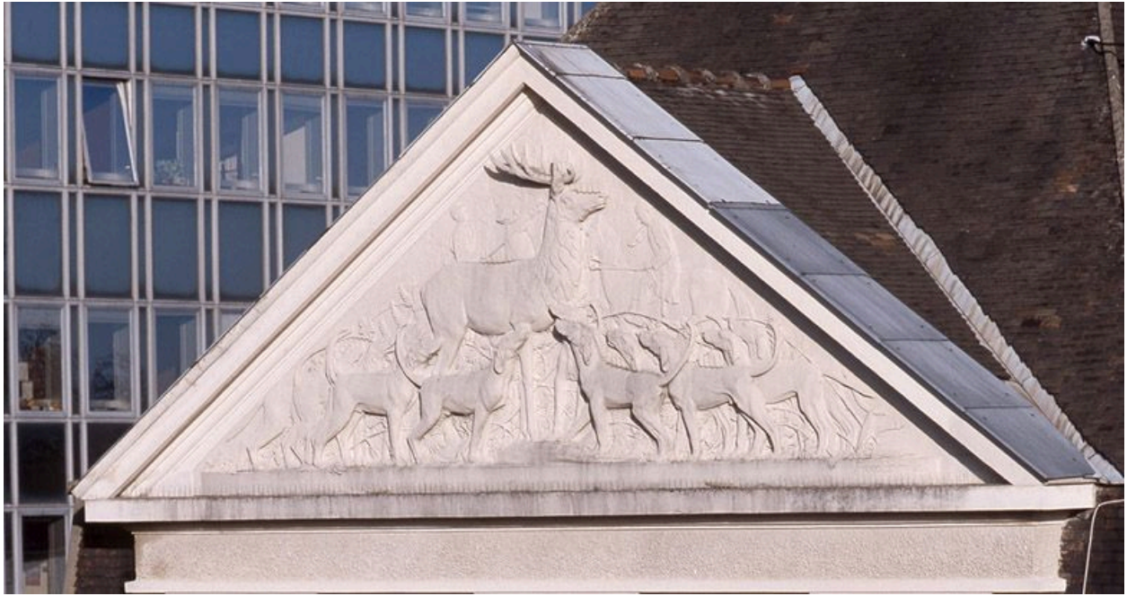
Bas-relief de Pascal Boureille (1951), sur la façade sud du bâtiment des années 1950.