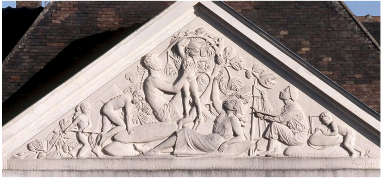
Bas-relief de Pascal Bouraille (1951), sur la façade sud du bâtiment des années 1950.