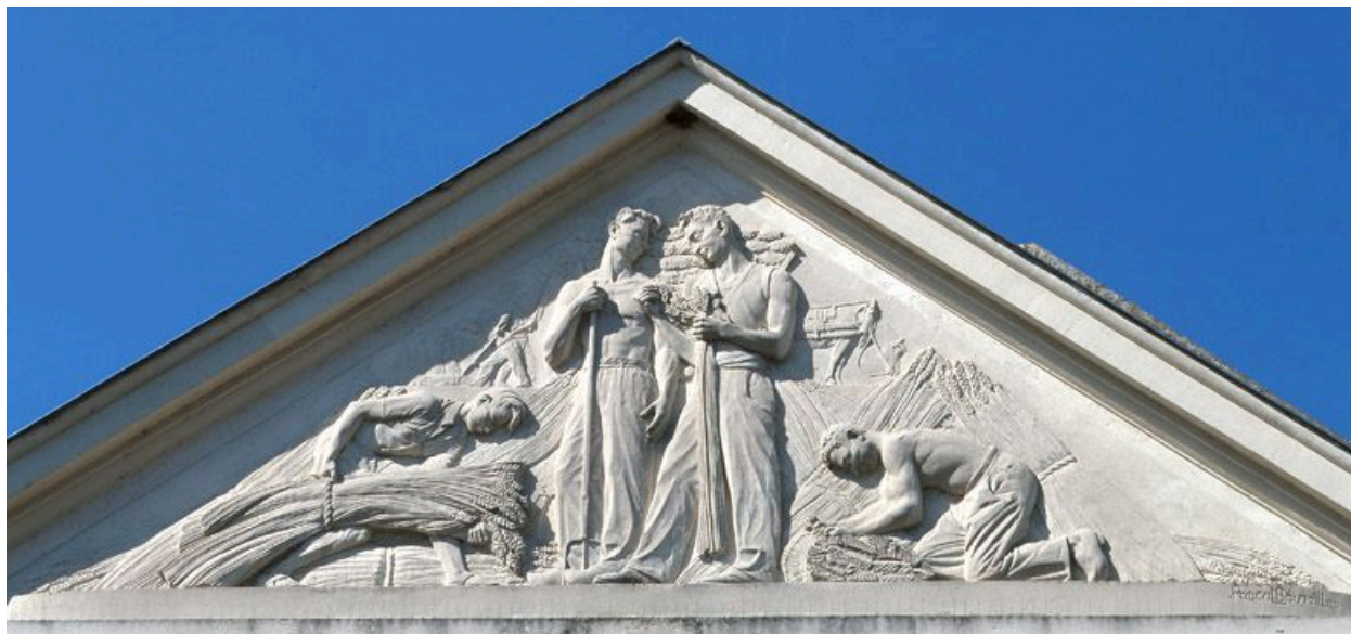
Bas-relief de Boueille, sur la façade orientale du bâtiment des années 1950.