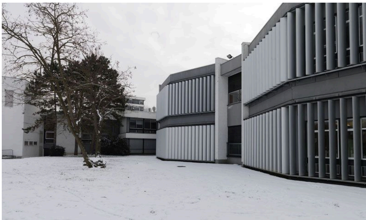
Vue des façades donnant sur le parc de la Préfecture.