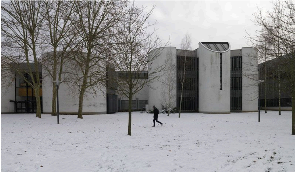
Vue des façades donnant sur le parc de la Préfecture.