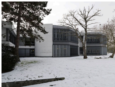
Vue des façades donnant sur le parc de la Préfecture.