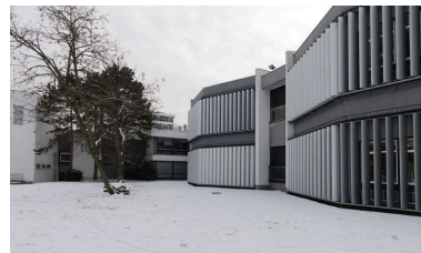
Vue des façades donnant sur le parc de la Préfecture. IVR11_20129500042NUC4A