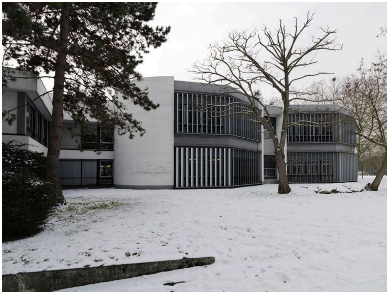
Vue des façades donnant sur le parc de la Préfecture.