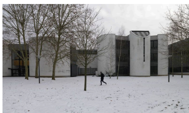
Vue des façades donnant sur le parc de la Préfecture.