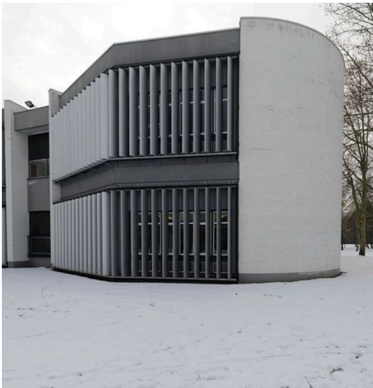
Vue des façades donnant sur le parc de la Préfecture.