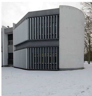
Vue des façades donnant sur le parc de la Préfecture. IVR11_20129500043NUC4A