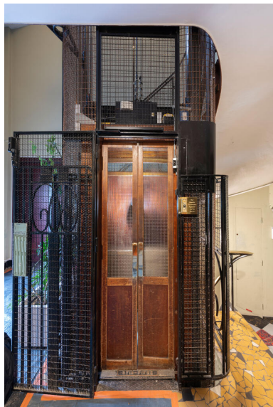
Immeuble, cabine d'ascenseur IVR11_20249200984NUC4A