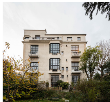
Immeuble, façade sur jardin IVR11_20249200980NUC4A