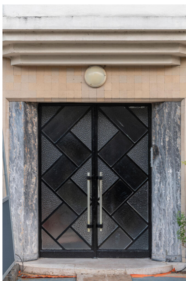
Immeuble, porte d'entrée en verre martelé IVR11_20249200981NUC4A