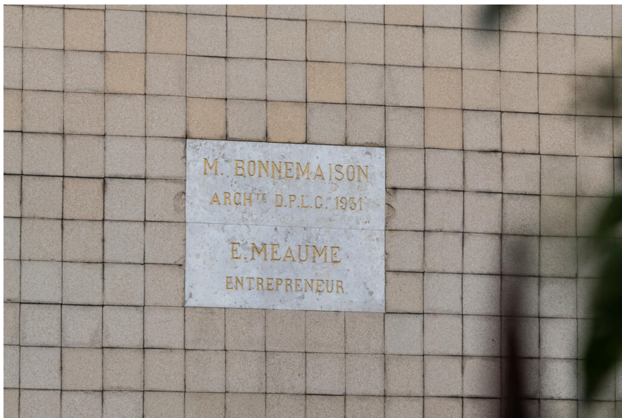
Immeuble, plaque de l'architecte