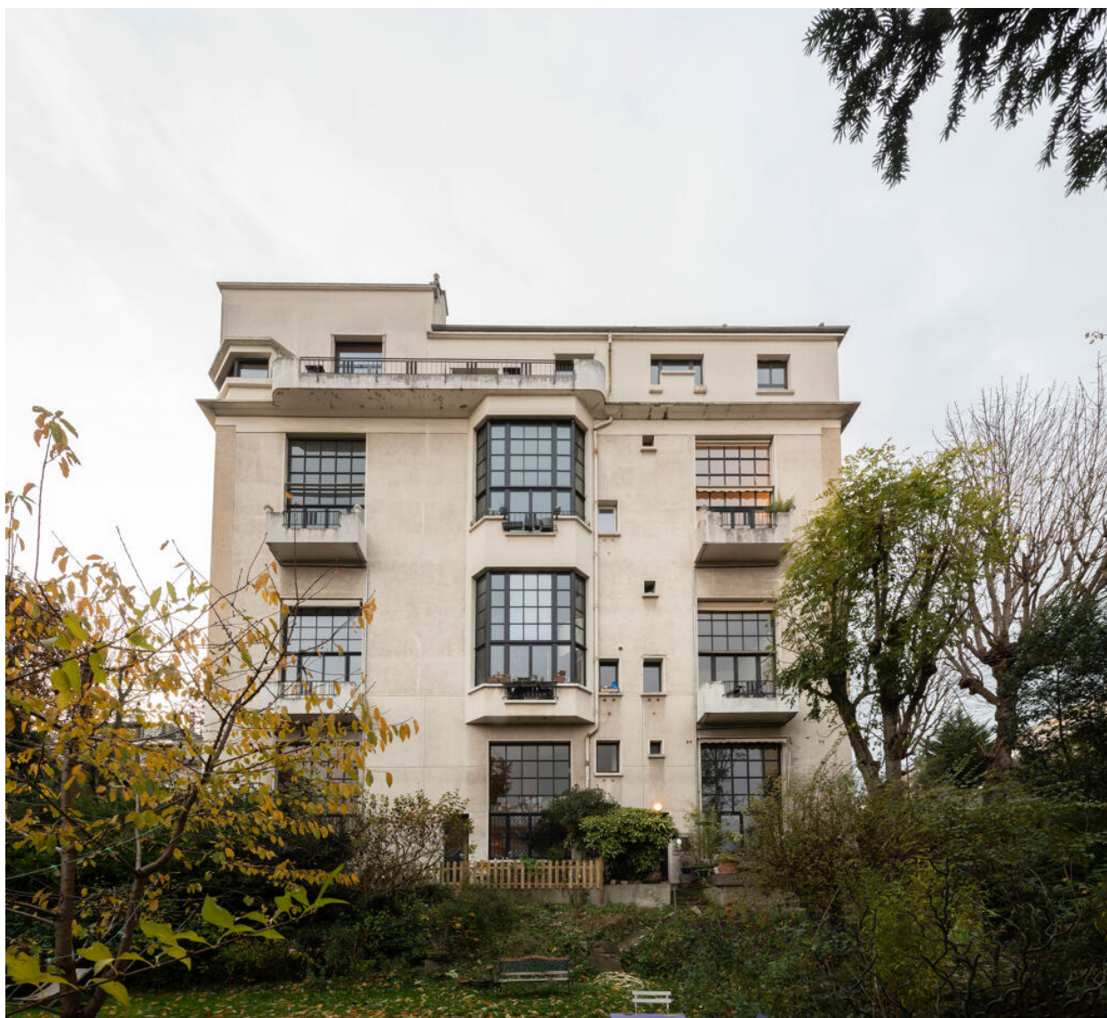
Immeuble, façade sur jardin