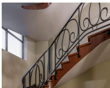
Immeuble, escalier IVR11_20249200986NUC4A