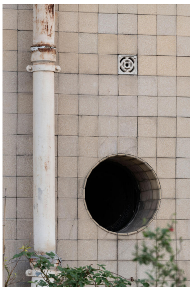
Immeuble, oculus de la façade principale IVR11_20249200982NUC4A