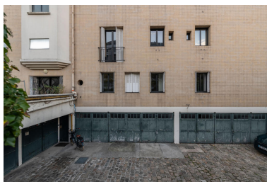
Immeuble, cour anglaise donnant accès aux garages IVR11_20249200979NUC4A