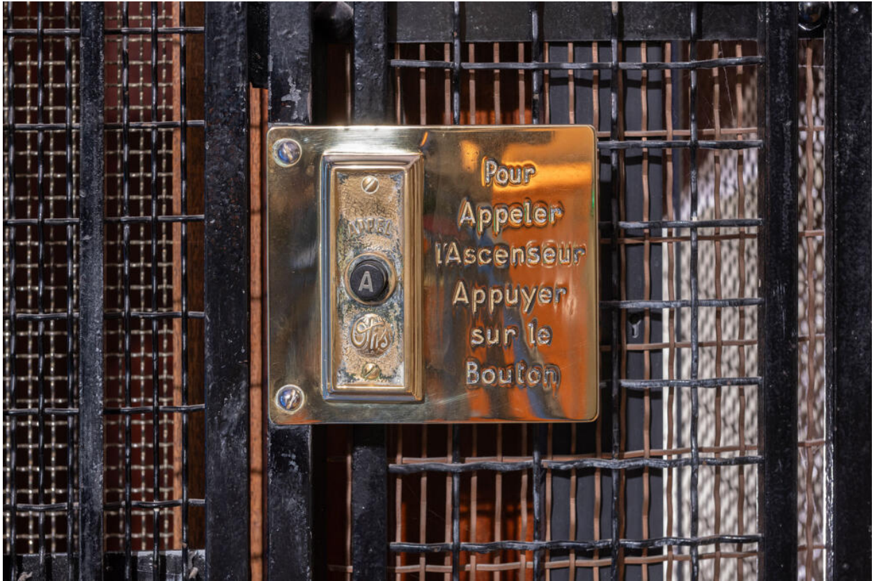
Immeuble, détail de l'ascenseur