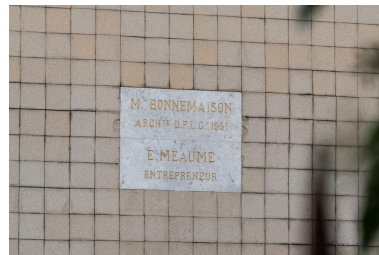
Immeuble, plaque de l'architecte IVR11_20249200983NUC4A