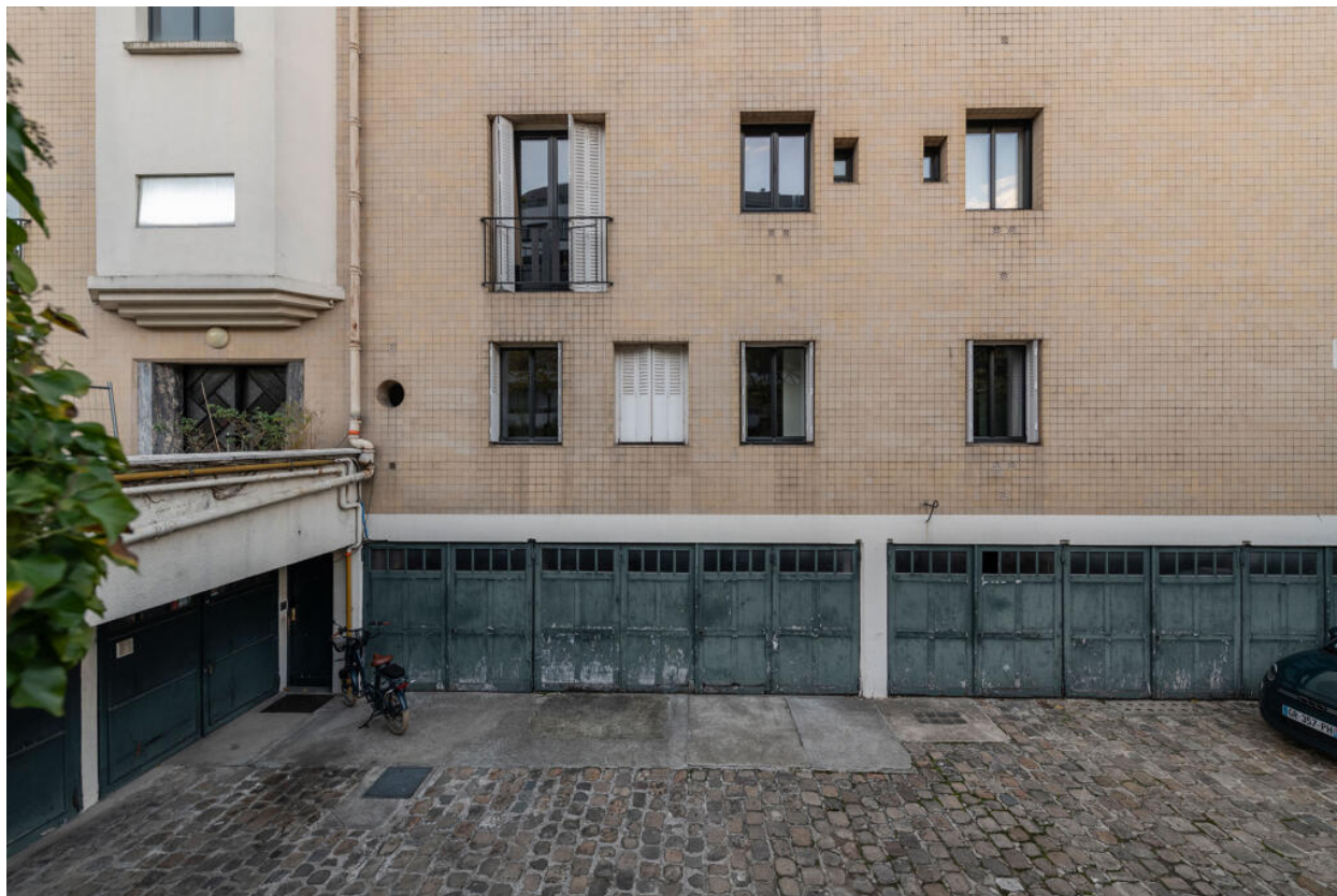
Immeuble, cour anglaise donnant accès aux garages