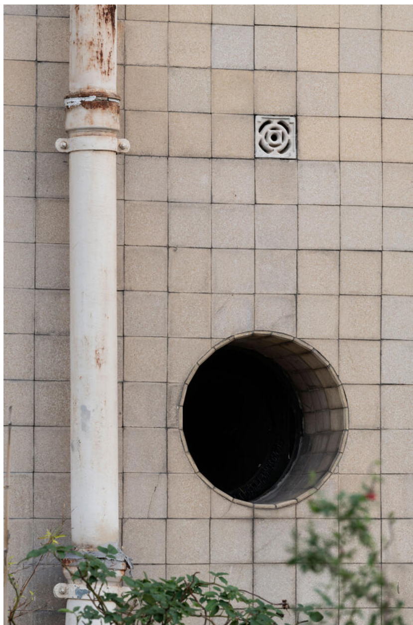
Immeuble, oculus de la façade principale