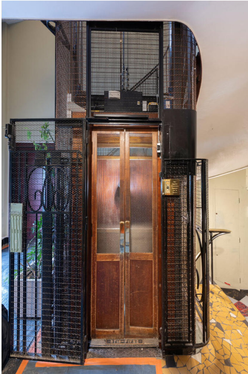
Immeuble, cabine d'ascenseur