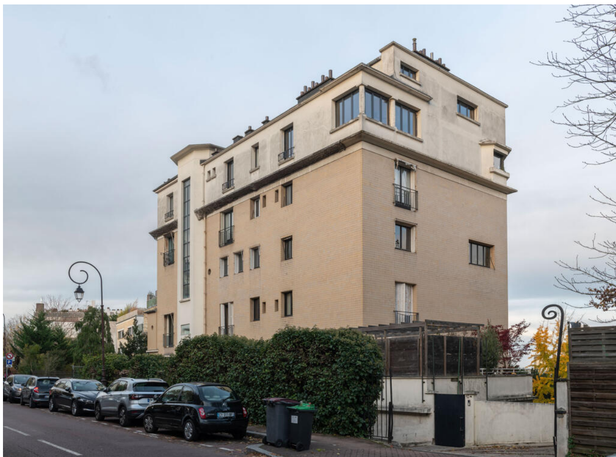
Immeuble, vue sud-ouest. Architecte : Maurice Bonnemaïson.