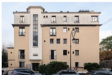
Immeuble, vue de la façade sur rue IVR11_20249200977NUC4A