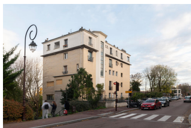
Immeuble, vue depuis le nord-ouest IVR11_20249200978NUC4A