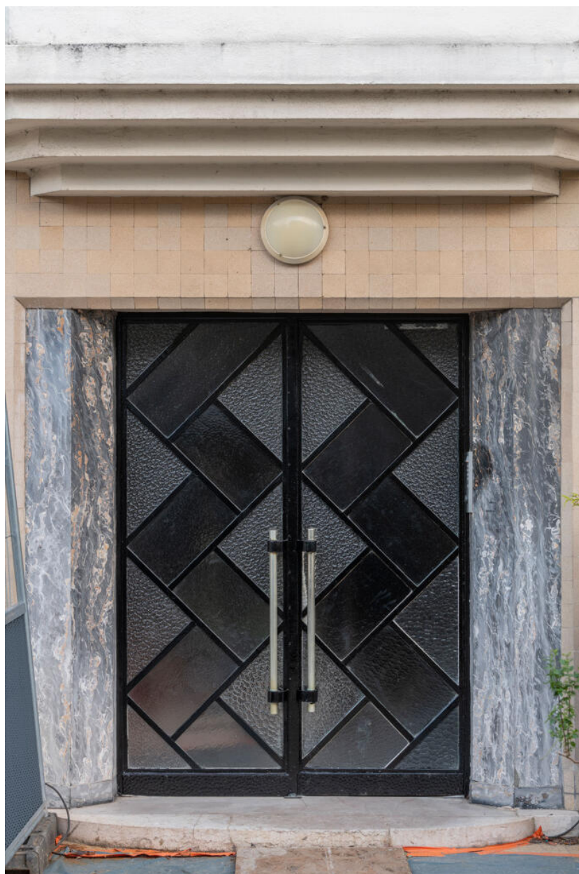
Immeuble, porte d'entrée en verre martelé