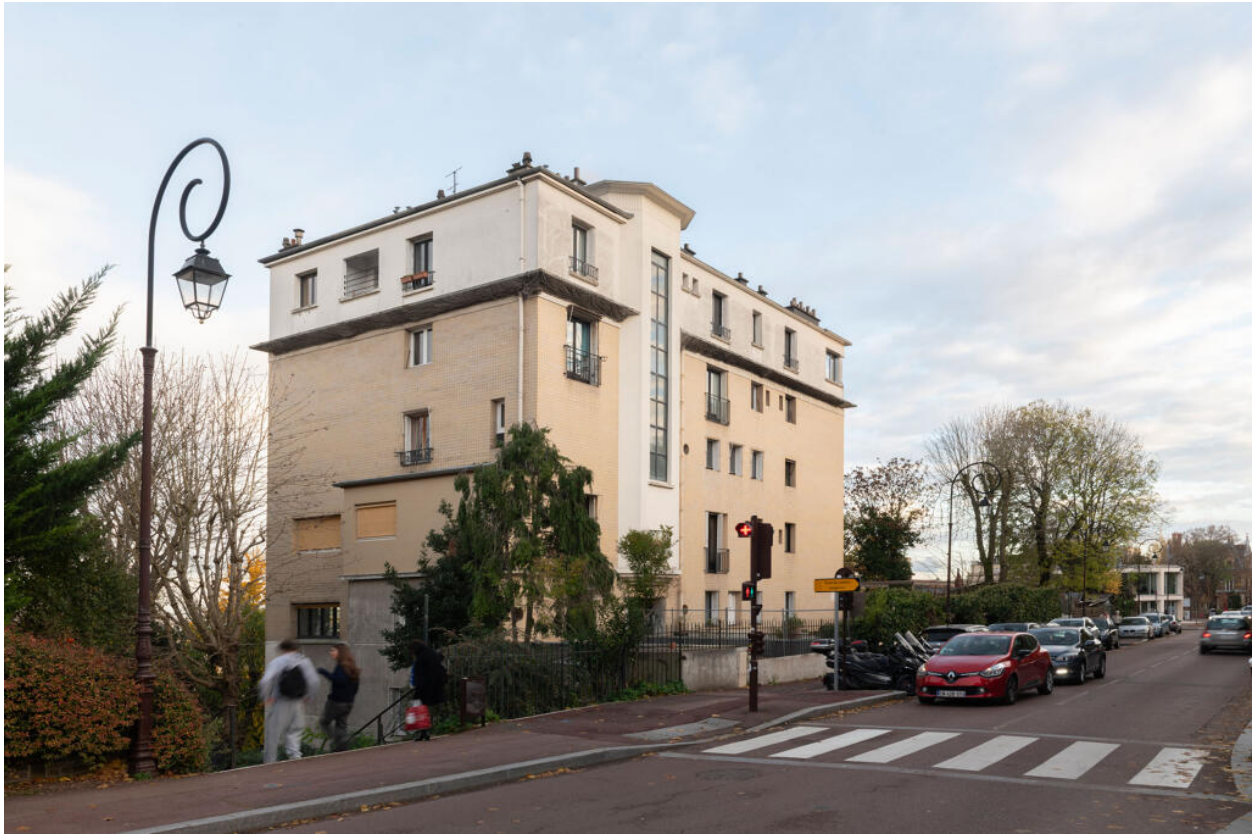
Immeuble, vue depuis le nord-ouest