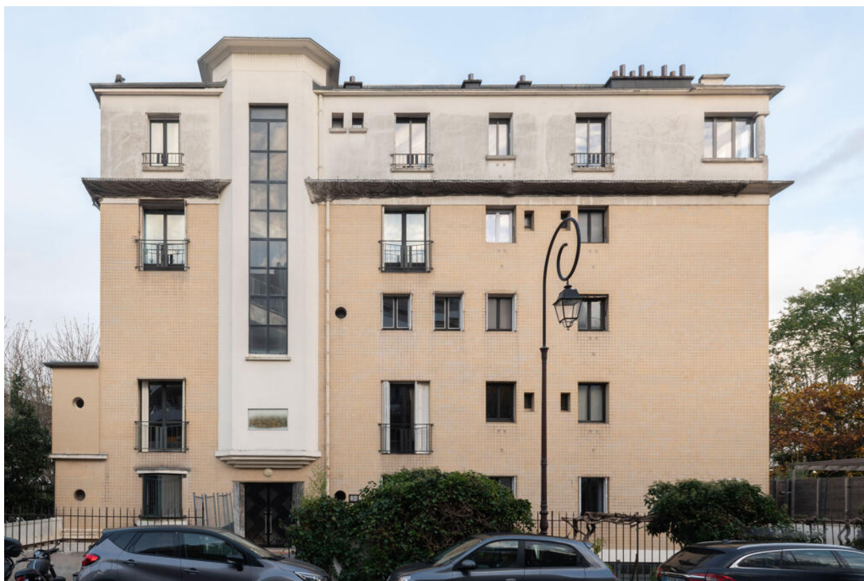
Immeuble, vue de la façade sur rue