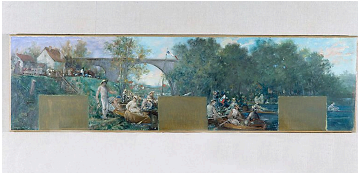
Canotiers sur la Marne. Esquisse, 1889. (Musée du Petit Palais)