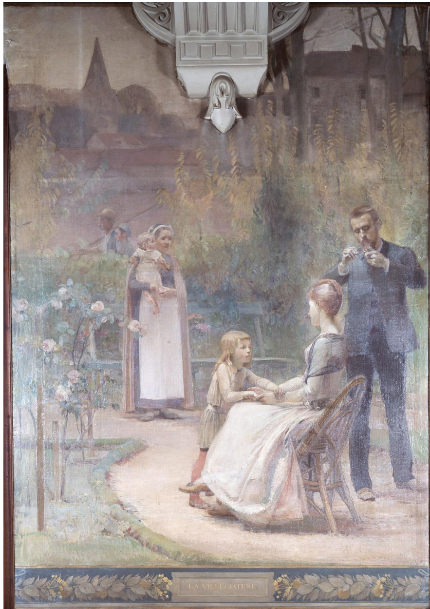
La Villégiature, 1892.