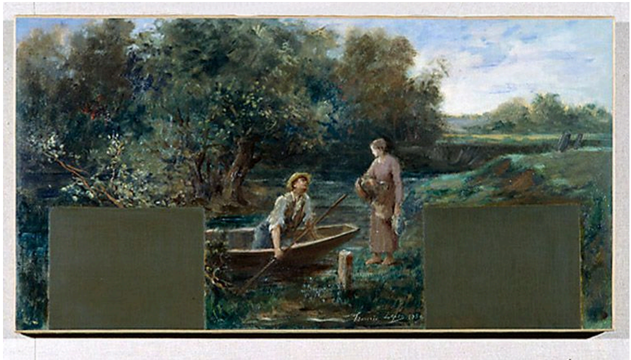
Idylle au bord de l'eau. Esquisse, 1889. (Musée du Petit Palais)