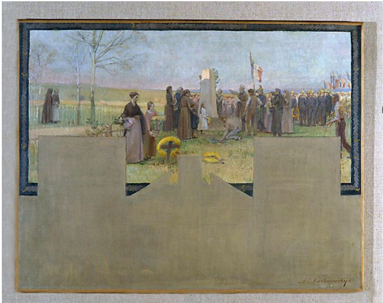
Inauguration d'un monument aux morts. Esquisse. (Musée du Petit Palais)