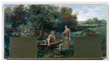
Idylle au bord de l'eau. Esquisse, 1889. (Musée du Petit Palais) IVR11_19879400029XA