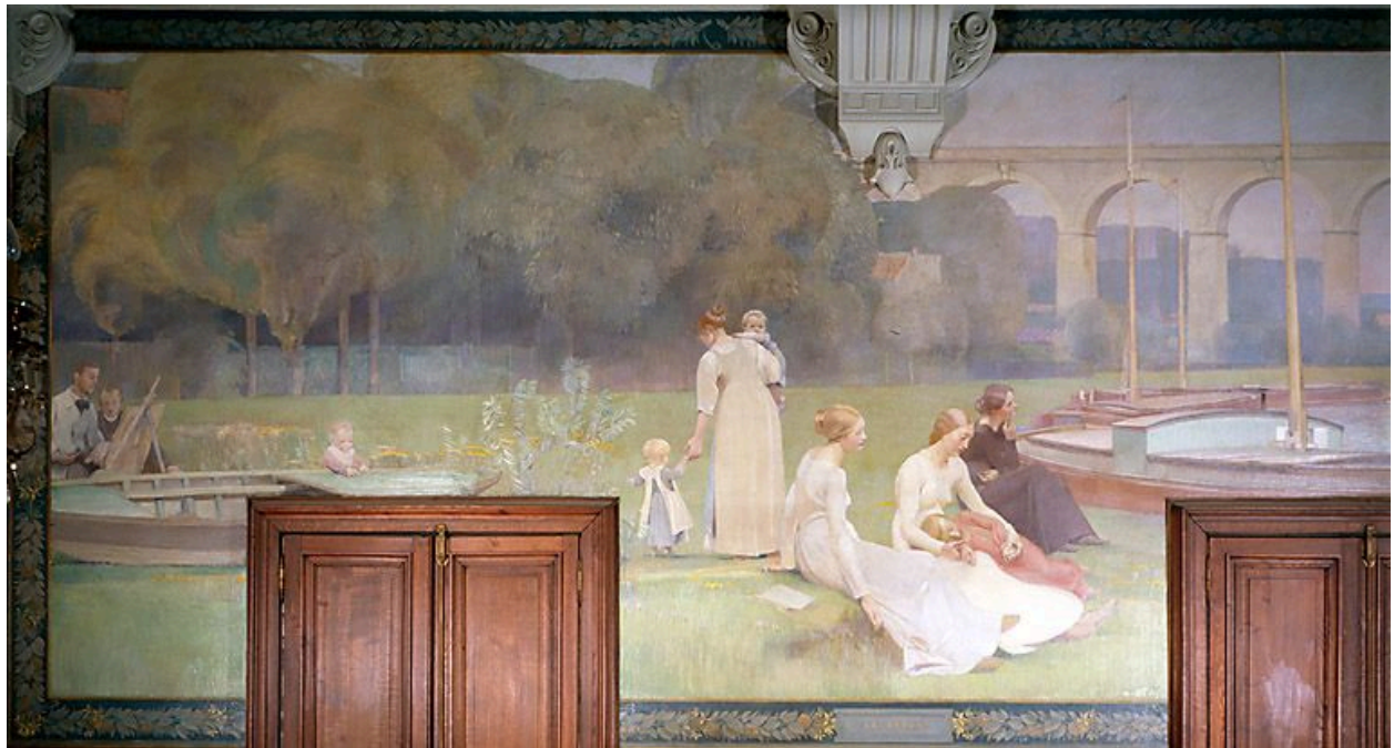
Le Repos, 1892.