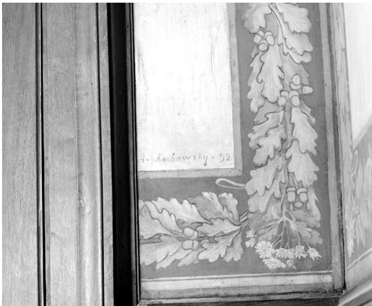
Détail de la signature d'Adrien Karbowski, 1892.