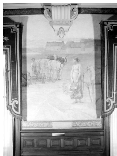
Le Labourage, 1892. Autr. Adrien Karbowsky