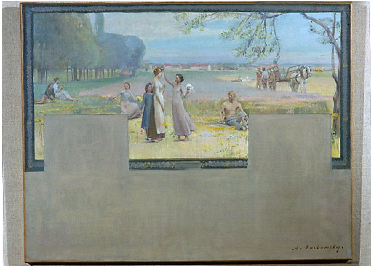
La jeunesse. Esquisse. (Musée du Petit Palais)