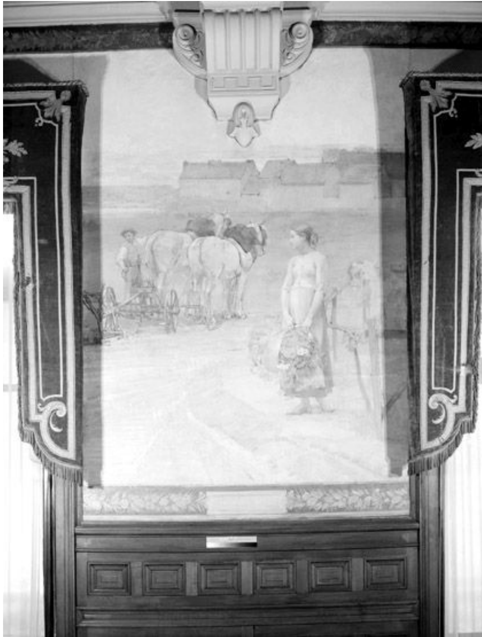
Le Labourage, 1892.