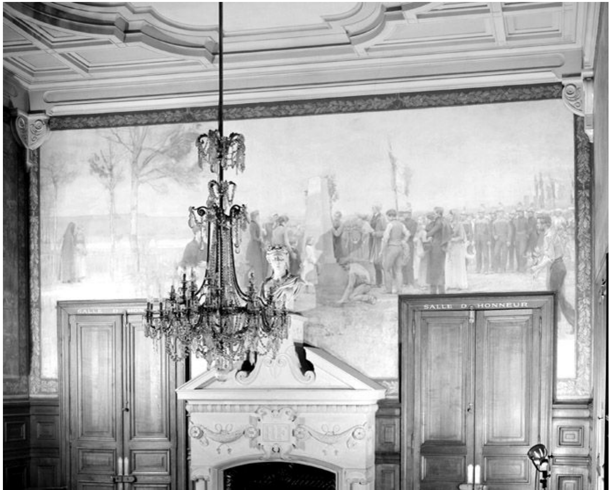
Inauguration d'un monument aux morts, 1892.