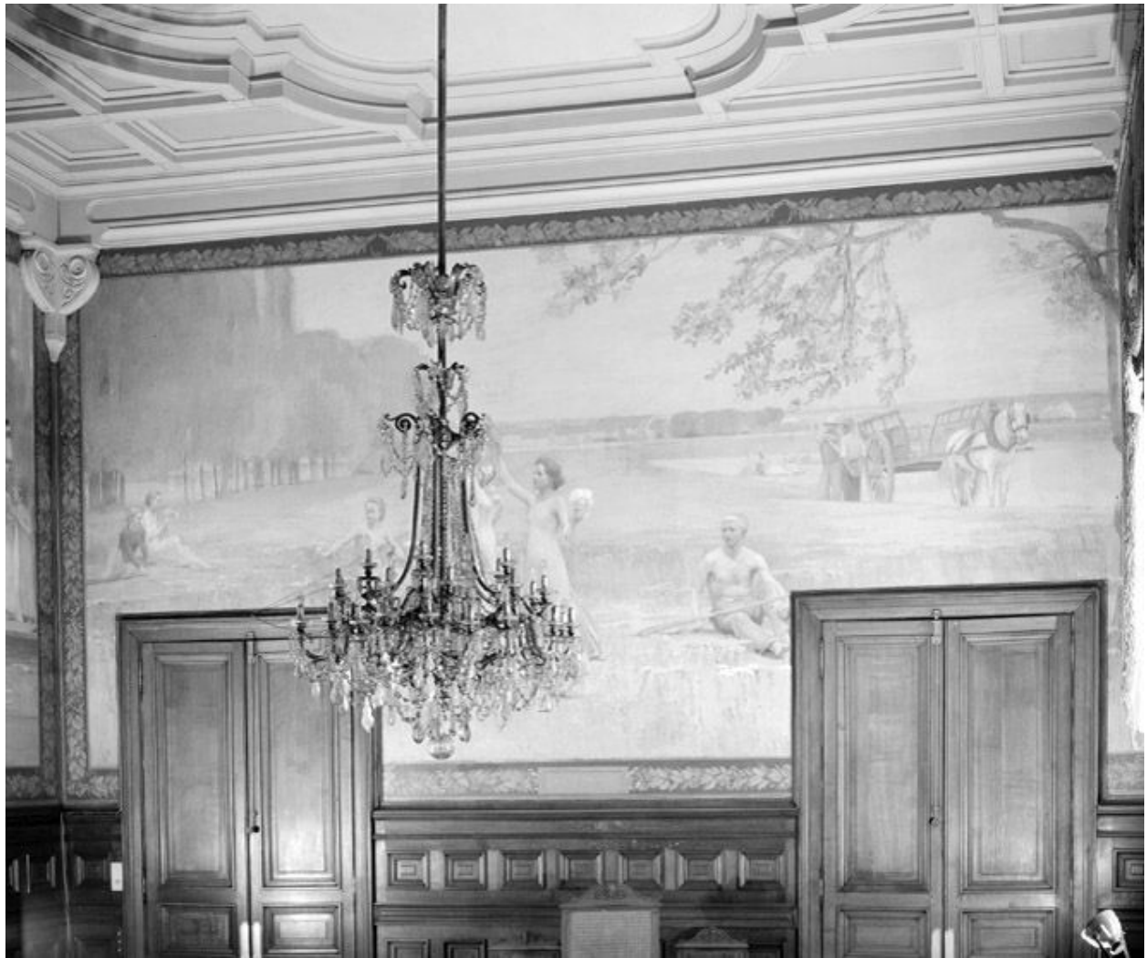
La jeunesse, 1892.