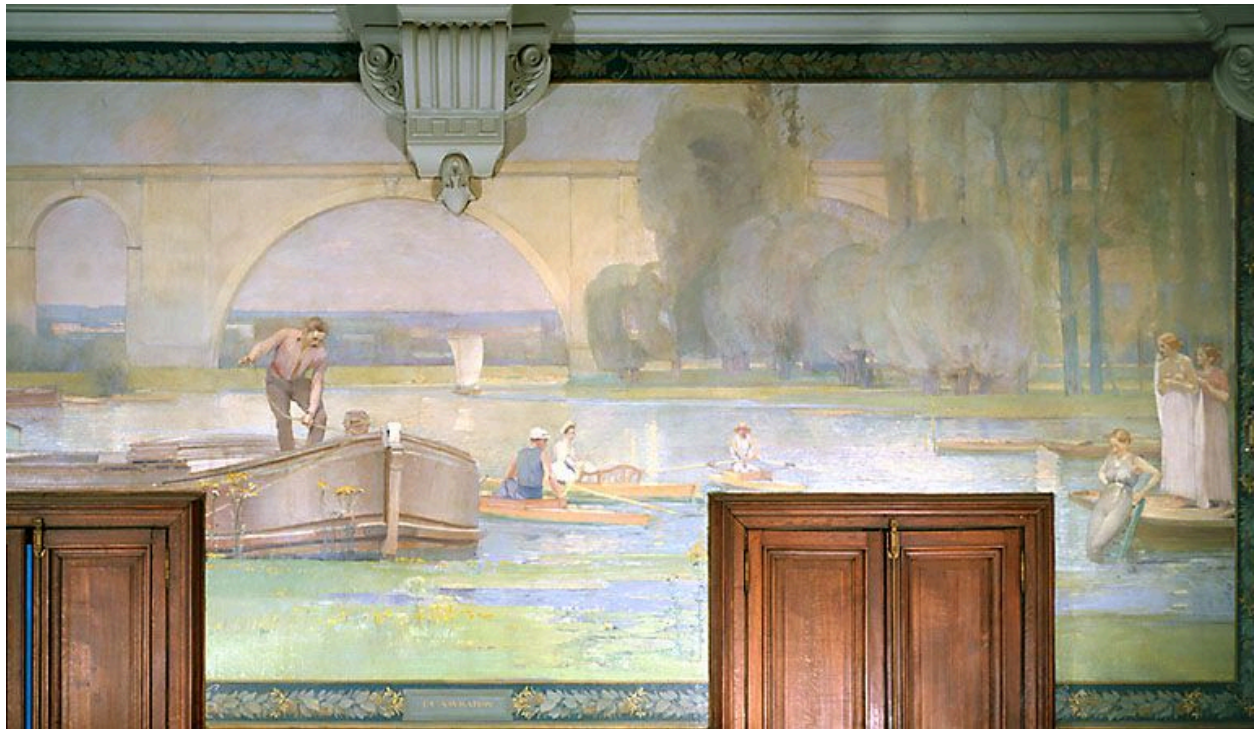
La Navigation, 1892.