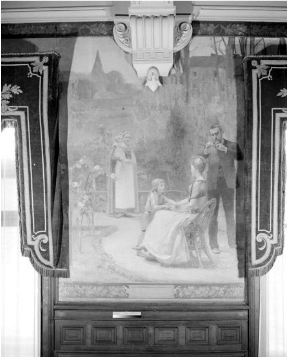
La Villégiature, 1892.