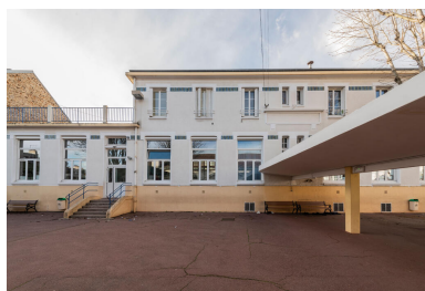
École des Coteaux, bâtiment de 1922, façade orientale sur cour IVR11_20249200956NUC4A