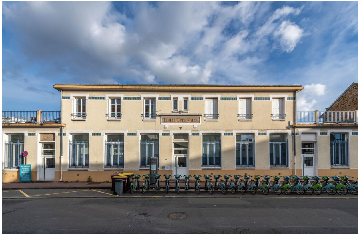
École des Coteaux, bâtiment de 1922, façade ouest. Architecte : Henri Renard.