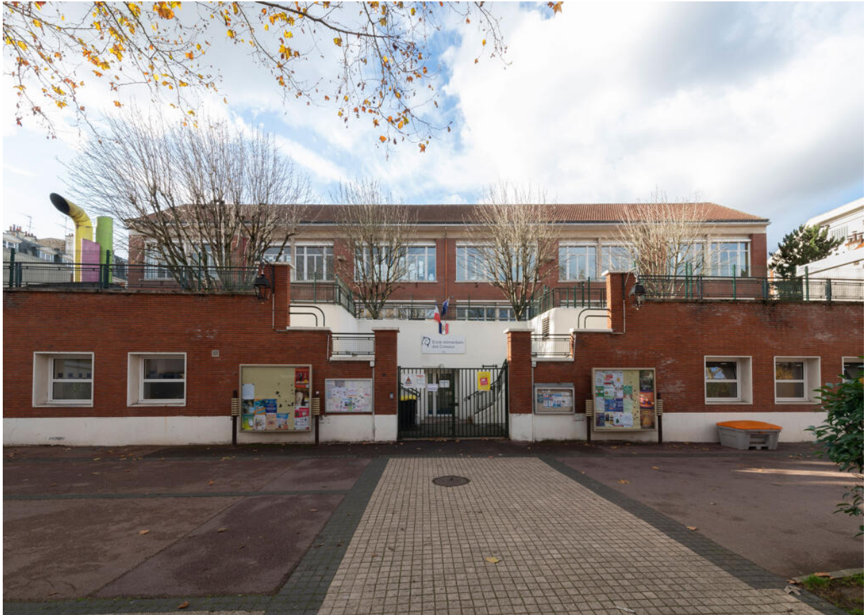
École des Coteaux, entrée du bâtiment de 1938 par l'avenue Berard Palissy