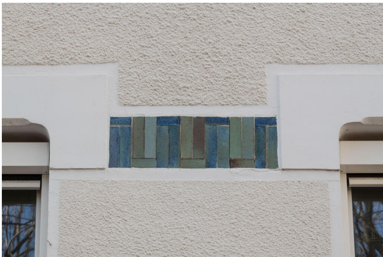
École des Coteaux, bâtiment de 1922, décor en brique émaillée