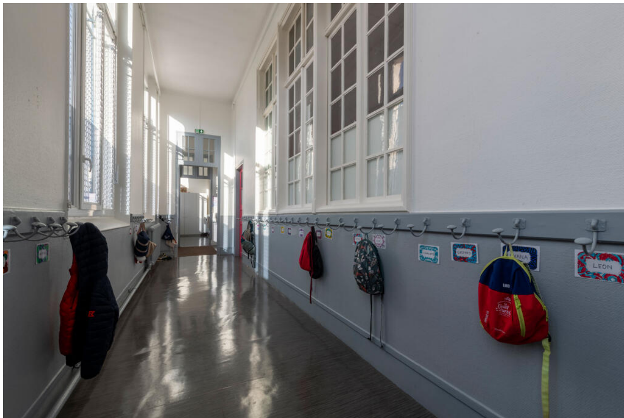
École des Coteaux, bâtiment de 1922, couloir desservant les classes au rez-de-chaussée