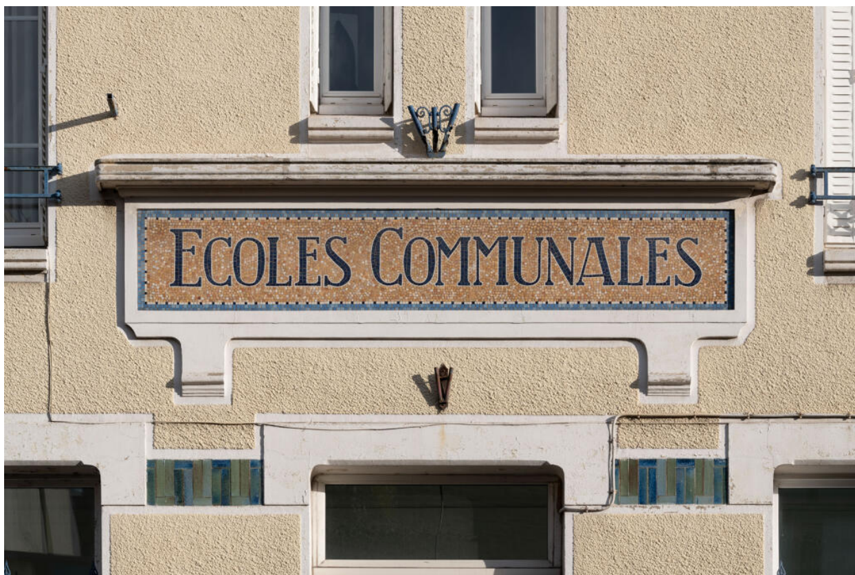
École des Coteaux, bâtiment de 1922, cartouche en mosaïque