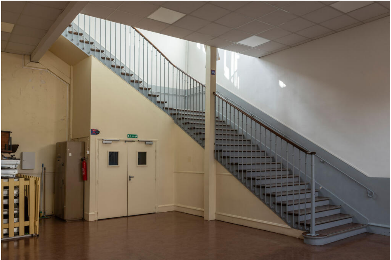
École des Coteaux, bâtiment de 1938, escalier principal