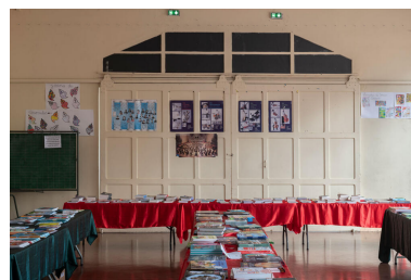
École des Coteaux, bâtiment de 1938, porte à deux vantaux coulissants donnant accès à l'escalier principal IVR11_20249200943NUC4A