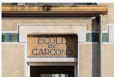
École des Coteaux, cartouche en mosaïque en dessus-de-porte IVR11_20249200966NUC4A