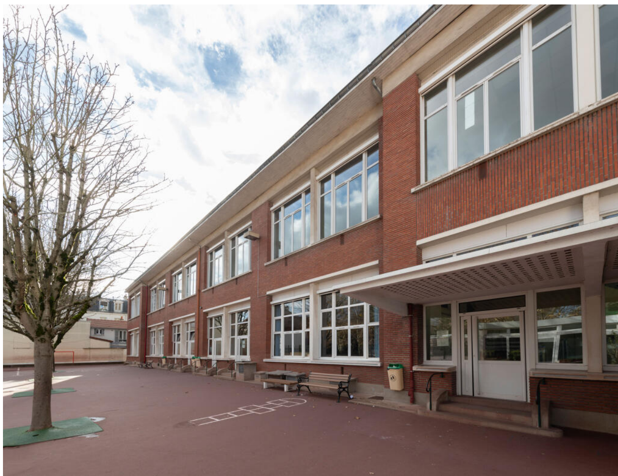
École des Coteaux, bâtiment de 1938, façade est