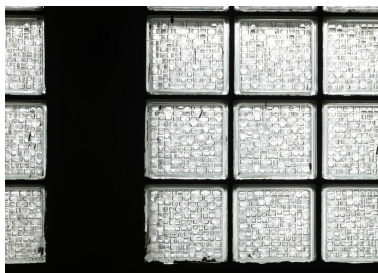
École des Coteaux, bâtiment de 1938, fenêtre du soubassement à pavés de verre IVR11_20249200950NUC4A