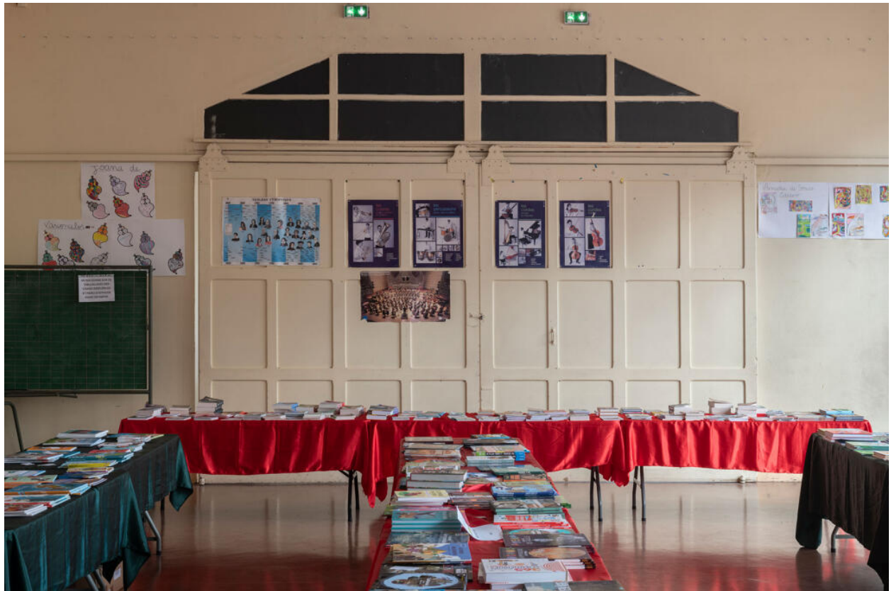
École des Coteaux, bâtiment de 1938, porte à deux vantaux coulissants donnant accès à l'escalier principal