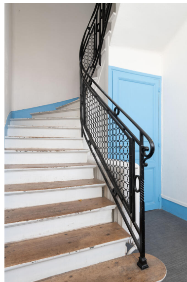
École des Coteaux, bâtiment de 1922, départ de l'escalier conduisant aux appartements de fonction