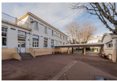
École des Coteaux, bâtiment de 1922, façade sur cour IVR11_20249200955NUC4A