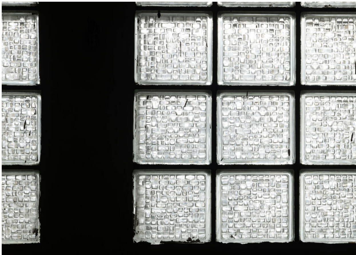
École des Coteaux, bâtiment de 1938, fenêtre du soubassement à pavés de verre