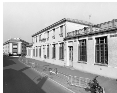
Vue d'ensemble des façades sur la rue.