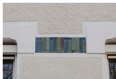
École des Coteaux, bâtiment de 1922, décor en brique émaillée IVR11_20249200959NUC4A