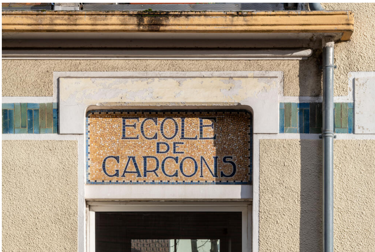
École des Coteaux, cartouche en mosaïque en dessus-de-porte