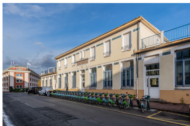
École des Coteaux, bâtiment de 1922, façade ouest IVR11_20249200963NUC4A