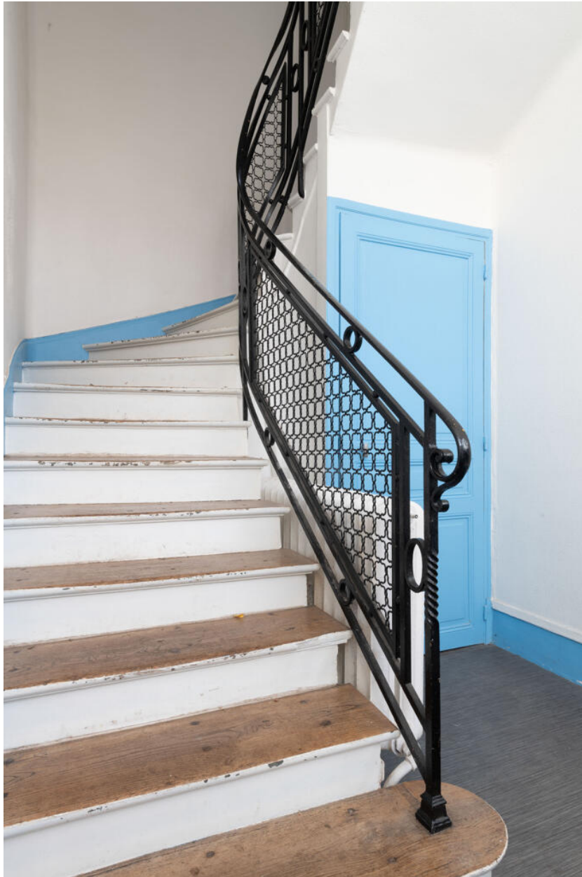
École des Coteaux, bâtiment de 1922, départ de l'escalier conduisant aux appartements de fonction