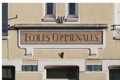
École des Coteaux, bâtiment de 1922, cartouche en mosaïque IVR11_20249200964NUC4A