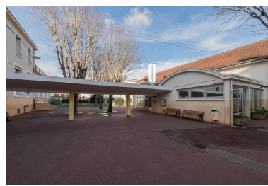
École des Coteaux, cour IVR11_20249200954NUC4A