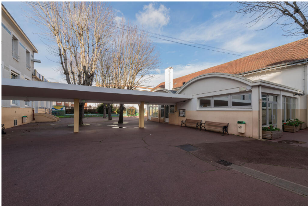
École des Coteaux, cour