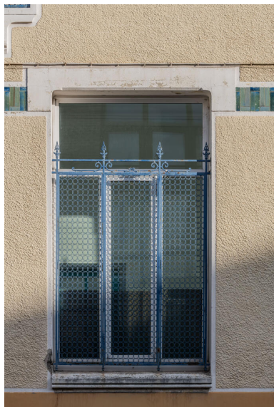
École des Coteaux, fenêtre du bâtiment de 1922 IVR11_20249200965NUC4A