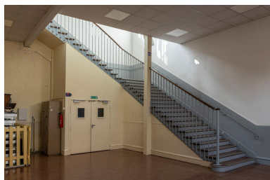
École des Coteaux, bâtiment de 1938, escalier principal IVR11_20249200945NUC4A