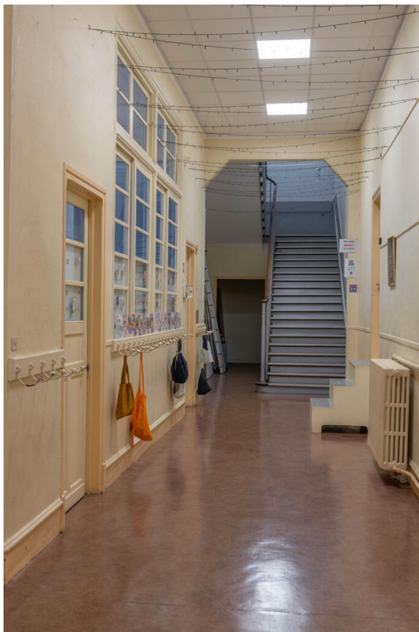
École des Coteaux, bâtiment de 1938, couloir desservant les classes du rez-de-chaussée