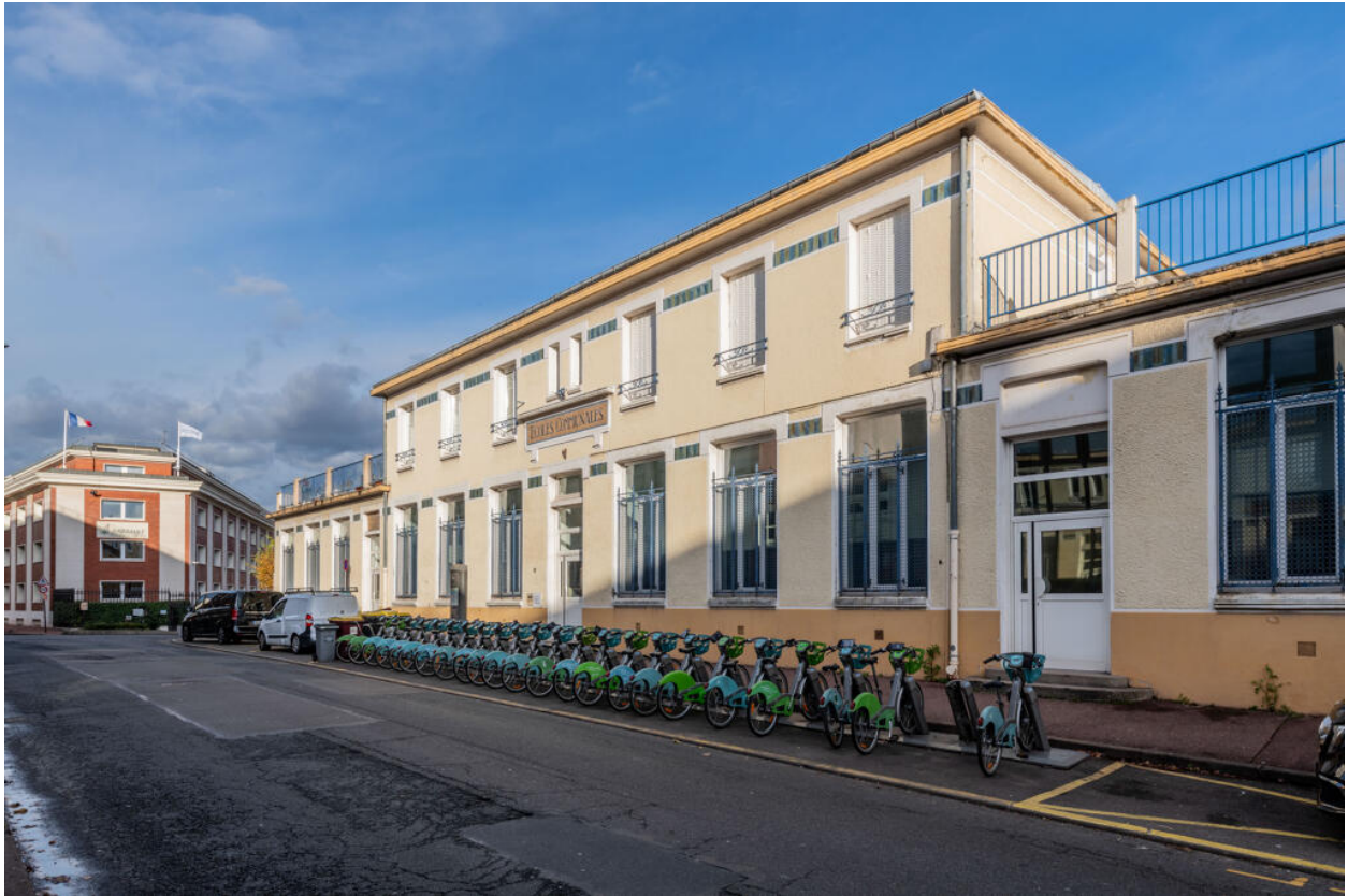
École des Coteaux, bâtiment de 1922, façade ouest