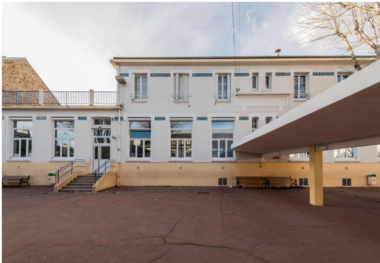
École des Coteaux, bâtiment de 1922, façade orientale sur cour