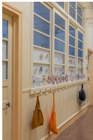
École des Coteaux, bâtiment de 1938, fenêtre de second-jour d'une classe IVR11_20249200947NUC4A