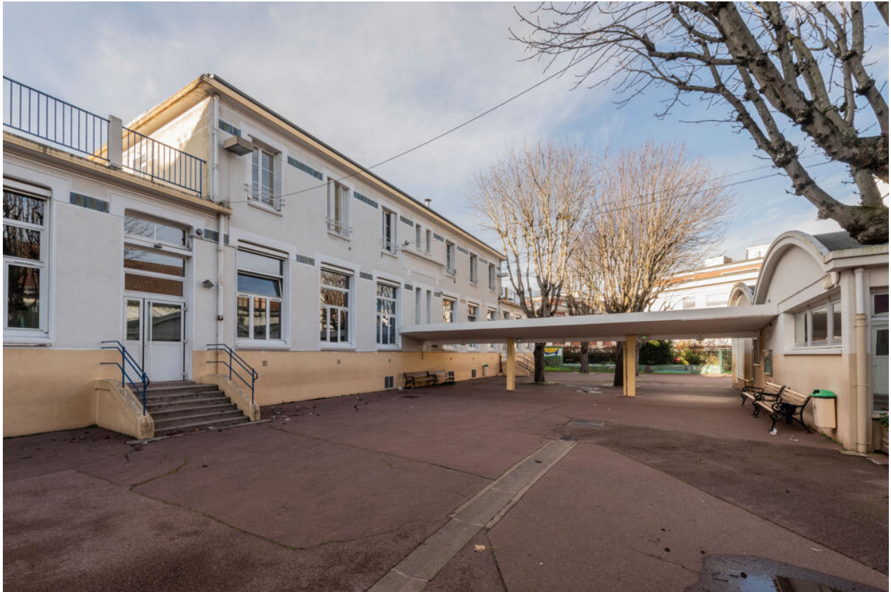
École des Coteaux, bâtiment de 1922, façade sur cour