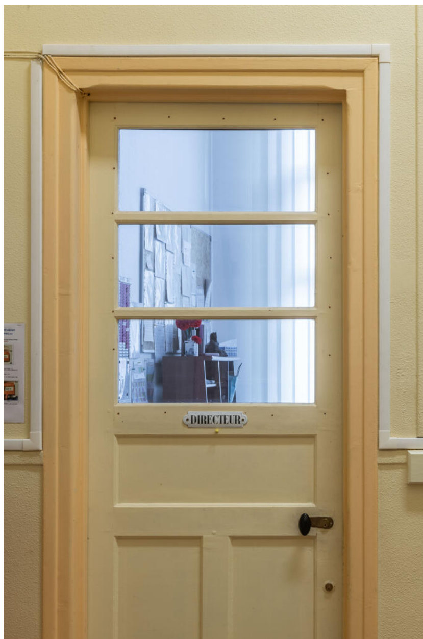
École des Coteaux, bâtiment de 1938, porte du bureau du directeur