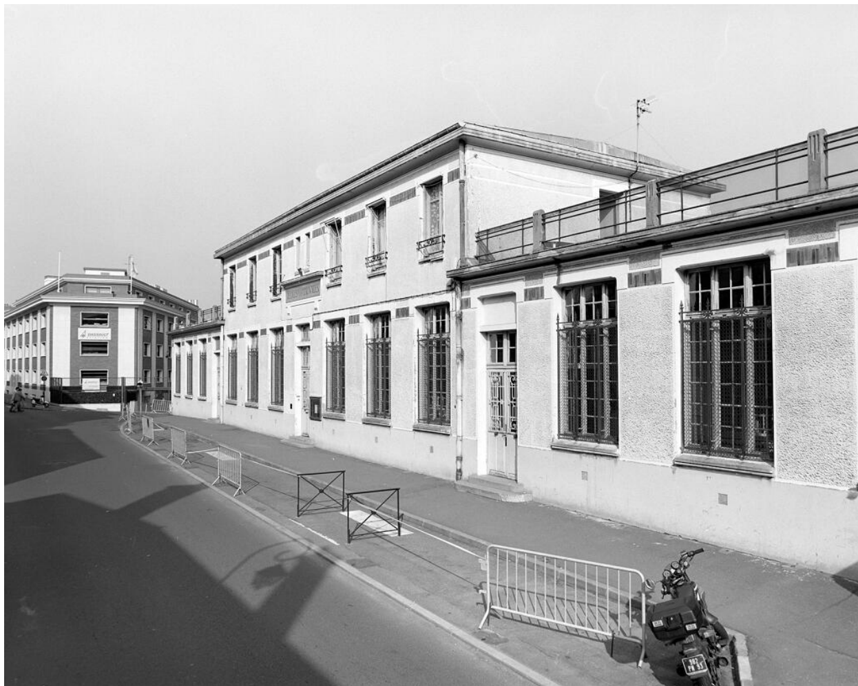
Vue d'ensemble des façades sur la rue.