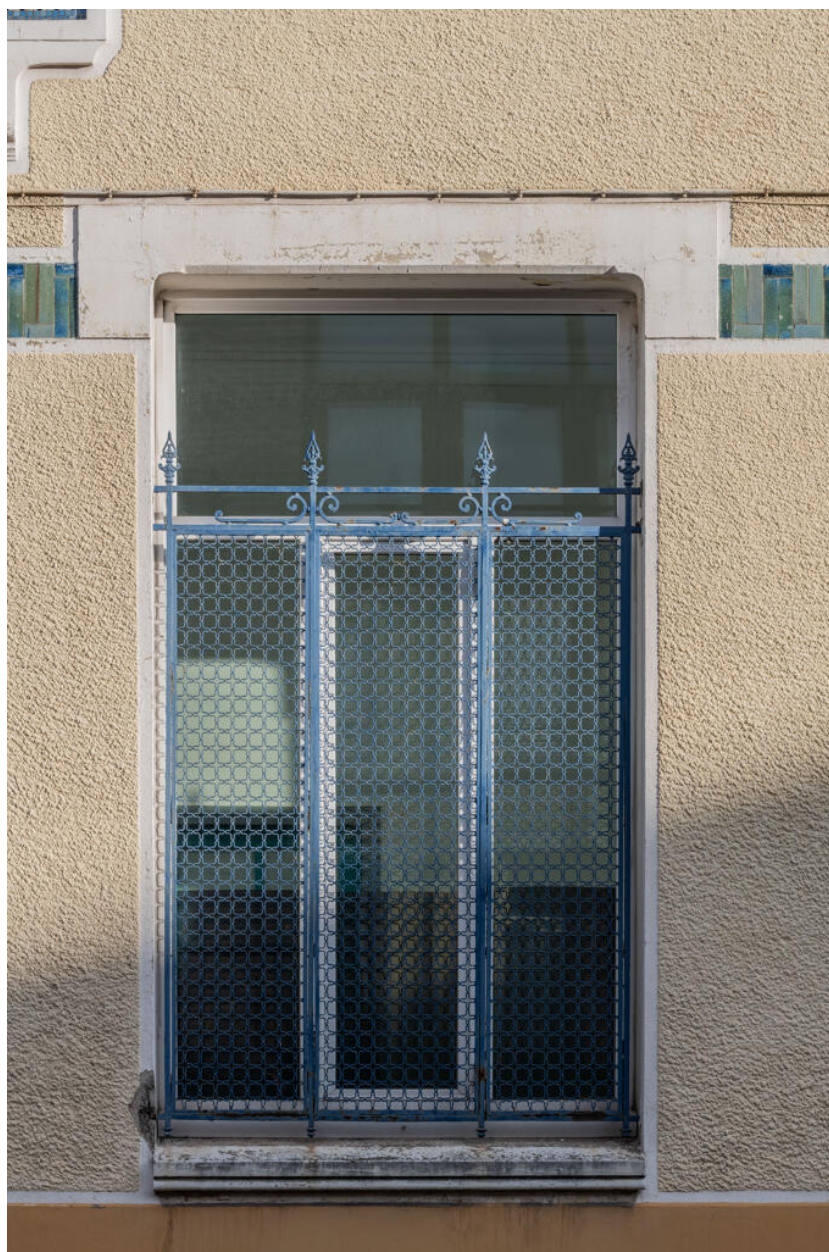
École des Coteaux, fenêtre du bâtiment de 1922