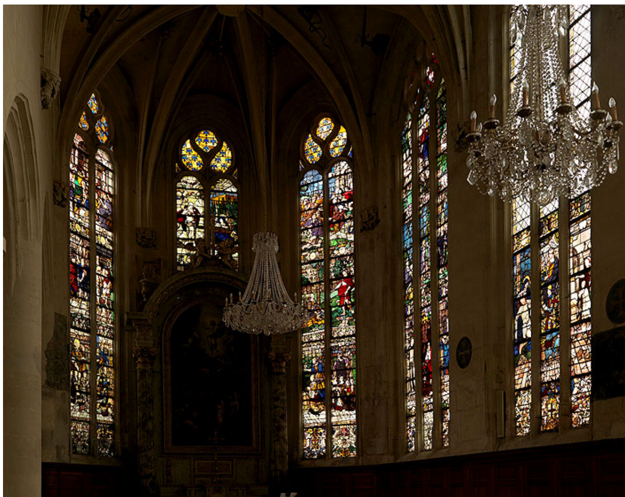
Vue d'ensemble des verrières du chœur.