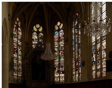
Vue d'ensemble des verrières du chœur. IVR11_20169500002NUC4A