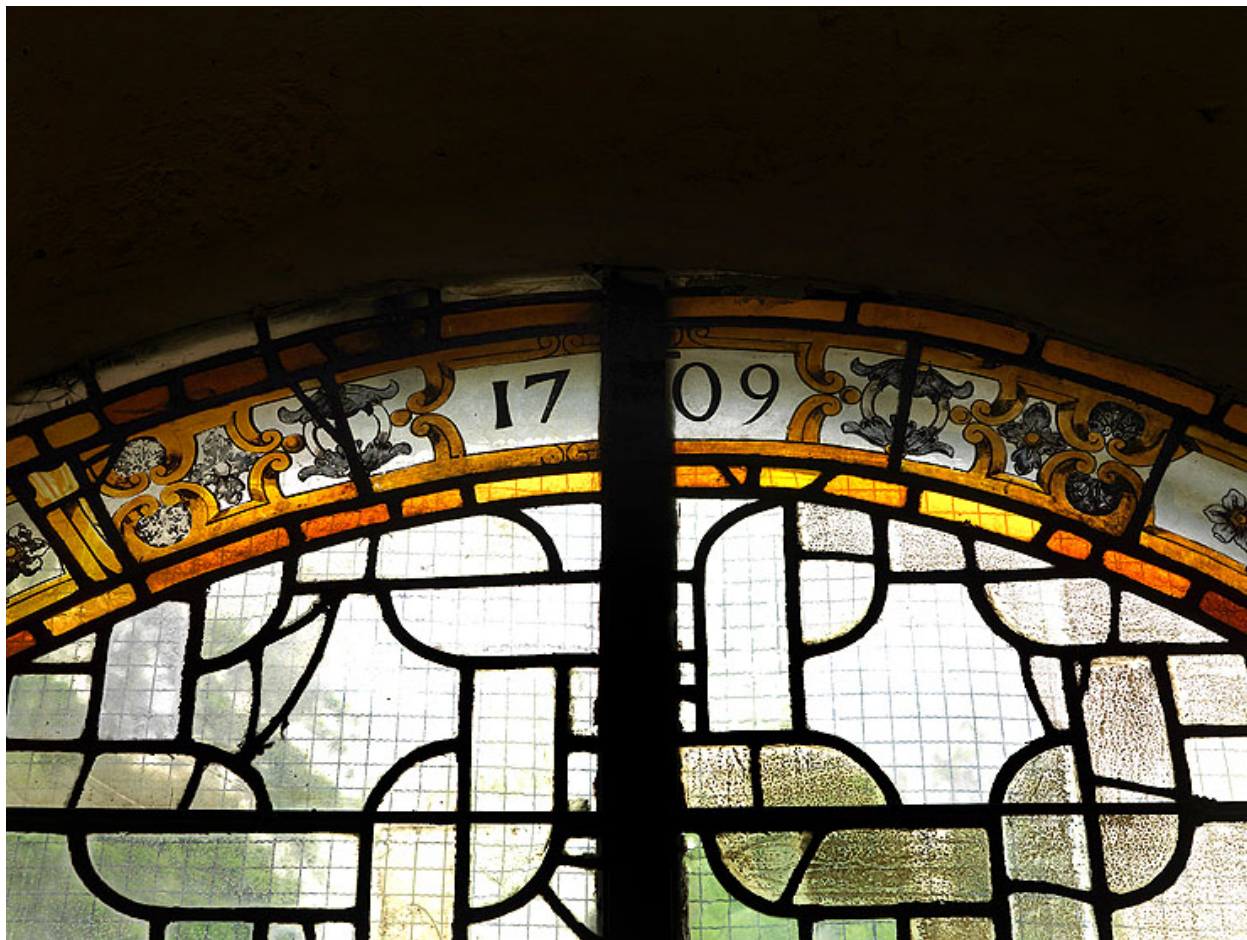
Détail de la bordure au sommet de la baie 16, sur el côté sud de la nef : date "1709".