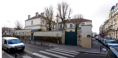
Vue de l'angle de la rue Boulard et de la rue Charles Divry. IVR11_20157500599NUC4A