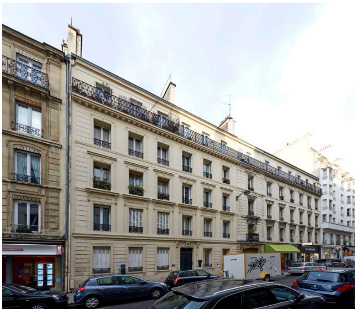
Vue de la rue Mouton Duvernet.