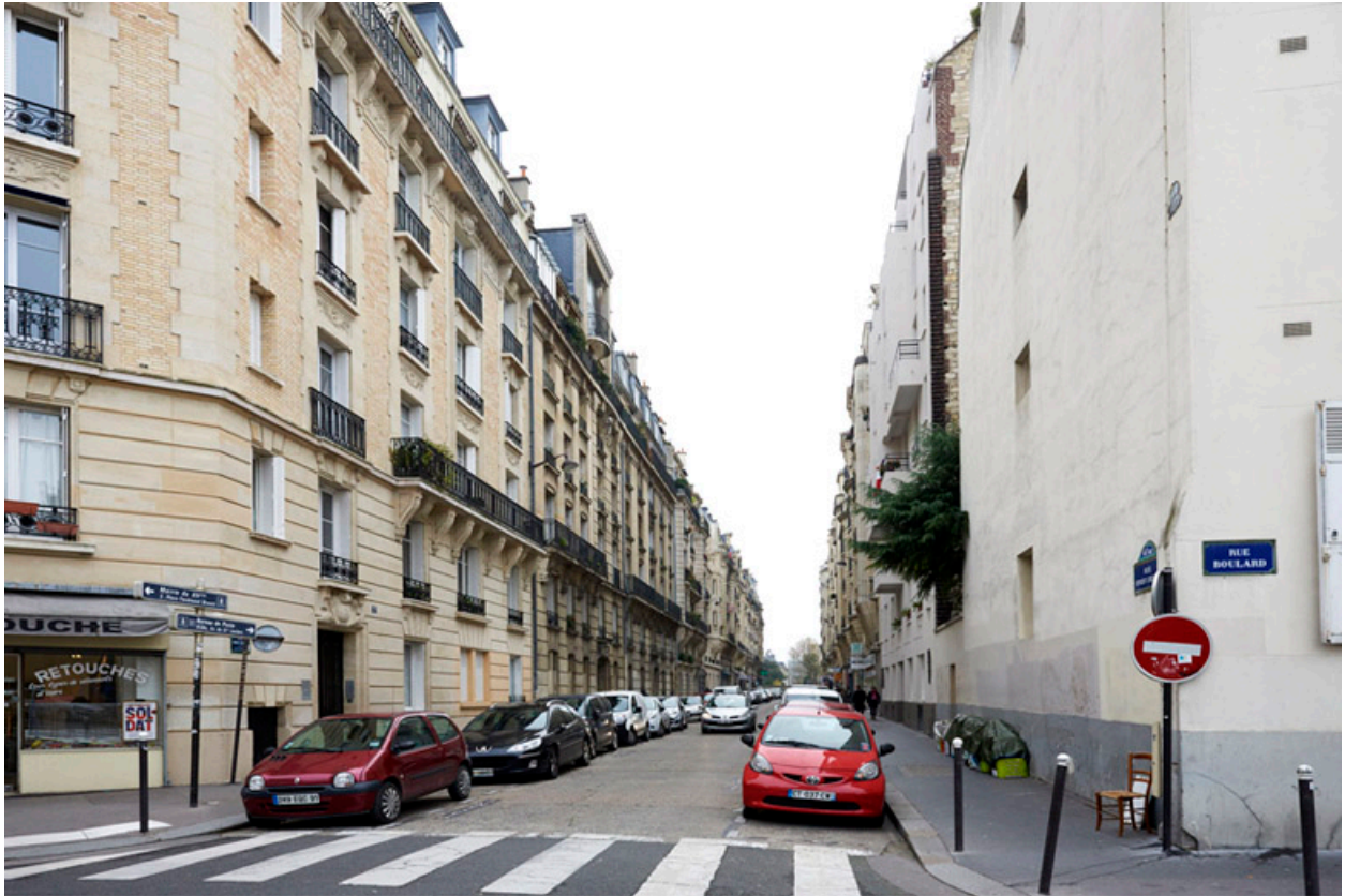
Vue de la rue Ernest Cresson, depuis la rue Boulard.