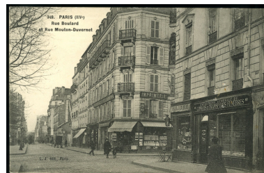
349. Paris XIVe Rue Boulard et rue Mouton-Duvernet.-Carte postale, vers 1900. IVR11_20157500540NUC4A