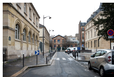
Vue de la rue Charles Divry, prise depuis la rue Ernest Cresson.