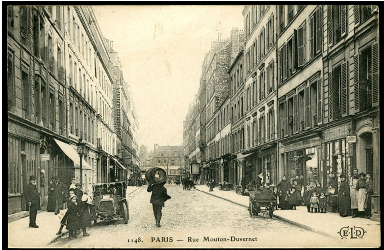
1148. Paris. Rue Mouton-Duvernet.-Carte postale, vers 1900 (Collection particulière).