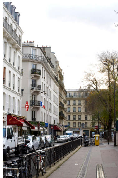
Vue de la rue Boulard vers la rue Mouton Duvernet.