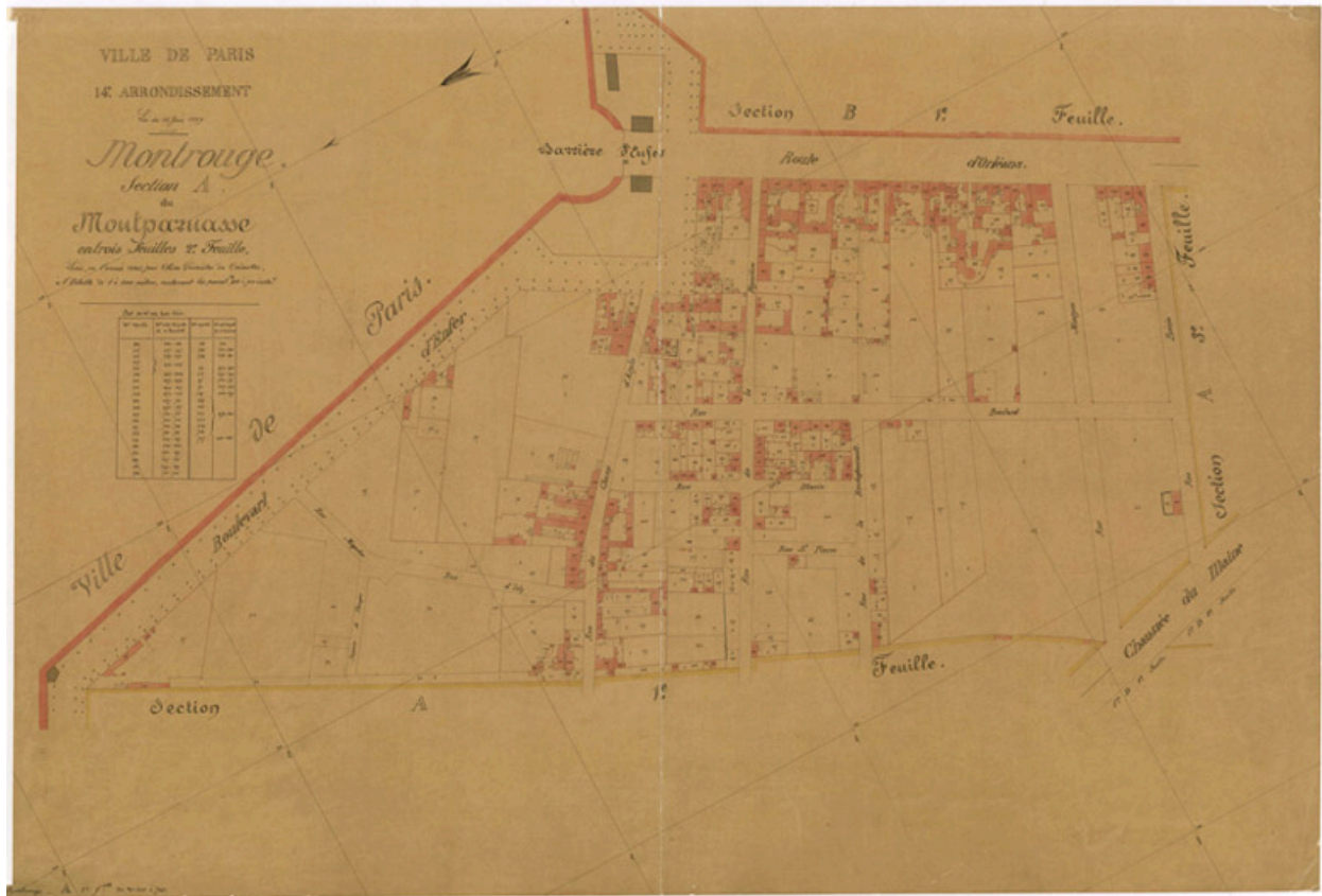
Plan cadastral de Montrouge, 1845. AD Paris Montrouge, section A dite du Montparnasse CN/149.