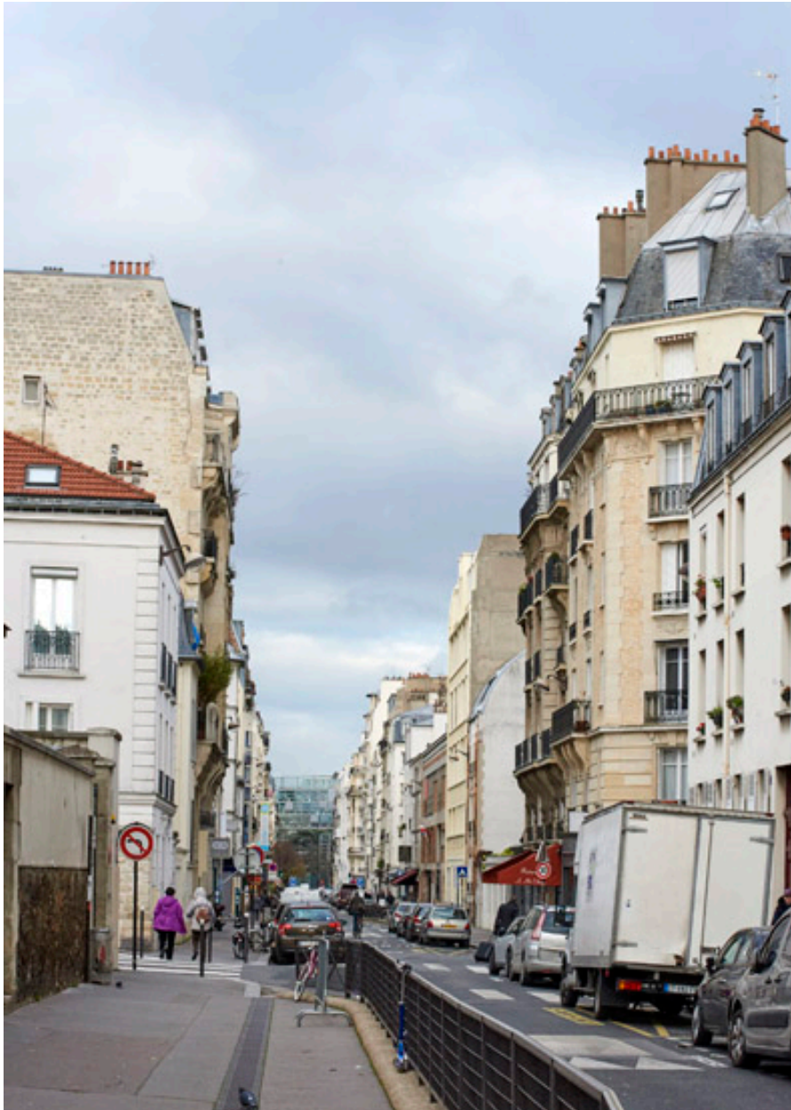
Vue de la rue Boulard vers la rue Daguerre.