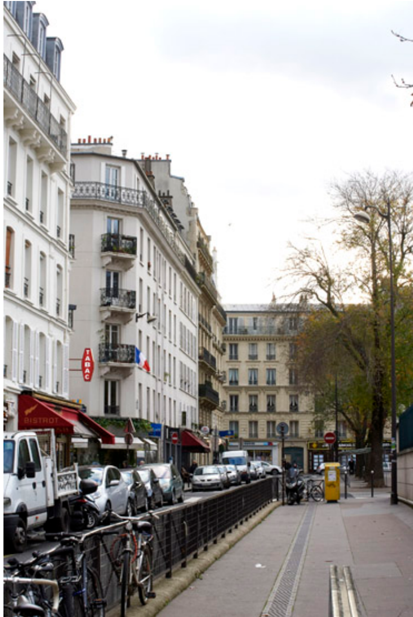
Vue de la rue Boulard vers la rue Mouton Duvernet.