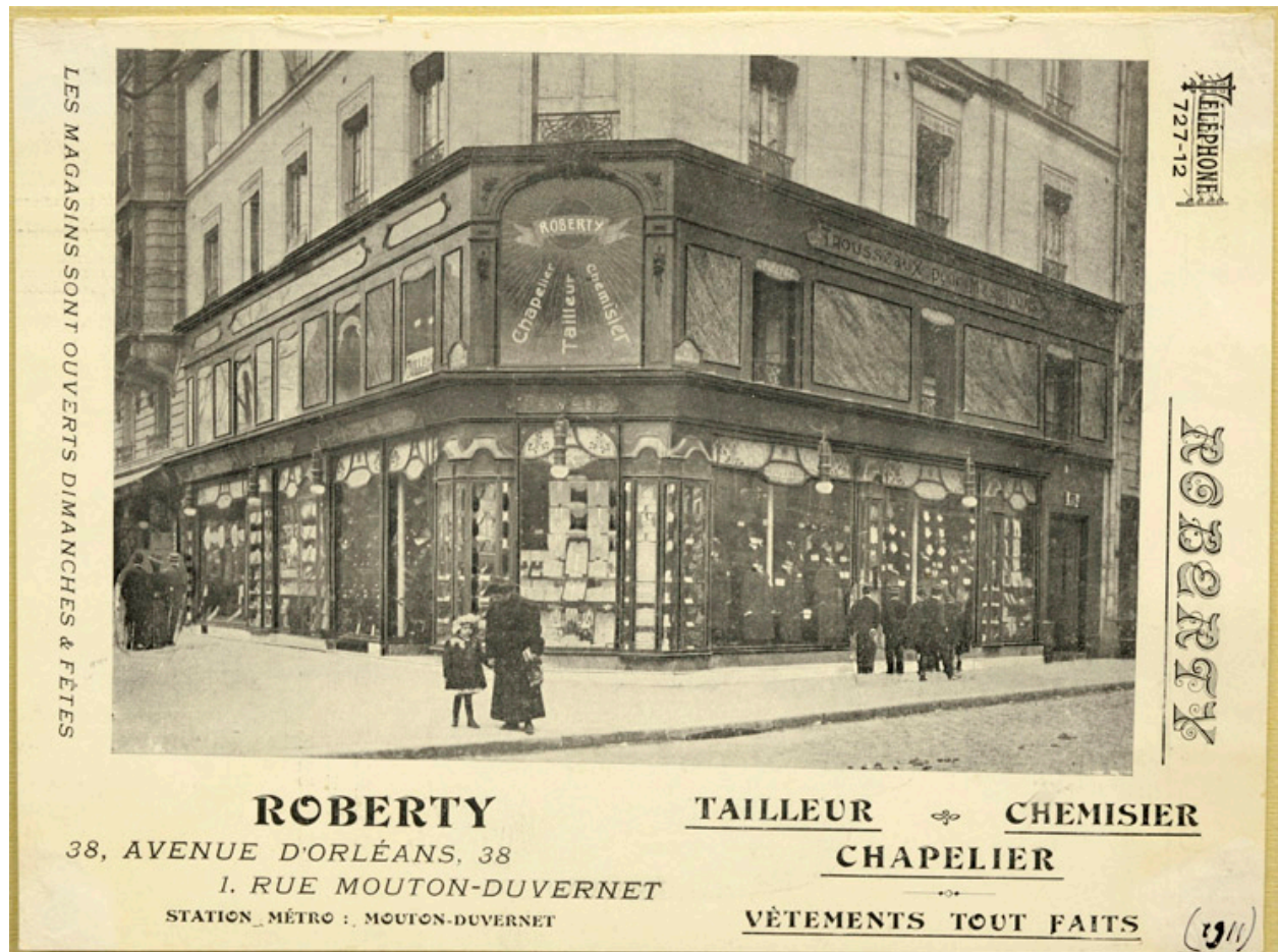
Grand magasin Roberty, 1 rue Mouton Duvernet. -Carte postale, vers 1900.