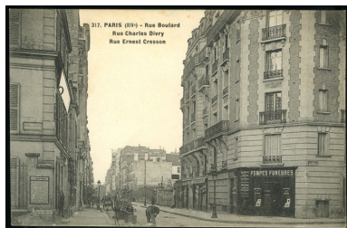
317. Paris XIVe Rue Boulard Rue Charles Divry Rue Ernest Cresson.-Carte postale, vers 1900. IVR11_20157500541NUC4A