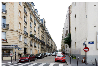
Vue de la rue Ernest Cresson, depuis la rue Boulard. IVR11_20157500669NUC4A