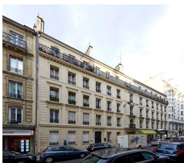
Vue de la rue Mouton Duvernet.