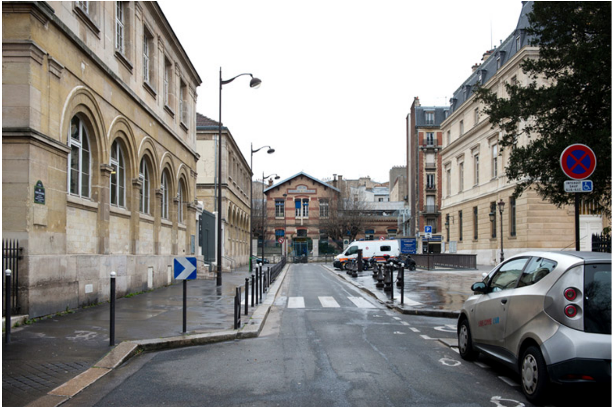
Vue de la rue Charles Divry, prise depuis la rue Ernest Cresson.