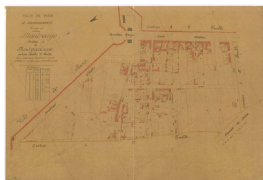
Plan cadastral de Montrouge, 1845. AD Paris Montrouge, section A dite du Montparnasse CN/149. IVR11_20157500812NUC4A