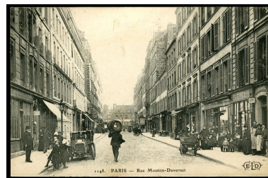
1148. Paris. Rue Mouton- Duvernet.-Carte postale, vers 1900. IVR11_20157500567NUC4A