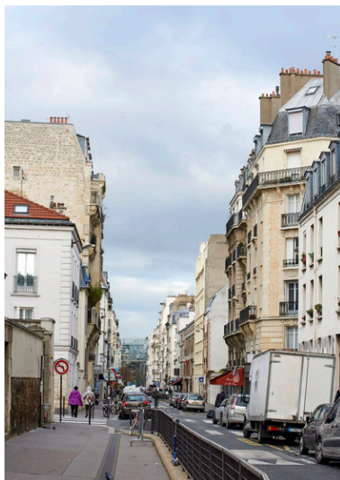
Vue de la rue Boulard vers la rue Daguerre.