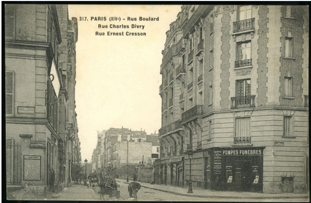
317. Paris XIVe Rue Boulard Rue Charles Divry Rue Ernest Cresson.-Carte postale, vers 1900 (Collection particulière).