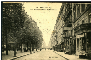
208. Paris XIVe Rue Boulard et Place de Montrouge.-Carte postale, vers 1900. IVR11_20157500565NUC4A