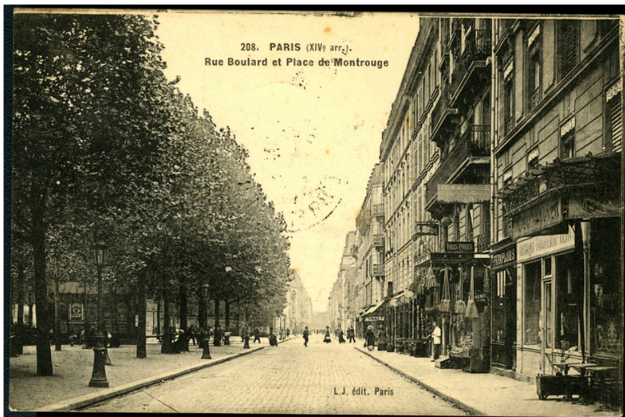
208. Paris XIVe Rue Boulard et Place de Montrouge.-Carte postale, vers 1900.