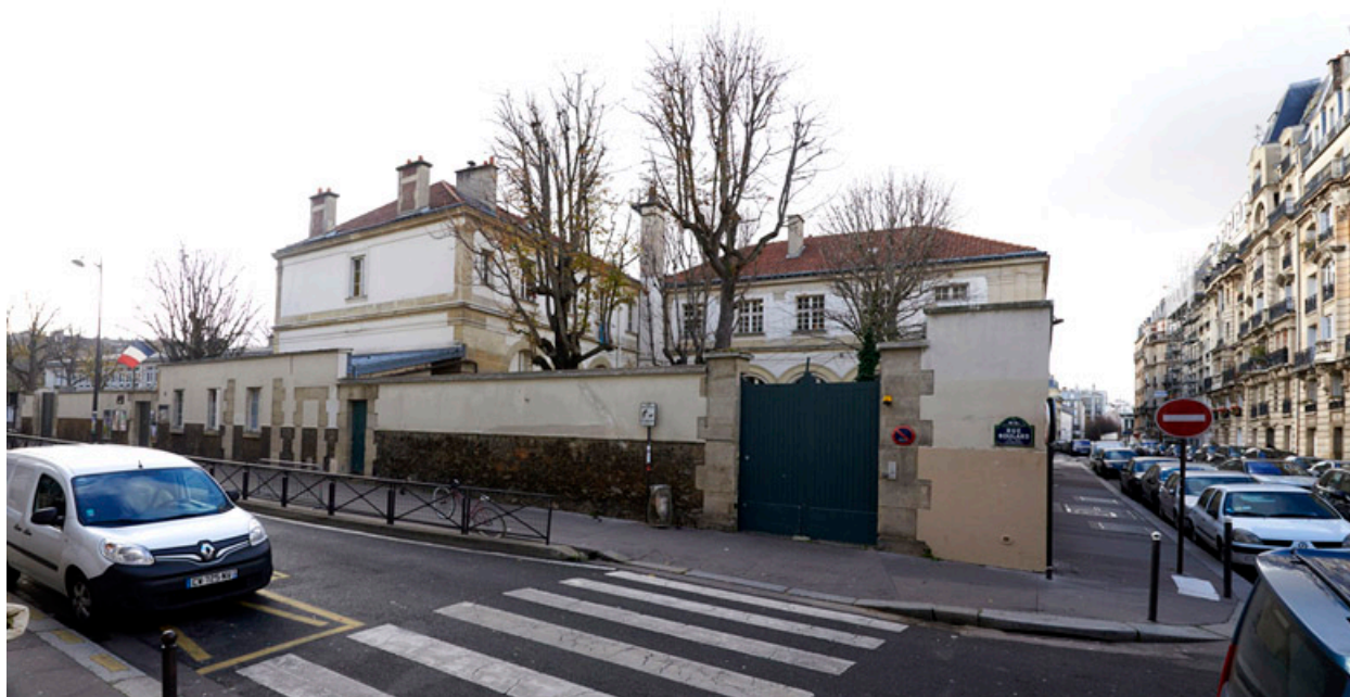
Vue de l'angle de la rue Boulard et de la rue Charles Divry.