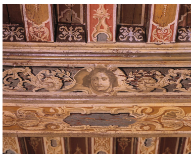
Détail d'une des quatre têtes de femme placées aux extrémités de la poutre transversale.