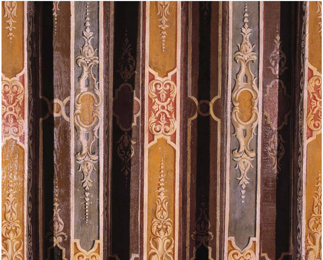
Détail des solives.