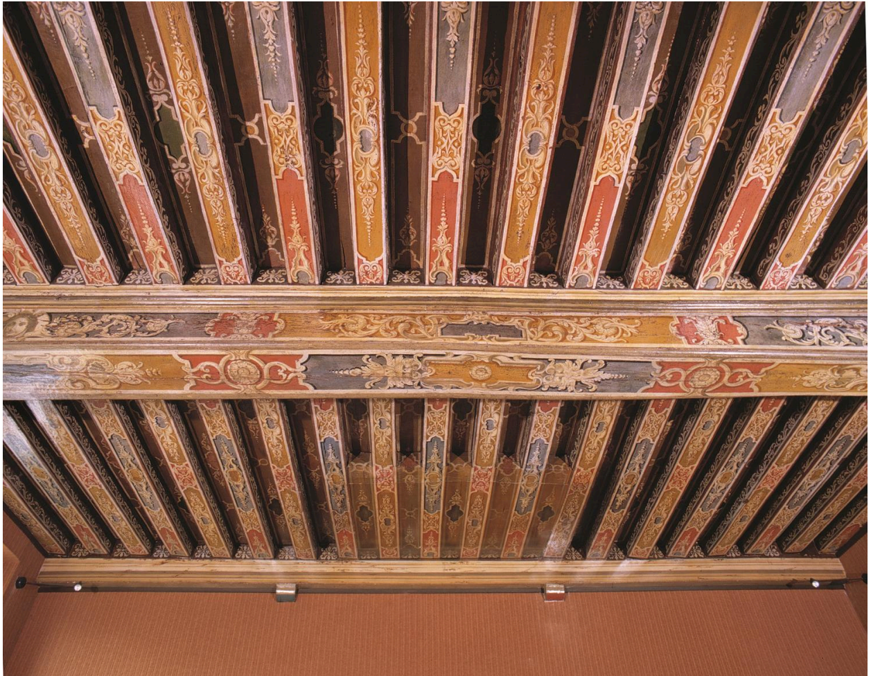
Vue d'ensemble du plafond à solives d'une des pièces du premier étage.