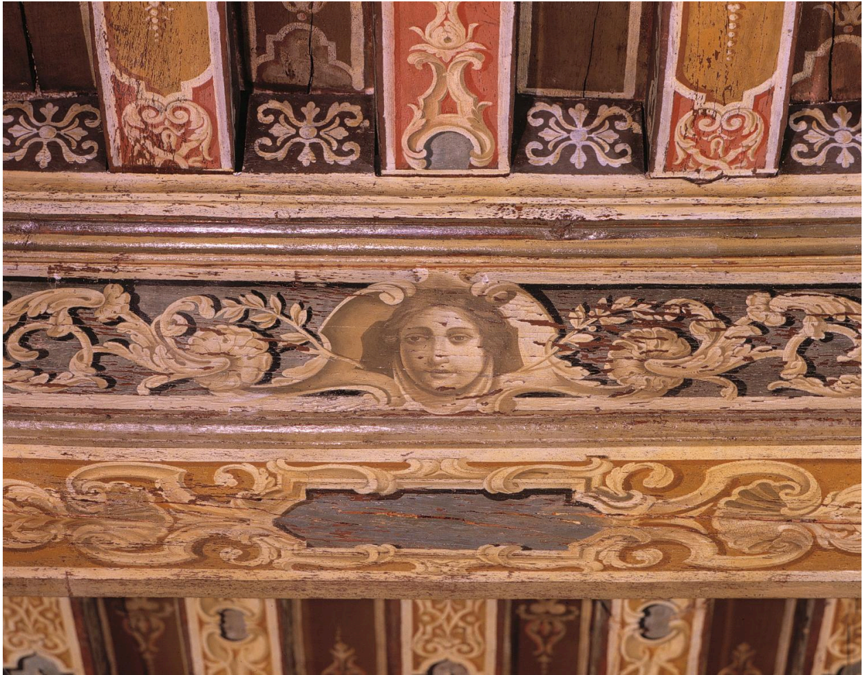
Détail d'une des quatre têtes de femme placées aux extrémités de la poutre transversale.