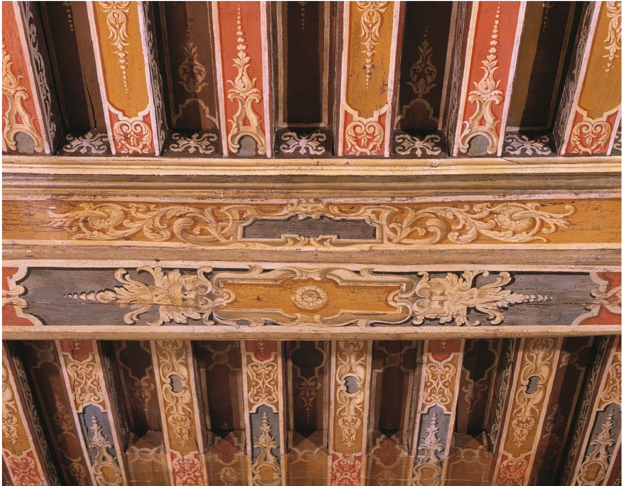
Détail du motif ornant la poutre transversale du plafond.