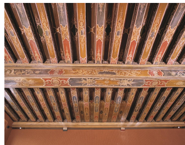
Vue d'ensemble du plafond à solives d'une des pièces du premier étage.