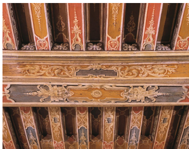
Détail du motif ornant la poutre transversale du plafond.