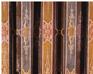
Détail des solives.