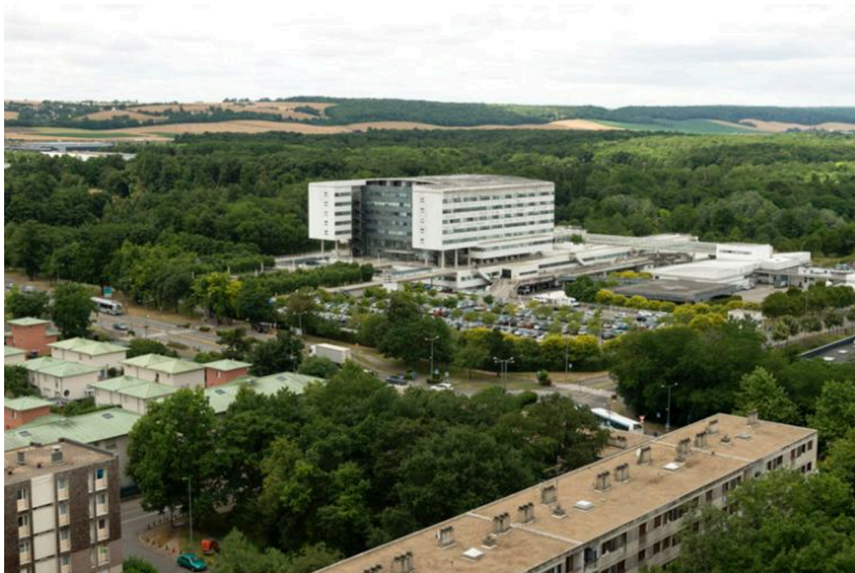
Le centre hospitalier François-Quesnay inauguré en 1998 à côté du Val Fourré.