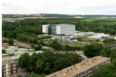
Le centre hospitalier François-Quesnay inauguré en 1998 à côté du Val Fourré.