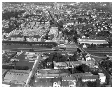
L'établissement à la fin des années 50. On voit la reconstruction du bloc médico-chirurgical par Lopez.