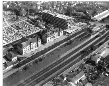
Les bâtiments construits par Raymond Marabout dans les années 30. A droite le pavillon de chirurgie, à gauche la maternité. (Fonds Bertin).

Phot. Laurent Kruszyk IVR11_20177800533NUC4A