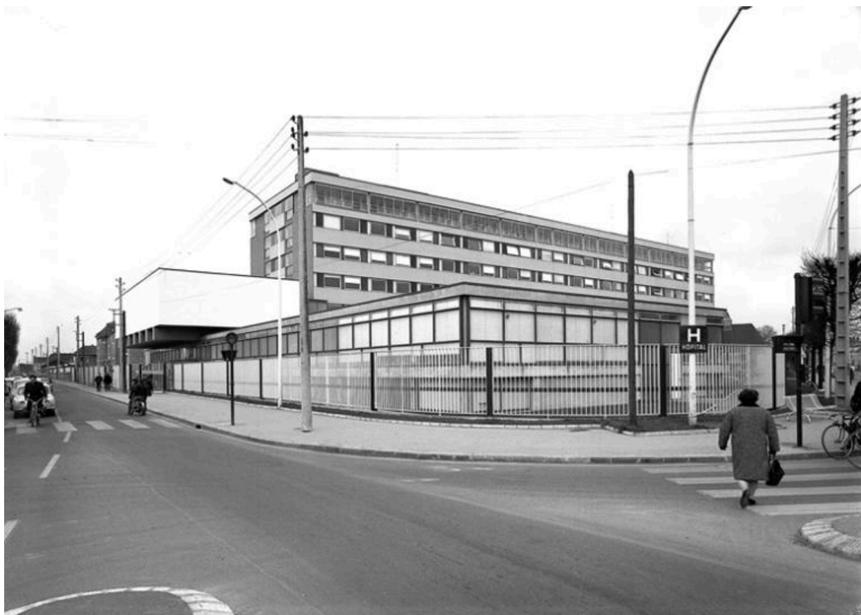
Le bloc construit par Lopez en cours d'achèvement. (Fonds Bertin).