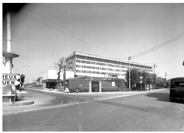
Vue d'ensemble de l'hôpital achevé.