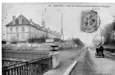
Vue de l'hôpital reconstruit par Durand. Il se situait le long de l'actuelle avenue Victor Duhamel, alors rue du faubourg Saint-Lazare.