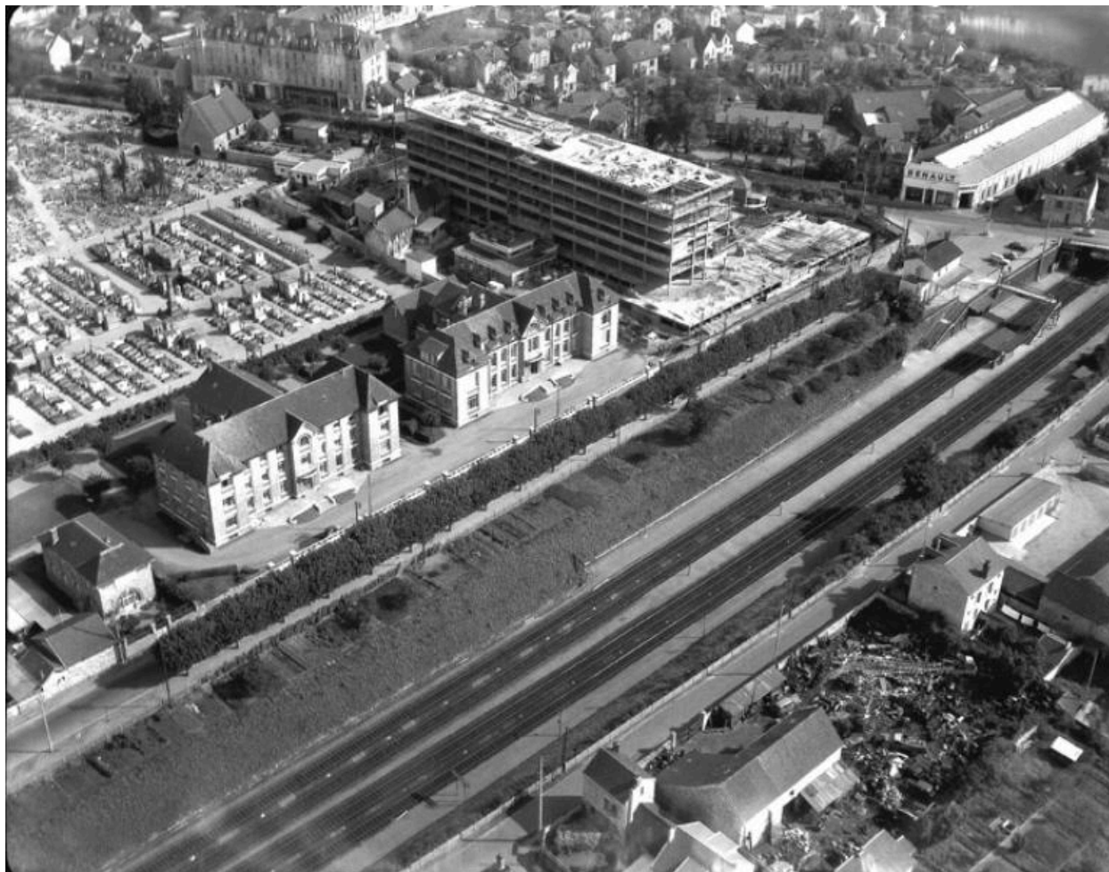
Les bâtiments construits par Raymond Marabout dans les années 30. A droite le pavillon de chirurgie, à gauche la maternité. (Fonds Bertin).