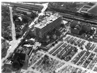
Le bloc médico-chirurgical en cours de construction. (Fonds Bertin).