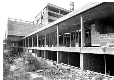
Le bâtiment des consultations au premier plan. (Fonds Bertin)