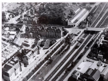
Vue d'ensemble de l'hôpital avant l'intervention de Lopez. On voit bien la composition de l'hôpital de 1854 avec trois pavillons reliés par deux ailes. CREDOP. .

Phot. Laurent Kruszyk IVR11_20177800533NUC4A