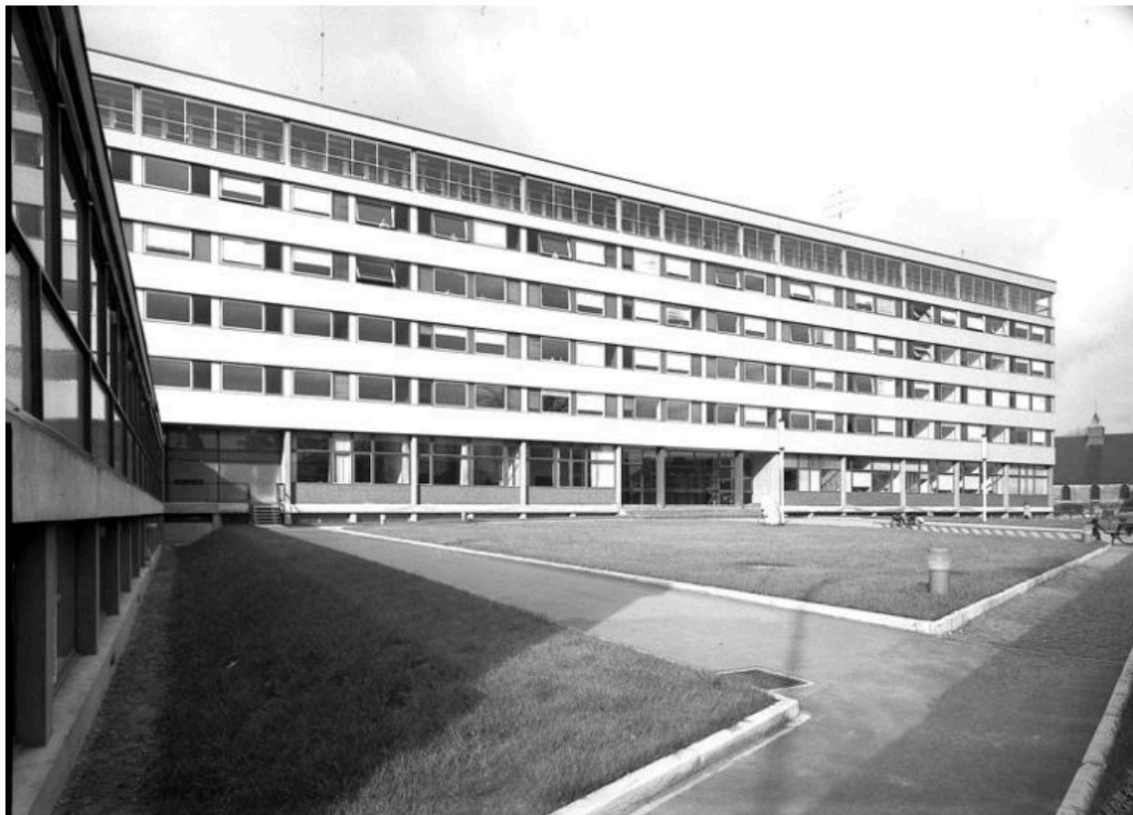
La façade principale du bloc donnant sur des carrés de pelouse.