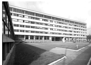
La façade principale du bloc donnant sur des carrés de pelouse.