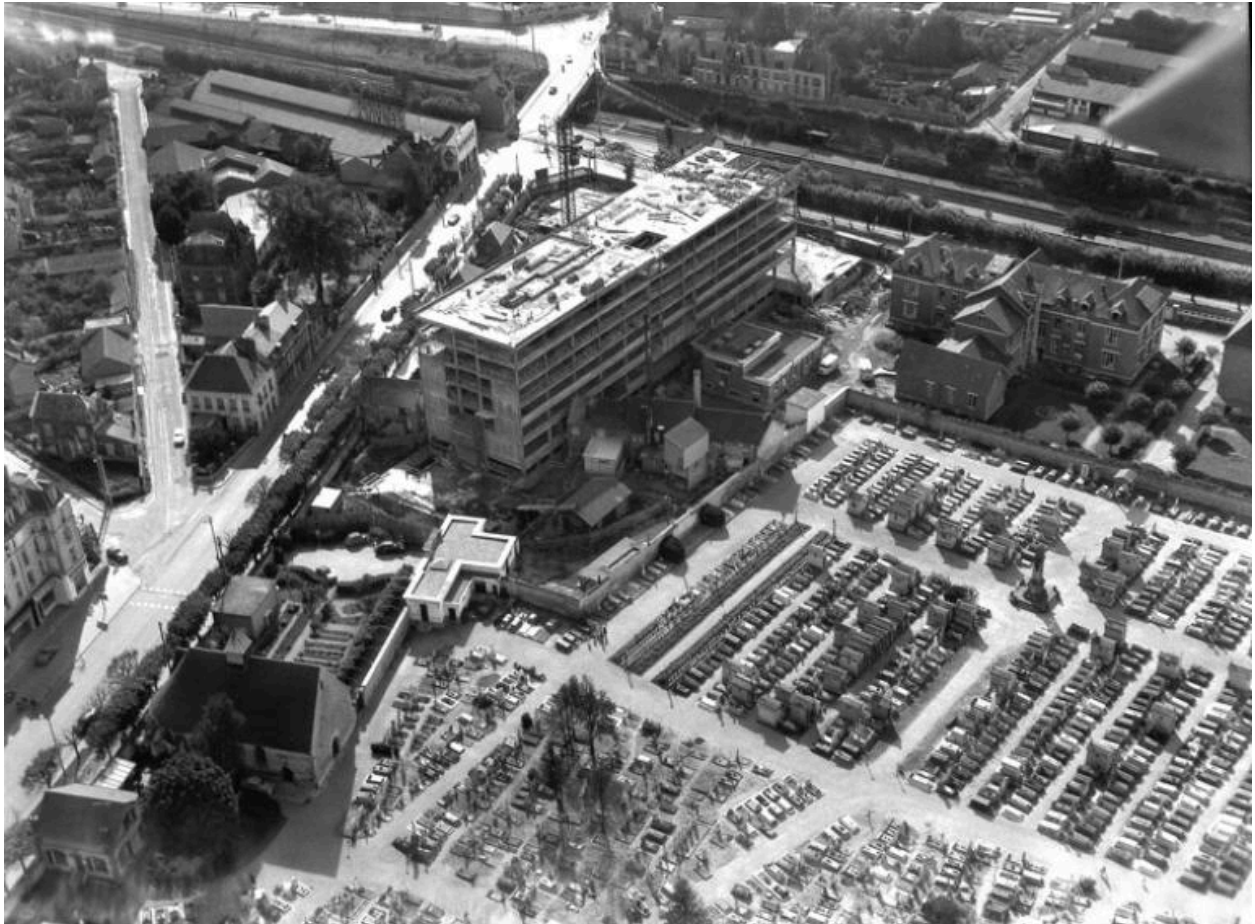
Le bloc médico-chirurgical en cours de construction.