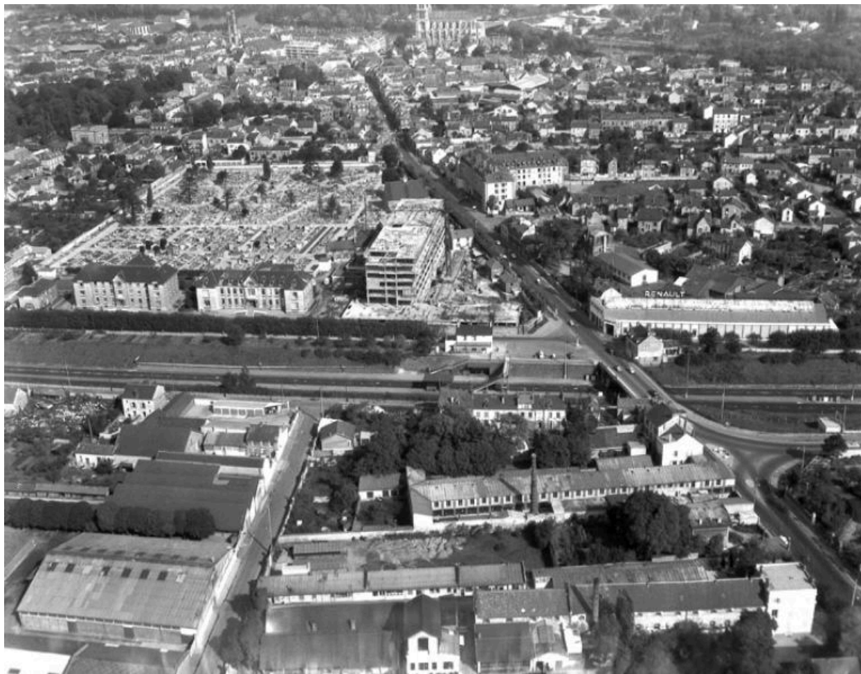
L'établissement à la fin des années 50. On voit la reconstruction du bloc médico-chirurgical par Lopez.