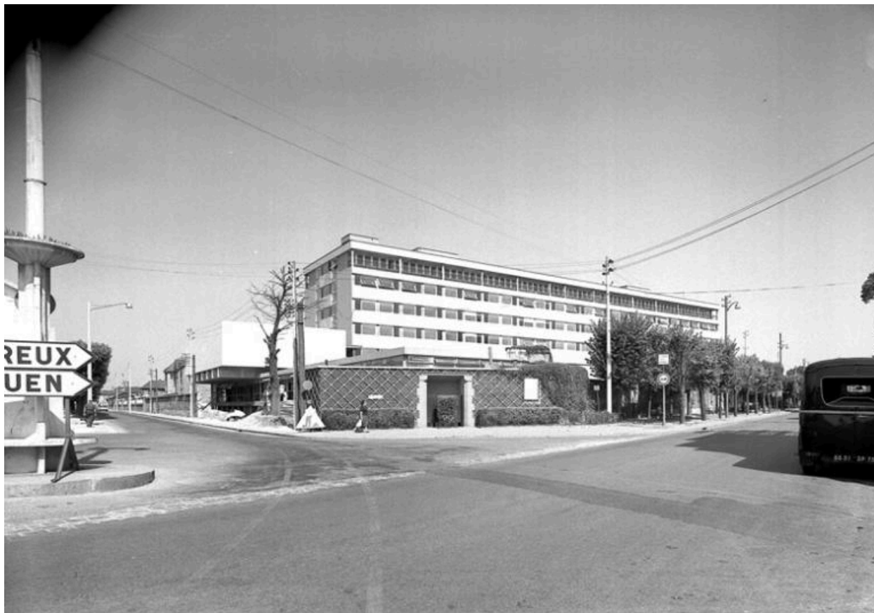
Vue d'ensemble de l'hôpital achevé.