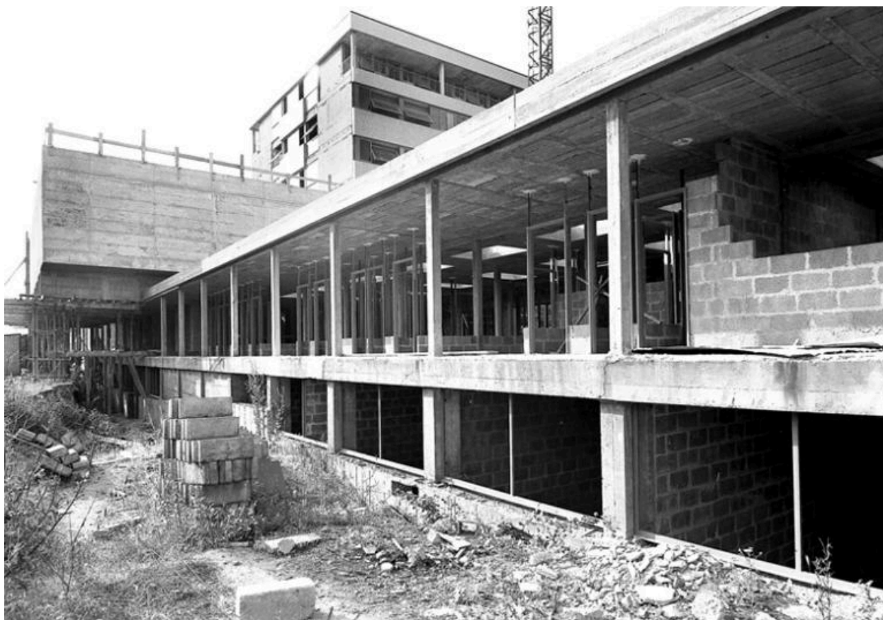
Le bâtiment des consultations au premier plan.