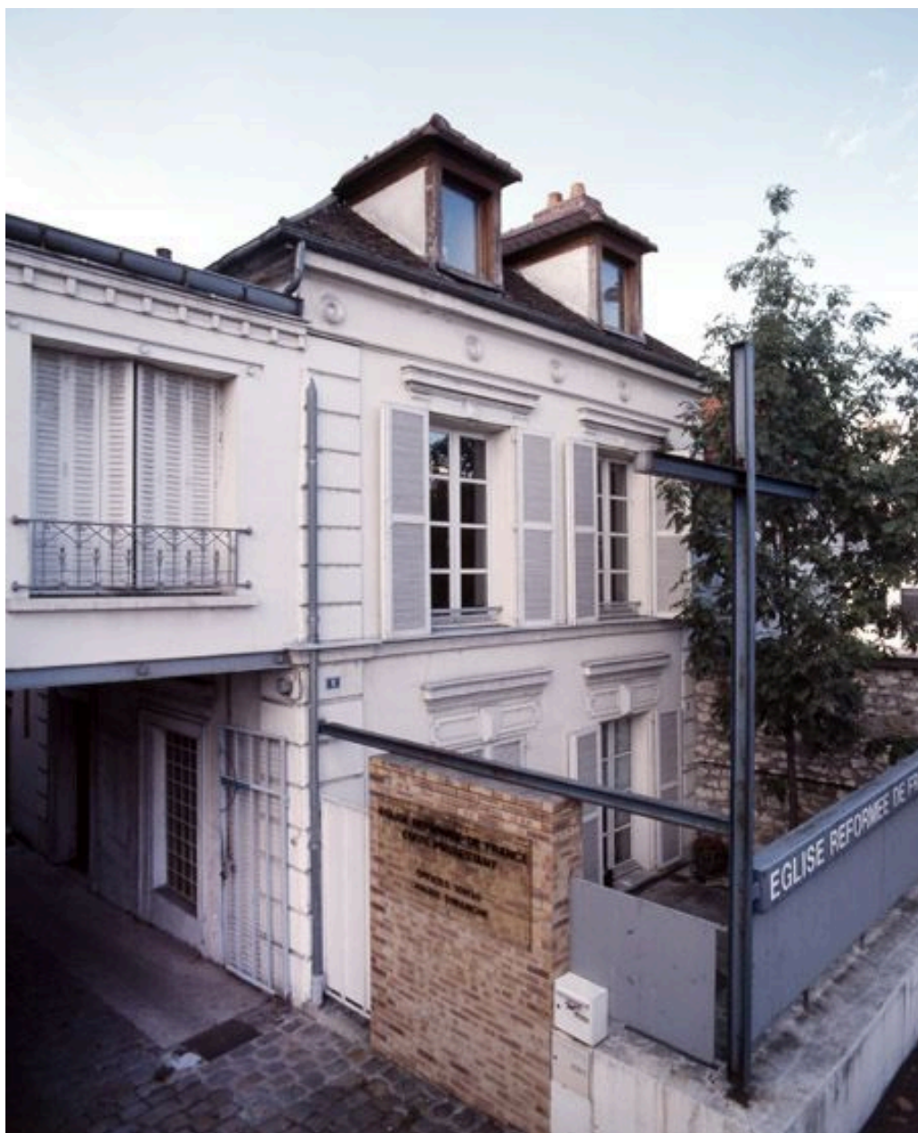
Maison servant actuellement de presbytère protestant : la façade sur l'avenue Thiers.