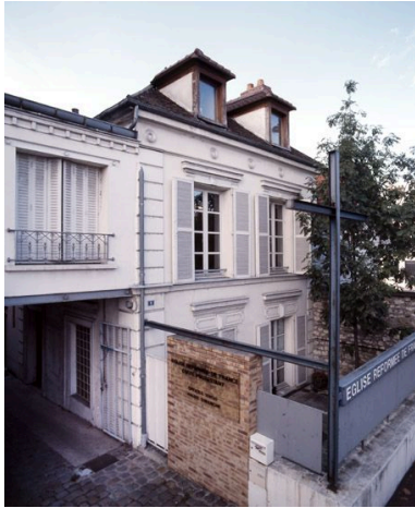
Maison servant actuellement de presbytère protestant : la façade sur l'avenue Thiers. IVR11_20057700476XA