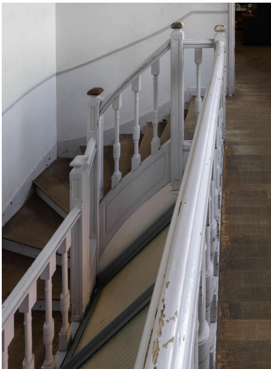
L'escalier principal, en bois peint.