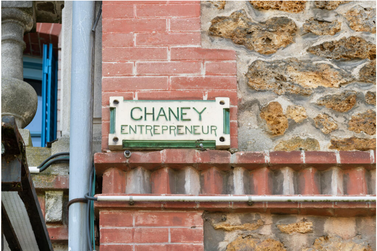
Corps latéral droit, plaque émaillée au nom de l'entrepreneur en maçonnerie, Chaney.