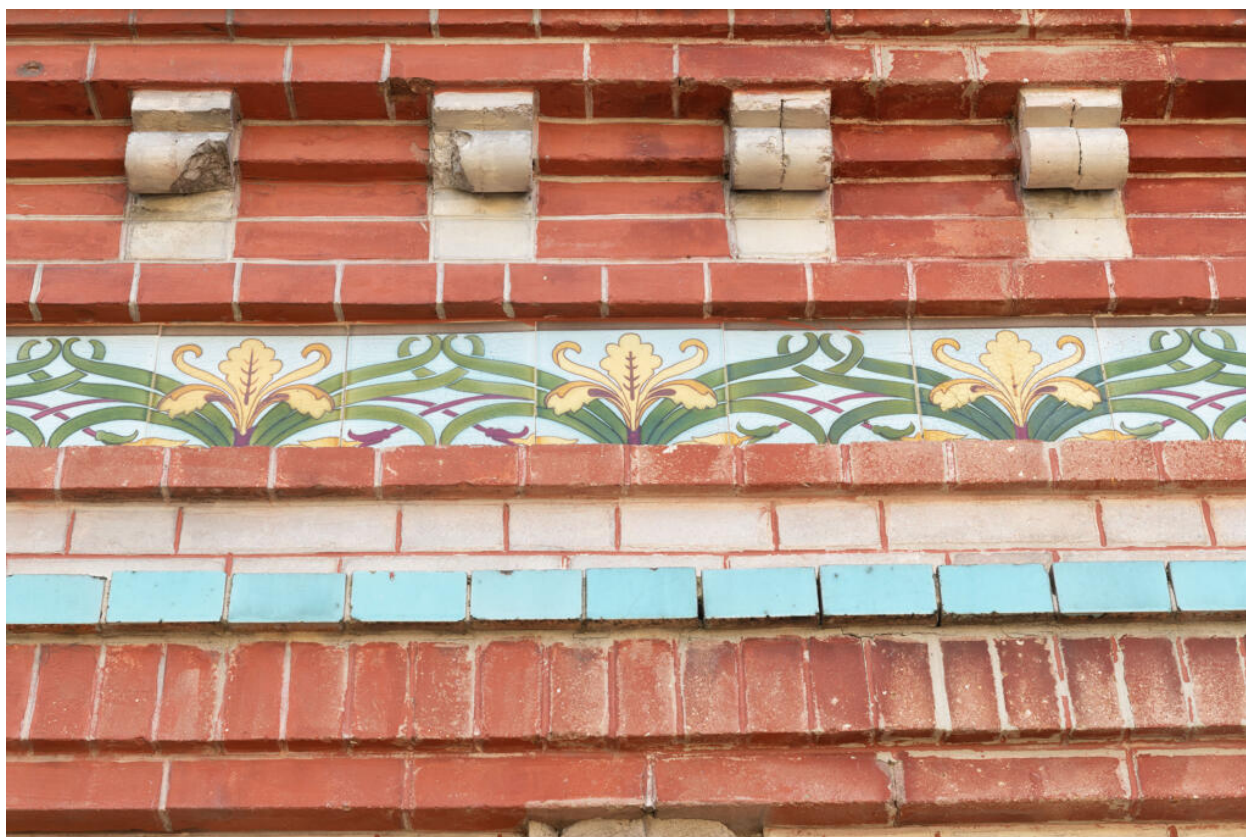
Détail de la frise en céramique émaillée à décor d'iris d'eau qui court sur la façade antérieure.