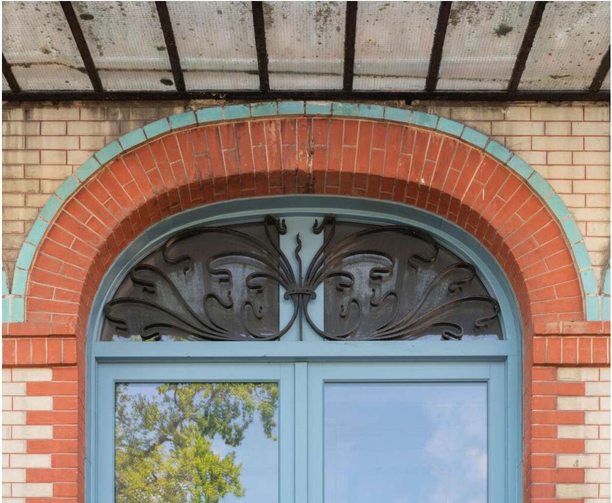
Détail de la ferronnerie en imposte de la porte principale. Son motif est encore Art nouveau.