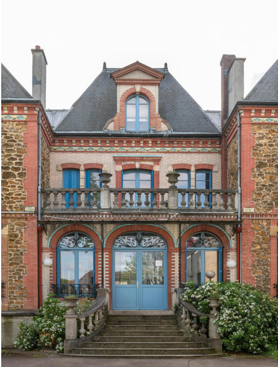
Détail du corps central, pourvu d'une terrasse.