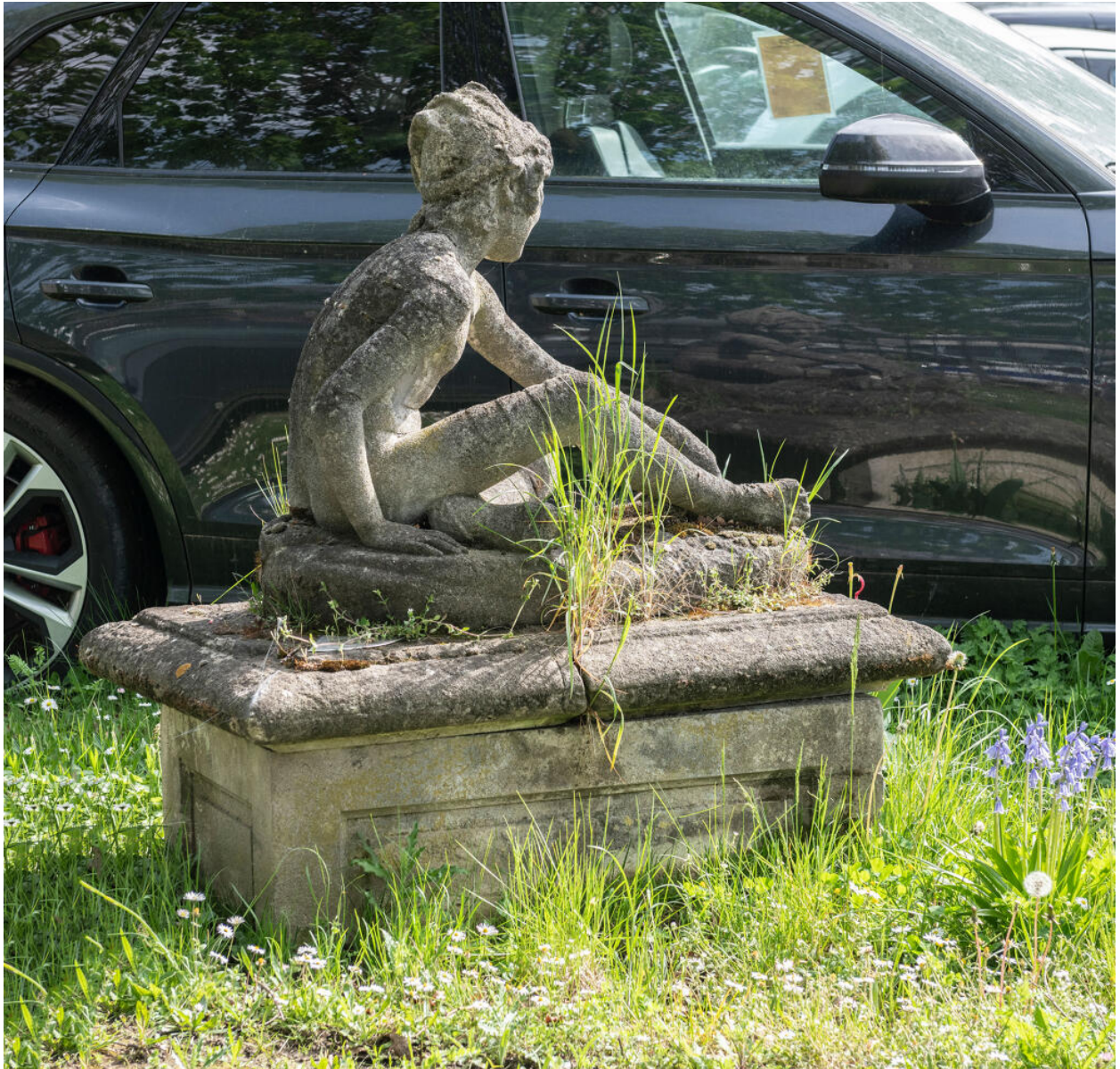
Souvenir du jardin qui entourait la maison : une copie du célèbre Tireur d'épine.