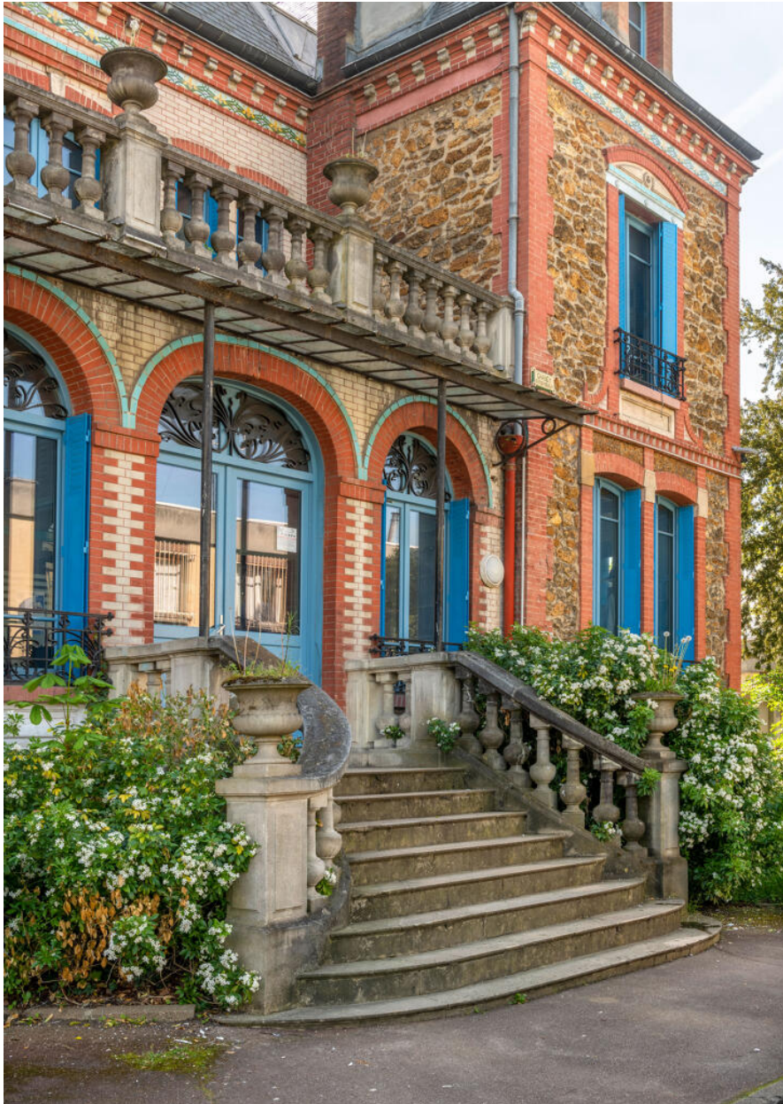
Détail du perron.