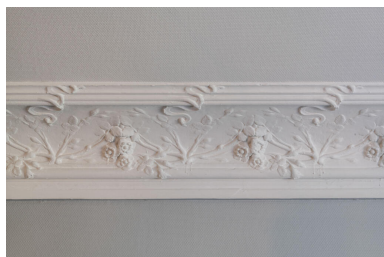
Quelques corniches stuguées sont conservées.