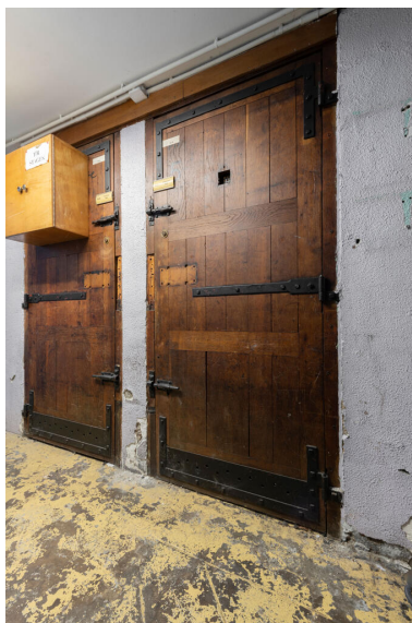
Au sous-sol, les caves ont servi de prison sous l'Occupation.