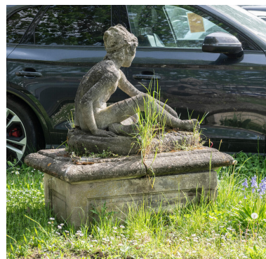
Souvenir du jardin qui entourait la maison : une copie du célèbre Tireur d'épine. IVR11_20249300087NUC4A