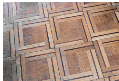
Parquet marqueté. IVR11_20249300091NUC4A