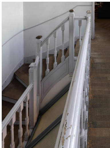
L'escalier principal, en bois peint. IVR11_20249300088NUC4A