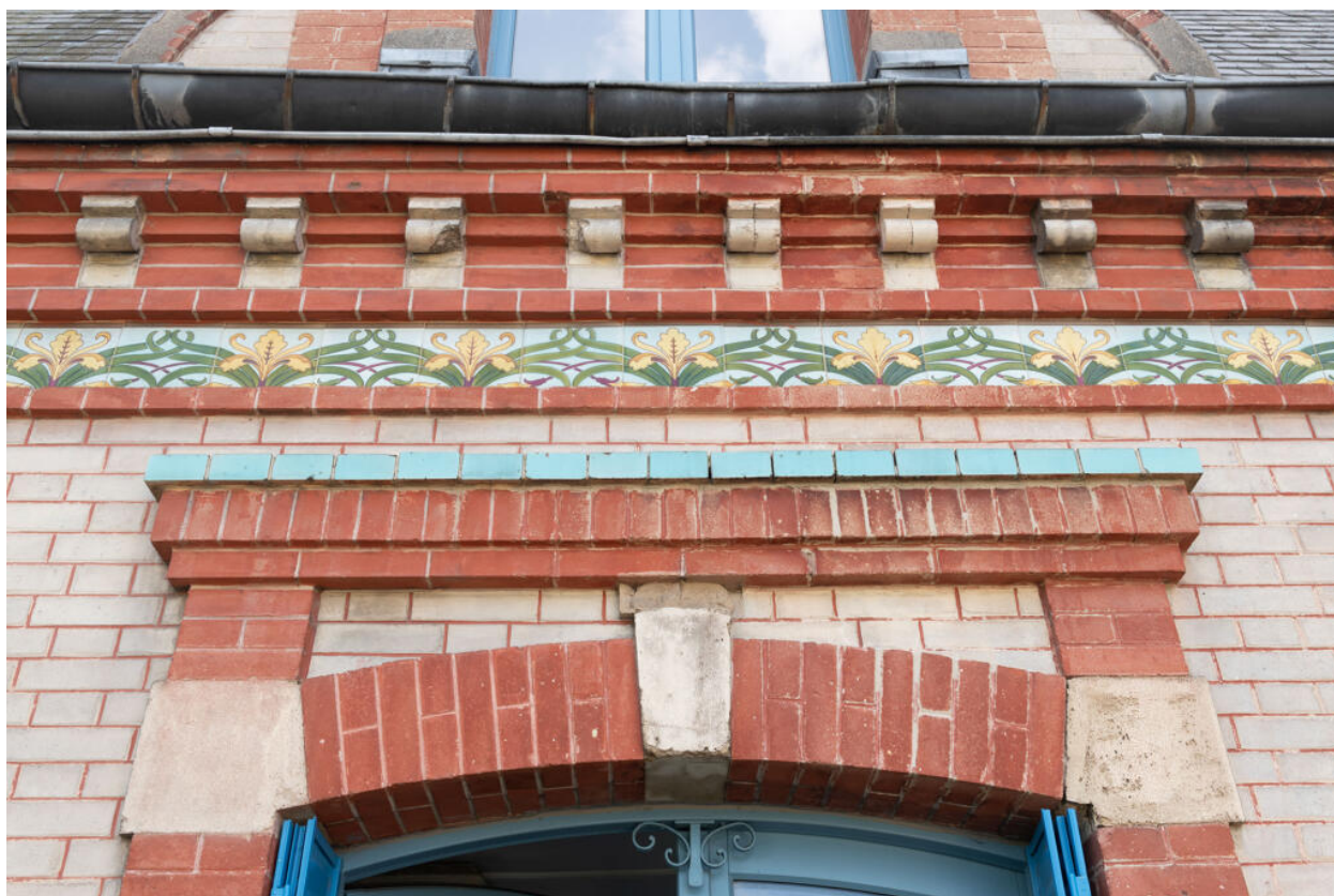
Détail de la fenêtre centrale du premier étage.