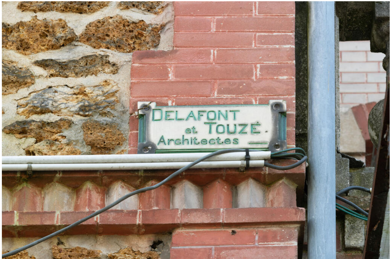
Corps latéral gauche, plaque émaillée au nom des deux architectes, Delafont et Touzé.