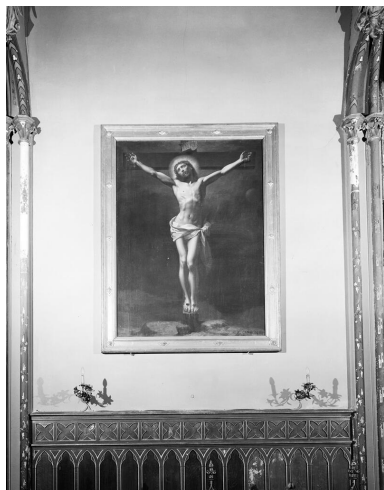
Vue d'ensemble. Tableau : Christ en croix IVR11_19979101045V