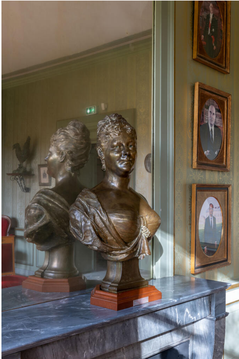
Buste de Juliette Adam. La signature de Bernstamm, située sur l'étoile du modèle, au premier plan à gauche, est à moitié effacée.