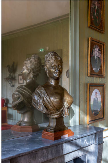
Buste de Juliette Adam. La signature de Bernstamm, située sur l'étole du modèle, au premier plan à gauche, est à moitié effacée.