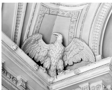
Décor du vestibule d'honneur : détail d'un aigle en ronde-bosse.

IVR11_19907800241X