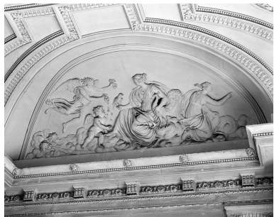
Décor du vestibule d'honneur : Junon symbole de l'air. Ensemble (4 reliefs).

IVR11_19907800243X