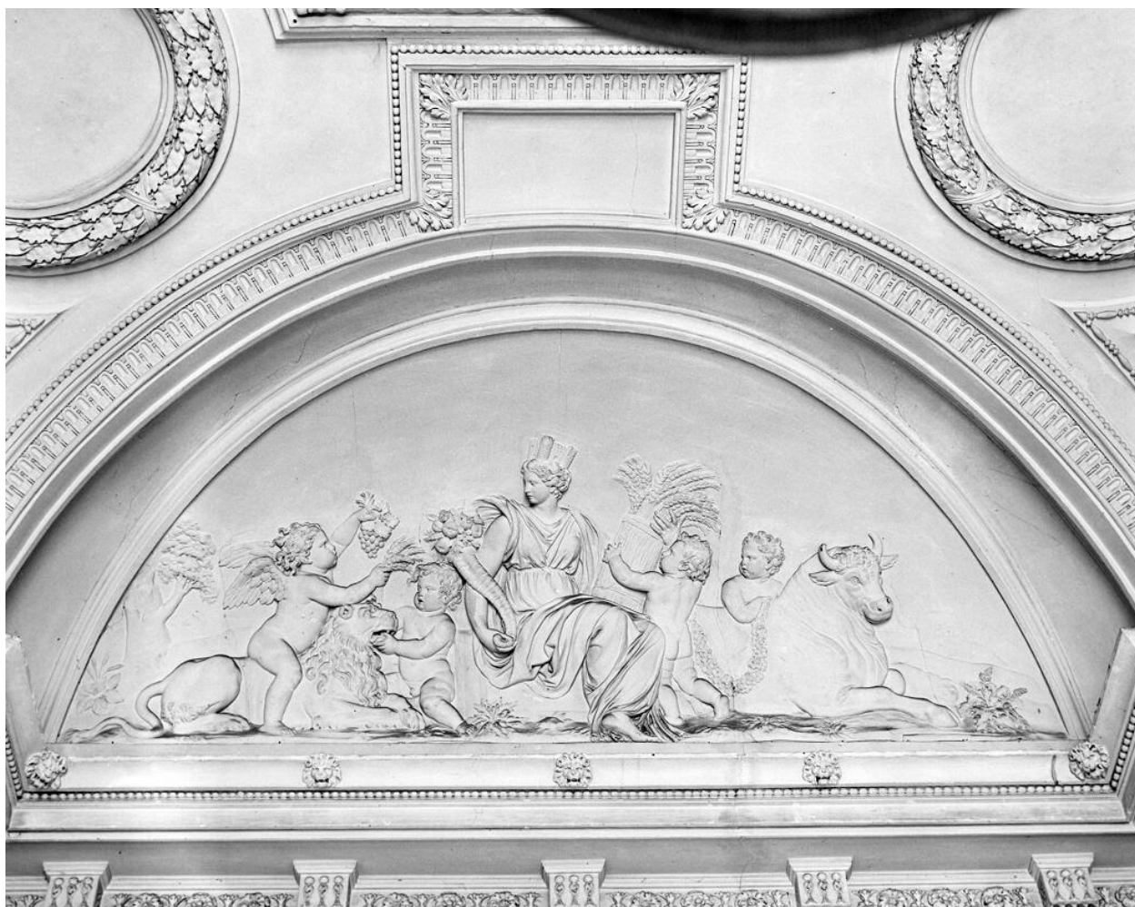
Décor du vestibule d'honneur : Cybèle, symbole de la terre. Ensemble (4 reliefs).