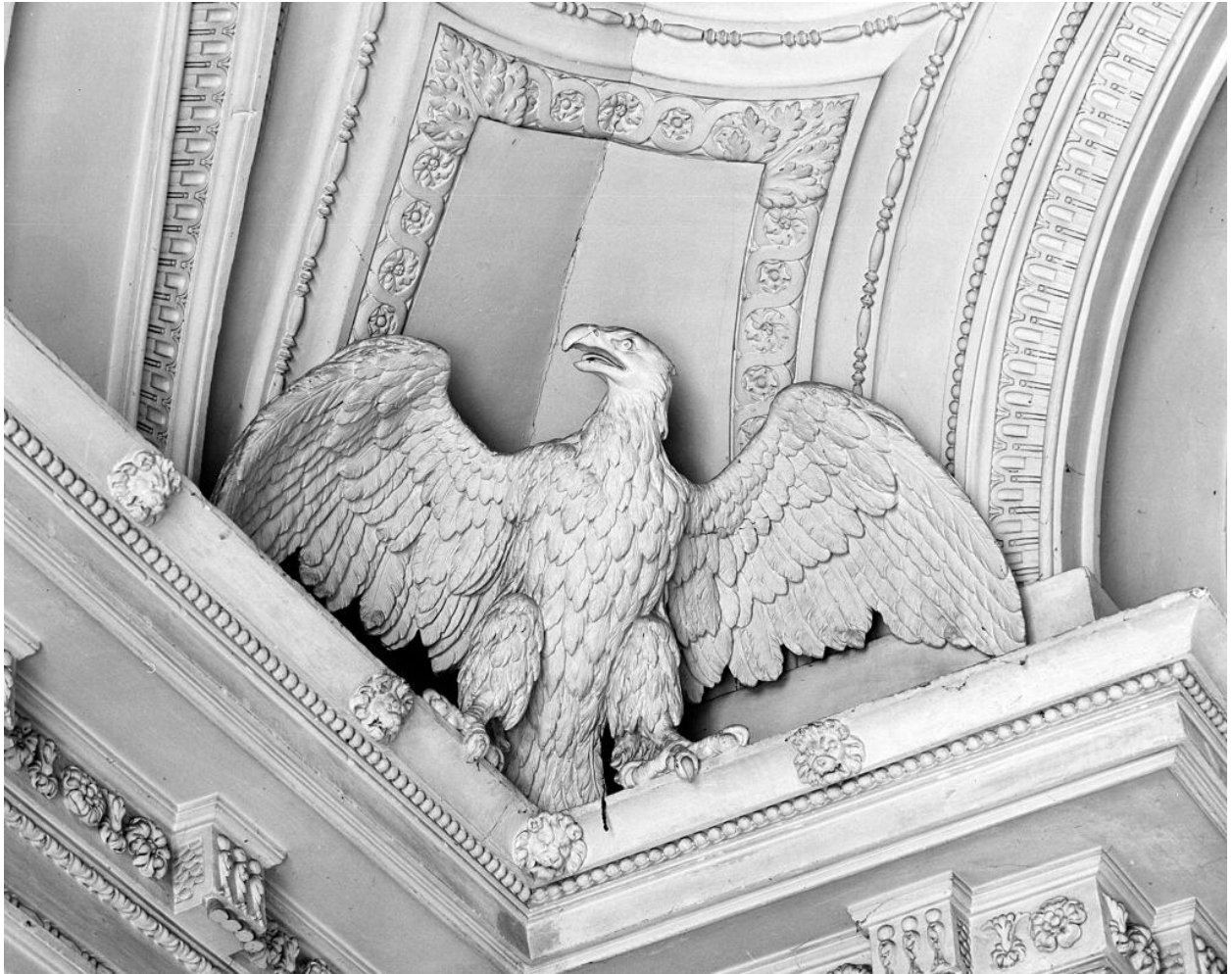
Décor du vestibule d'honneur : détail d'un aigle en ronde-bosse.