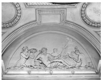
Décor du vestibule d'honneur : Neptune, symbole de l'eau. Ensemble (4 reliefs).

IVR11_19907800242X