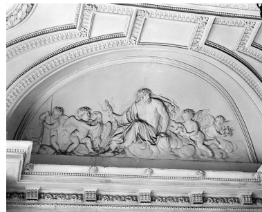
Décor du vestibule d'honneur : Jupiter, symbole du feu. Ensemble (4 reliefs).

Phot. Vialles Jean-Bernard IVR11_19907800240X