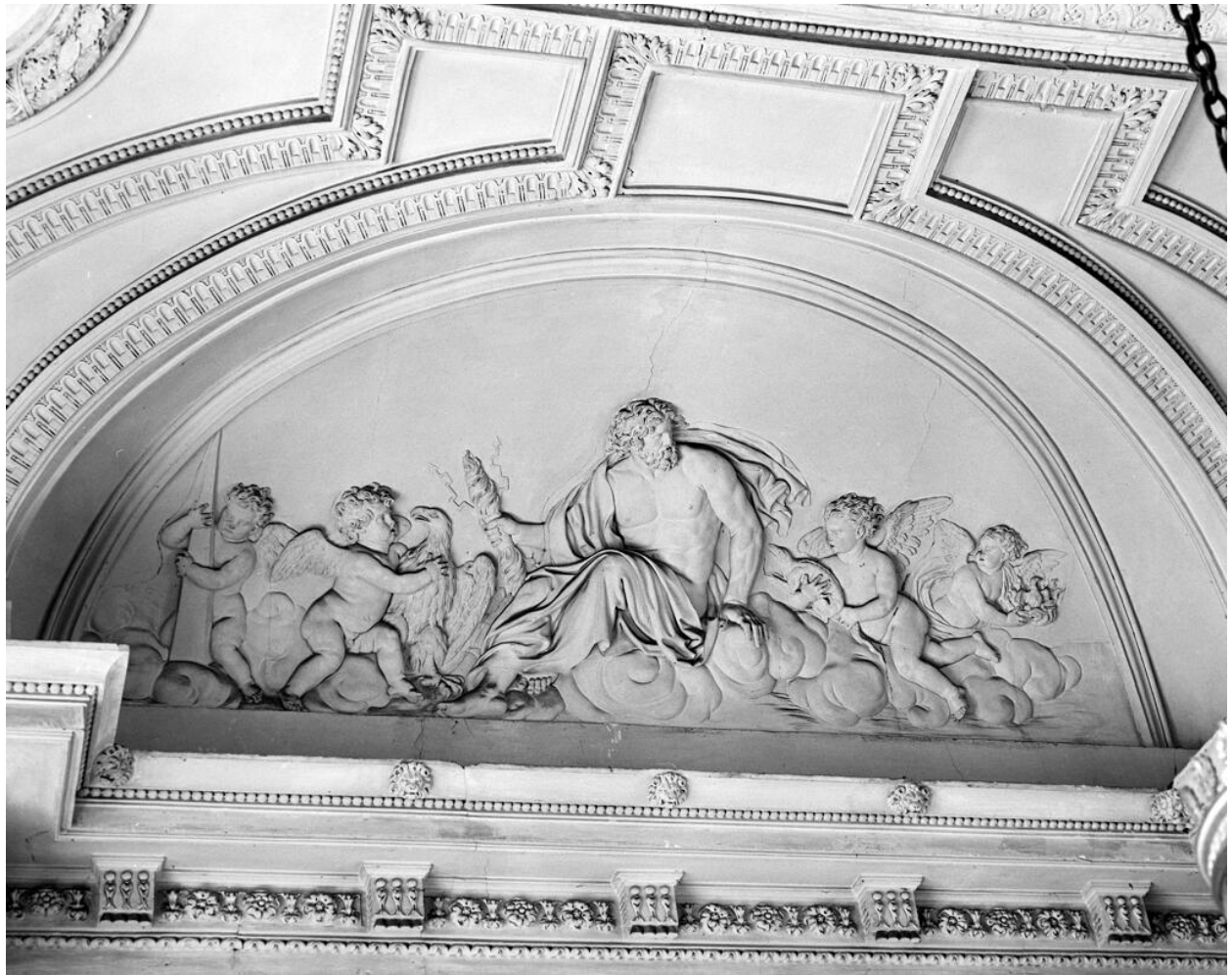
Décor du vestibule d'honneur : Jupiter, symbole du feu. Ensemble (4 reliefs).