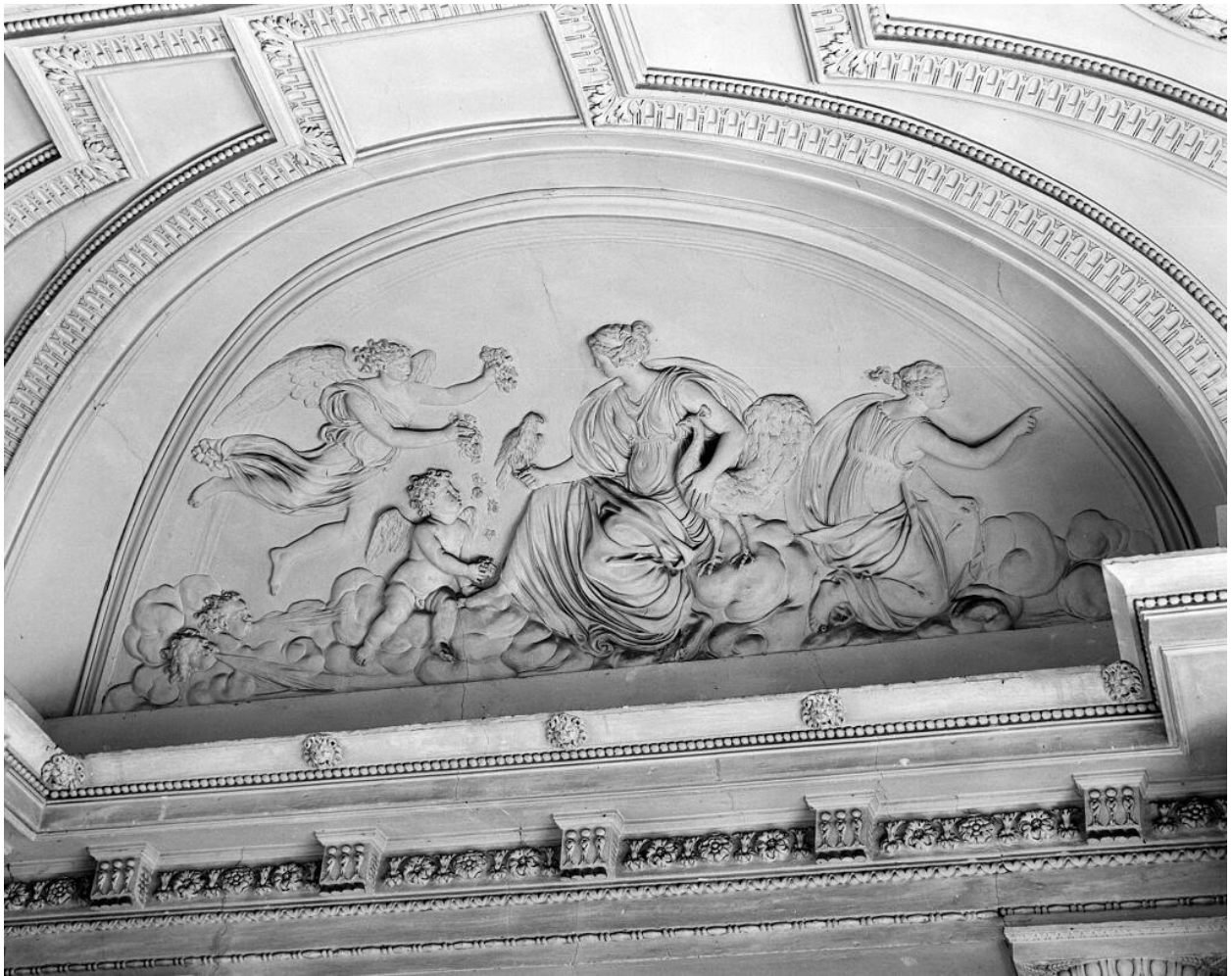
Décor du vestibule d'honneur : Junon symbole de l'air. Ensemble (4 reliefs).