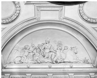
Décor du vestibule d'honneur : Cybèle, symbole de la terre. Ensemble (4 reliefs).

Phot. Vialles Jean-Bernard IVR11_19907800243X