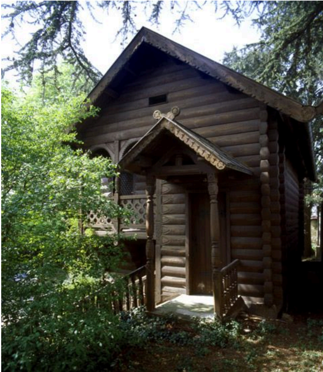
Détail de l'entrée.