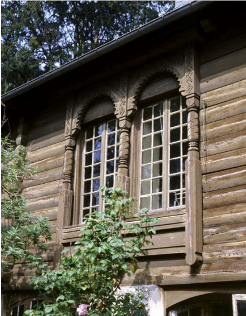
Détail d'une baie géminée sculptée.