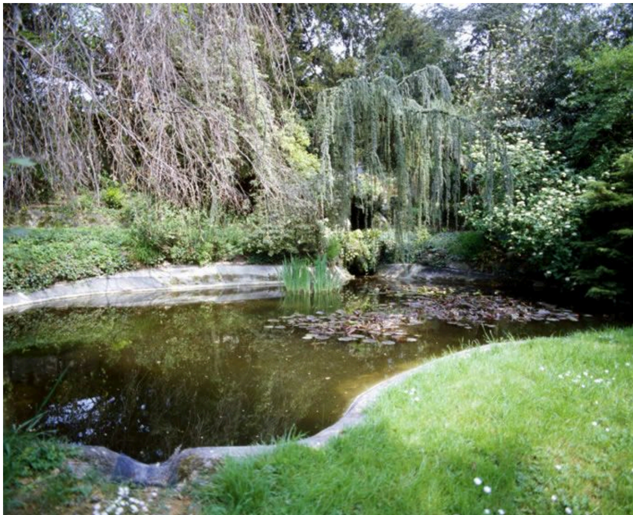
Pièce d'eau dans le jardin.