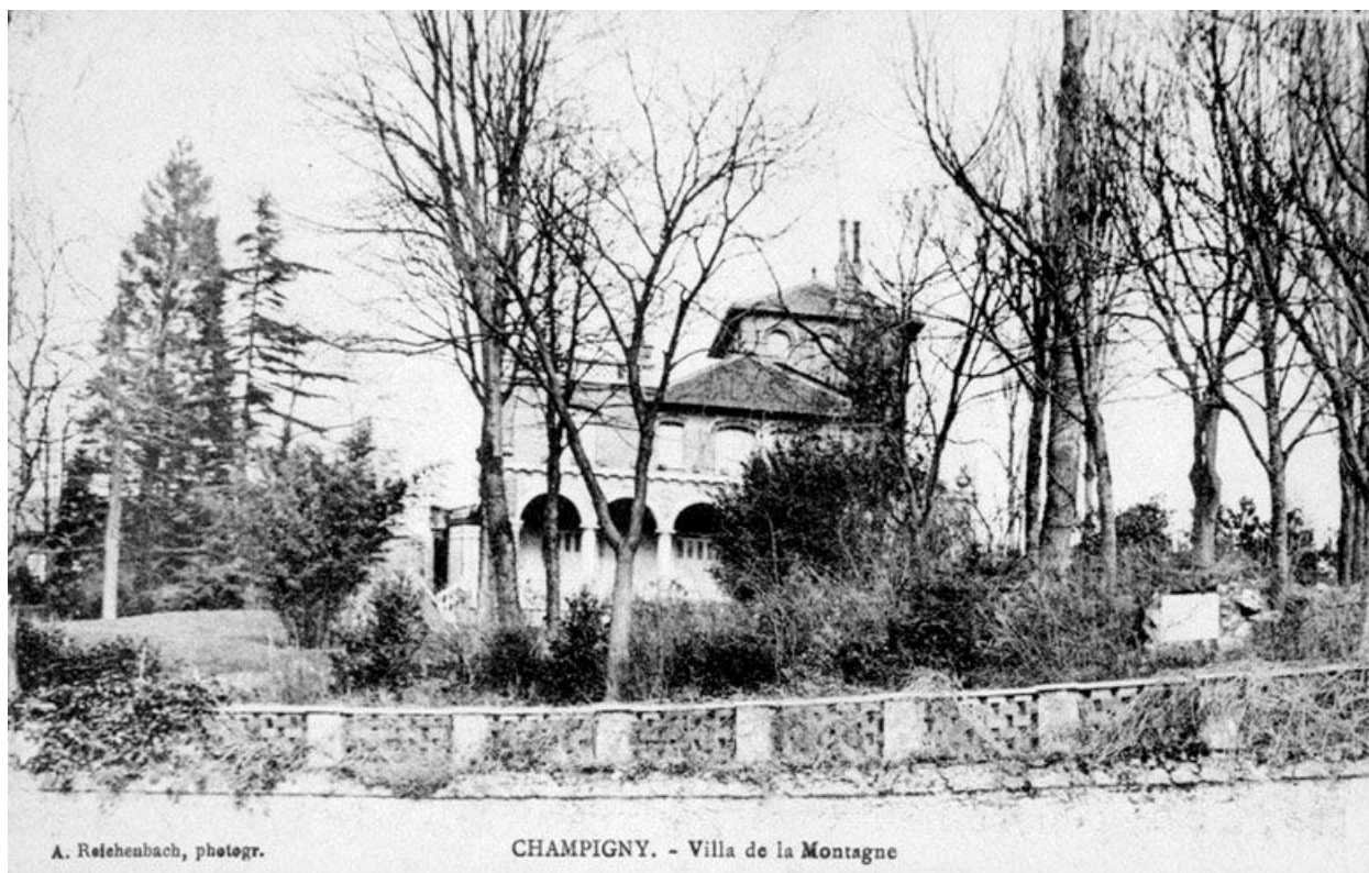
Vue de la villa depuis la route. Carte postale.