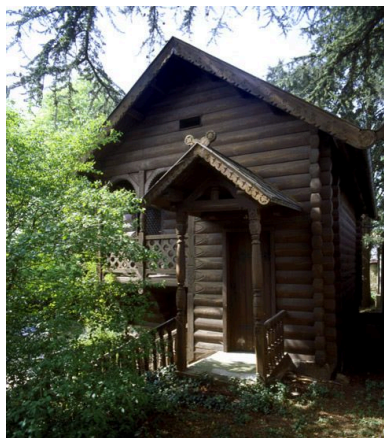
Détail de l'entrée.