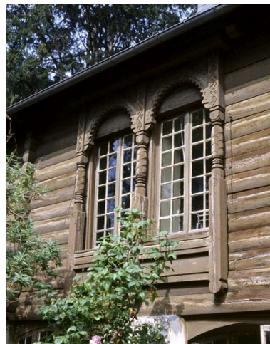
Détail d'une baie géminée sculptée.