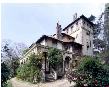
Vue générale de la villa. IVR11_20079400277VA