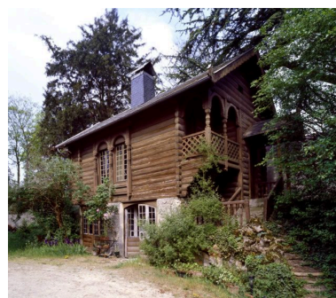
Le pavillon scandinave construit par Charles Garnier pour la section de "L'Histoire de l'habitation humaine" sur le Champs de Mars à l'Exposition universelle de 1889.