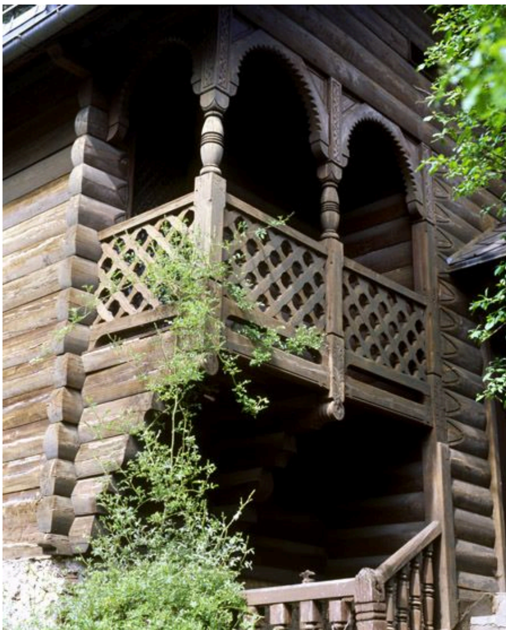
Détail de la galerie du pavillon.