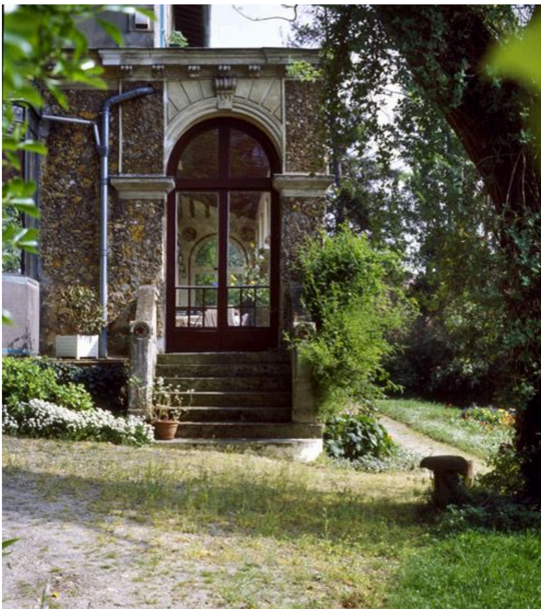
Extrémité ouest de la galerie.