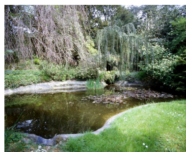
Pièce d'eau dans le jardin. IVR11_20079400282XA