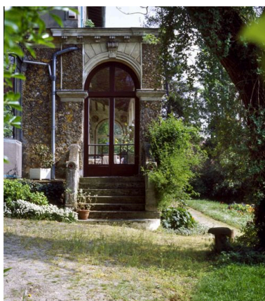
Extrémité ouest de la galerie. IVR11_20079400279XA