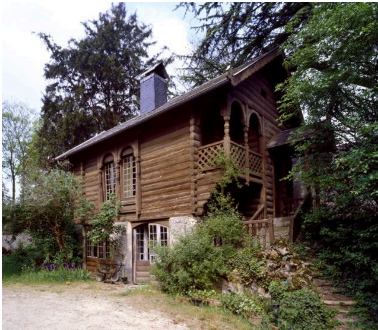
Le pavillon scandinave construit par Charles Garnier pour la section de "L'Histoire de l'habitation humaine" sur le Champs de Mars à l'Exposition universelle de 1889.