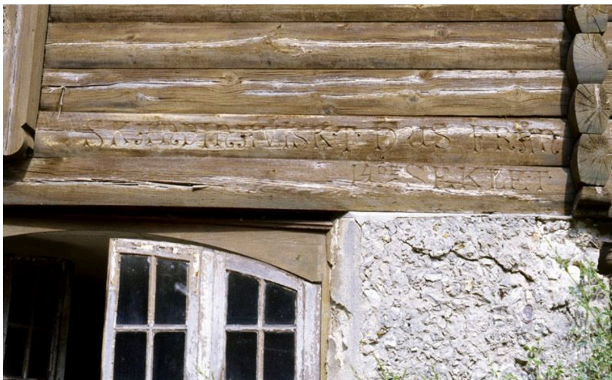
Inscription au-dessus du soubassement.