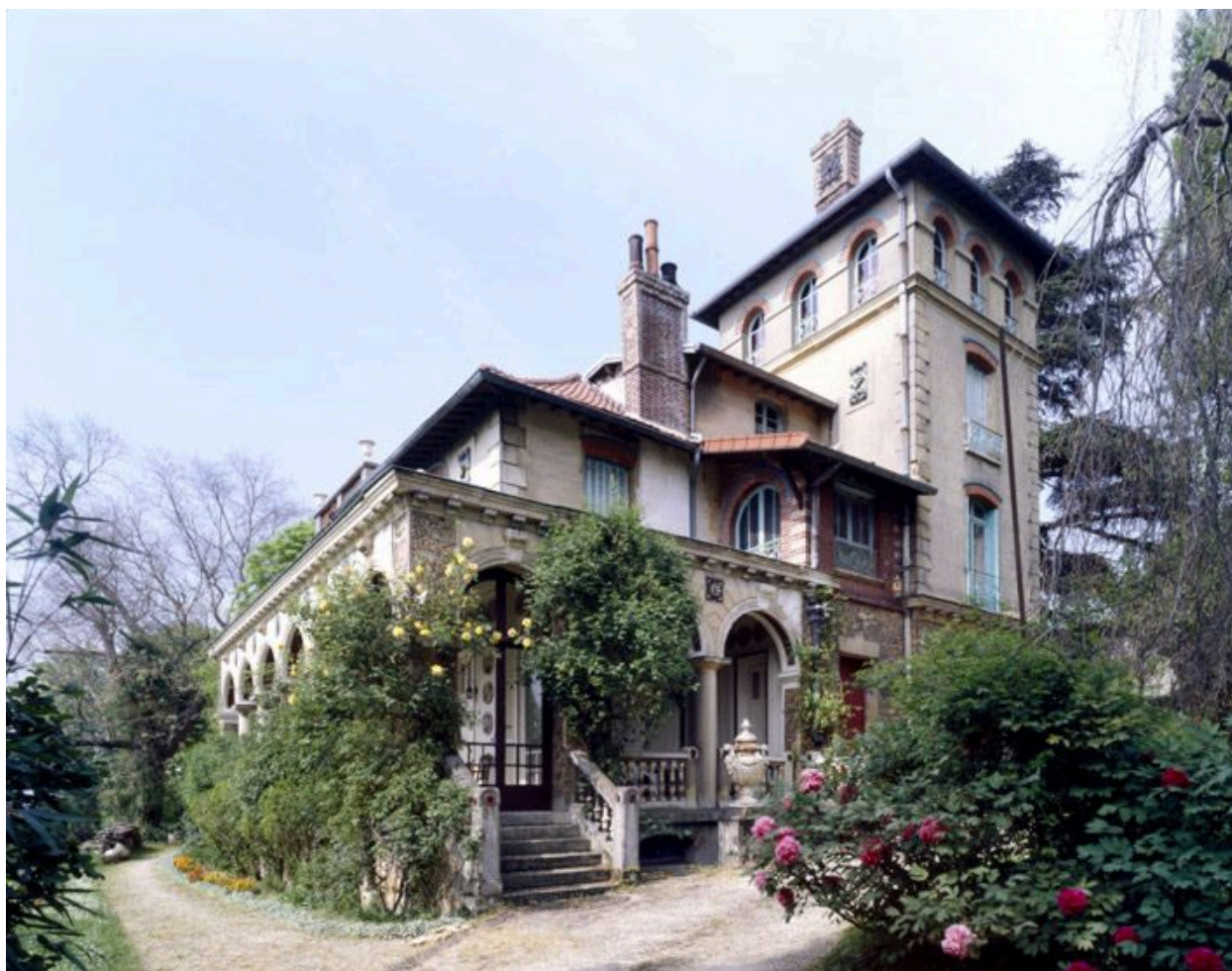
Vue générale de la villa.