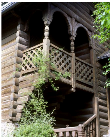
Détail de la galerie du pavillon.