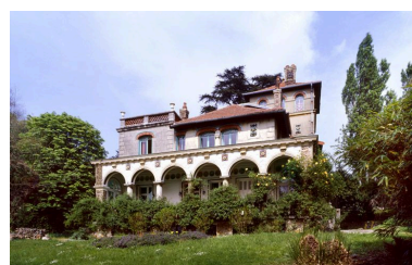
Vue générale de la façade sud où se lisent les quatre volumes principaux de la maison, constituée d'une galerie, un corps de logis flanqué d'une aile latérale, et une tour belvédère à l'arrière. IVR11_20079400275VA