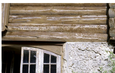
Inscription au-dessus du soubassement.