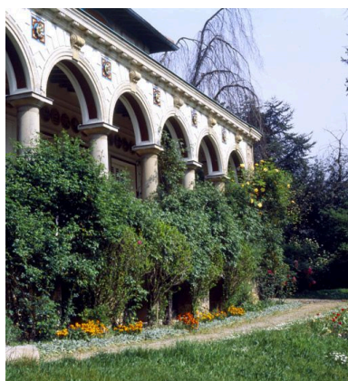
La galerie, qui domine la vue sur la Marne, orientée sud-ouest, a reçu un intéressant décor. Sous une corniche à modillons et denticules sont placés des cabochons en céramique émaillée, qui ponctuent les arcades en plein cintre.