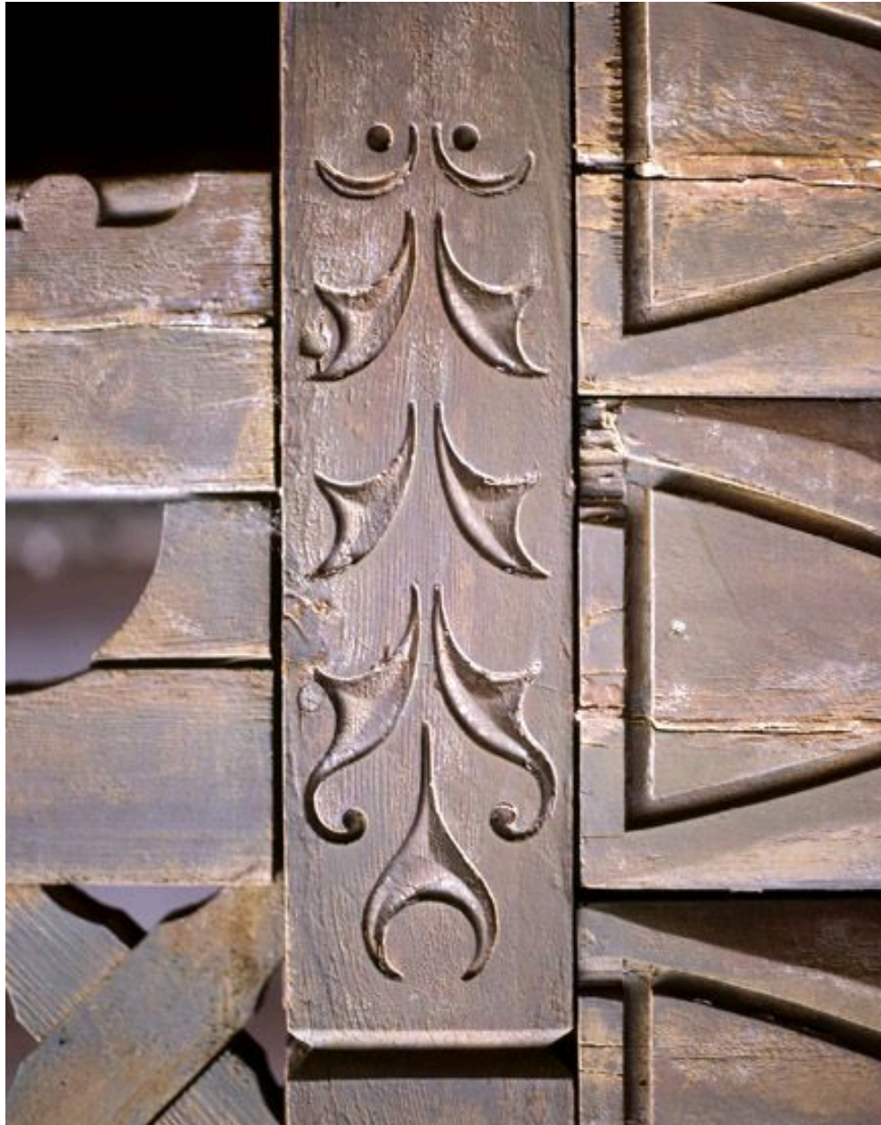
Détail sculpté du chambranle de la porte.