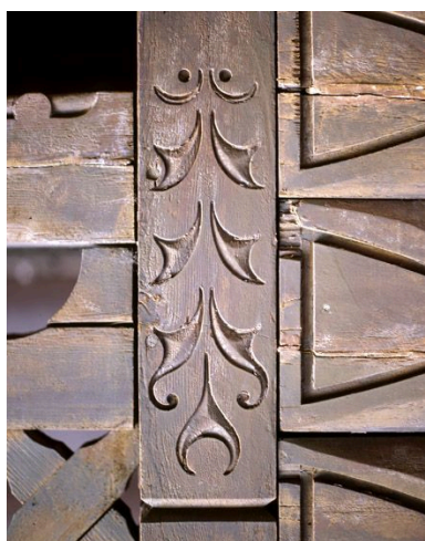
Détail sculpté du chambranle de la porte.