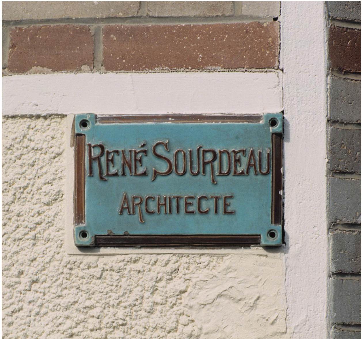
Plaque de René Sourdeau, architecte communal de 1922 à 1931.