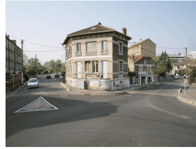
Vue d'ensemble. IVR11_20029100457XA