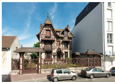
La façade sur rue de la maison est restée dans son état initial, de même que la barrière et le portail. IVR11_20177800357NUC4A