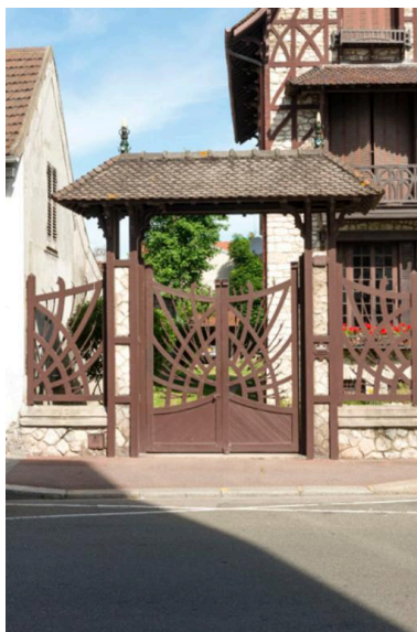
Le portail d'entrée a conservé son décor en pitchpin et ses épis de faîtage.