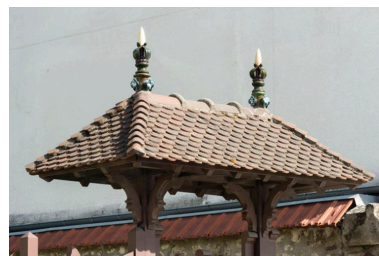
Les épis de faîtage proviennent des Mureaux. IVR11_20177800359NUC4A