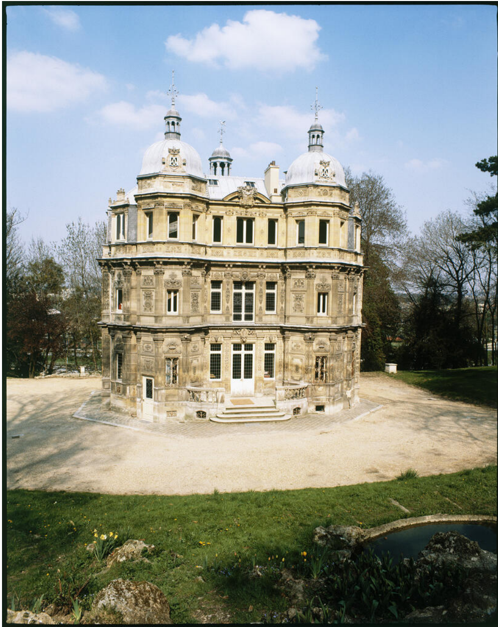
Façade du château.