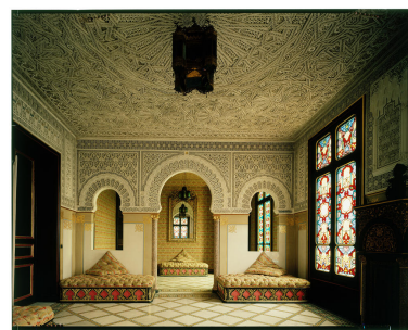
Le salon mauresque.