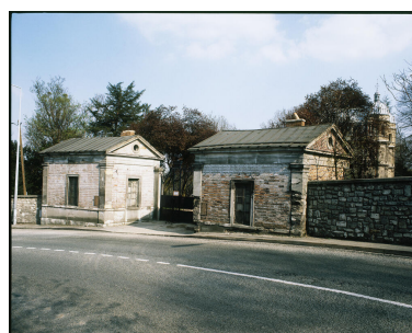
Pavillon et grille d'entrée du domaine. IVR11_19867800724XA