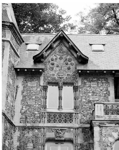
Détail avec un décor de fausse lucarne.