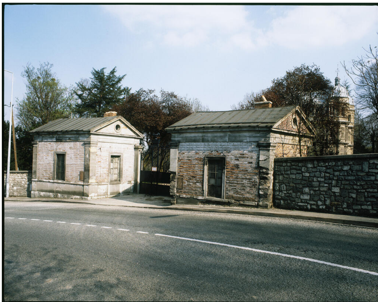
Pavillon et grille d'entrée du domaine.