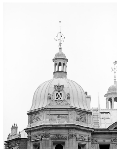
Décor de la couverture d'une tourelle du château. IVR11_19857801457X