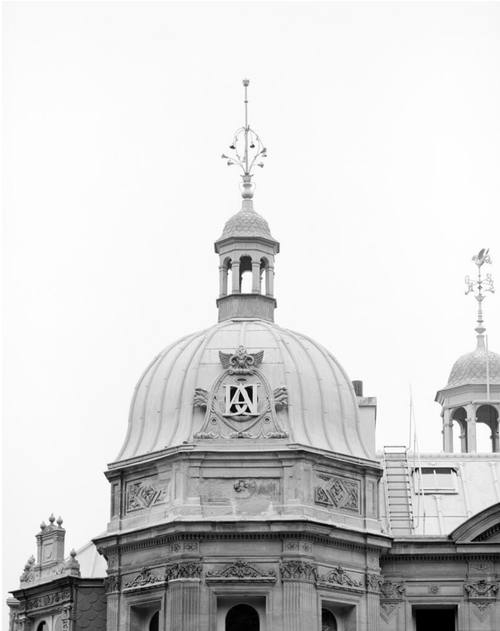
Décor de la couverture d'une tourelle du château.