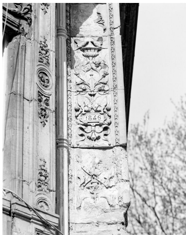
Détail d'un décor du château. La date d'achèvement du château y est inscrite.