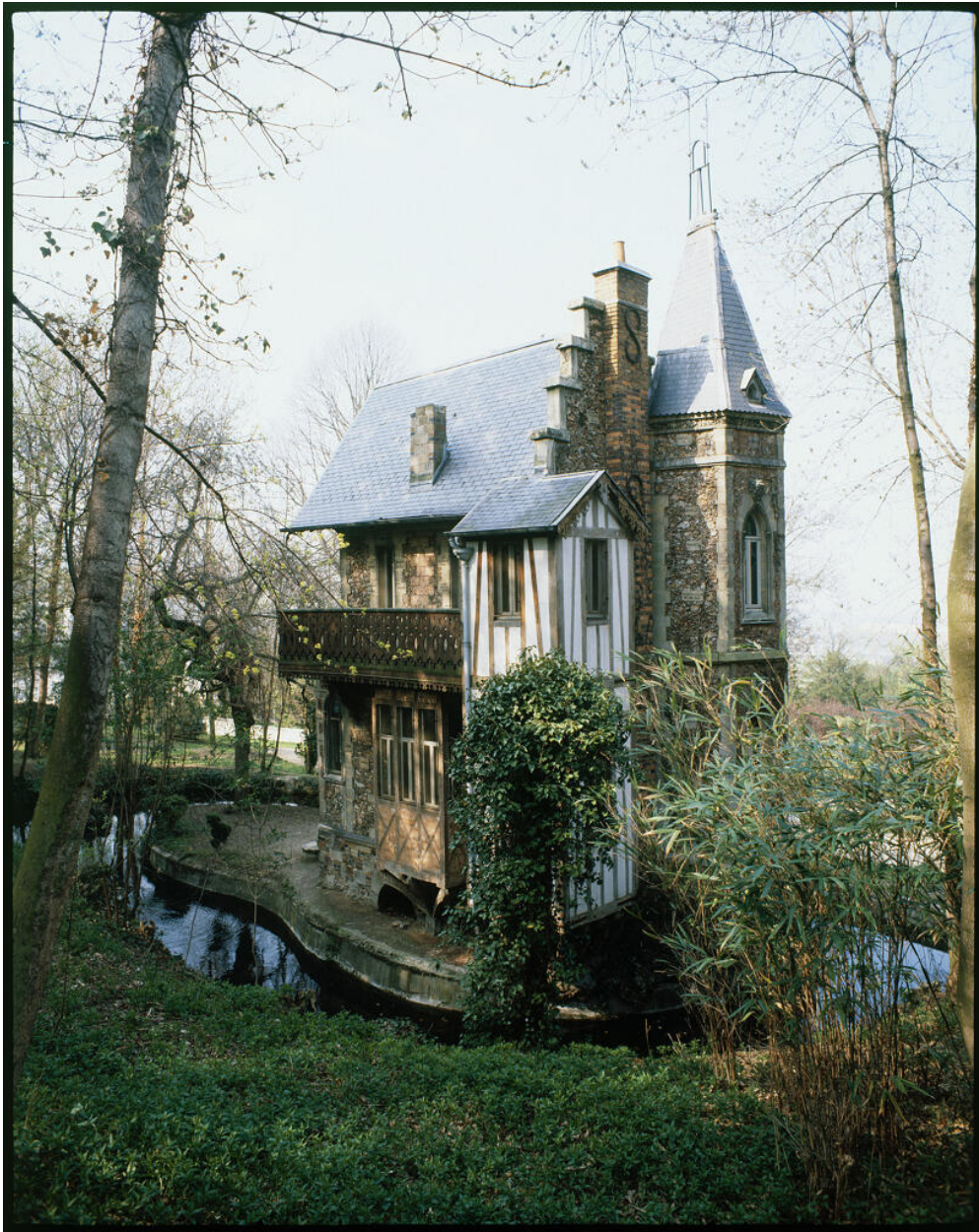
Façade arrière du château d'If, cabinet de travail d'Alexandre Dumas.