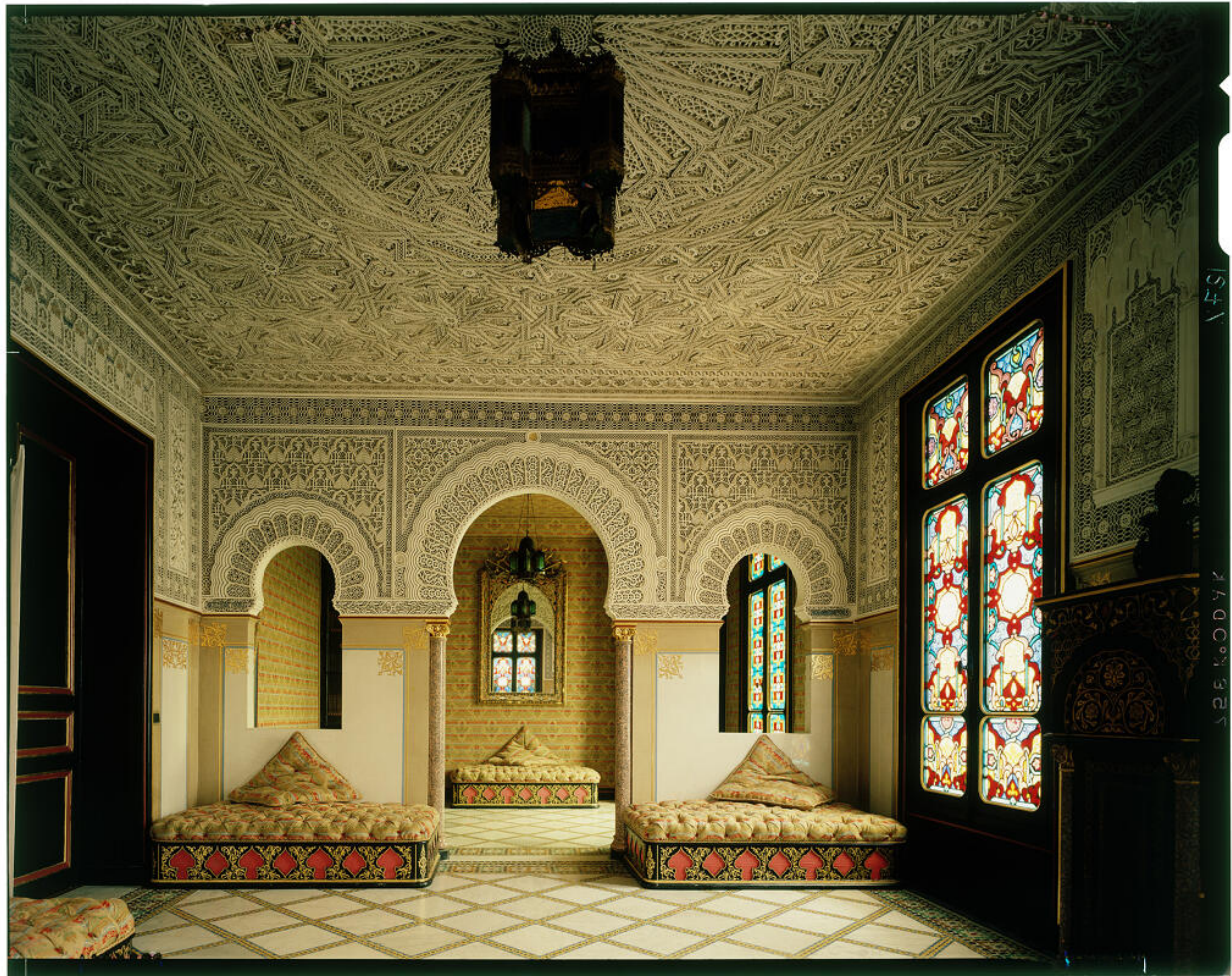
Le salon mauresque.