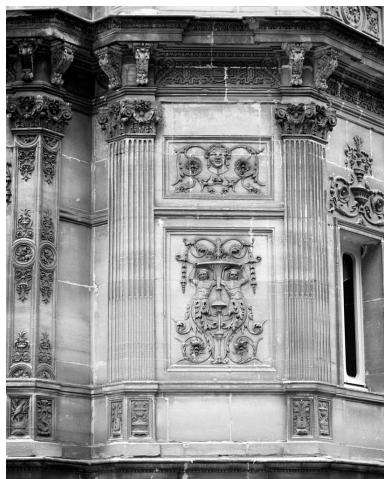
Détail d'un décor sur un panneau du château. IVR11_19857801455X