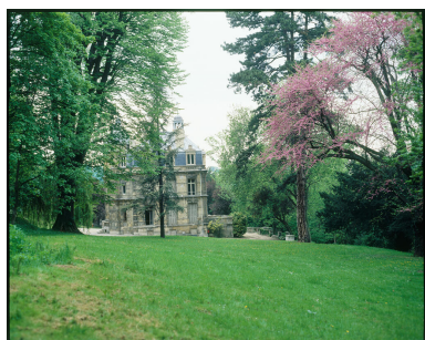
Le château vu du parc. IVR11_19867800936XA