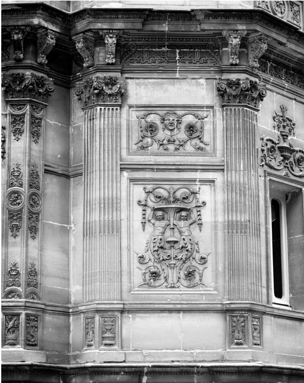
Détail d'un décor sur un panneau du château.