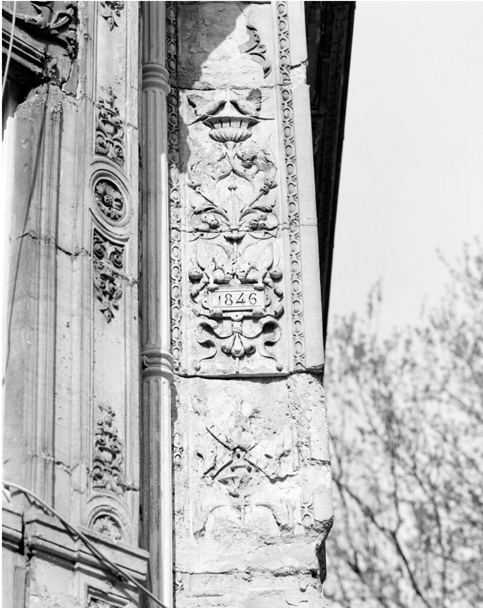
Détail d'un décor du château. La date d'achèvement du château y est inscrite.