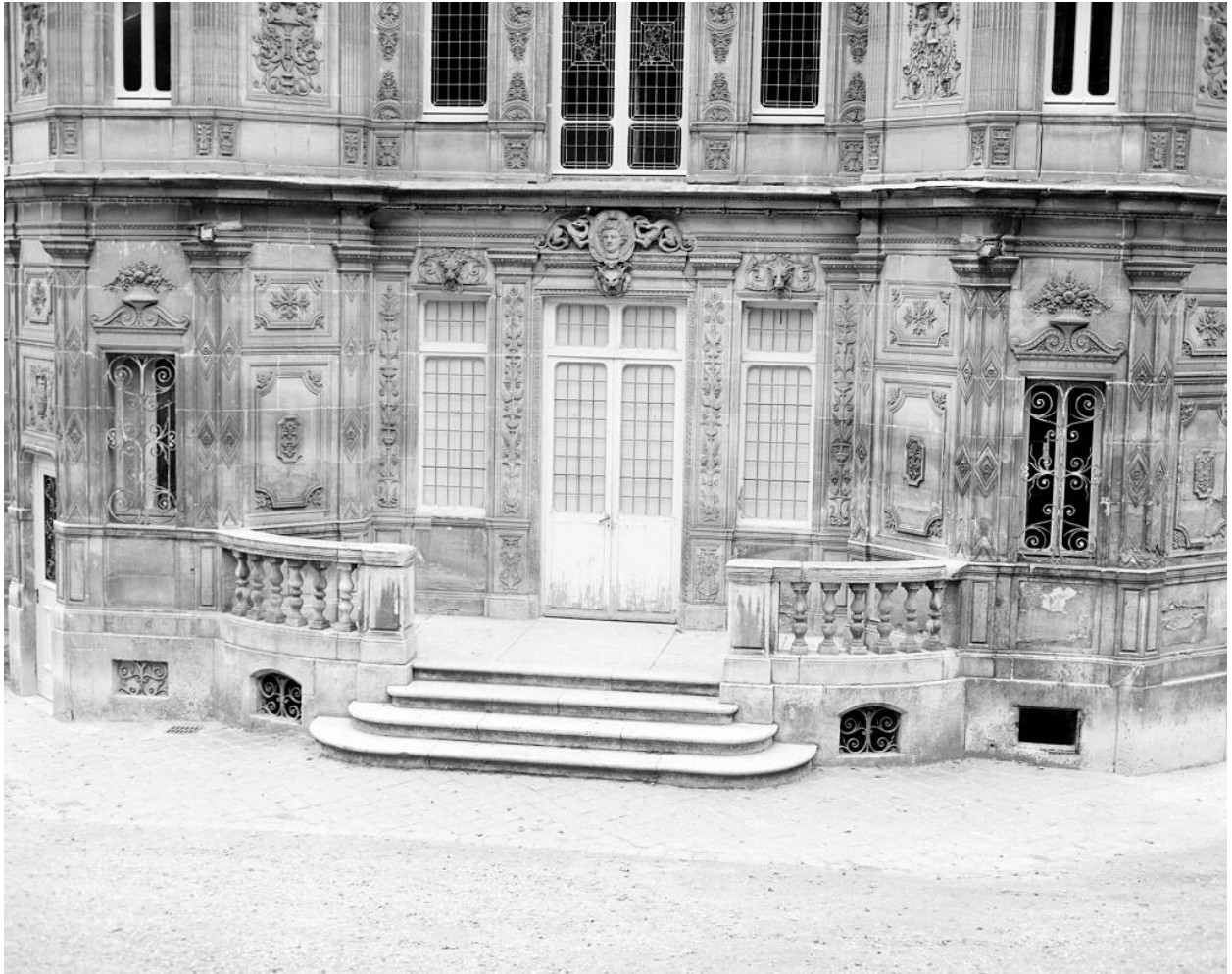
Le perron du château.