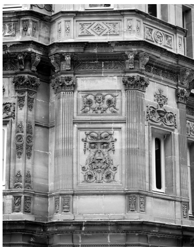
Détail d'un décor sur un panneau du château. IVR11_19857801456X