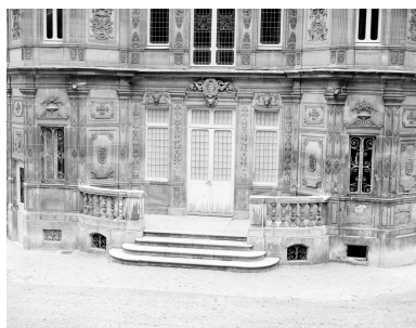
Le perron du château. IVR11_19857801452X