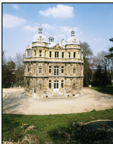
Façade du château. IVR11_19867800721XA