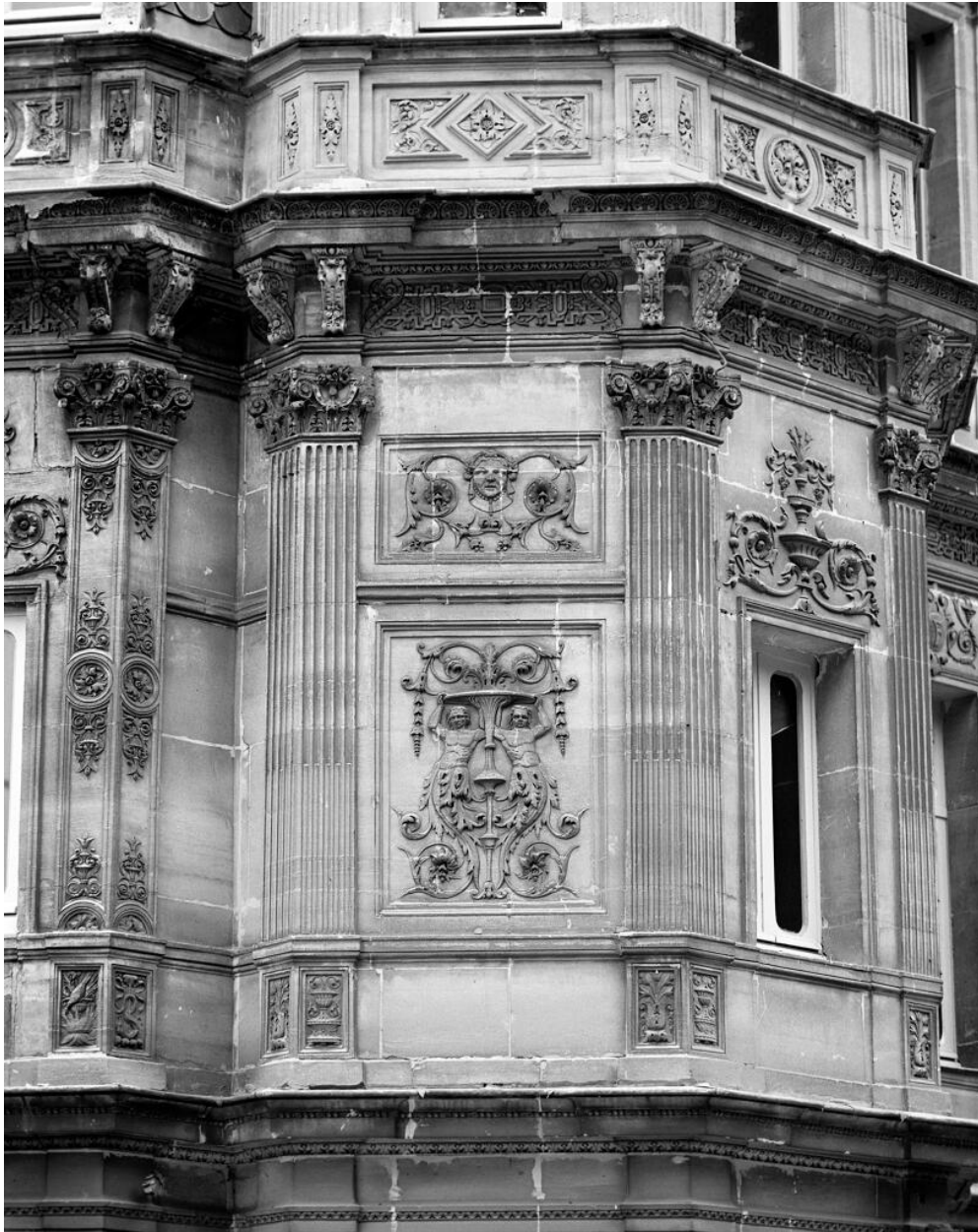
Détail d'un décor sur un panneau du château.