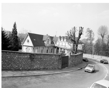
Écuries du château. IVR11_19867800722X