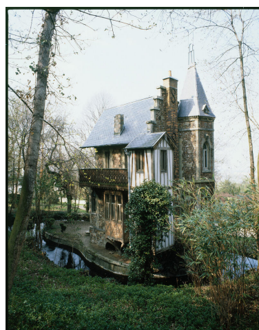
Façade arrière du château d'If, cabinet de travail d'Alexandre Dumas.