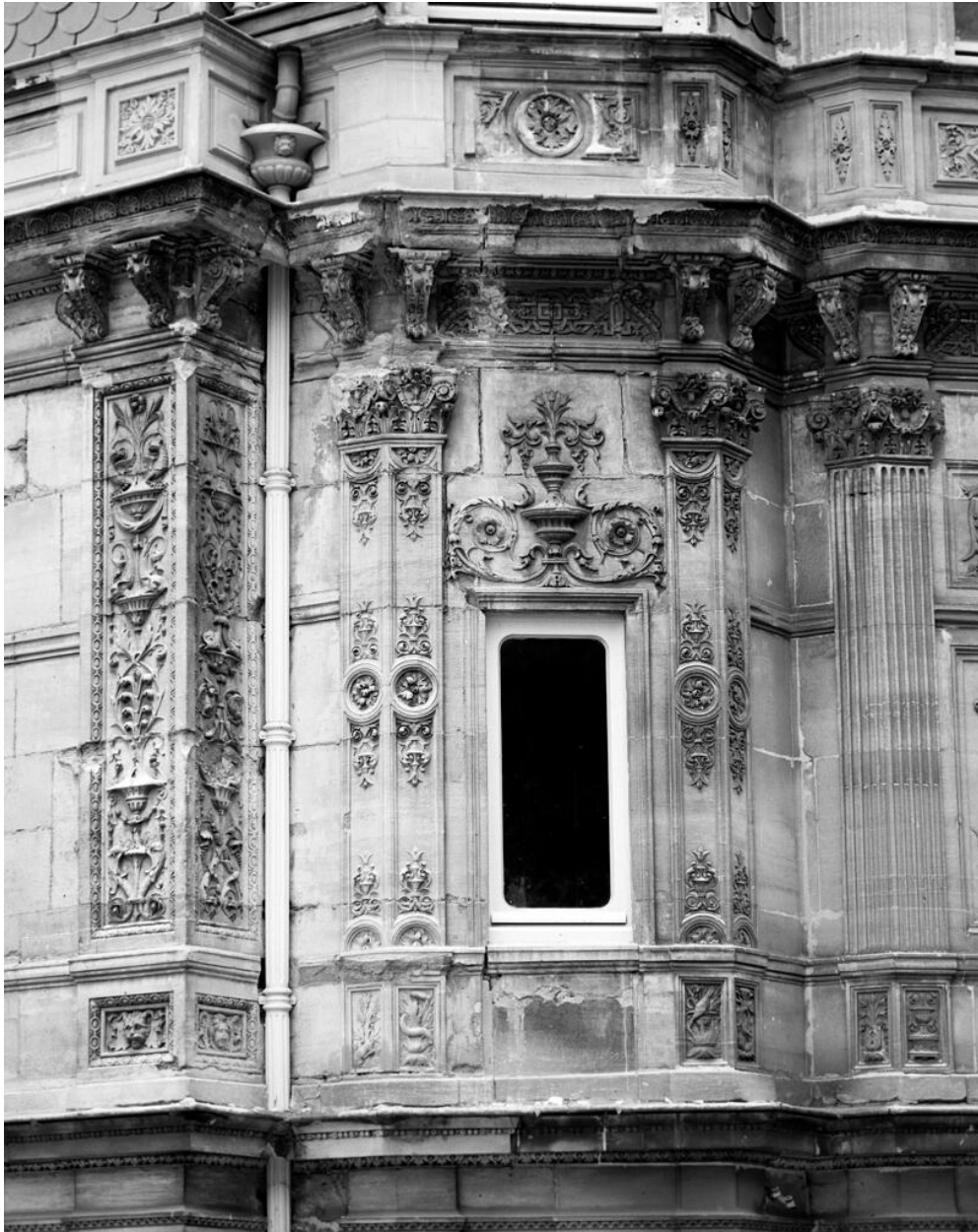
Détail d'une fenêtre avec son décor sculpté.