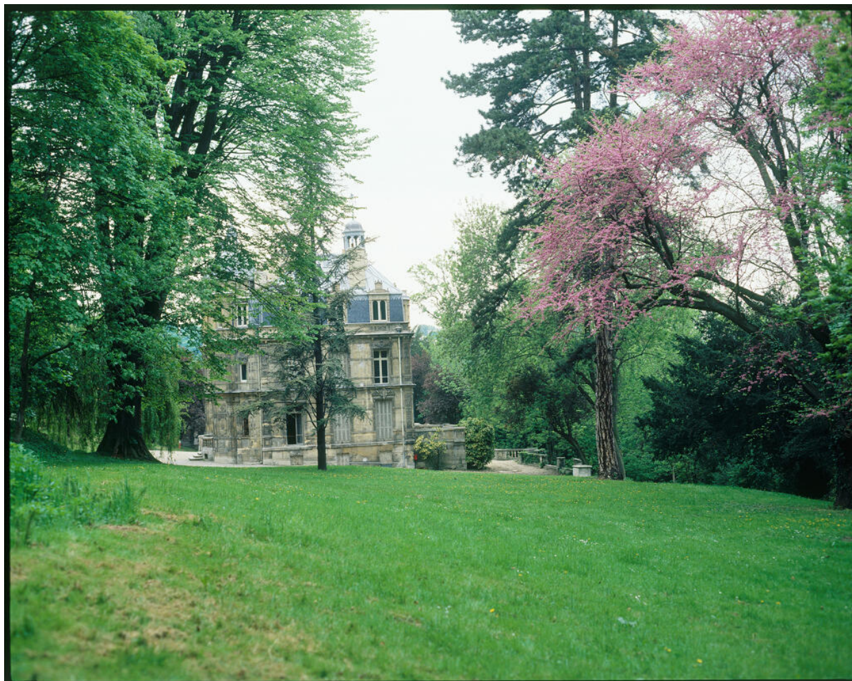
Le château vu du parc.