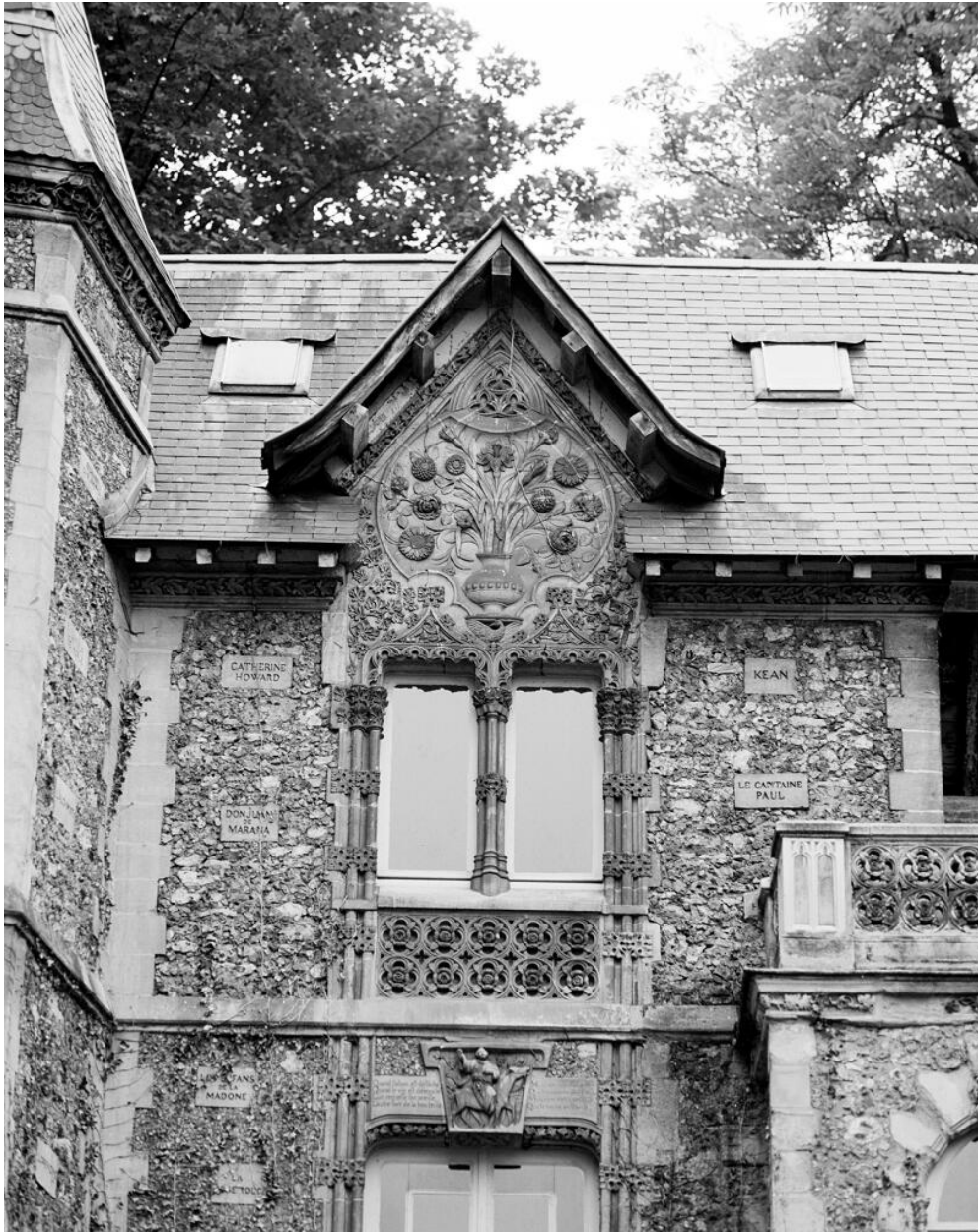
Détail avec un décor de fausse lucarne.