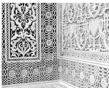
Détail des bas-reliefs du salon mauresque. Les signatures des restaurateurs de 1985 sont sculptées dans le décor. IVR11_19867800735X