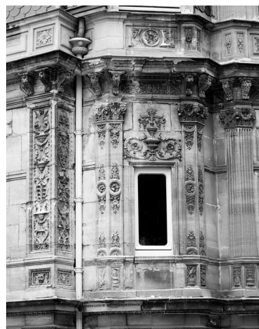
Détail d'une fenêtre avec son décor sculpté.