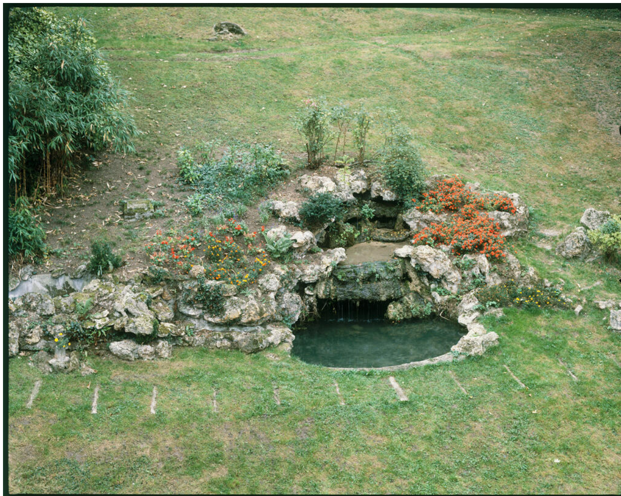
Détail du parc : cascade.