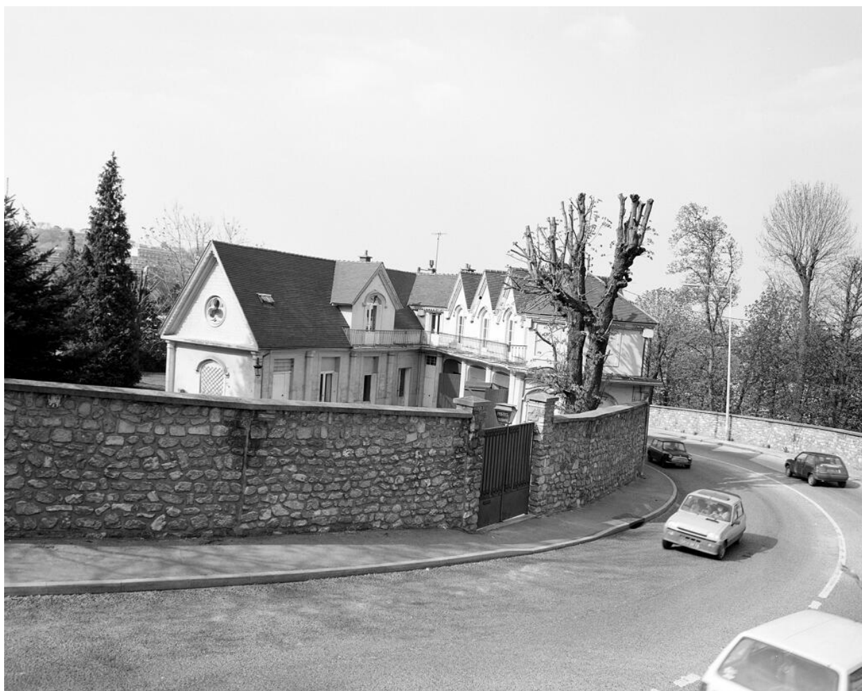
Ecuries du château.