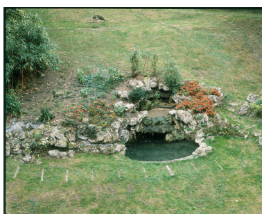
Détail du parc : cascade. IVR11_19857801347XA