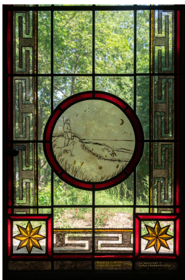
Détail d'un vitrail. Scène de promenade d'un chasseur et son chien à la nuit tombée. IVR11_20237800174NUC4A