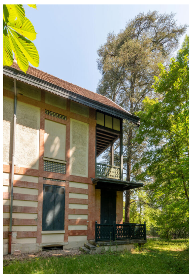
Façade postérieure. IVR11_20237800169NUC4A