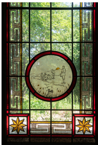
Détail d'une scène de pêche à la ligne au crépuscule. On retrouve ici encore le même chasseur et son chien. IVR11_20237800173NUC4A