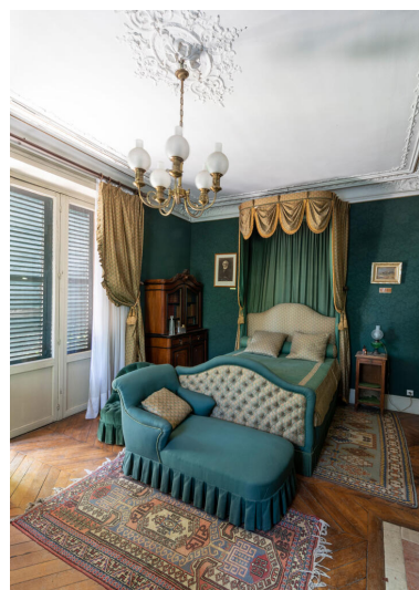
La chambre d'Ivan Tourguéniev, donnant sur le balcon. C'est dans ce lit, toujours environné du même mobilier, que l'écrivain est décédé en 1883. IVR11_20237800175NUC4A