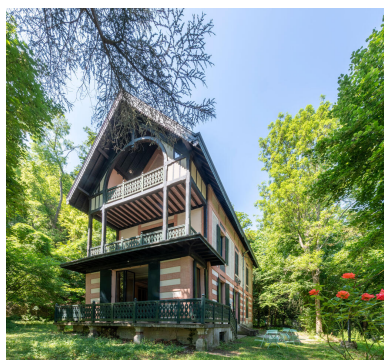
La façade latérale est, qui concentre tout le caractère pittoresque de la maison, a des allures de façade principale. IVR11_20237800167NUC4A