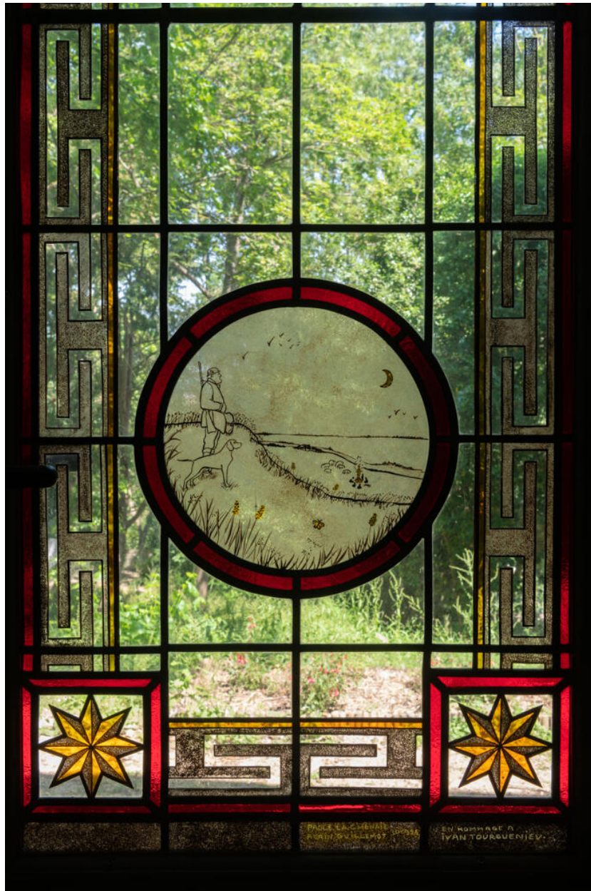
Détail d'un vitrail. Scène de promenade d'un chasseur et son chien à la nuit tombée.