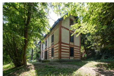
La façade postérieure et la façade latérale où se trouve l'entrée. IVR11_20237800168NUC4A