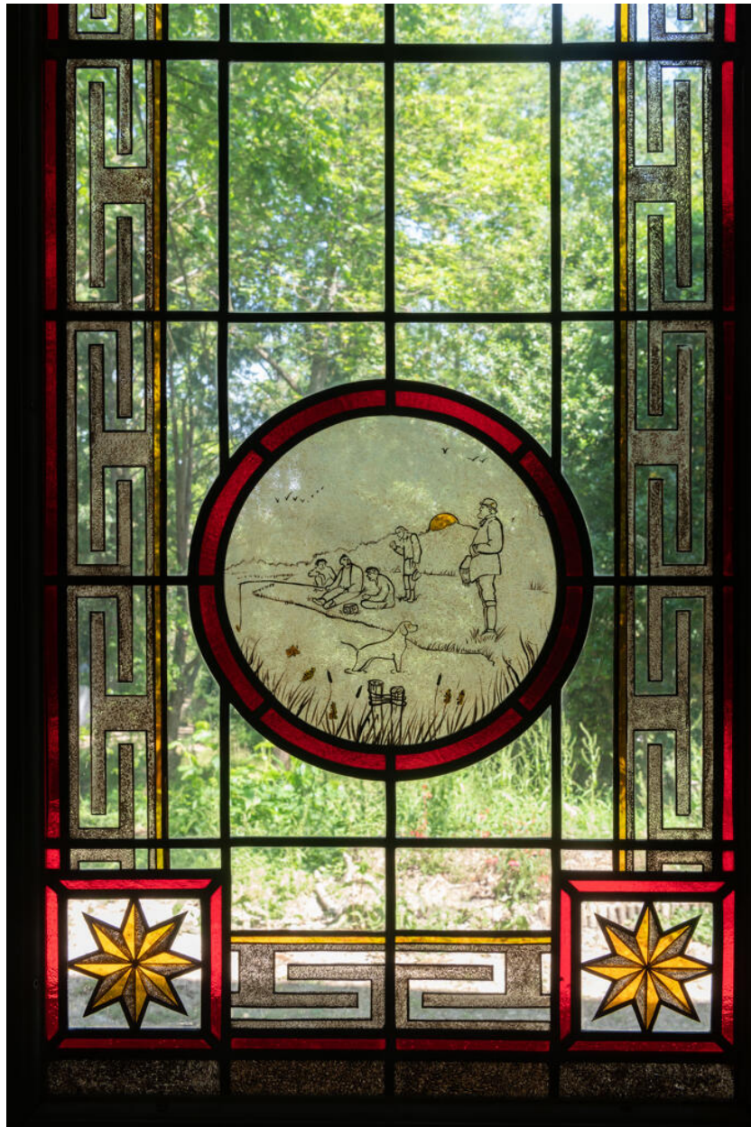
Détail d'une scène de pêche à la ligne au crépuscule. On retrouve ici encore le même chasseur et son chien.