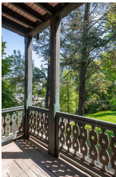
Le balcon de la chambre d'Ivan Tourgueniev, avec vue sur la maison Viardot et sur la Seine au loin. IVR11_20237800170NUC4A