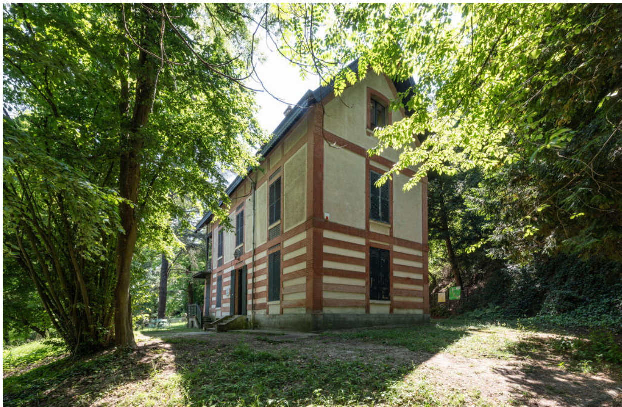
La façade postérieure et la façade latérale où se trouve l'entrée.