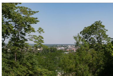
La vue depuis le balcon. IVR11_20237800162NUC4A