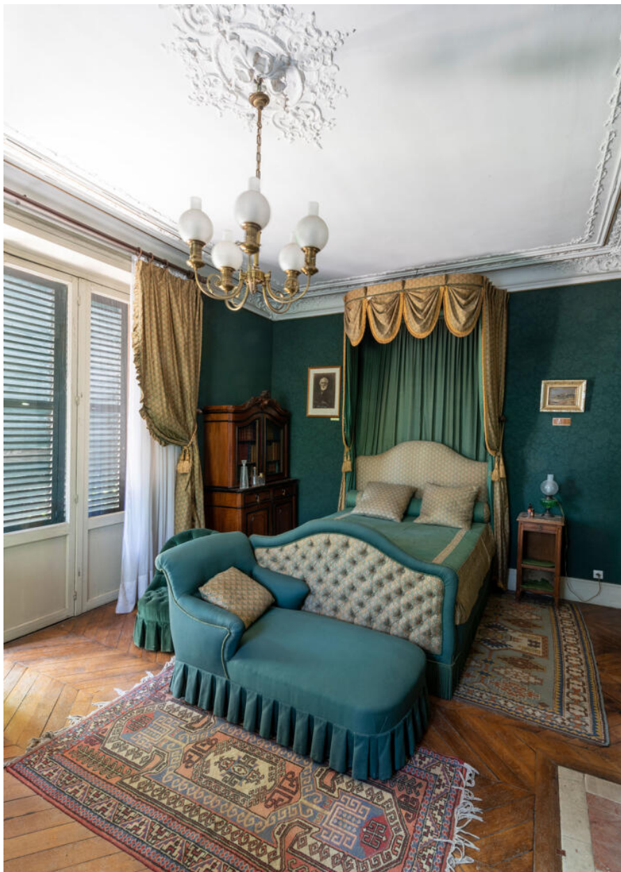
La chambre d'Ivan Tourguéniev, donnant sur le balcon. C'est dans ce lit, toujours entouré du même mobilier, que l'écrivain est décédé en 1883.