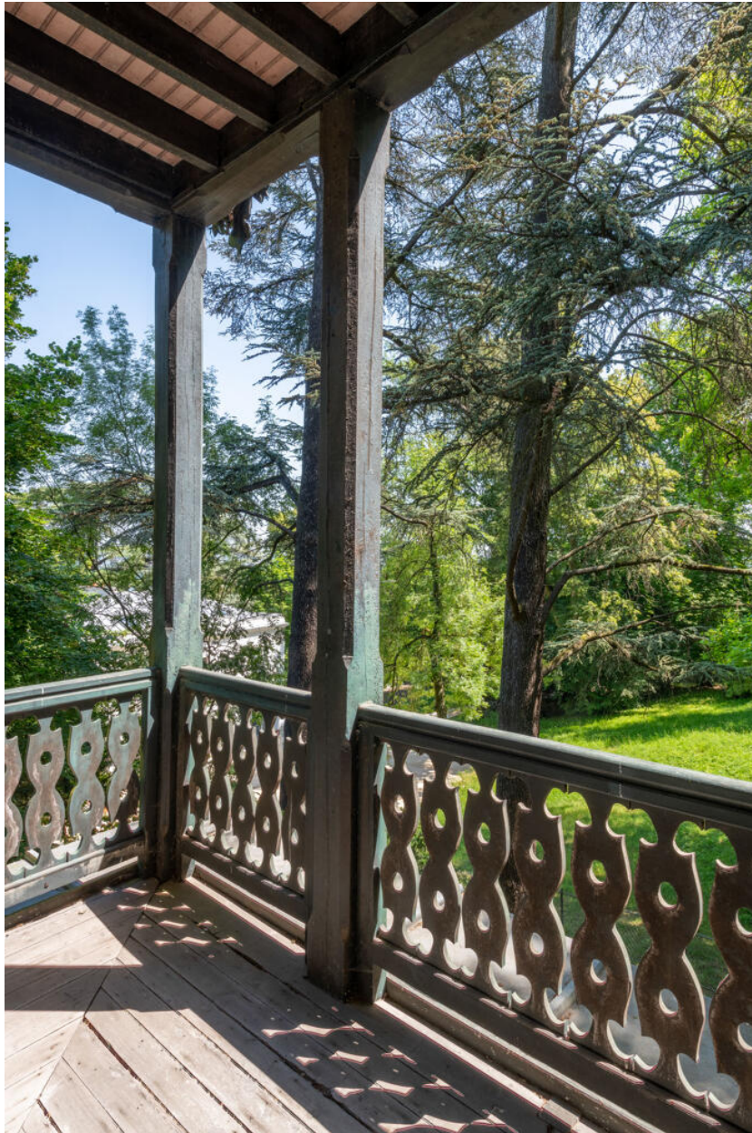
Le balcon de la chambre d'Ivan Tourgueniev, avec vue sur la maison Viardot et sur la Seine au loin.