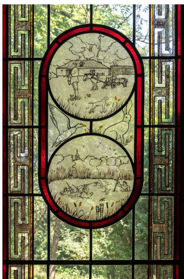
La porte d'entrée est décorée de vitreaux peints au trait, illustrant les plaisirs de la campagne, en particulier la chasse. IVR11_20237800172NUC4A