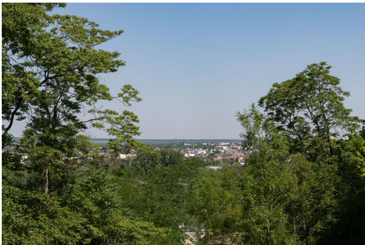
La vue depuis le balcon.