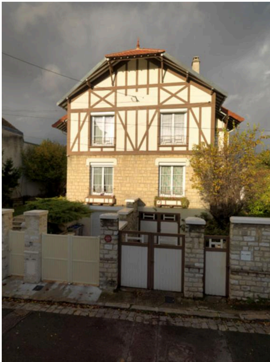
Façade principale. Le portail et la porte de garage de la villa de droite sont d'origine.