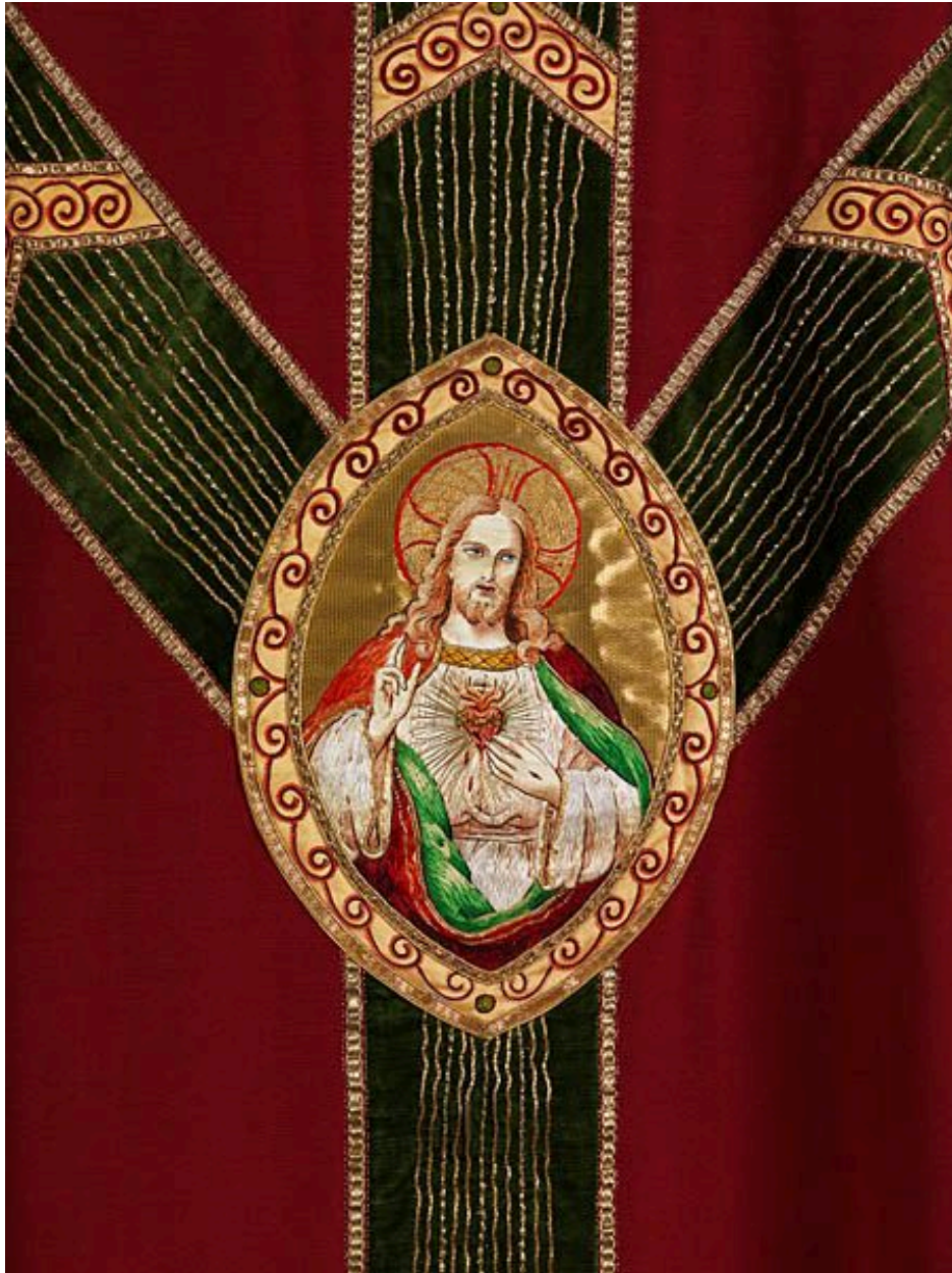
Détail du Sacré-Coeur.