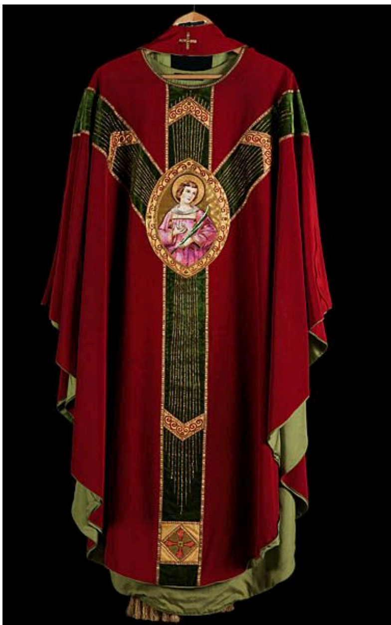
Vue de l'autre côté de la chasuble, avec saint Etienne.