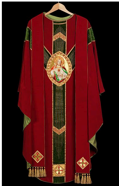
Vue d'un côté de la chasuble, avec le Sacré-Coeur (et l'étole assortie). IVR11_20117700019NUC4A