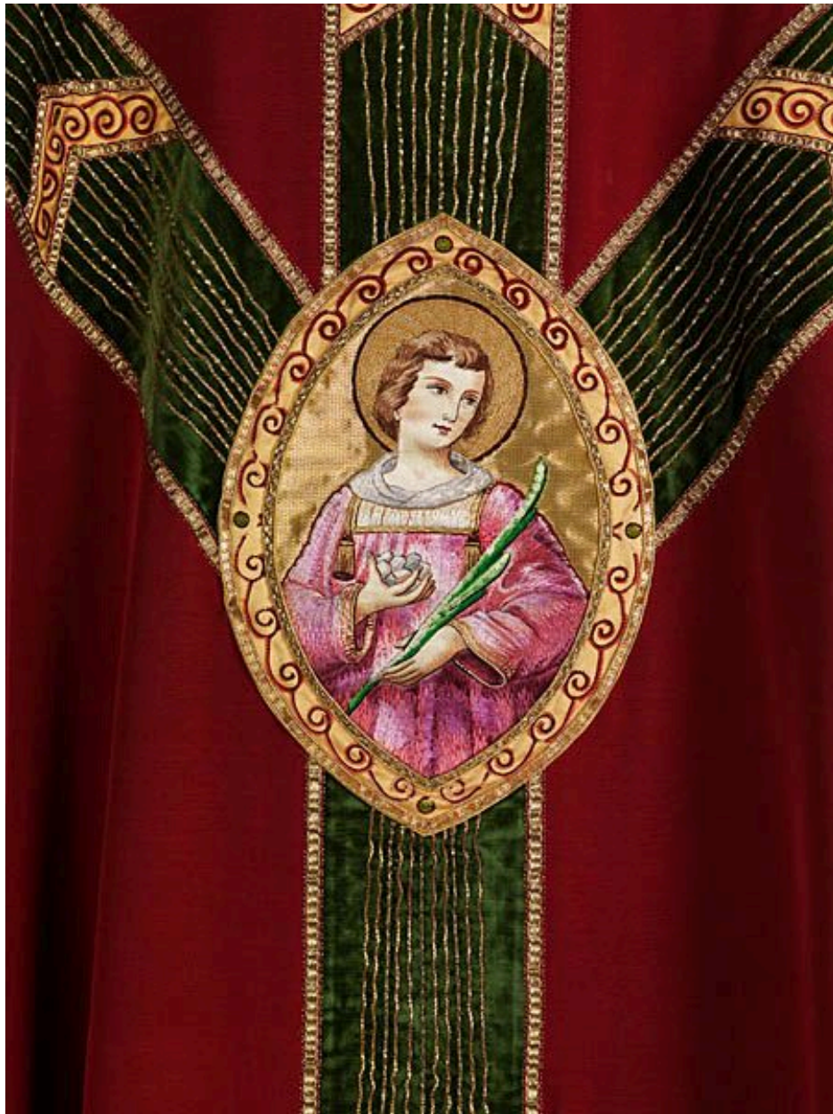
Détail de saint Etienne.