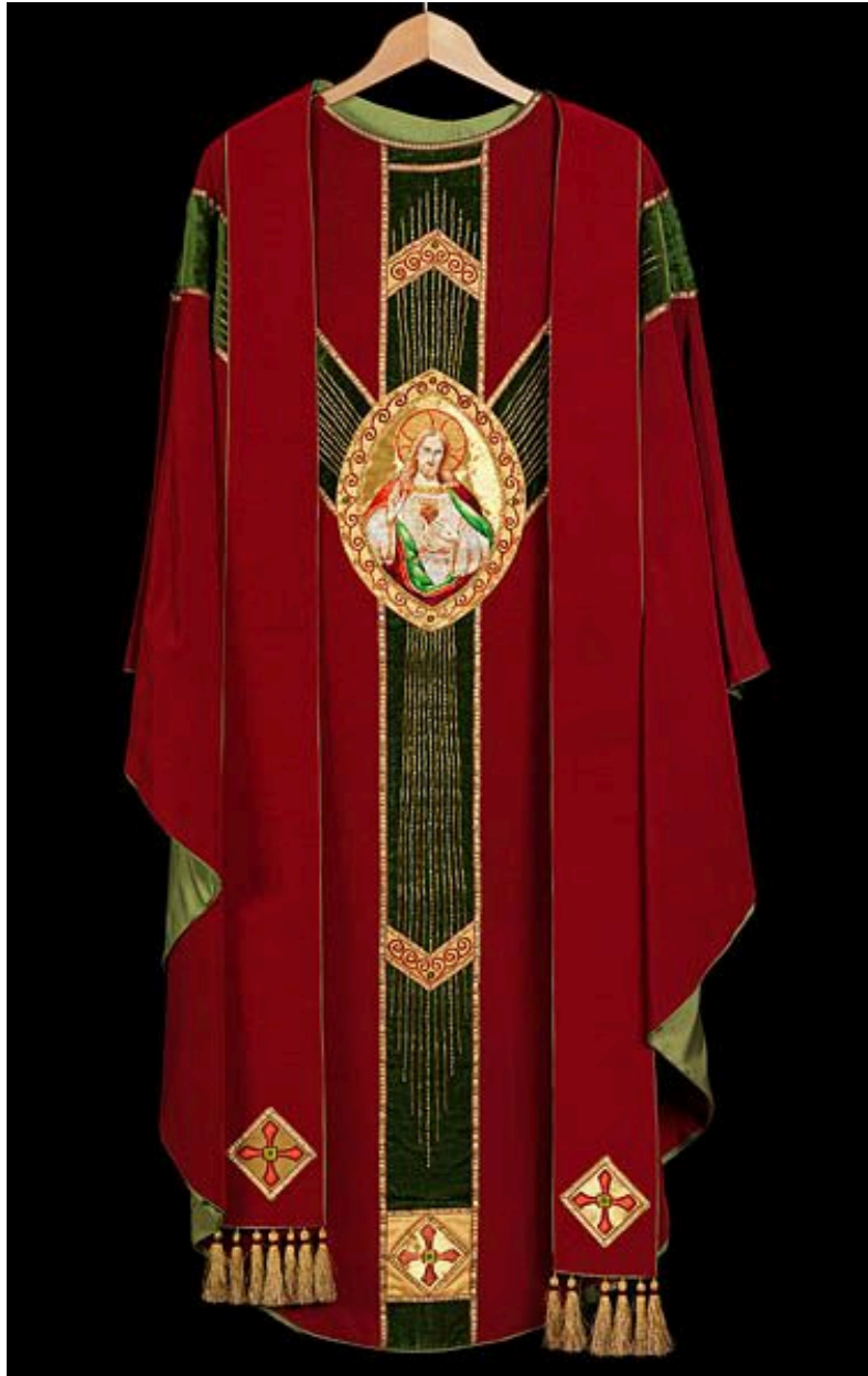
Vue d'un côté de la chasuble, avec le Sacré-Coeur (et l'étole assortie).