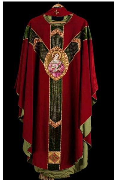
Vue de l'autre côté de la chasuble, avec saint Etienne.