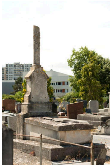
Tombeau orné d'une colonne tronquée. IVR11_20177800914NUC4A