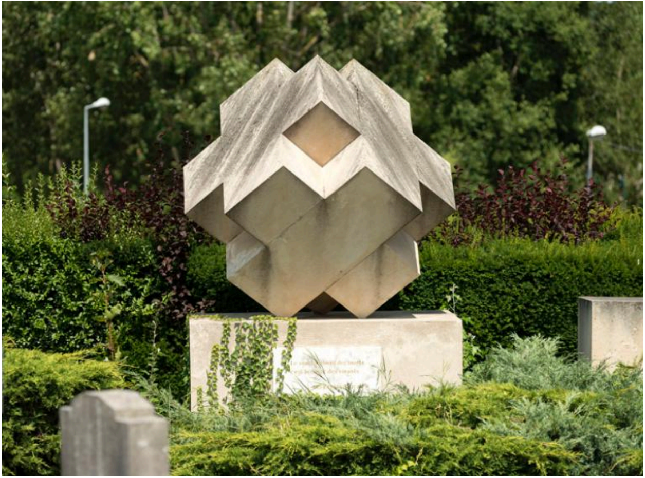
Le mémorial des rapatriés d'Algérie, détail de la pierre taillée en cube avec une croix en relief sur chacune de ses faces.