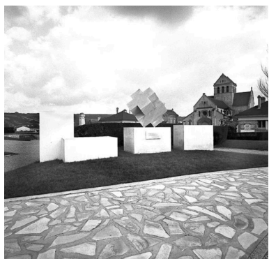
Le mémorial des Rapatriés d'Algérie.