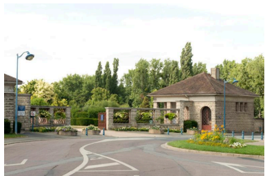
Vue de l'entrée du cimetière. Le pavillon du gardien. IVR11_20177800915NUC4A