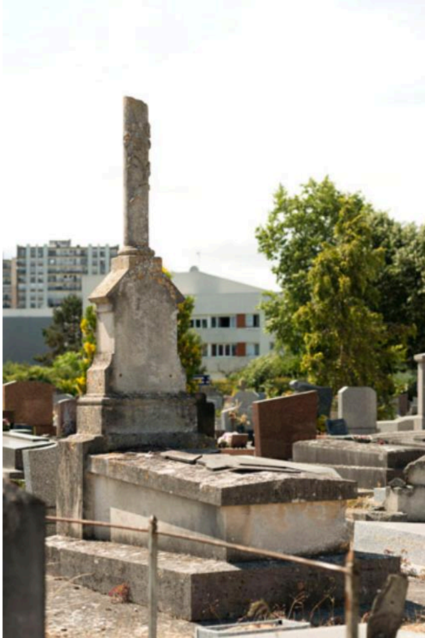
Tombeau orné d'une colonne tronquée.