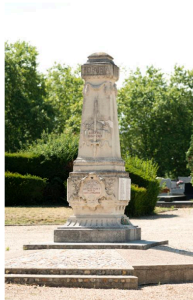
Le monument aux morts de la première guerre mondiale. IVR11_20177800910NUC4A