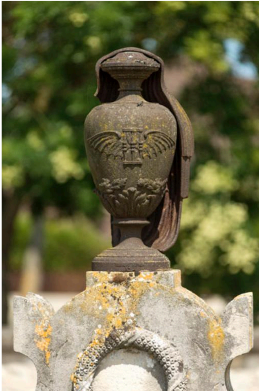
Urne voilée en fonte portant un sablier ailé.