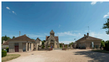
Vue de l'entrée du cimetière encadrée par deux pavillons. IVR11_20177800916NUC4A