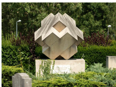
Le mémorial des rapatriés d'Algérie, détail de la pierre taillée en cube avec une croix en relief sur chacune de ses faces.