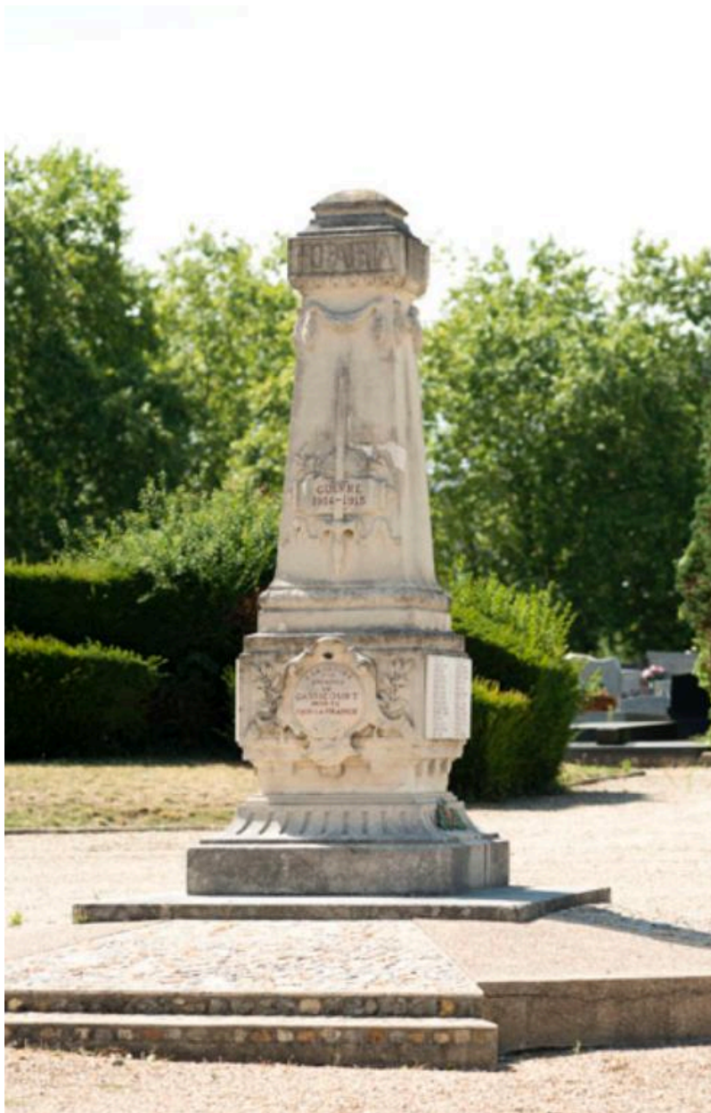
Le monument aux morts de la première guerre mondiale.