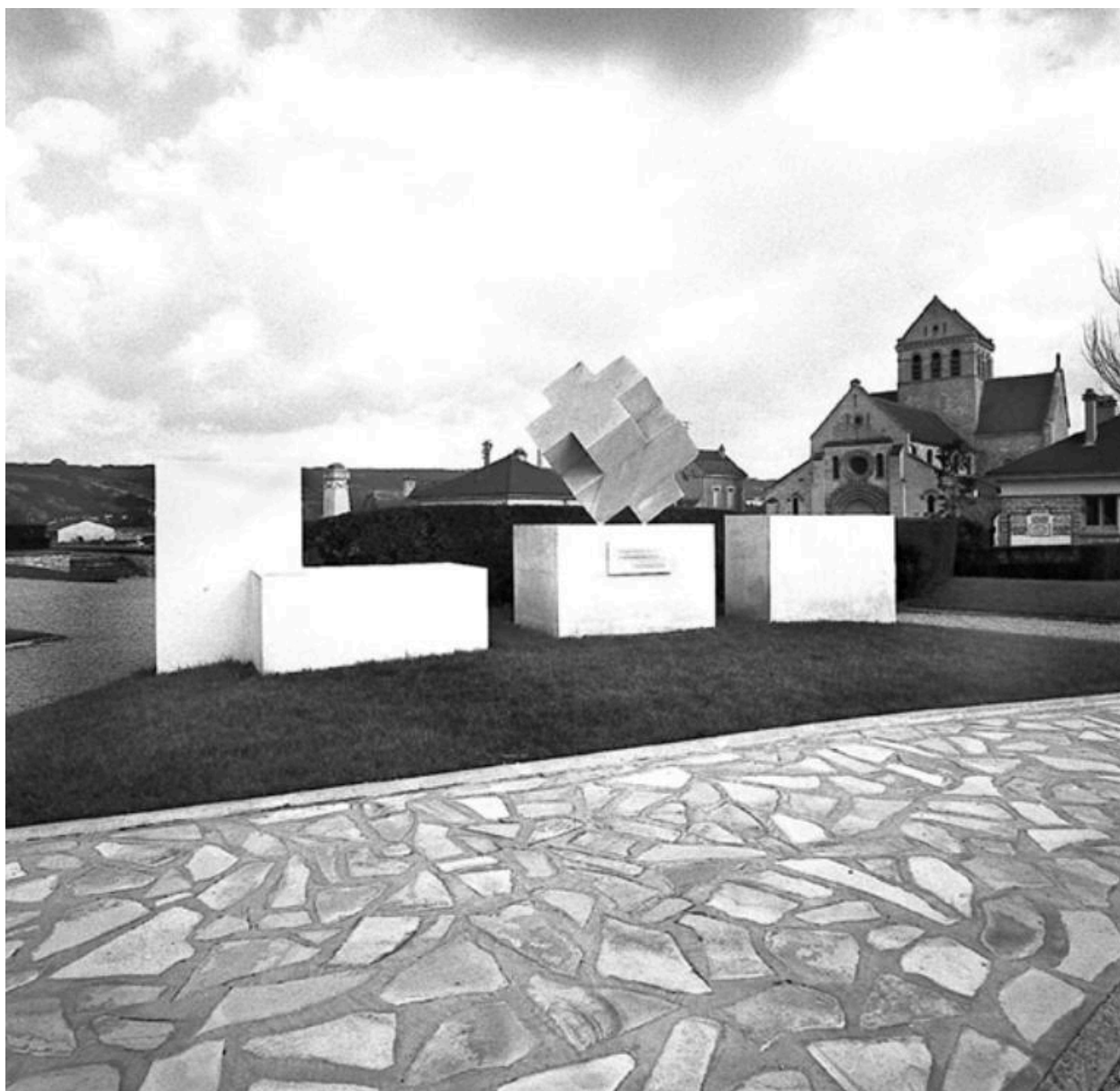
Le mémorial des Rapatriés d'Algérie. (Fonds Bertin).