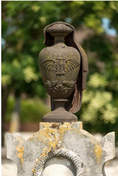
Urne voilée en fonte portant un sablier ailé. IVR11_20177800913NUC4A