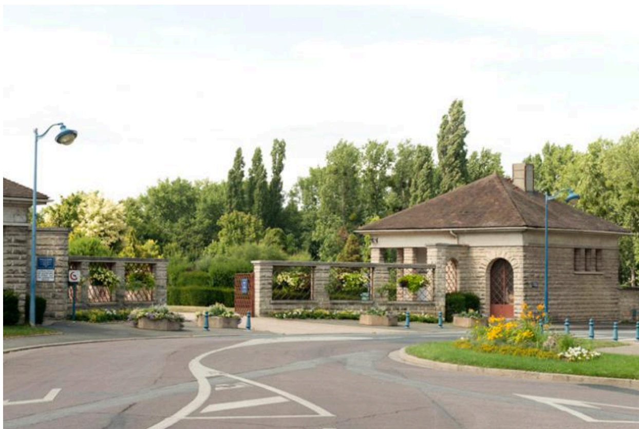
Vue de l'entrée du cimetière. Le pavillon du gardien.