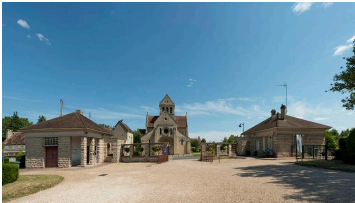
Vue de l'entrée du cimetière encadrée par deux pavillons.