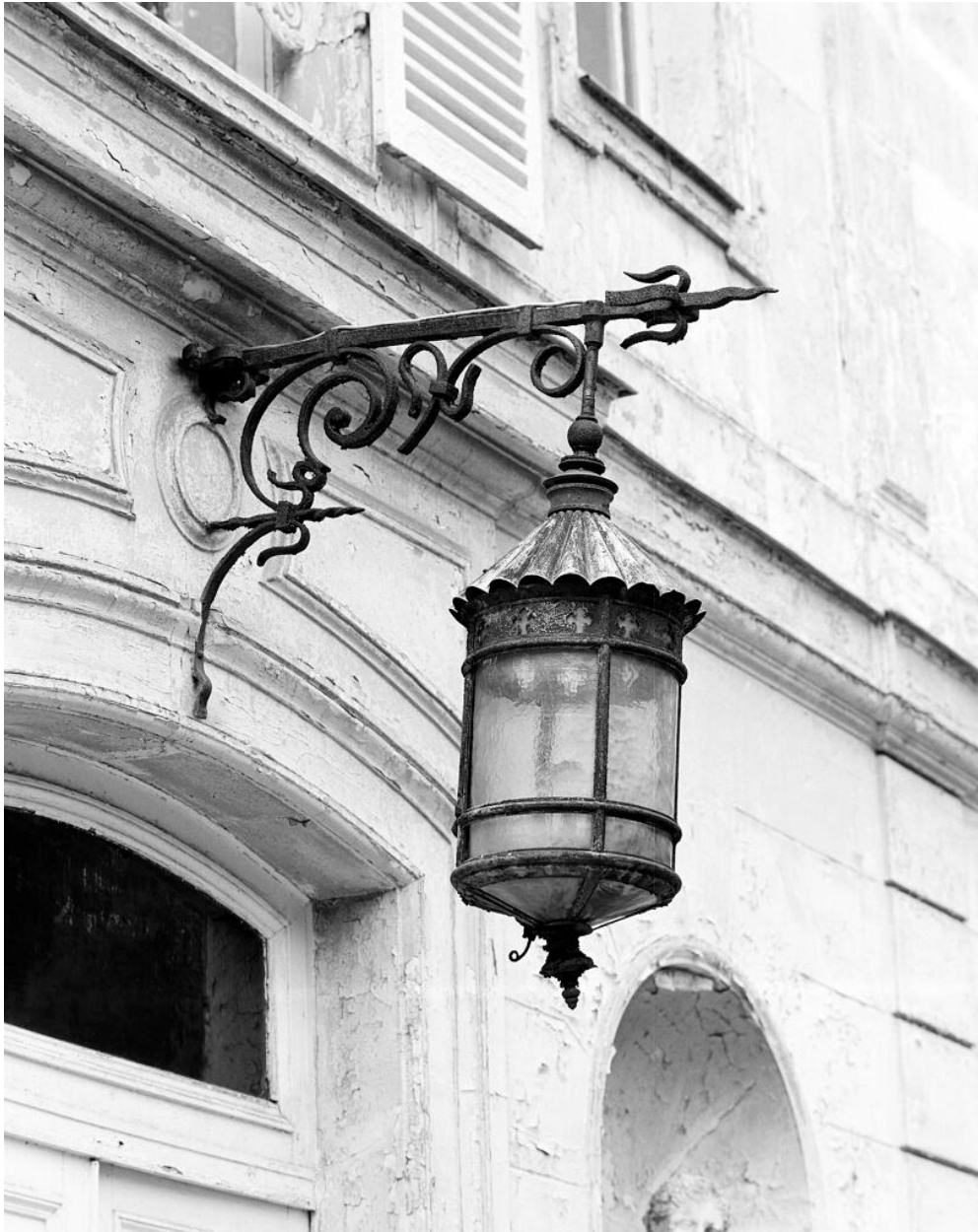
Façade antérieure : détail de la lanterne au-dessus de la porte d'entrée.