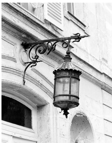
Façade antérieure : détail de la lanterne au-dessus de la porte d'entrée. IVR11_19907800264X