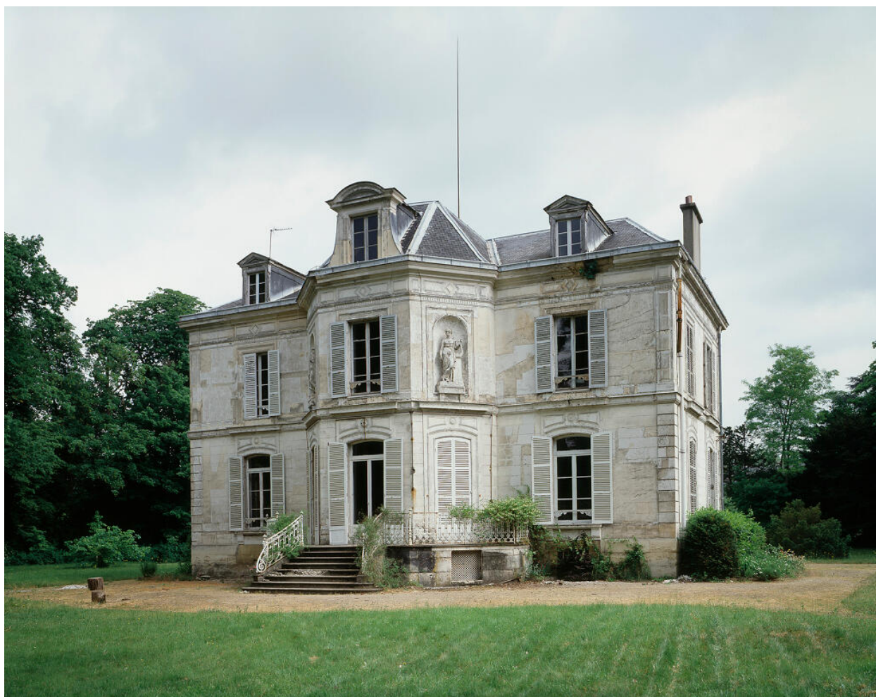
Vue d'ensemble de la façade postérieure.