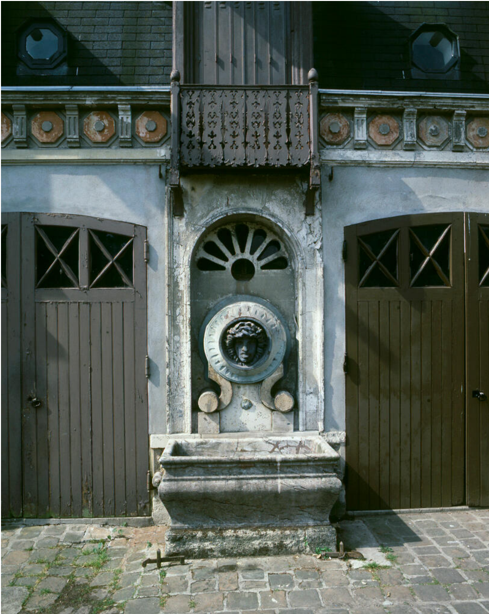
Détail de la fontaine des communs.