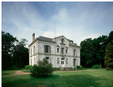
Vue d'ensemble de la façade antérieure. IVR11_19997800603VA