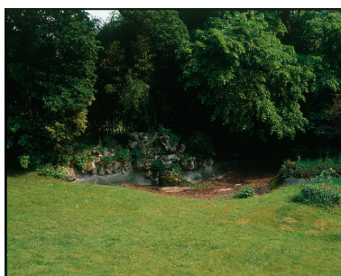
Vue du plan d'eau avec rocaille de meulière dans le parc. IVR11_19907800278XA