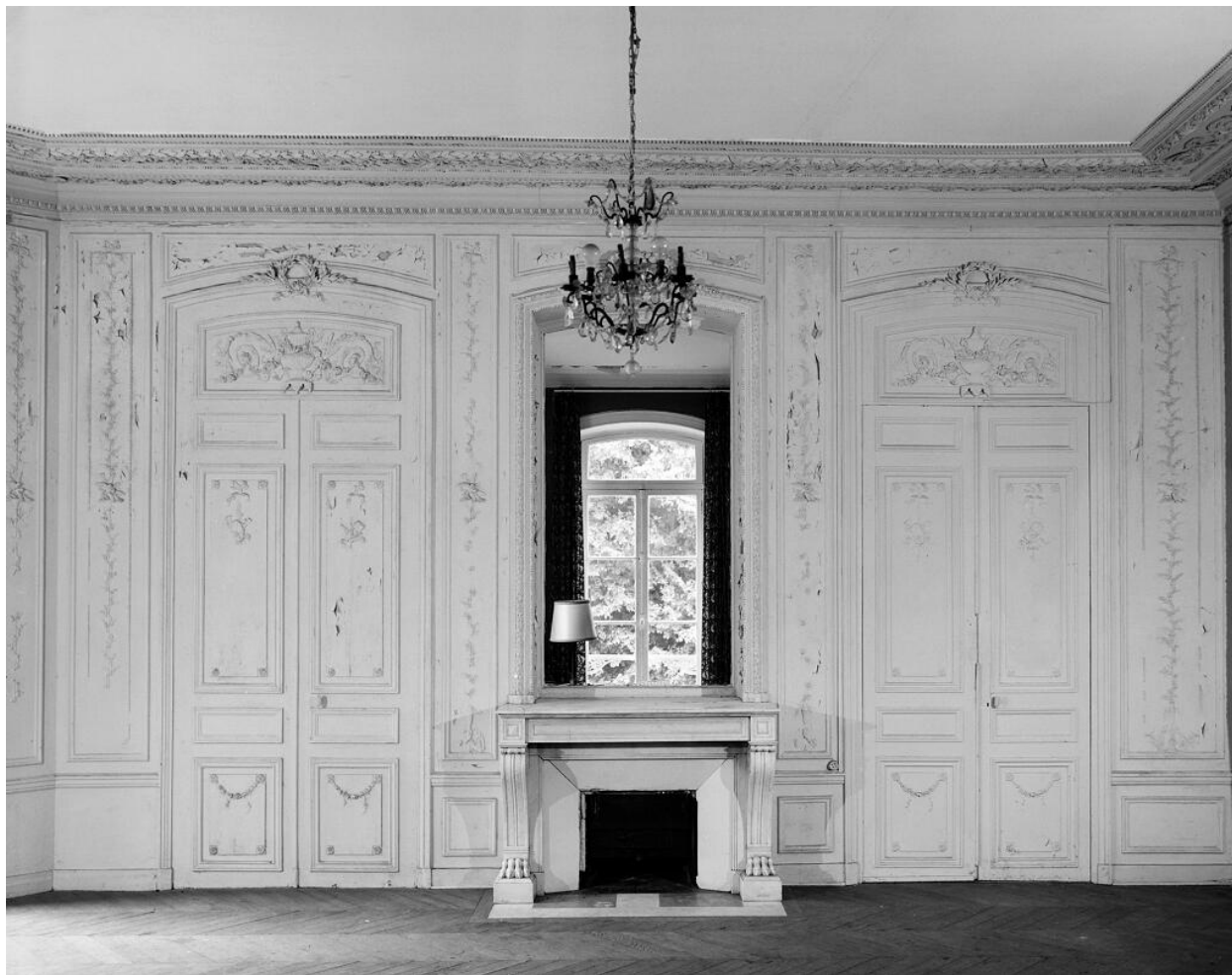
Salon central, rez-de-chaussée, vue d'ensemble du mur droit avec cheminée, surmontée d'une fenêtre donnant vue sur un deuxième salon.