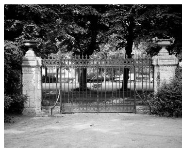
Vue d'ensemble du portail, prise depuis l'intérieur du parc.