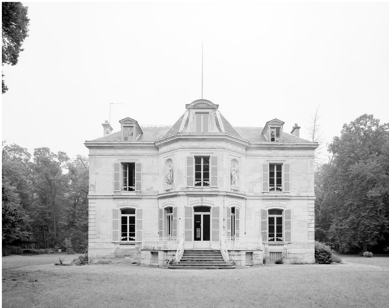
Façade postérieure sur jardin.