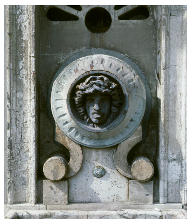
Fontaine des communs : tête de gorgone. IVR11_19997800613XA