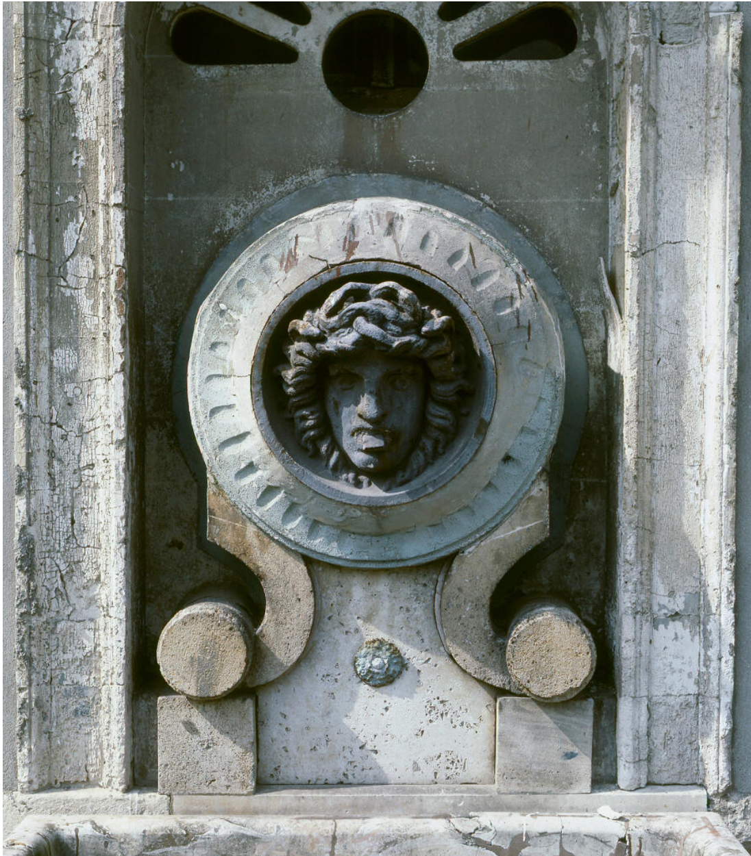
Fontaine des communs : tête de gorgone.