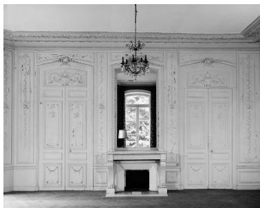
Salon central, rez-de-chaussée, vue d'ensemble du mur droit avec cheminée, surmontée d'une fenêtre donnant vue sur un deuxième salon. IVR11_19907800267V