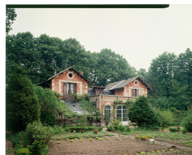
Vue de l'orangerie dans le parc, avec au premier plan le jardin potager et bouquetier. IVR11_19907800281VA