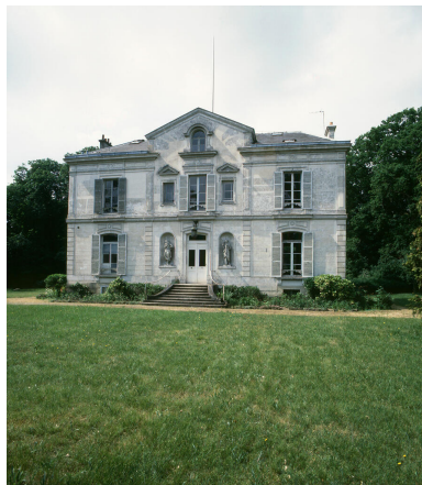
Vue d'ensemble de la façade antérieure.