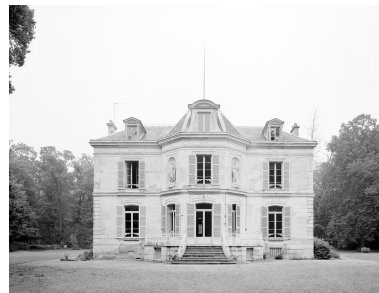
Façade postérieure sur jardin.