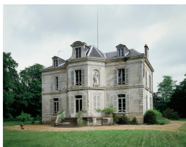
Vue d'ensemble de la façade postérieure. IVR11_19997800605VA