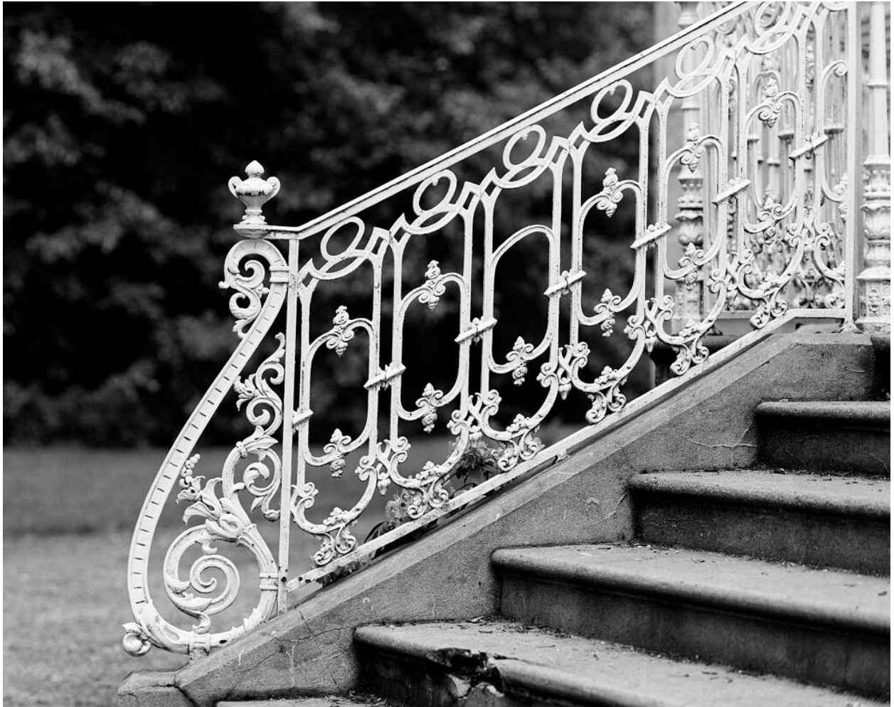
Façade postérieure, escalier de distribution extérieure, détail de la rampe.