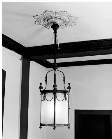
Vestibule d'entrée : lanterne.