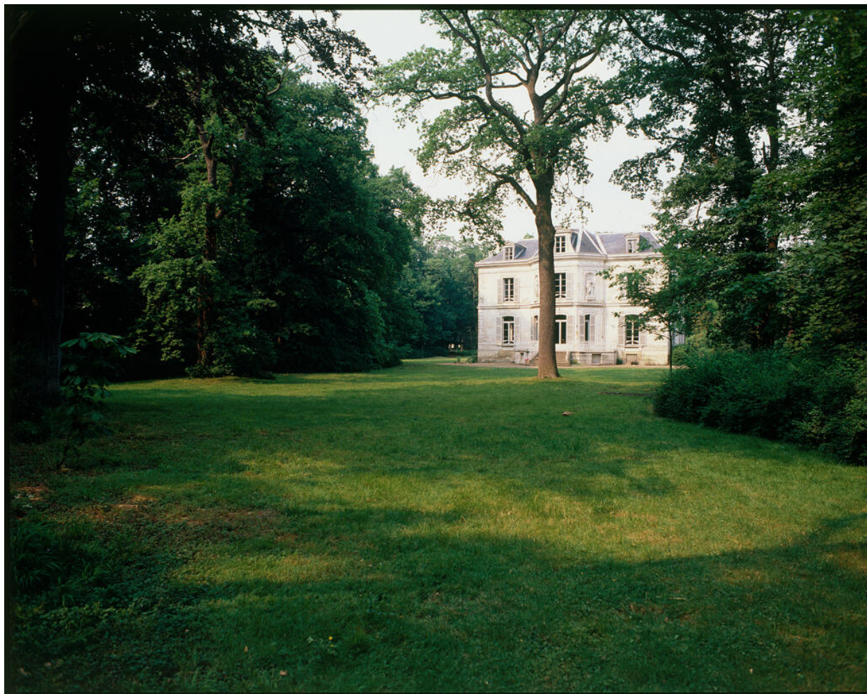
Coulée de verdure située dans l'axe de la façade postérieure de la maison.