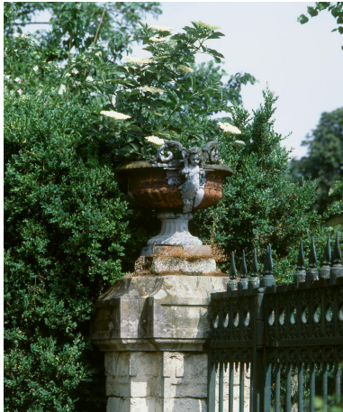
Détail d'un vase Médicis sur le portail d'entrée.

IVR11_19997800609XA