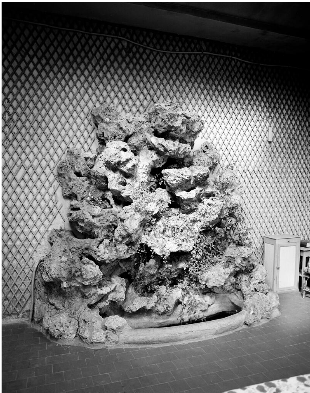
Vue intérieure de l'orangerie : sur le mur de fond, le bassin est surmonté d'une rocaille.