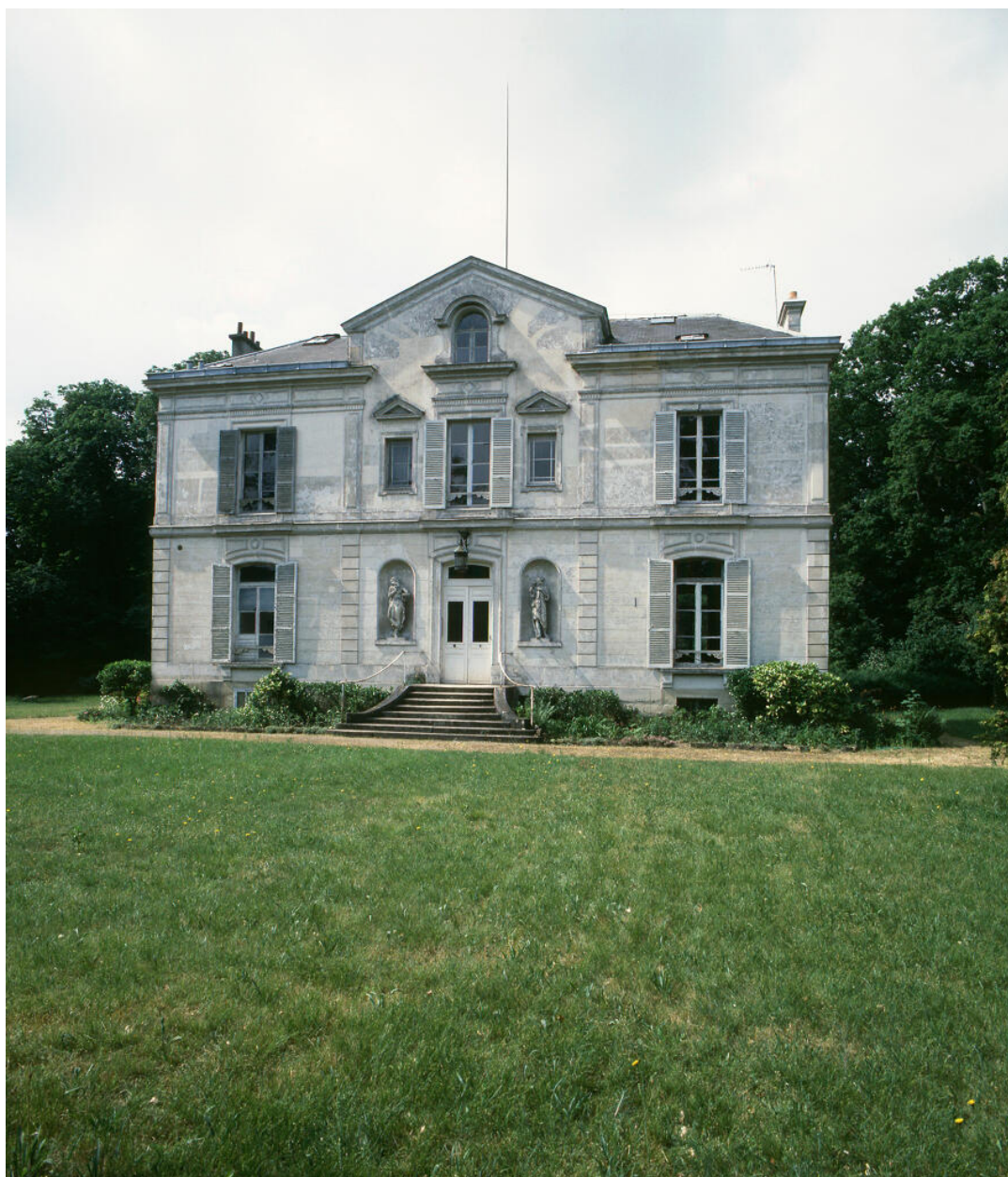
Vue d'ensemble de la façade antérieure.