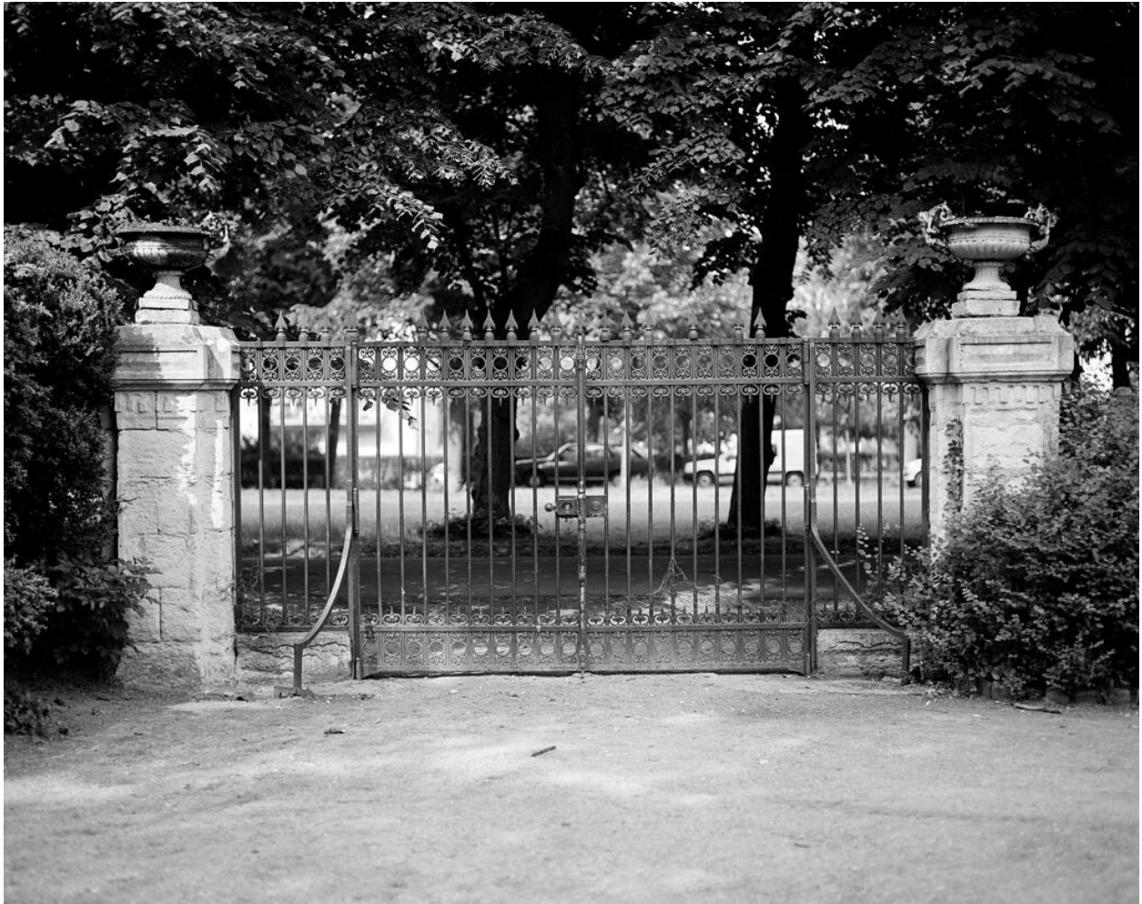
Vue d'ensemble du portail, prise depuis l'intérieur du parc.