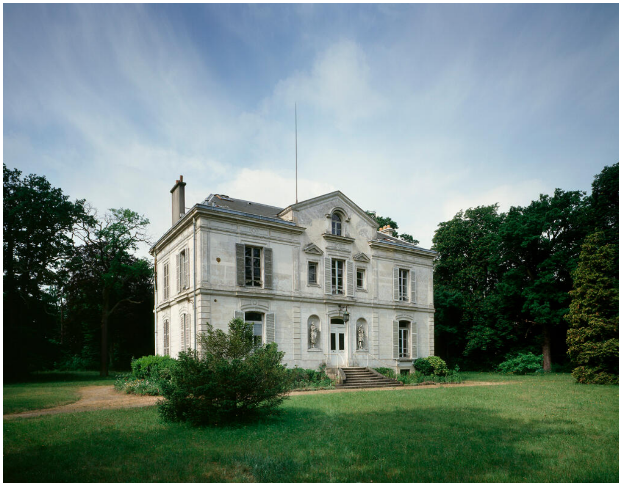
Vue d'ensemble de la façade antérieure.