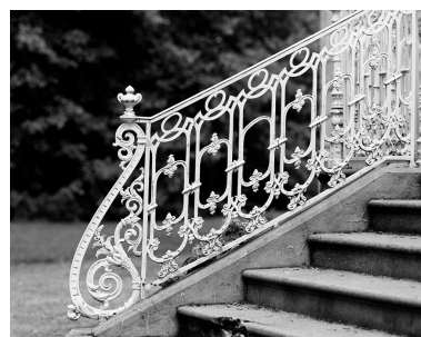
Façade postérieure, escalier de distribution extérieure, détail de la rampe. IVR11_19907800265X