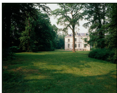
Coulée de verdure située dans l'axe de la façade postérieure de la maison.