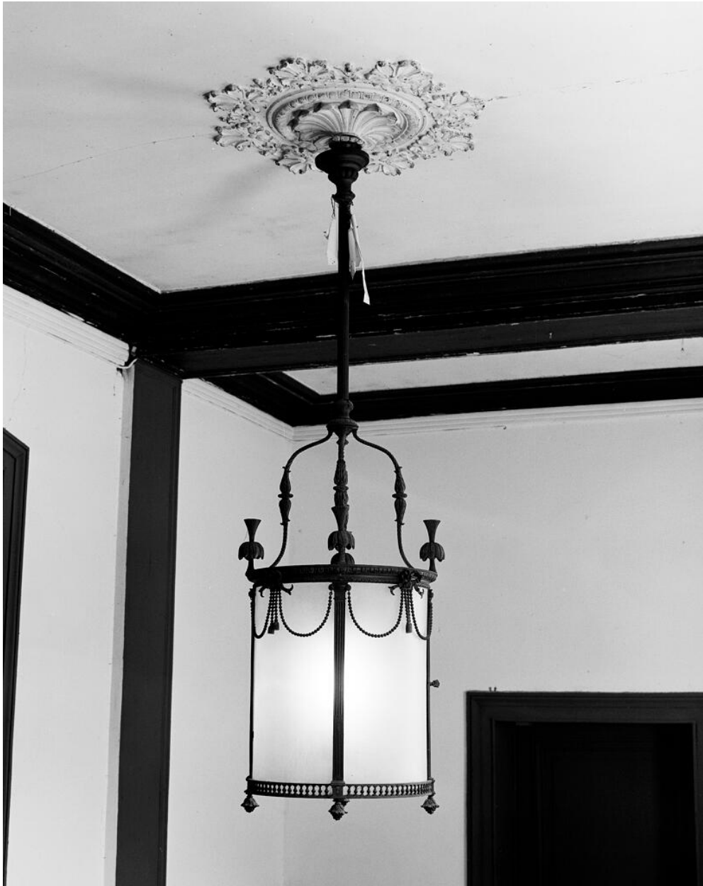
Vestibule d'entrée : lanterne.