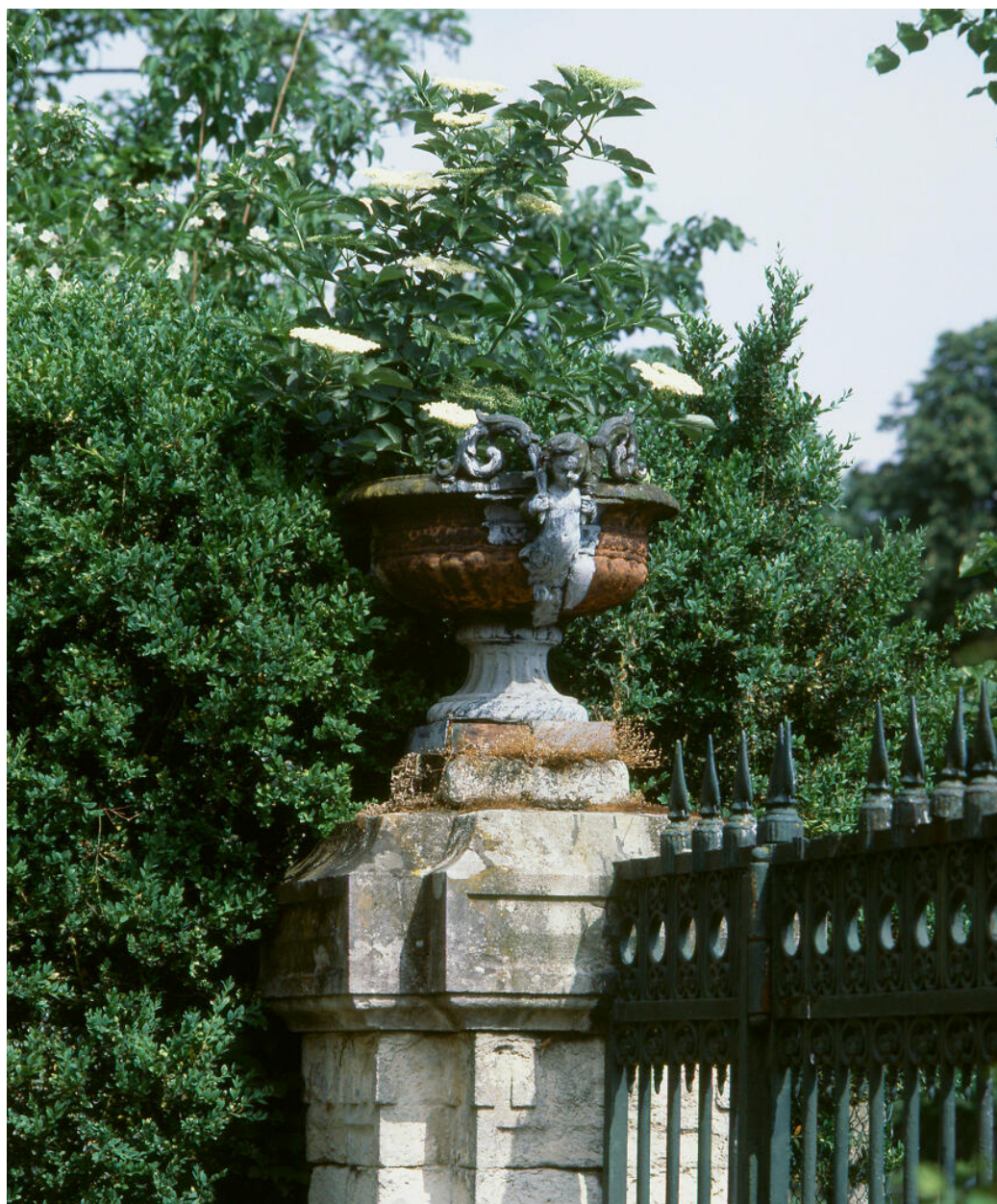
Détail d'un vase Médicis sur le portail d'entrée.