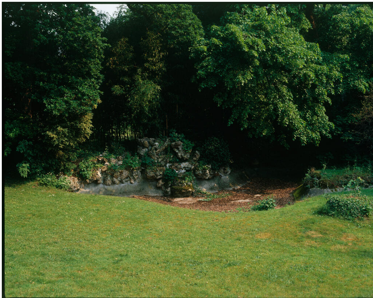
Vue du plan d'eau avec rocaille de meulière dans le parc.