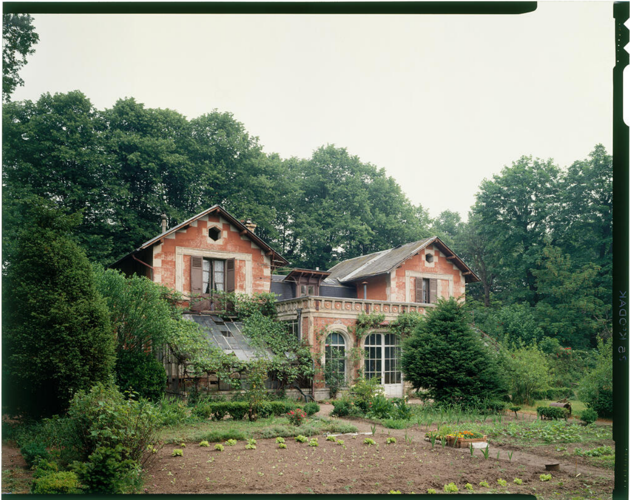
Vue de l'orangerie dans le parc, avec au premier plan le jardin potager et bouquetier.