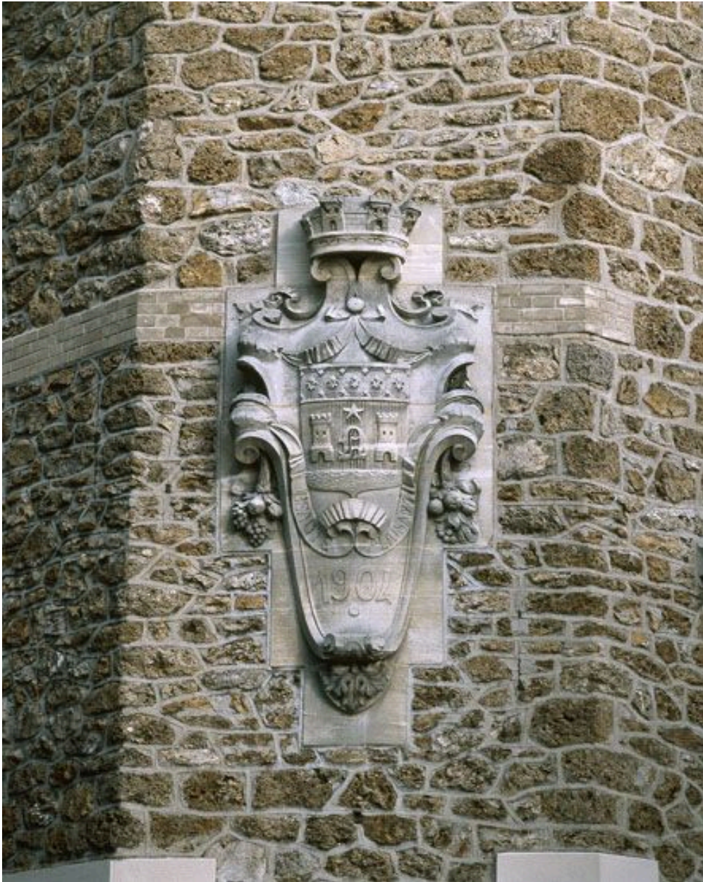
Détail du bas-relief des armes de la ville, daté 1904.