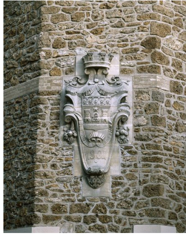
Détail du bas-relief des armes de la ville, daté 1904. IVR11_20049400181XA