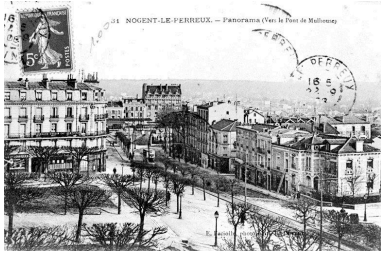
Façade antérieure. Carte postale. IVR11_19859400230XB