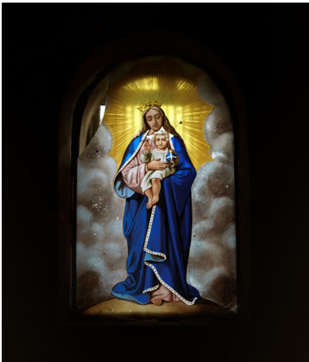
Vue du vitrail ornant la chapelle funéraire.