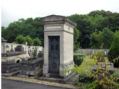
Vue d'ensemble de la chapelle. IVR11_20169500140NUC4A