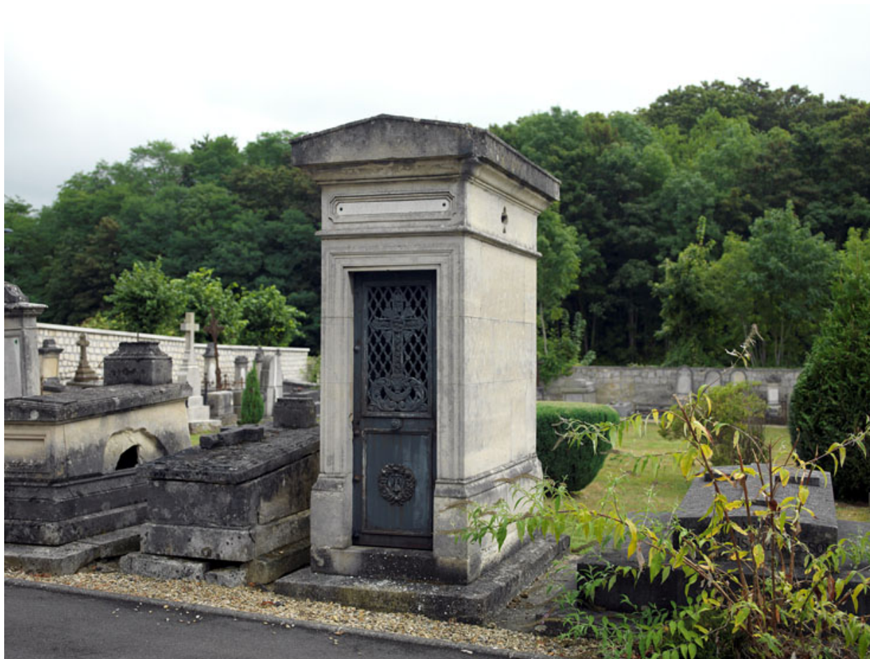
Vue d'ensemble de la chapelle.