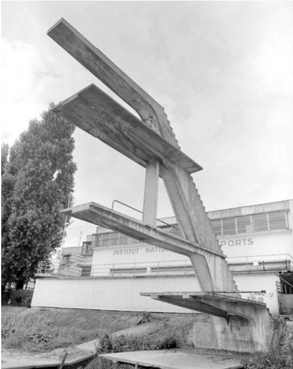
Façade sur la Marne et plongeur.