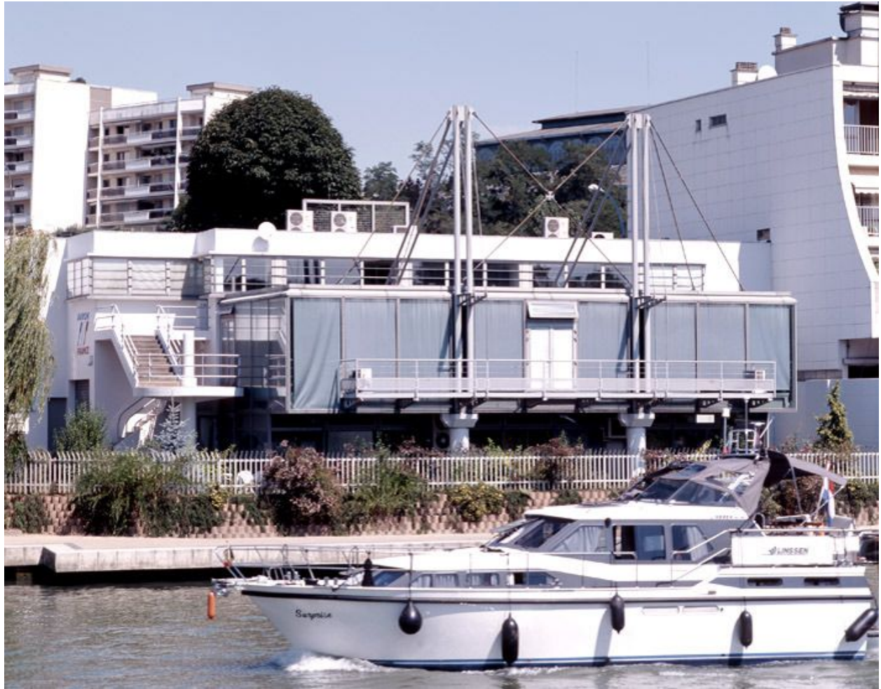
Vue d'ensemble depuis le quai de Champigny après la rénovation complète et la construction d'une extension.