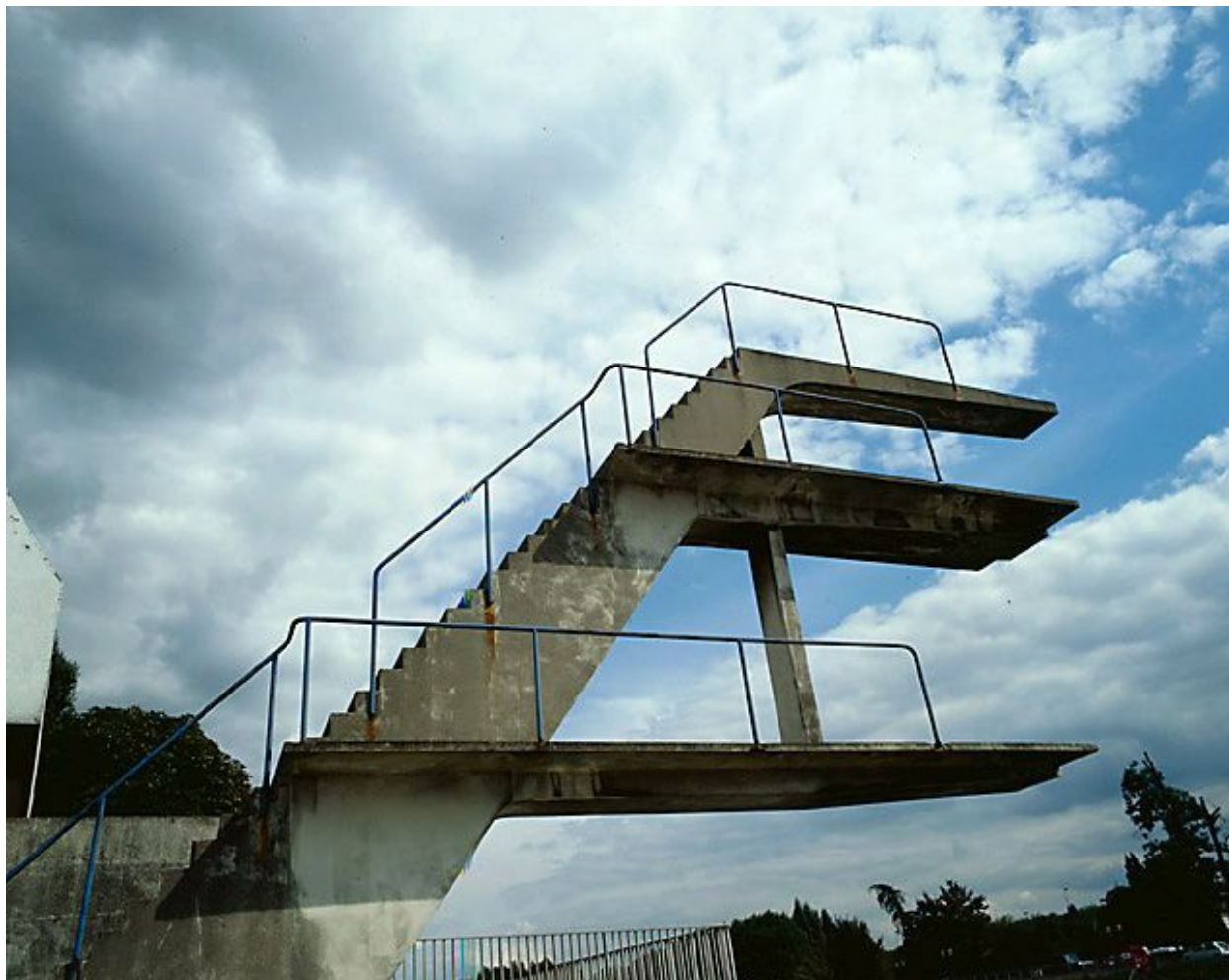
Vue du plongeur.