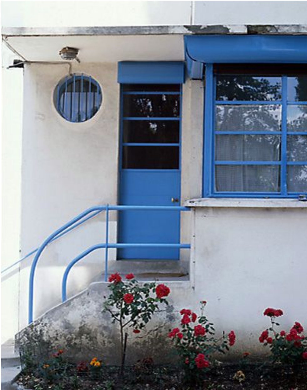
Entrée de la loge du gardien.