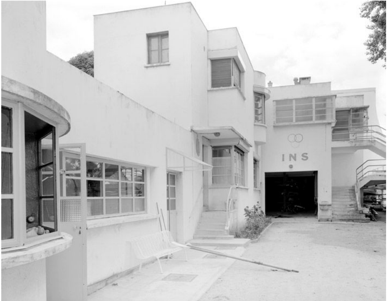
Façade sur cour: loge du gardien, entrée du garage des bateaux et accès aux vestiaires.