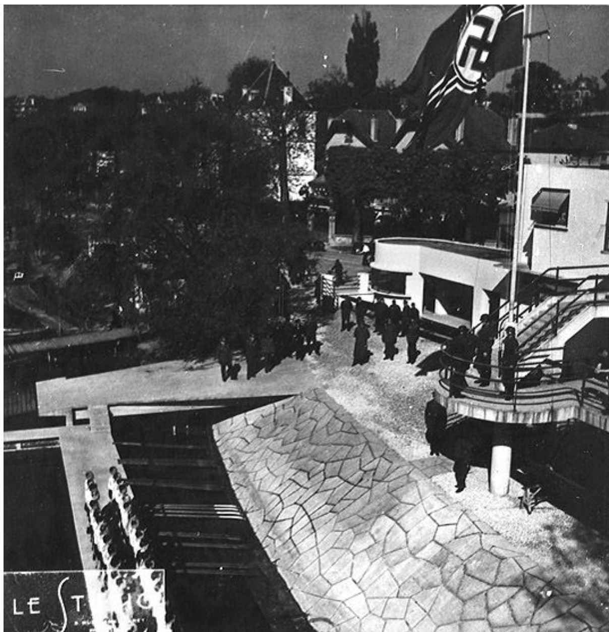
Vue partielle de la façade sur la Marne et du bassin de natation. Photographie ancienne.