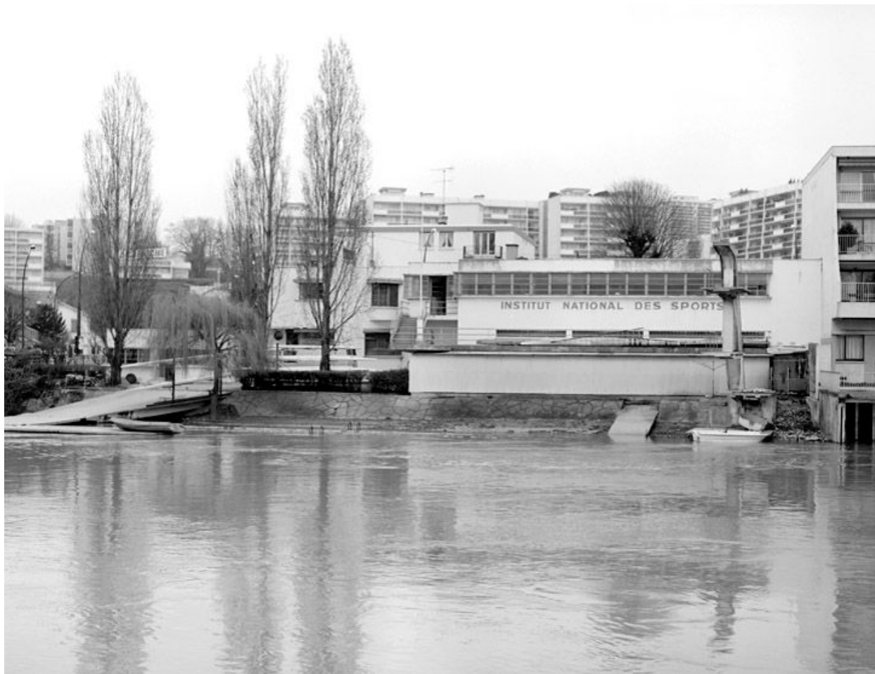
Vue générale de la façade sur la Marne.