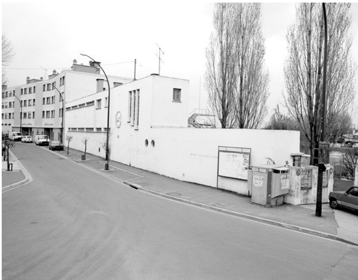
Façade sur le boulevard de la Marne.