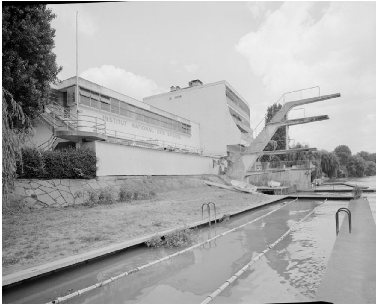
Façade sur la Marne: plongeur et bassin de natation.