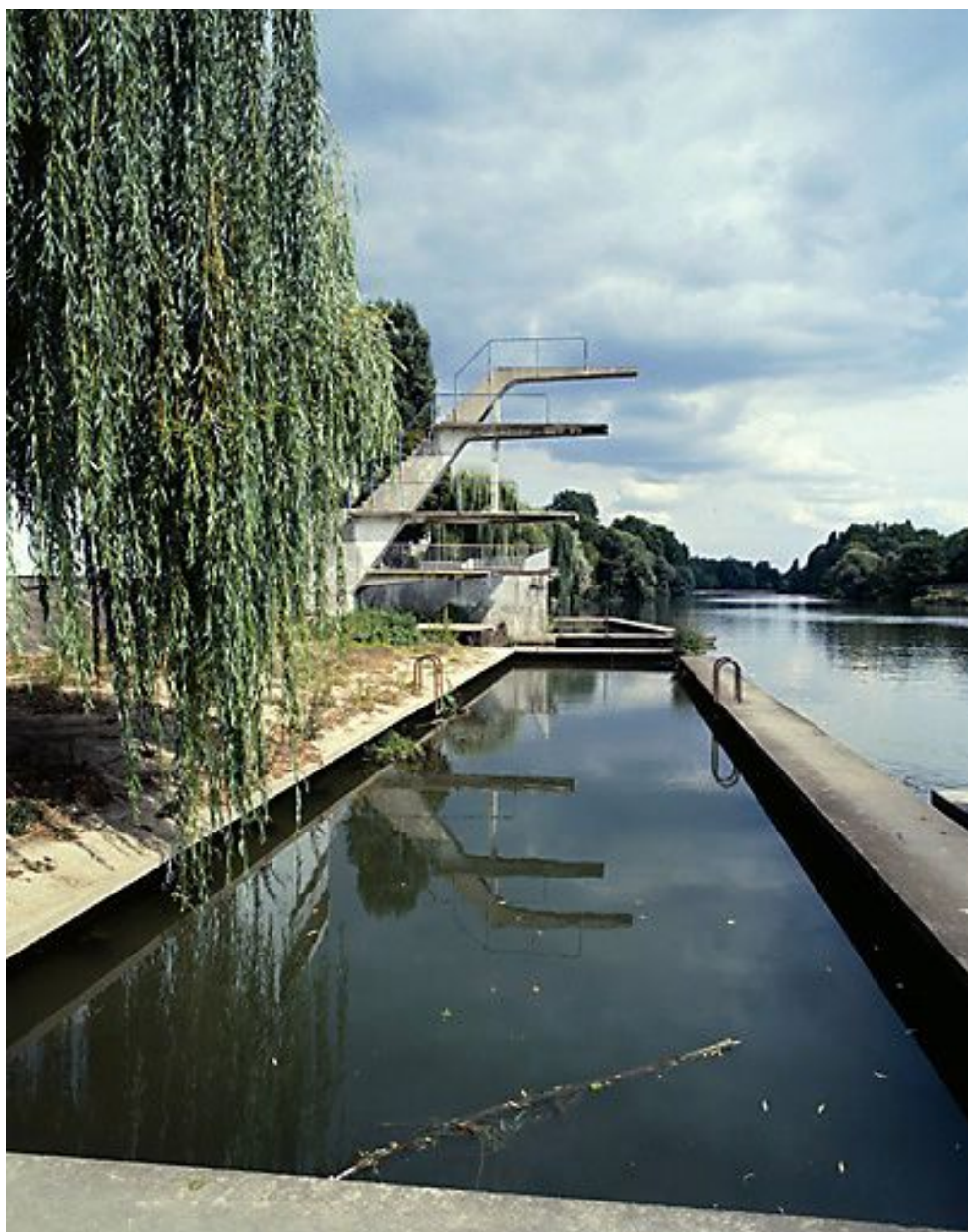
Façade sur la Marne : vue générale du bassin et du plongeur.