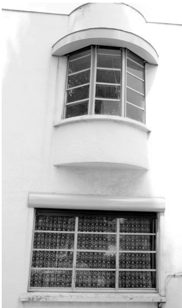
Détail de la façade sur cour.