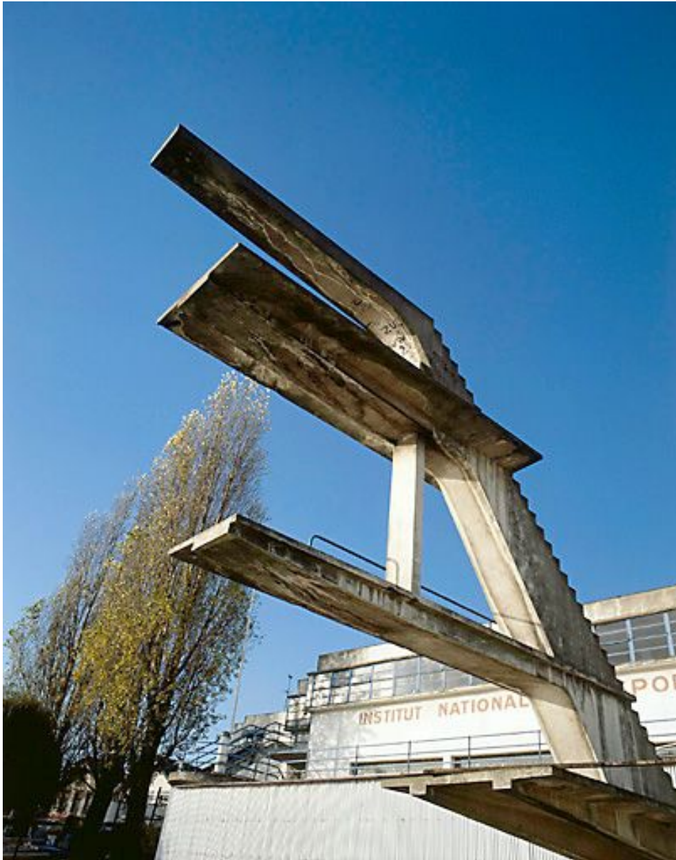
Le plongeur en rivière.