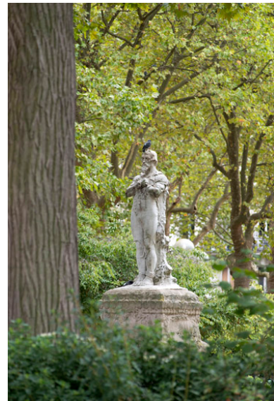
Vue de trois quart droit de la statue. IVR11_20157500283NUC4A