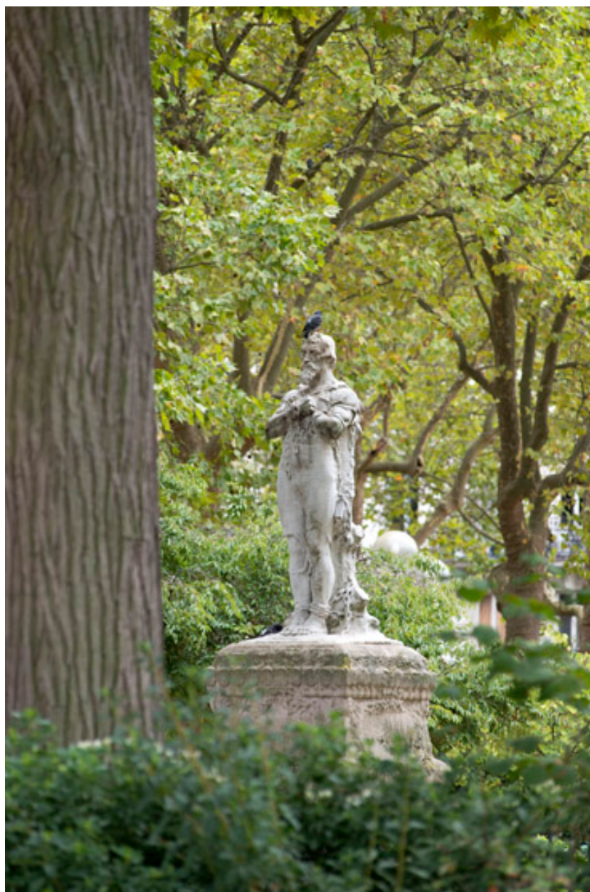
Vue de trois quart droit de la statue.