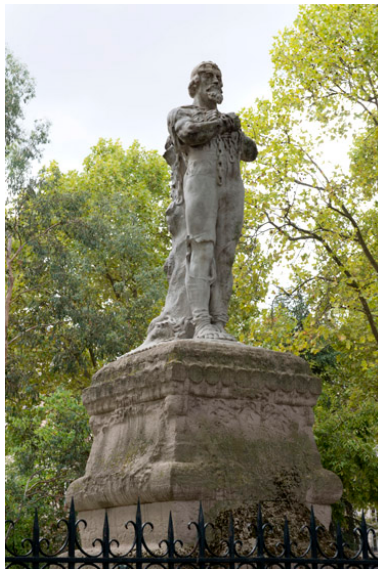
Vue de trois quart de la statue. IVR11_20157500282NUC4A