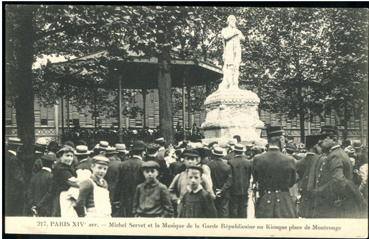
217, PARIS XIV e arr. — Michel Servet et la Musique de la Garde Républicaine au Kiosque place de Montrouge

La statue de Michel Servet et la Musique de la Garde Républicaine au Kiosque place de Montrouge.-Carte postale, vers 1900.