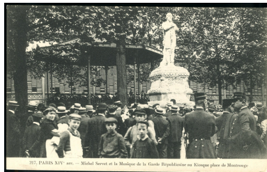
La statue de Michel Servet et la Musique de la Garde Républicaine au Kiosque place de Montrouge.-Carte postale, vers 1900. IVR11_20157500542NUC4A