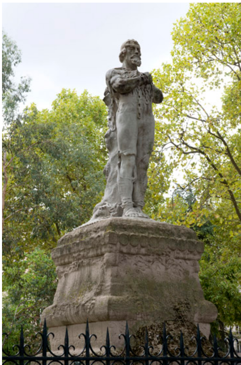
Vue de trois quart de la statue.