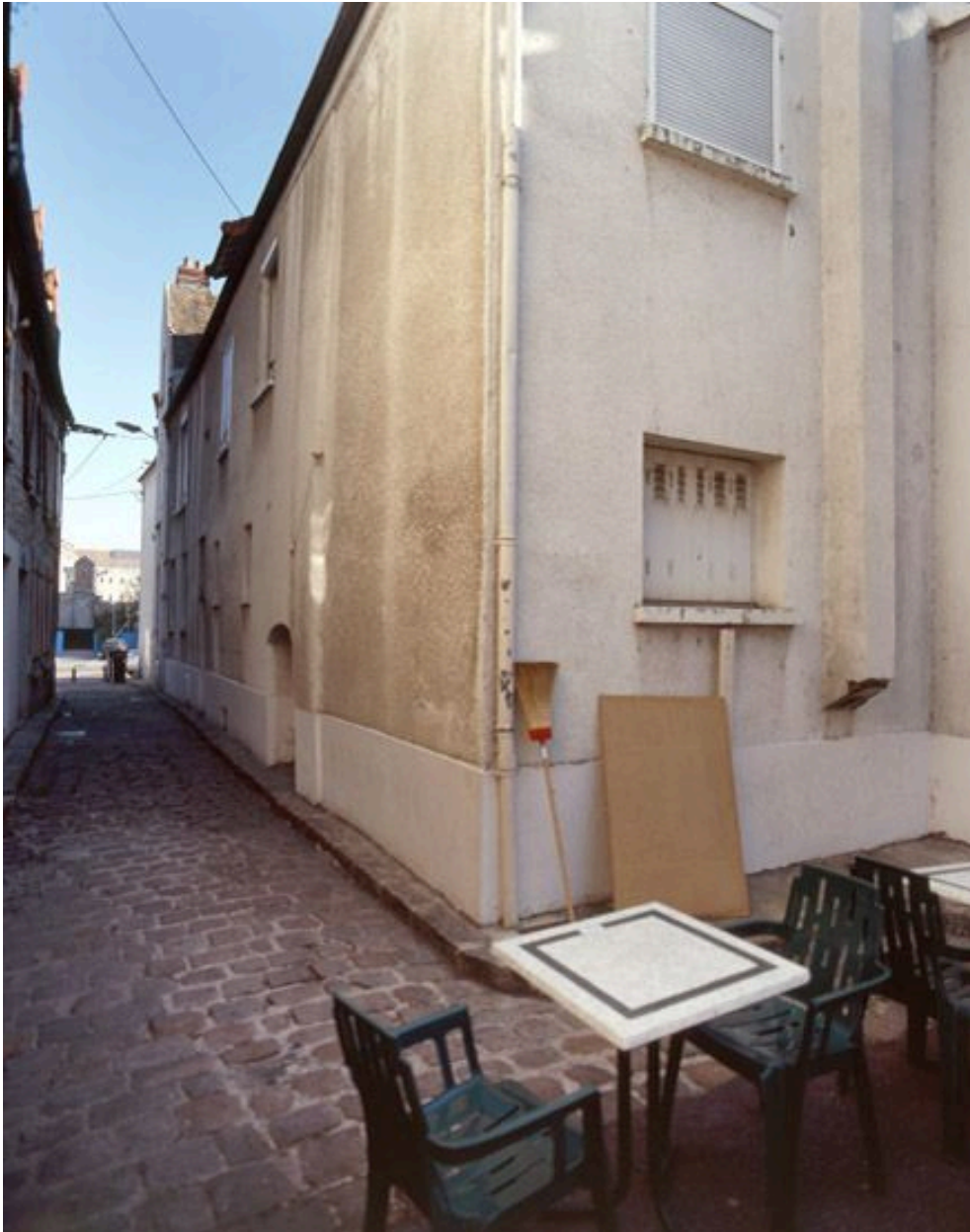
La façade de la maison, sur la rue du Four.