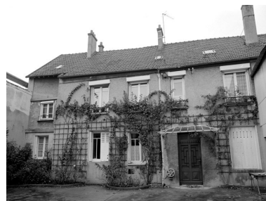
Elévation sur cour. IVR11_20047700031X