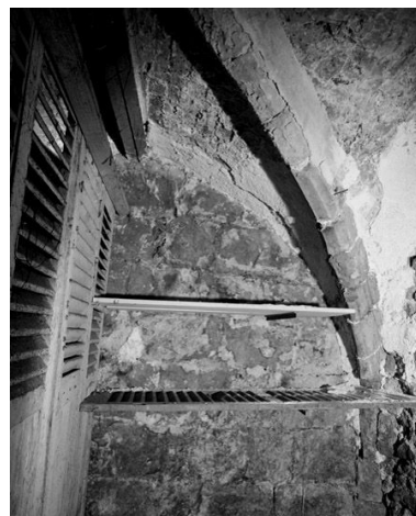
La cave médiévale : vue de l'angle sud-est. Le mur en gros appareil se trouve à l'est.