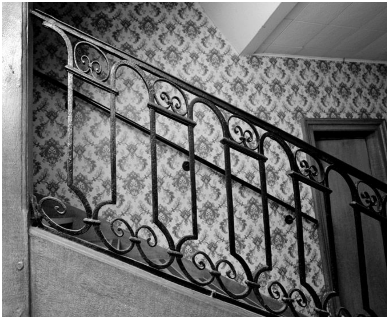
Vue de l'escalier, avec rampe en ferronnerie du 18e siècle.