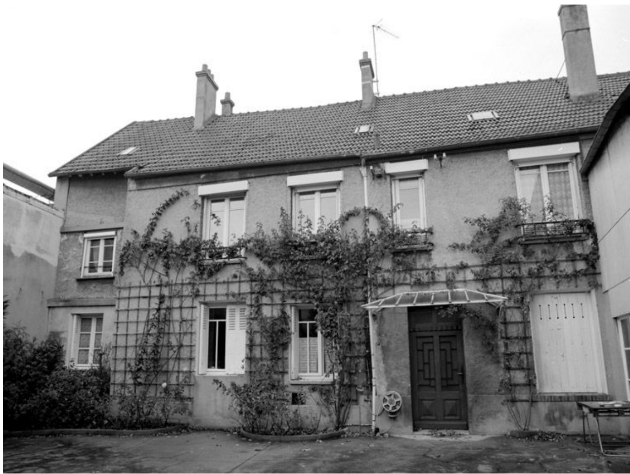
Elévation sur cour.