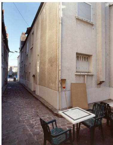
La façade de la maison, sur la rue du Four. IVR11_20057700483XA