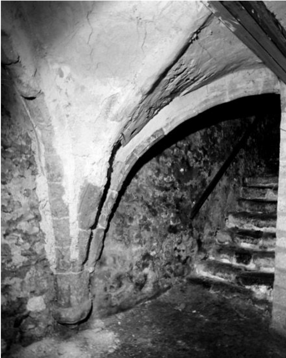
La cave médiévale : vue de l'escalier d'accès et de la retombée des ogives dans le mur ouest.