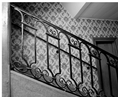
Vue de l'escalier, avec rampe en ferronnerie du 18e siècle. IVR11_20047700030X