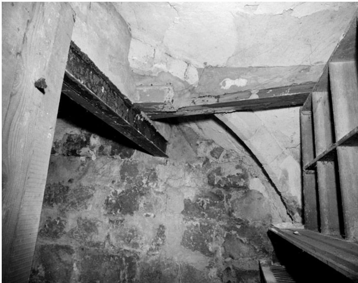
La cave médiévale : vue de la travée nord-est. Le mur en gros appareil se trouve à l'est.