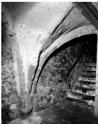
La cave médiévale : vue de l'escalier d'accès et de la retombée des ogives dans le mur ouest. IVR11_20047700027X