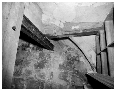
La cave médiévale : vue de la travée nord-est. Le mur en gros appareil se trouve à l'est.