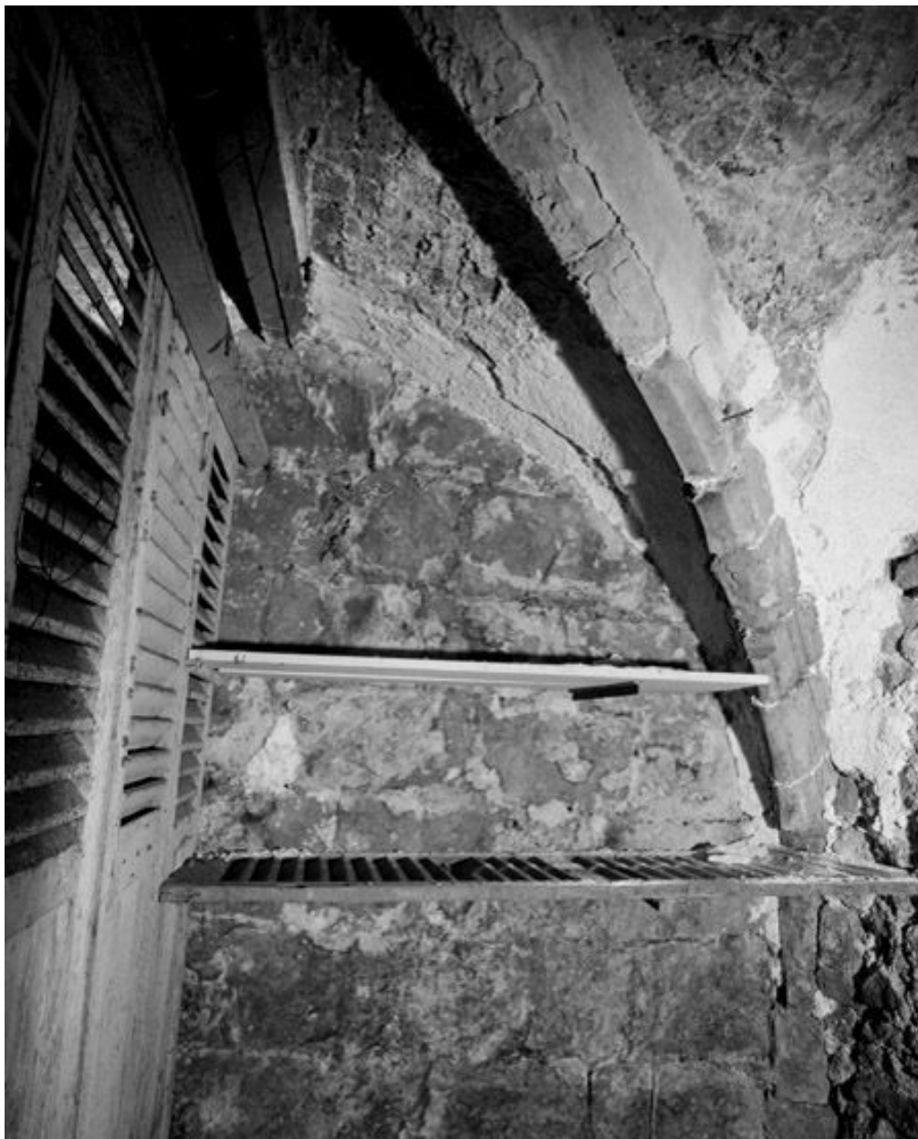
La cave médiévale : vue de l'angle sud-est. Le mur en gros appareil se trouve à l'est.