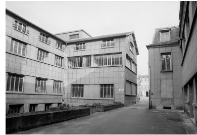
Vue des ateliers sur cour. Photographie. IVR11_20029300124NUC