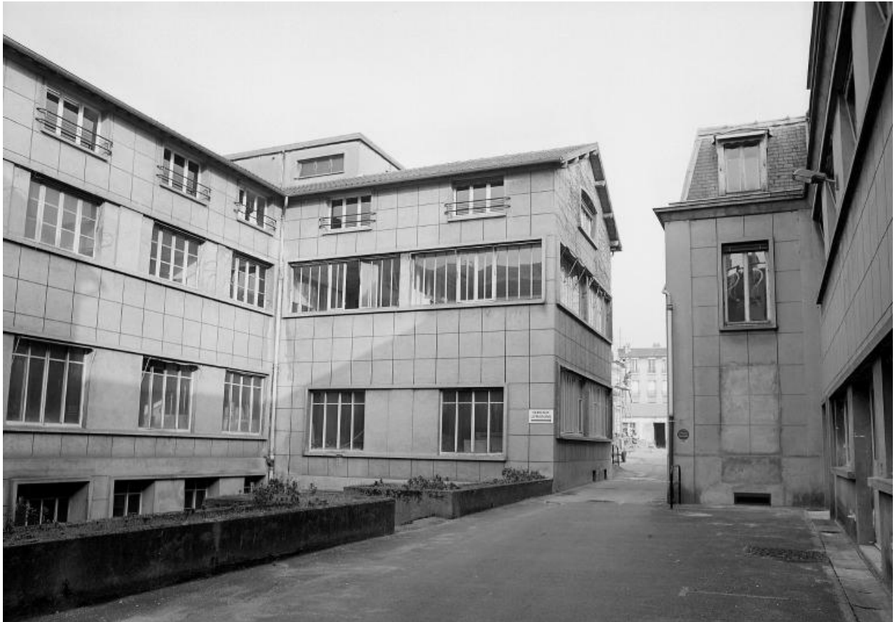
Vue des ateliers sur cour. Photographie.