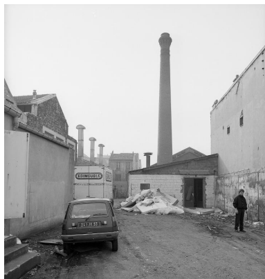
Vue de la cheminée. Photographie.