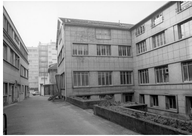
Vue des ateliers. Photographie. (AD Seine-Saint-Denis. A NB 118) IVR11_20029300122NUC