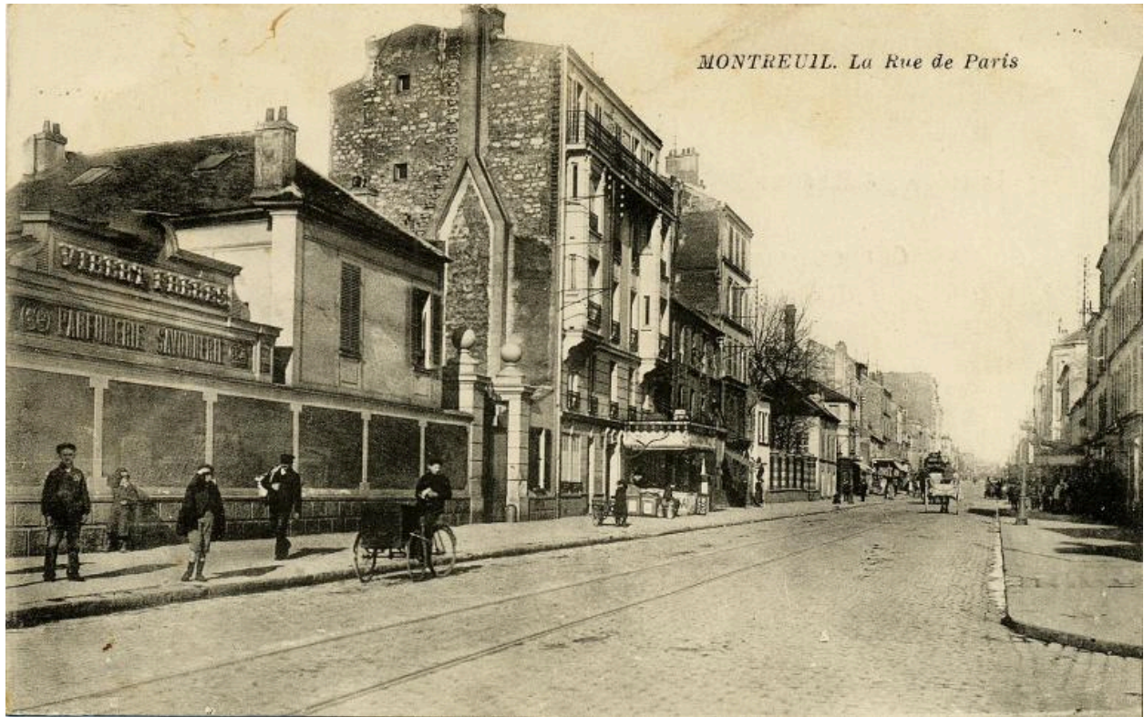
Vue des bâtiments sur la rue de Paris, vers 1905. Carte postale. (Musée de l'histoire vivante, Montreuil. 2 F 4)