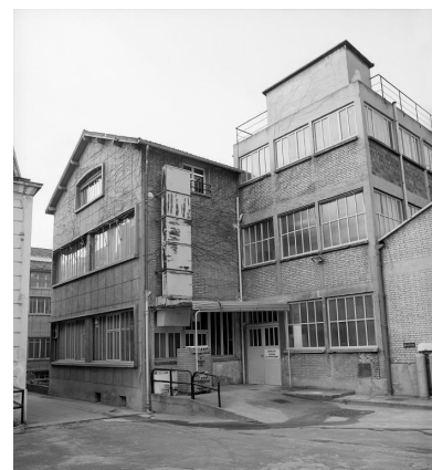
Vue des ateliers et bureaux. Photographie. IVR11_20029300121NUCA