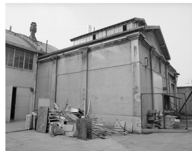
Vue d'un atelier. Photographie.