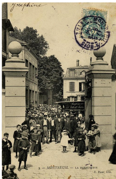
Vue de l'entrée sur la rue de Paris, vers 1905. Carte postale. (Musée de l'histoire vivante, Montreuil. 2 F 4)