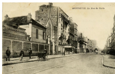
Vue des bâtiments sur la rue de Paris, vers 1905. Carte postale. (Musée de l'histoire vivante, Montreuil. 2 F 4) IVR11_20029300061NUCA