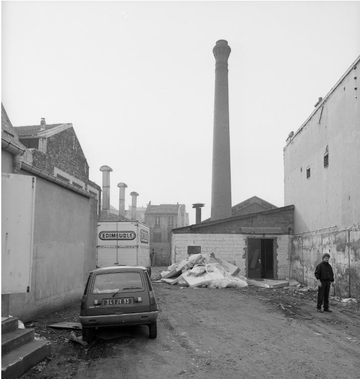
Vue de la cheminée. Photographie.