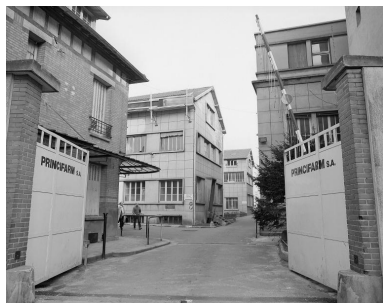
Vue de l'entrée du site. Photographie. (AD Seine-Saint-Denis. A NB 118) IVR11_20029300125NUC