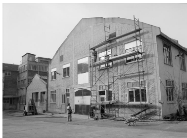
Vue d'un atelier. Photographie. (AD Seine-Saint-Denis. A NB 118)