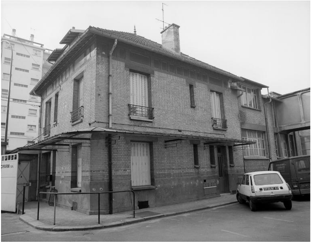
Vue du pavillon de l'entrée. Photographie.