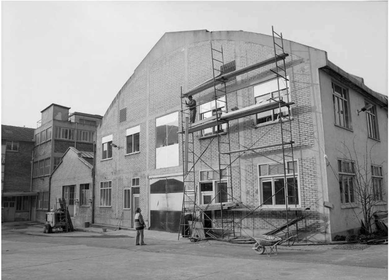
Vue d'un atelier. Photographie. (AD Seine-Saint-Denis. A NB 118)