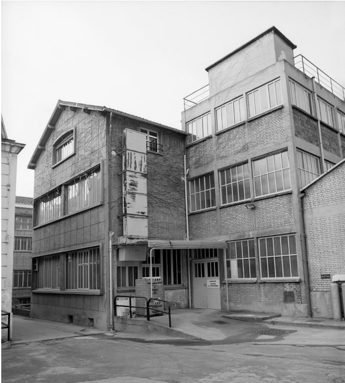
Vue des ateliers et bureaux. Photographie.