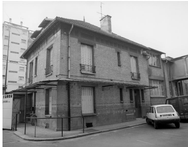
Vue du pavillon de l'entrée. Photographie. IVR11_20029300123NUC