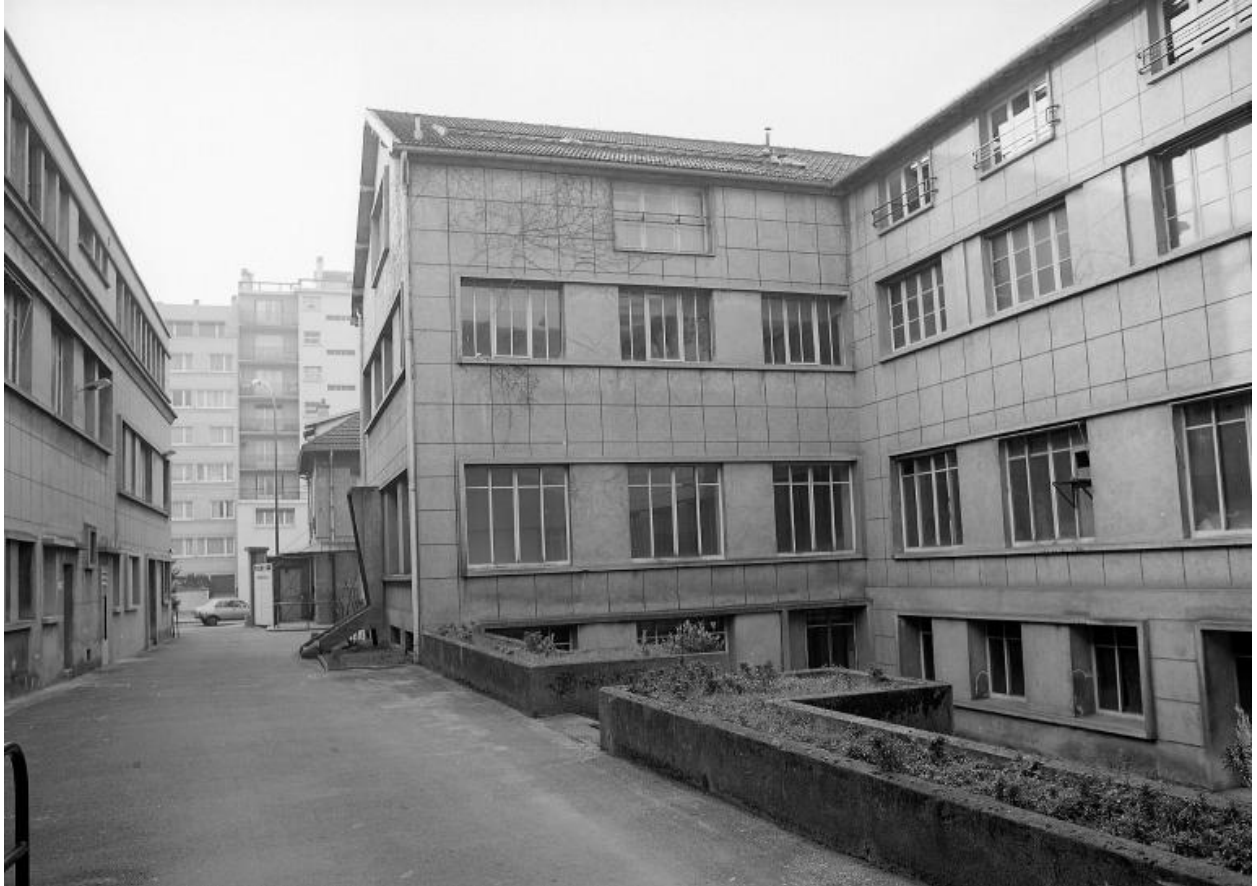
Vue des ateliers. Photographie.