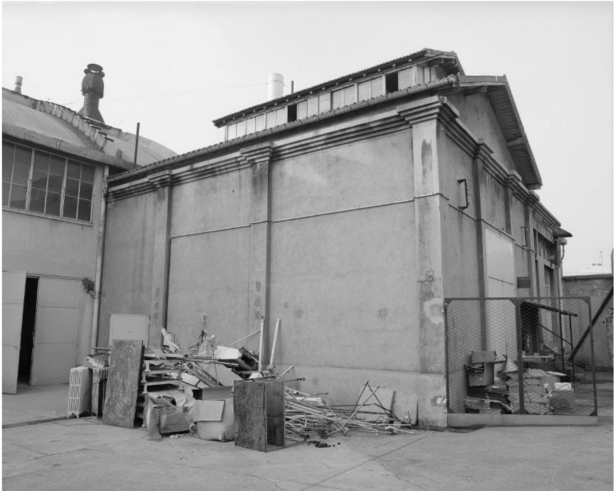
Vue d'un atelier. Photographie. (AD Seine-Saint-Denis. A NB 118)