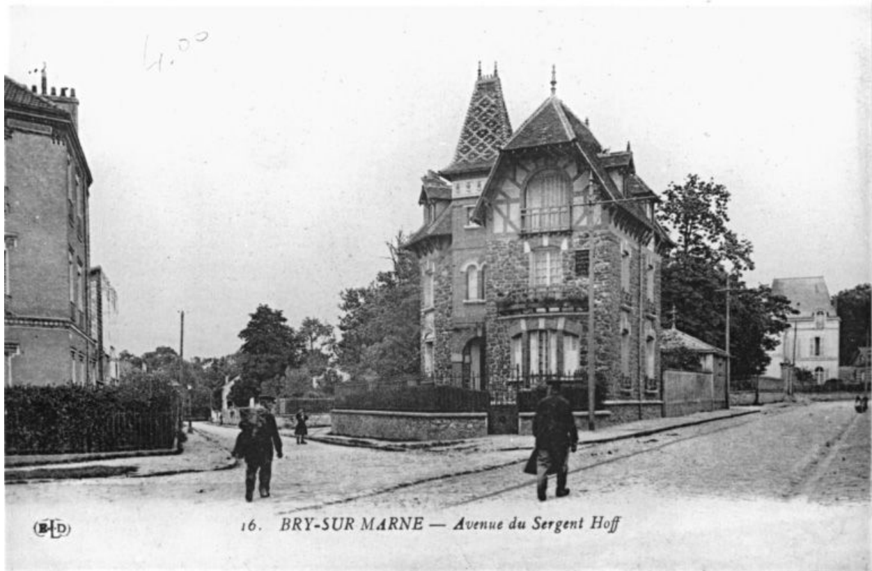
Vue générale. Carte postale. (AD Val-de-Marne)