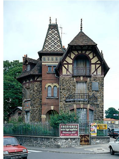
Façade antérieure. IVR11_19859401017VA