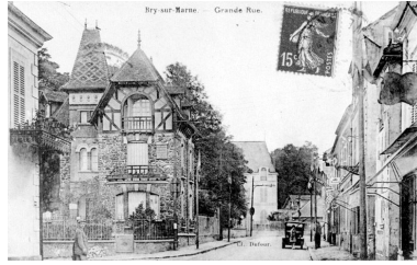
Vue d'ensemble. Carte postale. (Collection particulière)