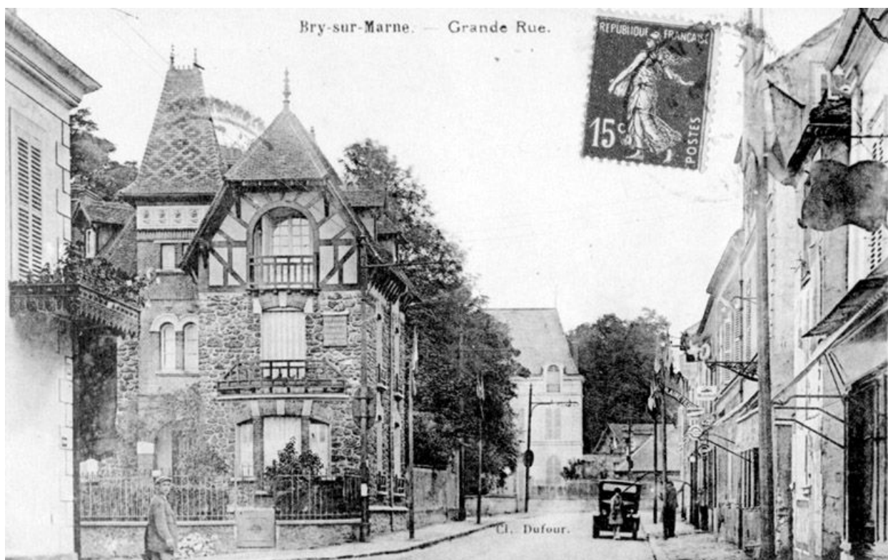
Vue d'ensemble. Carte postale.